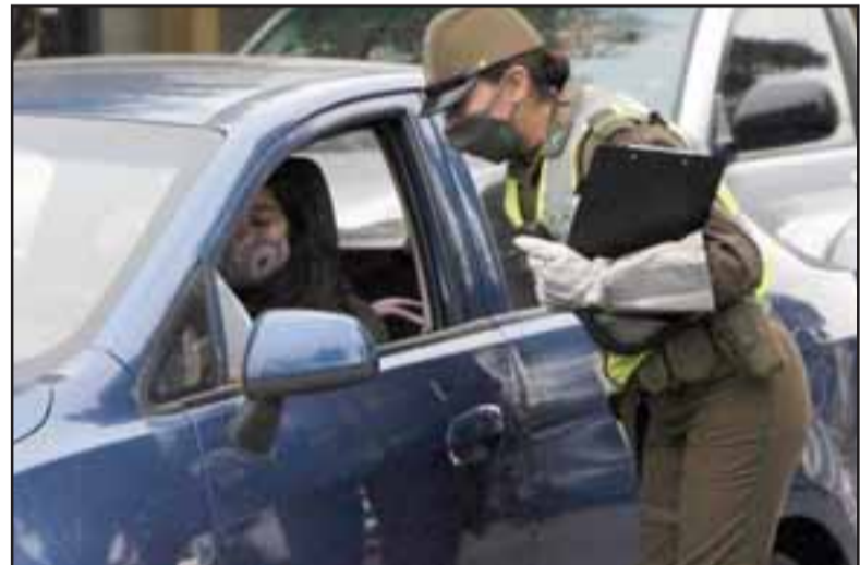
Desde este miércoles se ha aumentado el control especialmente en el centro de San Felipe, tanto para vehículos pero también y por sobre todo a peatones.

demos frenar el número de muertes y contagios que se han ido desarrollando en nuestra comuna. Tenemos la esperanza de que esta situación sea prontamente revertida», agregó González.