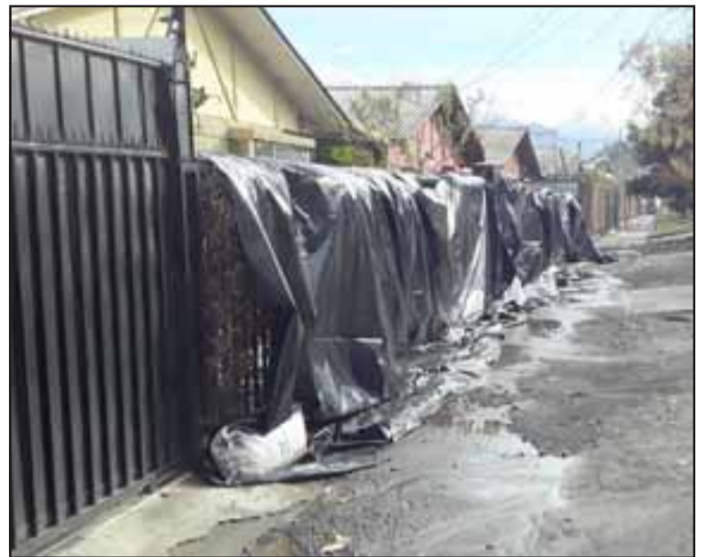
Así amaneció una de las casas afectadas luego de la lluvia.

no entiendo el tema del porqué tiran el agua hacia Encón y toda la pendiente de Encón agarra hacia abajo y se tira hacia nuestras casas, y a las otras casas no les pasa absolutamente nada, no tengo explicación. No sé qué hacer, el tipo de la casa igual es un buen tipo y se mantiene arreglando la casa, pero ¿qué hago con él?, ¿qué le digo a él? ¿Quién es el culpable de todo esto?, todavía no encuentro razón, este es un tema que vengo reclamando hace unos 15 años, no tengo explicación, yo sé que esta gente que ha pasado esto conmigo es cruel, es muy difícil, es un tema muy doloroso, como digo hasta lloré porque somos seres humanos. En la vida nosotros, imagínense yo trabajo en escuela de fútbol, ayudo niños, trabajo con ellos, en ese sentido siempre estoy con la gente del sector en la humildad con ellos, uno los quiere, los cuida, trata de ser como un padre, pero de repente explotas porque el agua entraba a la casa, eran cuatro vecinos desesperados, la familia con guagua. Yo sé que en otros lados hubo inundaciones, pero yo creo que la mía fue la más crítica porque imagínate el living, con los perros encerrados en una pieza, mojados, y después las camas, una cosa inexistente. Bueno la vida es así, quería contar mi historia para que nos preparemos un poco