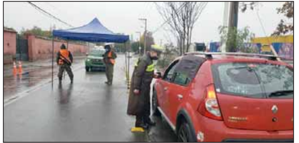
Por al menos una semana más se extenderá la cuarentena en las comunas de San Felipe y Los Andes.

cieron este llamado, pues de la conducta de todos los habitantes de esta comuna dependerá que la cuarentena sea finalmente levantada por la autoridad de Salud. «Sabemos que esta medida afecta de manera