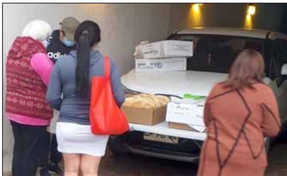
Todos los sábados llegan los vecinos a retirar los diez panes por familia que este vecino entrega en El Canelo