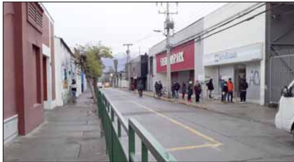
Así estaba la calle Santo Domingo ayer en la mañana, arteria por donde deben pasar los buses a Llay Llay, Catemu, Putaendo, etc.

- A ver, detengámonos ahí para graficarle a nuestros lectores, vaya siguiéndome para que nuestro lector nos