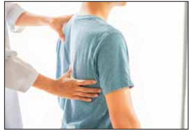
Los kinesiólogos tienen un papel clave en la recuperación de la función pulmonar y disminución de tiempos de hospitalización en pacientes con coronavirus.

Cabe destacar que el kinesiólogo es el profesional experto en la mantención, mejora y rehabilitación del sistema respiratorio de una persona y, dada las consecuencias evidencia-