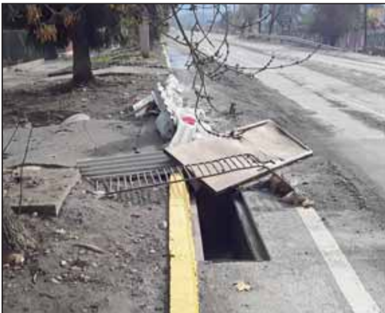
Este sería el lugar donde se acumula el agua.

más con la ayuda de la muni, no sé si de Esva o Serviu, porque es muy cruel... muy cruel el tema que pasó ahí», dijo Héctor Rocco, propietario de una de las viviendas, quizás la más afectada.