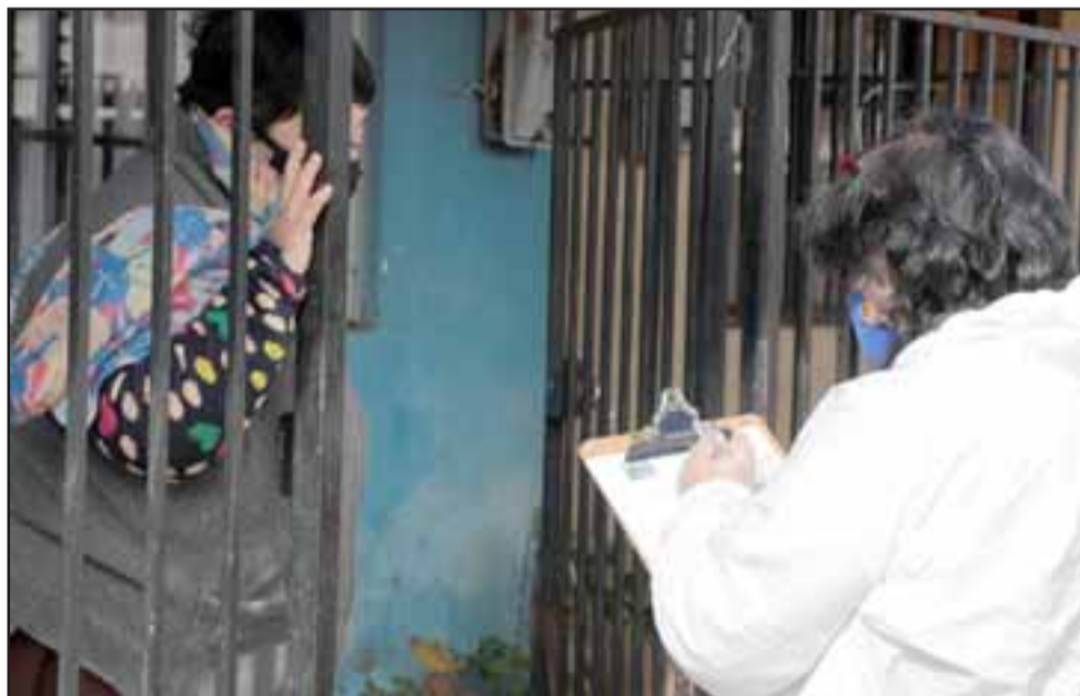
La pérdida de empleo o la imposibilidad de ir a trabajar producto de la pandemia, convierten en indispensable la ayuda que se entrega a través del gobierno regional y el municipio.

nuestra villa hay muchos adultos mayores. Muchos de ellos perdieron el empleo o no están yendo a sus trabajos; entre todos estamos saliendo adelante y esto es una gran ayuda (las canastas familiares) para nuestros vecinos», finalizó la dirigente.