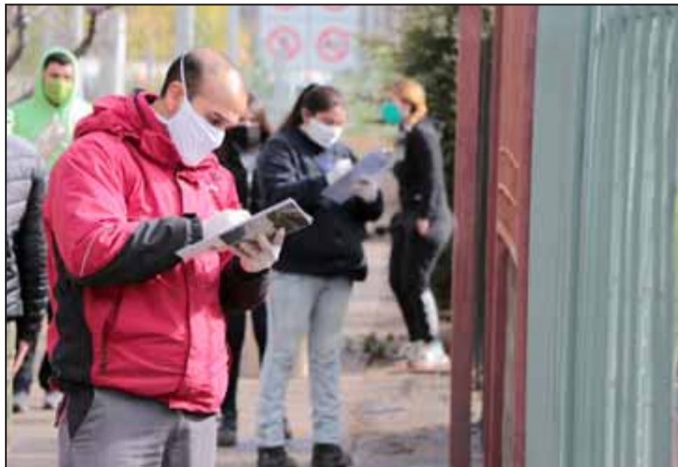
Los equipos municipales han entregado más de 14 mil cajas de alimentos a los vecinos de la comuna.

Finalmente, el jefe comunal insistió que estamos viviendo una realidad compleja, sin embargo apeló a la comprensión de los vecinos, debido a que «las entregas a veces sufren ciertas re-