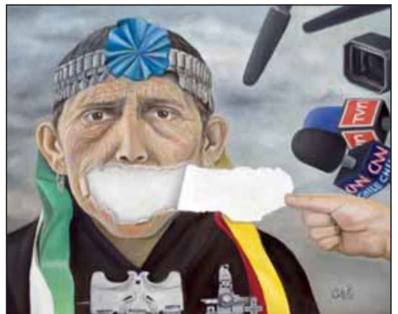
La obra ‘Witrafun Pellü’ (‘Rasgar el Alma’) refiere a cómo vive en la actualidad la cultura mapuche y cómo aún mantiene latente ese dolor histórico.