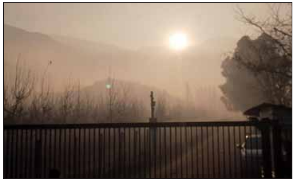
Funcionarios de Conaf, Carabineros y el municipio local, detuvieron la faena ilícita que emanó una gran cantidad de humo en la zona.

Por su parte el director regional de Conaf, Sandro Bruzzone, explicó que « para realizar una quema de desechos agrícolas y forestales, la persona interesada, primero, tiene que informar su intención a la Corporación e inscribir su predio. Luego, si reúne los requisitos solicitados, recibirá un comprobante de aviso de quema que estipula días, horas y medidas que debe implementar antes y durante la faena. Si no cuenta con este documento