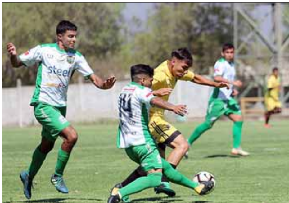
Se confirmó que Trasandino y ningún equipo de la Tercera División competirá este año en la Copa Chile.