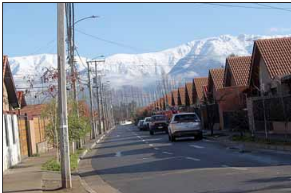
BLANCA CORDILLERA.- Así lucen las montañas alrededor del Valle de Aconcagua.