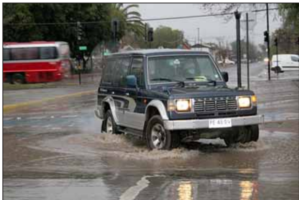
INVIERNO INSTALADO.- Las calles de San Felipe recibieron miles de litros de agua este fin de semana.