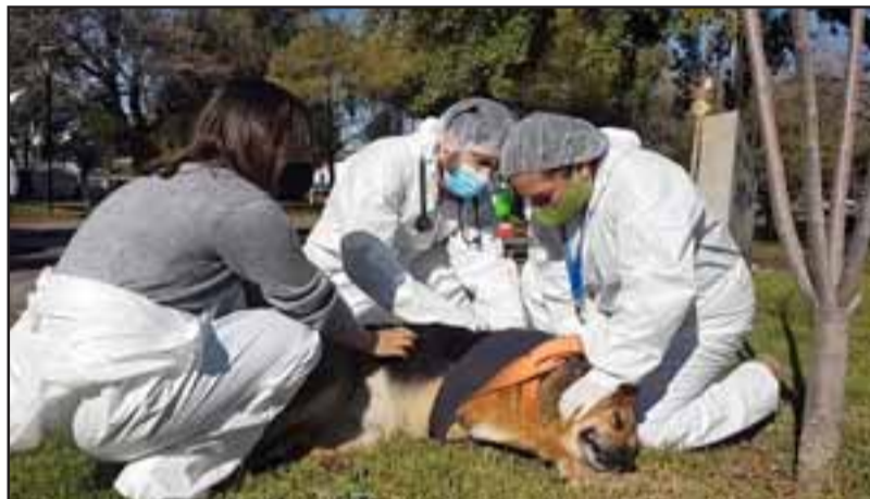
Ellos salieron a realizar un monitoreo médico a los perritos para saber su estado de salud ante la lluvia y el frío.

yo que realizan los animalistas, que saben exactamente cuáles son los puntos exacto donde se encuentran los perritos en la comuna. Pudimos ponerles chalecos impermeables, entre otros servicios», manifestó la profesional.