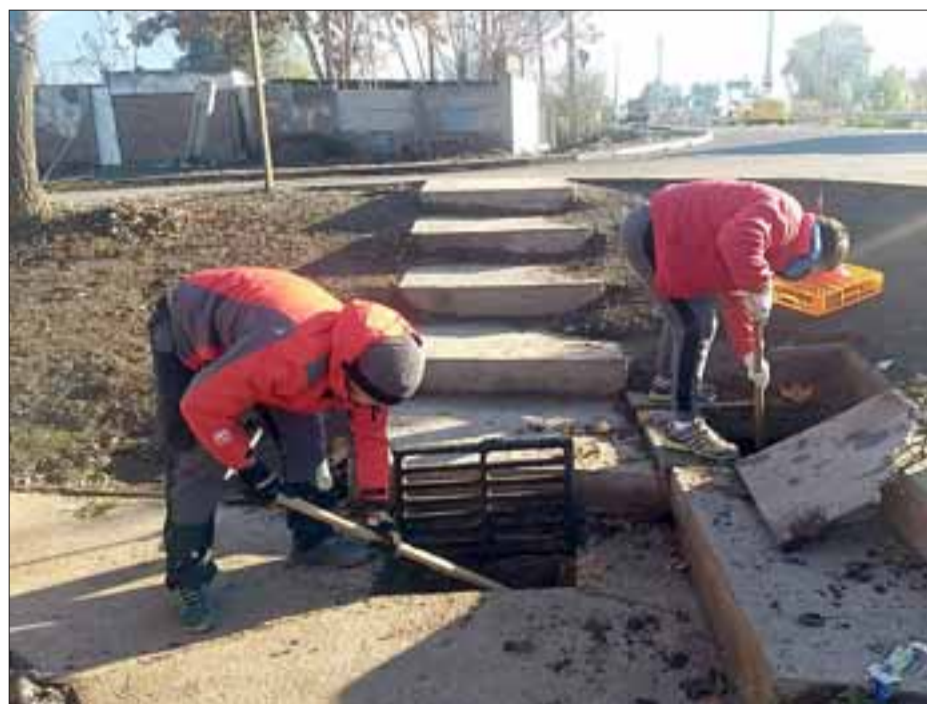
Se busca pronto poder ejecutar el proyecto definitivo de evacuación de aguas lluvias en ese punto de la comuna.