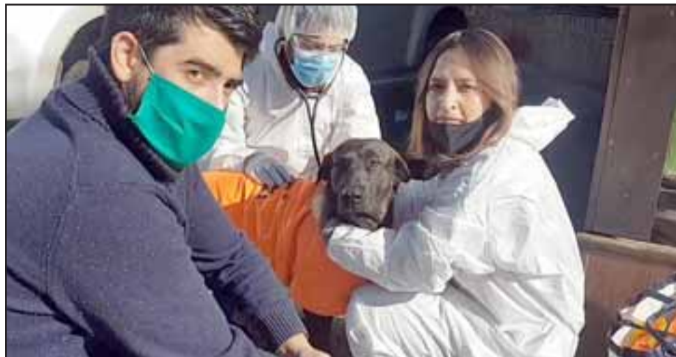
Personal veterinario atendió a los animales en plena calle, algunos canes fueron desparasitados y otros chipeados.

nadora del centro veterinario, sostuvo que «hemos salido para realizar un monitoreo médico a los perritos, para saber su estado de salud ante las lluvias y el frío. Hoy, gracias al gran apo-