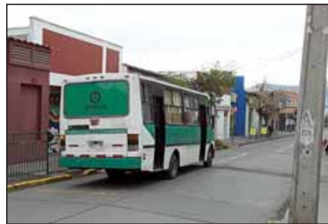
Hoy vuelven a sus recorridos los microbuses rurales al darse por terminado el conflicto.

Terminamos intensas jornadas con las autoridades