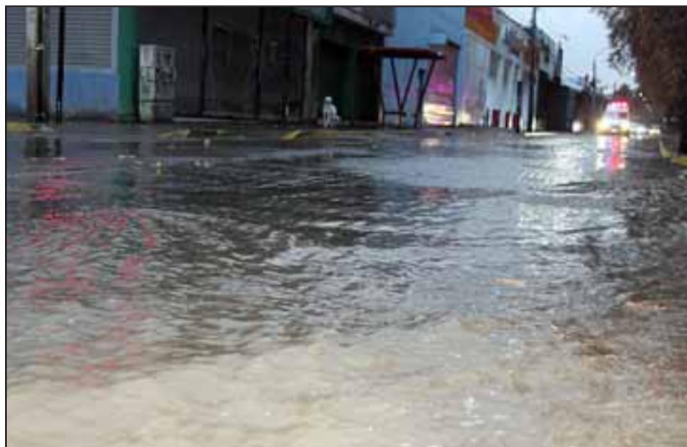
AVENIDA INUNDADA.- Hacia lucía Avenida Chacabuco frente a botillería Nueva Pacífico la tarde noche de este sábado.