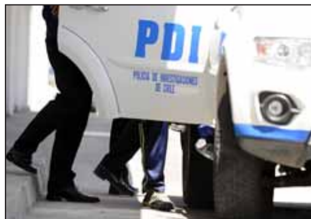
El imputado fue detenido por la PDI. (Referencial).

(sábado) se realizaron fiscalizaciones en el sector céntrico de esta ciudad, fiscalizando a dos personas a quienes se les solicitó exhibir su permiso temporal, los cuales al mostrarlos se veía claramente que estos tenían características de adulterado por lo cual se corroboró con el código QR de los documentos, obteniendo que dichos documentos habían sido tramitados con fecha 30 de junio del año 2020 por lo cual se procedió a la detención de las dos personas por el artículo 318 del Código Penal y por Falsificación y Uso malicioso de documentos públicos, continuando con las diligencias los funcionarios policiales lograron la individualización de una tercera persona, quien habría realizado la adulteración de los documentos desde un teléfono celular, por lo cual se procedió a la detención de esta persona, de estos antecedentes se dio cuenta al Ministerio Públi-