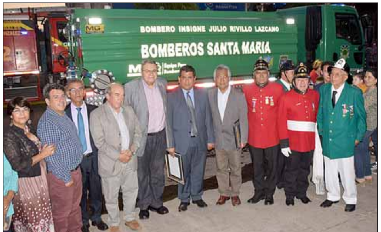
SU NOMBRE EN LA HISTORIA.- Este imponente camión aljibe de la 2ª CÍA de Bomberos de Santa María lleva su nombre.