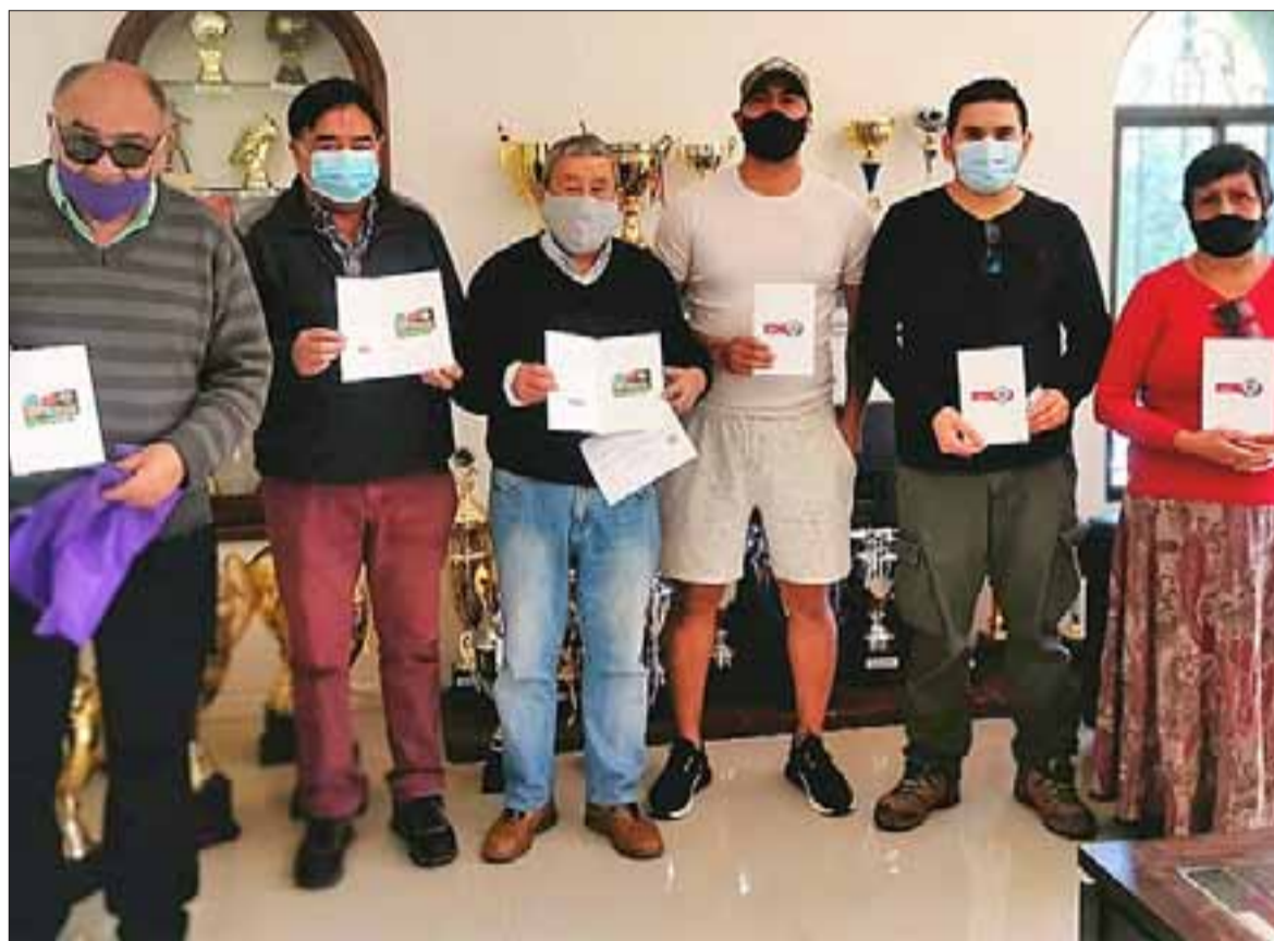
La totalidad de los clubes de la Quinta Región recibieron Gift Card de parte de la ANFA.

Durante la conversación con Diario El Trabajo , el directivo reconoció que tanto las asociaciones y los clubes del valle de Acon-