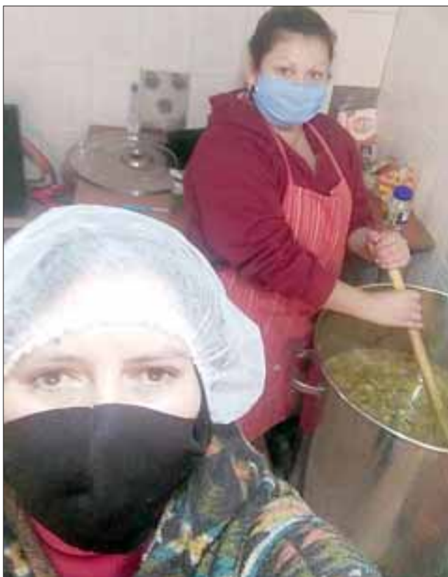
INCANSABLES. - Aquí las vemos en plena acción, quienes quieren apoyarlas con mercadería, pueden llamarlas al celular +56 9 3175 1554.