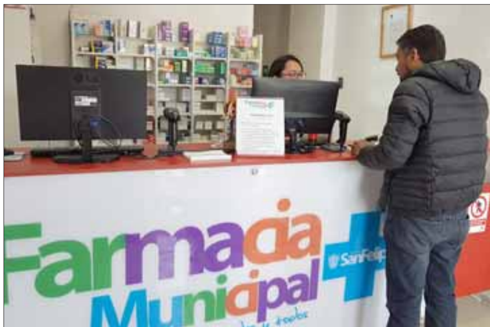
A partir del próximo 3 de agosto se iniciaría el traslado de la farmacia municipal, estimándose que el proceso dure unos 14 días.

En la misma línea, informó que el equipo profesional de la Farmacia se encuentra llamando a los usuarios para informar que la venta de fármacos se está haciendo por adelantado para los meses de julio y agosto, a fin de apoyar a los usuarios.