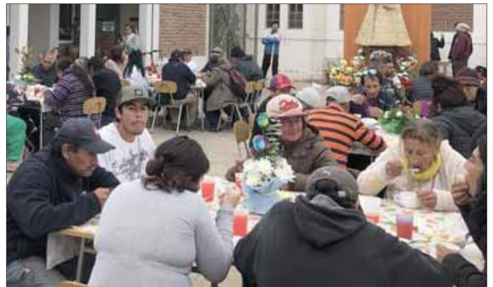
AÑOS DE SERVICIO SOCIAL. - Antes que llegara la pandemia, ya este Comedor Solidario estaba haciendo su labor social en la vida de quienes menos tienen.

- ¿Palabras de agradecimiento en este momento de reconocimiento?