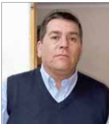
El presidente de ARFA Quinta recalzó que están muy atentos a la situación de cada asociación y clubes del valle de Aconcagua.

que por ahora es imposible pensar en un retorno. Hoy más que nunca se necesita la unión de toda la gente que forma parte del fútbol amateur», concluyó el timonel de la ARFA Quinta Región.