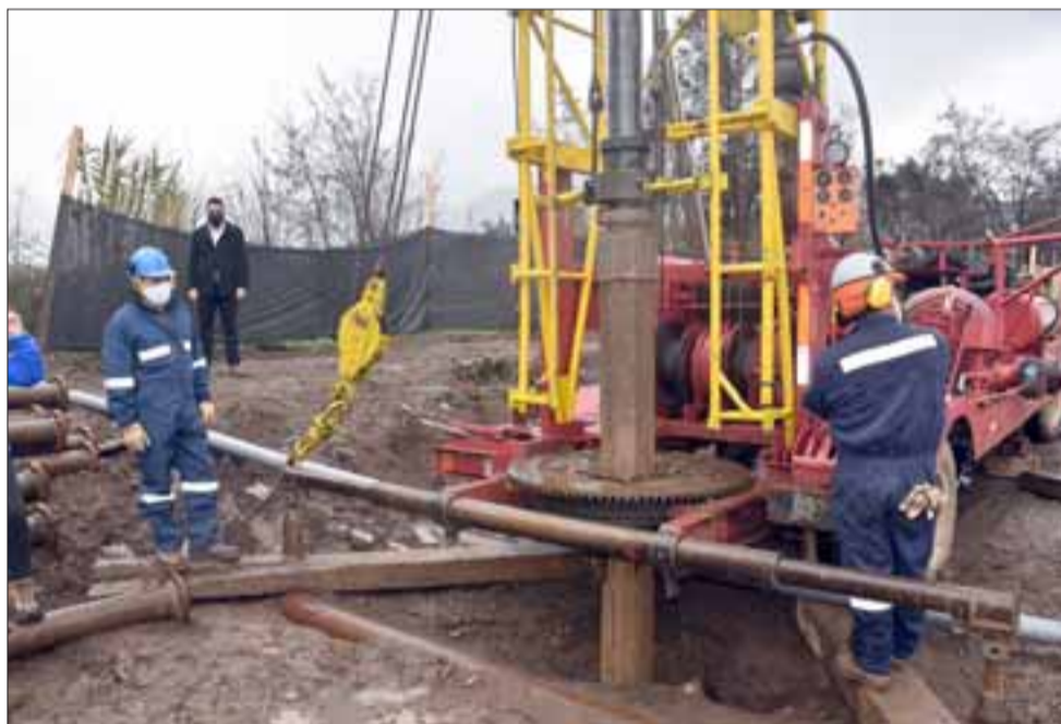
Este martes se hizo la entrega de los terrenos donde se emplazarán dos de los pozos que inyectarán agua a los canales Comunero y Valdesano en el caso que se declare Emergencia Agrícola en la comuna.

En la ocasión estuvieron presente los representantes de los beneficiarios de estas iniciativas, que ayudan a la agricultura familiar campesina: «Estamos muy felices, es una obra que esperábamos por mucho tiempo, en estos años que ha habido