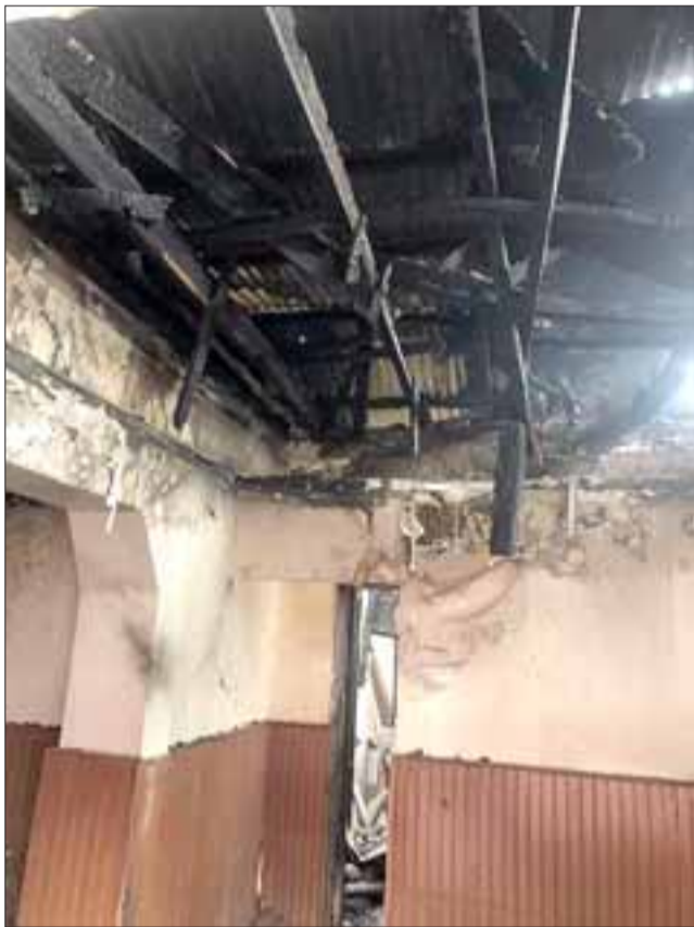
Daños en el techo se puede apreciar. En algunos momentos es fuego se desarrolló en gran manera.