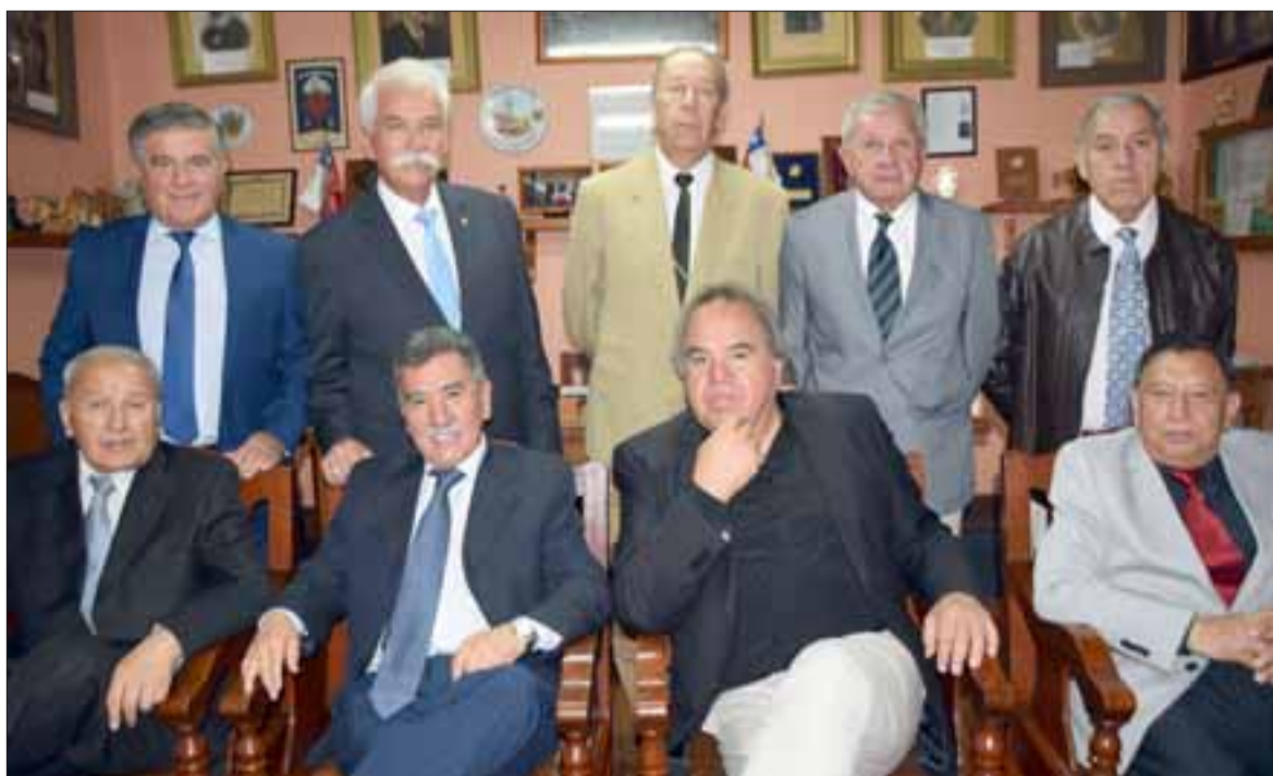
SUS AMIGOS.- Ellos son el actual Directorio de la Sociedad de Artesanos La Unión, quienes a través de su presidente hicieron presente sus condolencias.