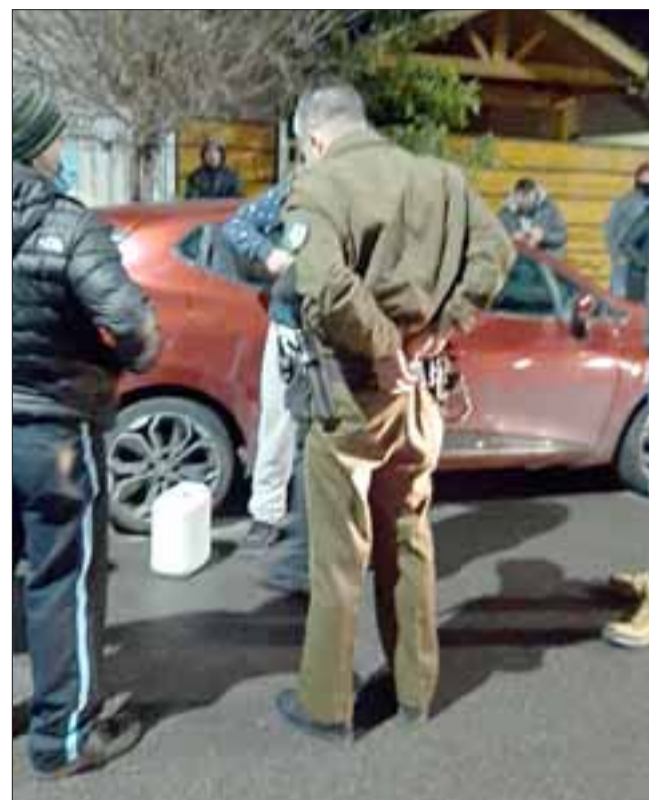
Carabineros presentes en el lugar logrando con ayuda de los vecinos recuperar las bicicletas y detener al supuesto ladrón

- El delito de Receptación sanciona a quien conociendo su origen o no pudiendo menos que conocerlo, tenga en su poder, transporte, compra, venda, transforme o comercialice especies que provengan de hurto, robo, receptación, apropiación indebida y/o hurto de animales. Asimismo, el delito de Recep-