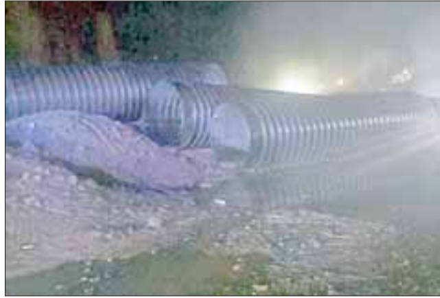
Estos son los tubos destruidos que eran para hacer el entubamiento de un canal de regadío.

LOS ANDES.- La Fiscalía local de Los Andes en base al informe de Bomberos inició una investigación