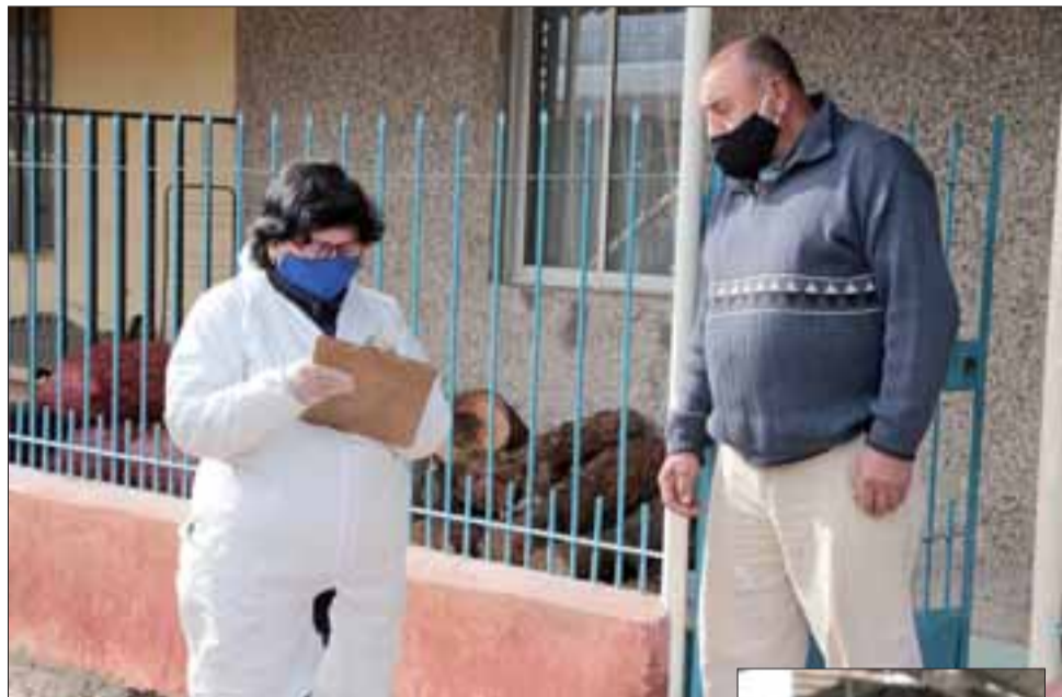
Esta ayuda de los balones de gas se gestiona a través de los programas sociales y no por inscripción en la Dideco. Este apoyo va a los adultos mayores, postrados, Jefas de Hogar, personas con discapacidad y quienes están sin empleo.

El Dideco Pablo Silva Núñez , explicó que la entrega de cargas gas se realiza con el apoyo de los programas y oficinas de esta dirección, los princi-