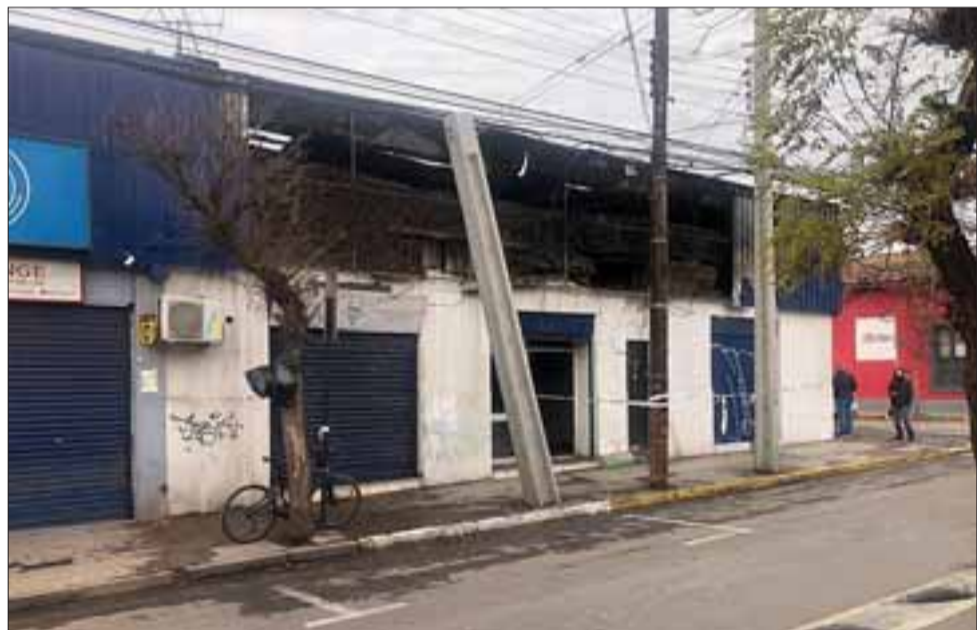
Acá se puede apreciar el daño a la estructura de los locales ubicado en calle Prat pasado Navarro.