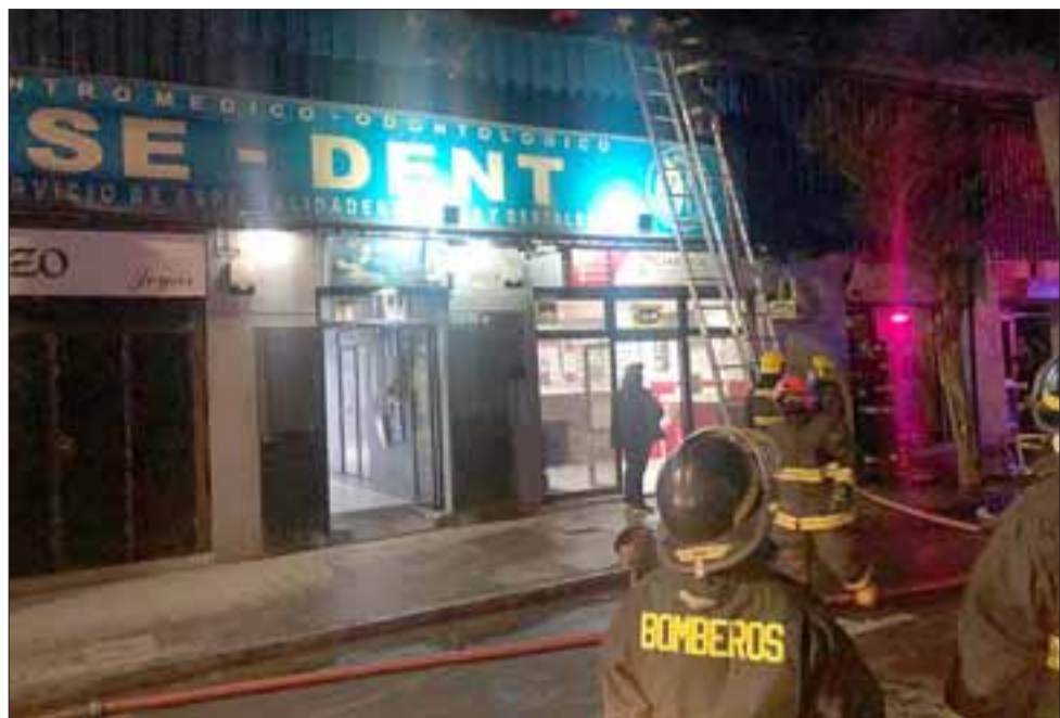
Voluntarios colocando una escalera para poder subir al techo de uno de los locales afectados por el incendio.

ropa, otra más al menos tres locales que se fueron por el fuego de la misma estructura y para el otro lado no para nada, donde está la casa de cambio de moneda porque ahí se trabajó en controlar el fuego.