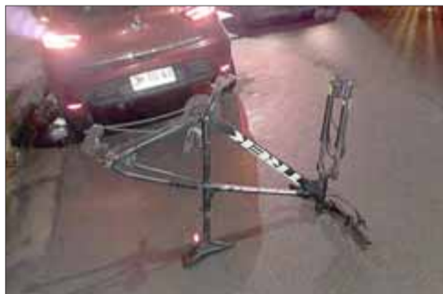
El marco de una de las bicicletas

tación sanciona las conductas negligentes de quienes adquieren o poseen dichos bienes.