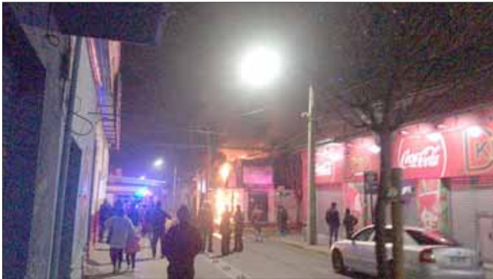
Las llamas consumiendo el local de la esquina. Finalmente Bomberos logró controlar la escena.

locales siniestrado, decimos esto porque durante el combate del incendio corrió el rumor que había una persona adentro, sin embargo después de efectuar una exhaustiva búsqueda por parte de los bomberos se desechó esa información. Al incendio concurren 90 voluntarios y 18 vehículos de emergencia.