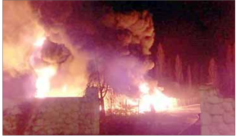
El reporte de Bomberos dio cuenta que este gigantesco incendio tuvo un origen intencional y por ello la gravedad del hecho, ya que los tubos estaban acopiados para la construcción de un proyecto de entubamiento de dicho canal.

blemas de seguridad, salubridad y de calidad de las aguas, este canal concursó a la CNR en el año 2018 y ganó una bonificación con la Ley 18450 para la construcción del entubamiento. Dada la importancia y procesos de la construcción de éste, antes de iniciarse, se informó a la Municipalidad, junta de vecinos, APR y Club Deportivo del