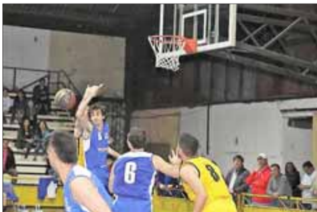
El Prat jugando un partido de la Liga Nacional de Básquetbol.