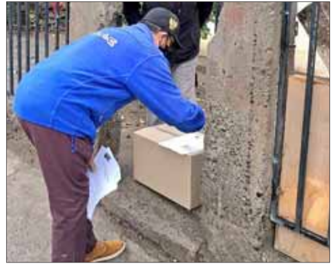
Son más de 400 millones de pesos dispuestos para la comuna y que tendrá como principal objetivo la compra de canastas familiares.

González subrayó que lo que se ha hecho, con los dineros destinados, es adquirir una caja de mercadería con menos productos pero que ayude a más familias, «es una situación que se evaluará con esta entrega, pero el propósito será el mismo que es apoyar a la mayor cantidad de personas (...) De forma paralela, se espera que la