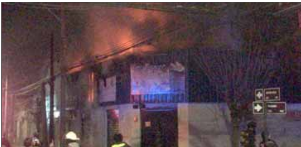
Las llamas saliendo del local de la esquina de Prat con Navarro.