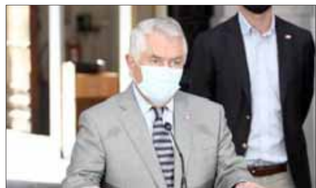
El Ministro de Salud, Enrique Paris, anunciando el paso a la transición junto a alcaldes de las comunas que pasan a este paso.