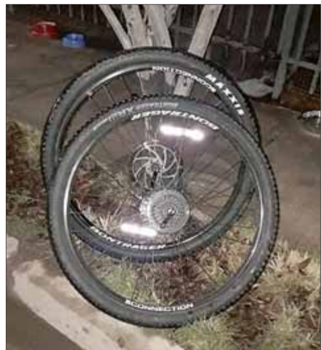
Dos ruedas de una de las bicicletas que fue recuperada.

tación sanciona las conductas negligentes de quienes adquieren o poseen dichos bienes.