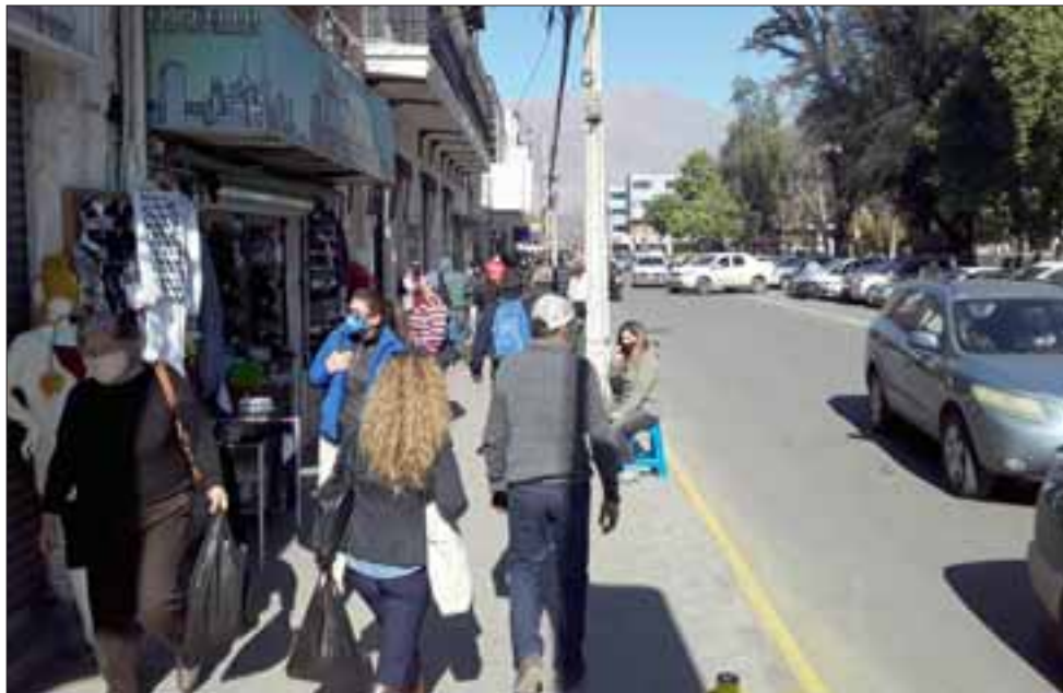
Gran cantidad de personas se pudo apreciar ayer en el centro de San Felipe tras el paso de Cuarentena a Transición.

La Cámara de Comercio de San Felipe agrupa a más de 300 comerciantes de San Felipe.