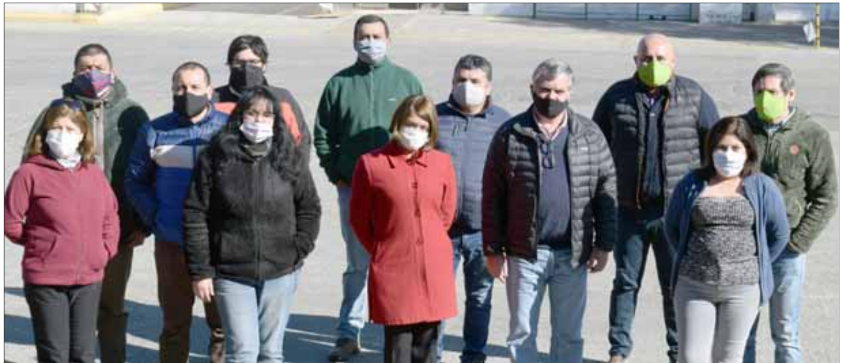
SIEMPRE EXSER.- Varios empleados administrativos de Exser San Felipe posaron este martes para las cámaras de Diario El Trabajo en su lugar de trabajo.

to la misma estará siendo premiada con la Distinción Empresa Destacada 2020 , por parte del Concejo Municipal de nuestra ciudad, en el marco del 280º Aniversario de nuestra comuna.