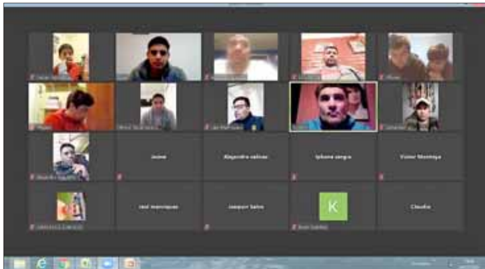
En la última cita se conversó con el ex seleccionado chileno Fernando Astengo.