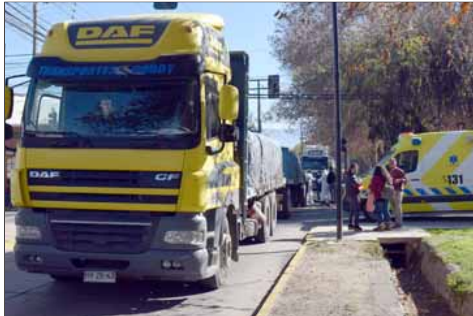
El camión detenido para que Carabineros adopte el procedimiento de rigor.