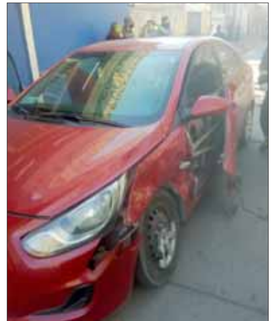
FUERTE IMPACTO. - Así quedó el vehículo particular, su puerta fue arrancada por la violencia del impacto.

Roberto González Short