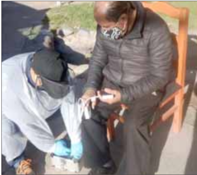
VIOLENTO AMANECER. - Uno de los conductores es atendido en el mismo lugar de los hechos.

Cerca de las 8 de la mañana de este martes, en la intersección de Avenida Chacabuco con calle Navarro, se originó una colisión vehicular en la que los protagonistas fueron el conductor de un taxi colectivo de la Línea 2 y un vehículo particular. Pese a que aún no se esclarece con exactitud las causas del choque, es evidente que uno de los involucrados no habría respetado la señal Pare existente en Navarro.