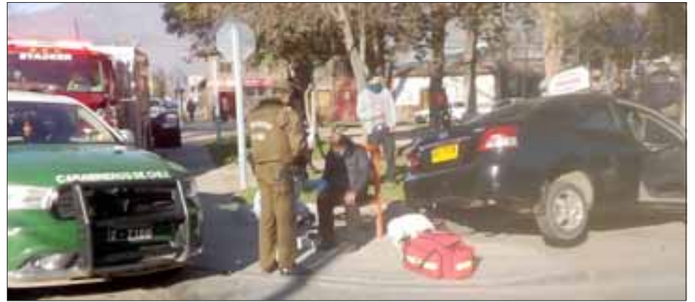
ATENDIDO EN EL LUGAR. - Carabineros y Bomberos fueron los primeros en llegar al lugar del accidente la mañana de este martes.

Tras la colisión, los profesionales del SAMU y rescatistas de Bomberos que llegaron al lugar debieron emplearse a fondo para poder extraer al conductor del