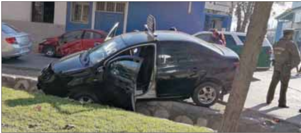
PUDO SER FATAL. - La colisión fue potente, los daños materiales también cuantiosos, afortunadamente no hubo muertes que lamentar.