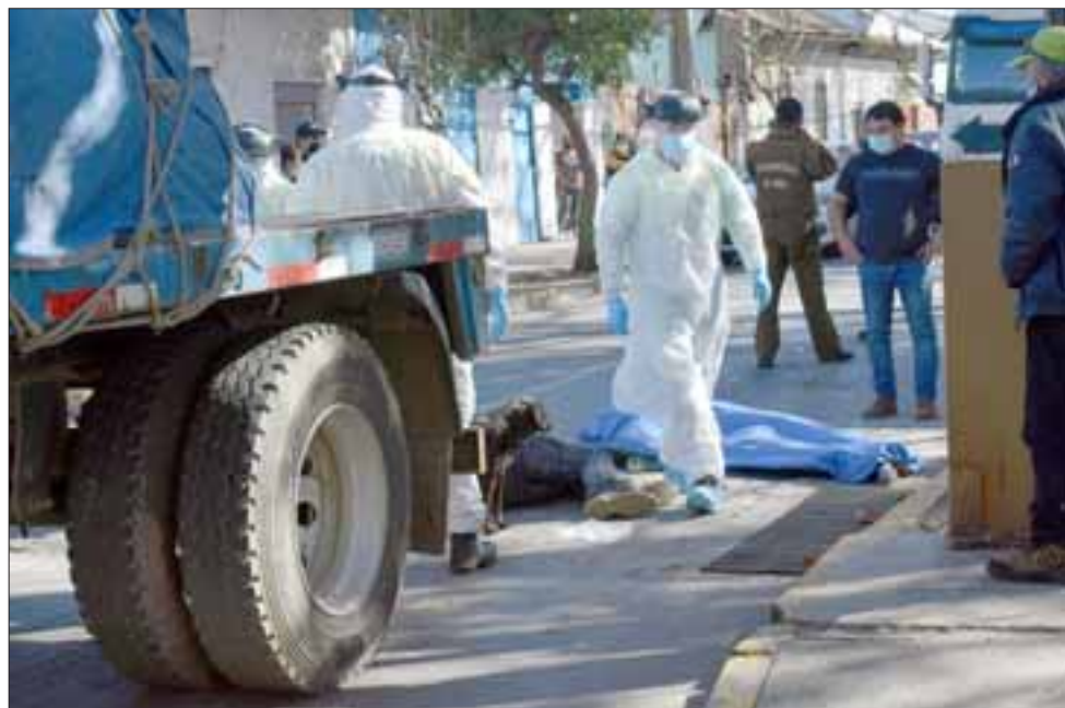
El cuerpo yace cubierto por una lona color azul.