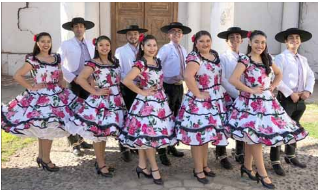
NUESTRO BALLET.- Ellos son parte de los jóvenes que conforman esta prestigiosa agrupación artística de nuestra comuna.