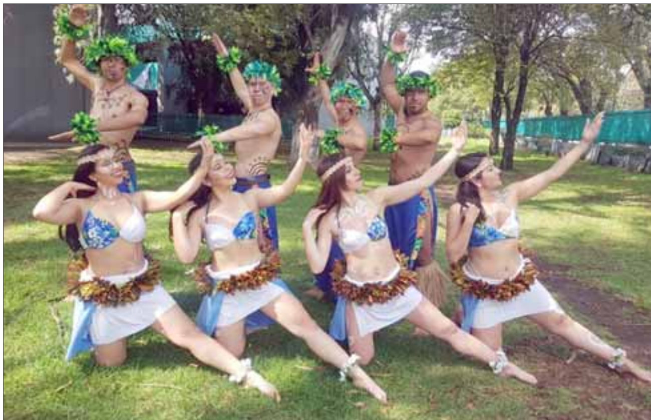
FELIZ CUMPLEAÑOS.- Hoy miércoles este Ballet folclórico se encuentra cumpliendo sus 26 años de existencia, llevando alegría, calidad artística y gran despliegue escénico en las actividades donde se han presentado.