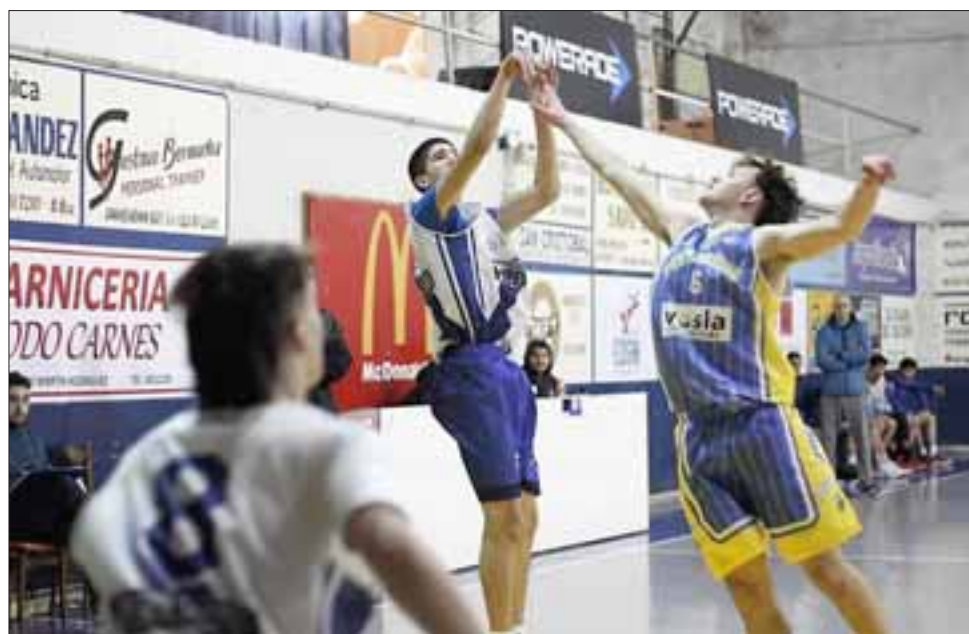
El Prat en una de sus últimas participaciones en el Campioni del Domani.

Por estos días un grupo de jugadores pratinos que integran el conjunto que debería jugar el Domani, se encuentran realizando por cuenta propia unas rutinas de entrenamiento diarias que les permitan volver en buenas condiciones cuando se vise el retorno a las actividades deportivas.