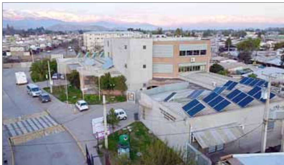
A partir de hoy a las 07:00 horas el Cesfam 'Segismundo Iturra' comenzará a atender vía telefónica para agendar horas de morbilidad.

«En cuanto a las atenciones respiratorias, éstas se seguirán realizando de manera presencial. Si yo estoy con alguna afección respiratoria debo acercarme al Centro de Salud Familiar, que cuenta con todos los protocolos respectivos para desarrollar una atención oportuna», destacó.