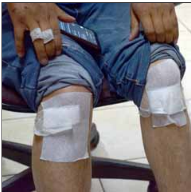
RODILLAS TAMBIÉN. - Las rodillas del vecino, según el mismo denunciante, también están muy golpeadas.