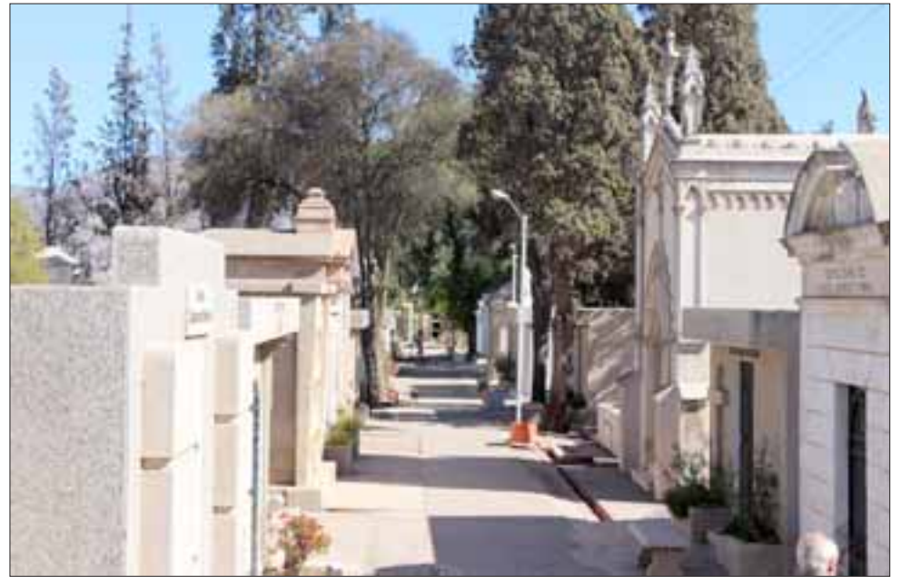
A partir de hoy miércoles, y sólo de lunes a viernes, reabre sus puertas al público el Cementerio Municipal de San Felipe.

«Nuestro personal velará porque se cumplan las medidas sanitarias correspondientes para todas las vecinas y vecinos que ingresen a las instalaciones», comentó.