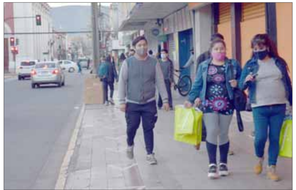
SEAMOS RESPONSABLES. - En esta Fase 2 se nos permite el desplazamiento y la reapertura de ciertos comercios en la zona, de lunes a viernes, manteniéndose la cuarentena los sábados, domingos y festivos; el Toque de Queda se mantiene sin cambios.

- Los patrones o empleadores deben exigir y poner a disposición de los trabajadores, los elementos de protección e higiene para evitar contagios, esto es, mascarillas, medidas de barrera física en caso de ser posible (ventanales, cajas acrílicas, etc.), elementos de sanitización personal (alcohol-gel, elementos para lavado de manos para ser usados cada vez que sean necesarios, etc.). Sanitizar tanto los espacios comunes que usan trabajadores, como aquellos espacios comunes en los que exista circulación de clientes; entendiendo la autonomía de y las realidades particulares de cada establecimiento comercial, y entendiendo también la necesidad de tener ventas, y tratando de conjugar esto con las exigencias sanitarias que la Pandemia exige, a fin de mantener el flujo de clientes sin que se generen aglomeraciones. Se sugiere mantener un horario continuado, con hora de apertura a las 10.00 horas y de cierre a las 18.00 horas. Finalmente, les recuerdo que los trabajadores que vivan en zonas en que se ha decretado cuarentena, legalmente están eximidas prestar servicios e impedidas de circular libremente, por lo que, de darse este caso, el empleador no podrá exigir