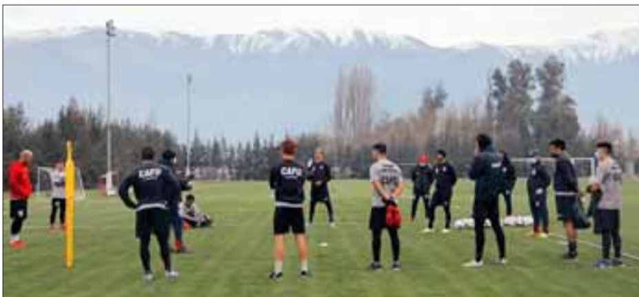
En las próximas horas el plantel albirrojo dará inicio a la Fase 3 del reintegro deportivo.

bajando sin mayores dificultades hace casi tres semanas, y de no mediar ningún contratiempo, desde la jornada de hoy podrá comenzar a ejecutar la puesta a punto técnica-táctica, ya que hasta ahora los acentos se han puesto preferentemente en la parte física.