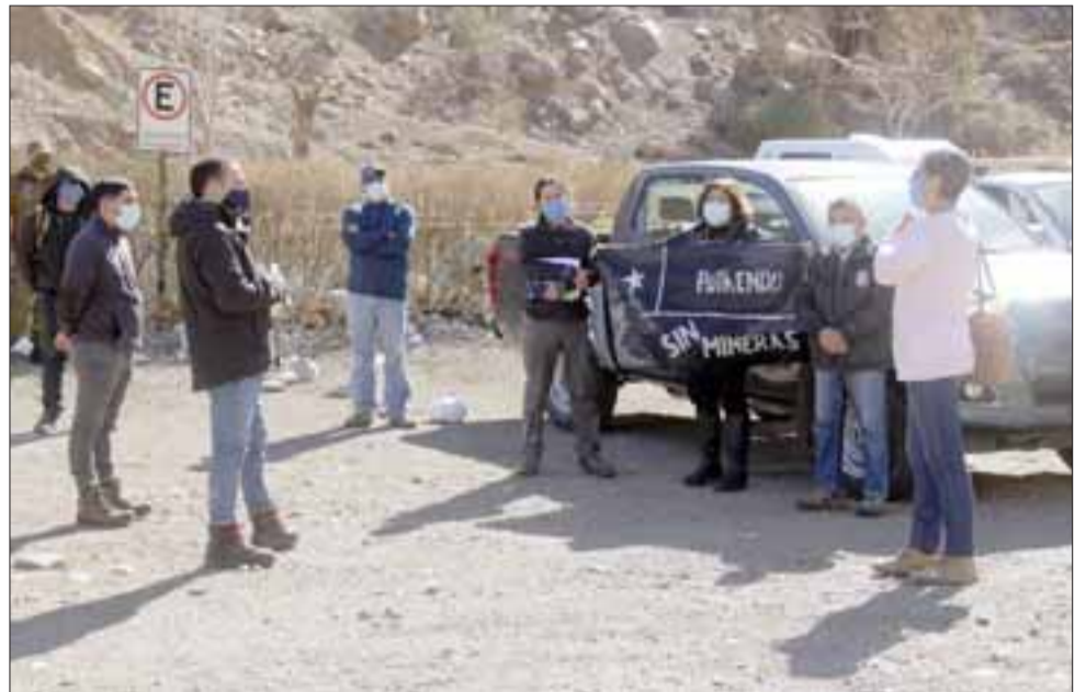
En el sector 'Las Tejas' las autoridades reiteraron a representantes de la Compañía Minera Vizcachitas Holding, su oposición a la instalación de faenas de gran minería en la cordillera de Putaendo.

Si bien se constató que no existe campamento minero, en la oportunidad se dejó claro el recelo y rechazo por parte del municipio hacia Vizcachitas Holding.