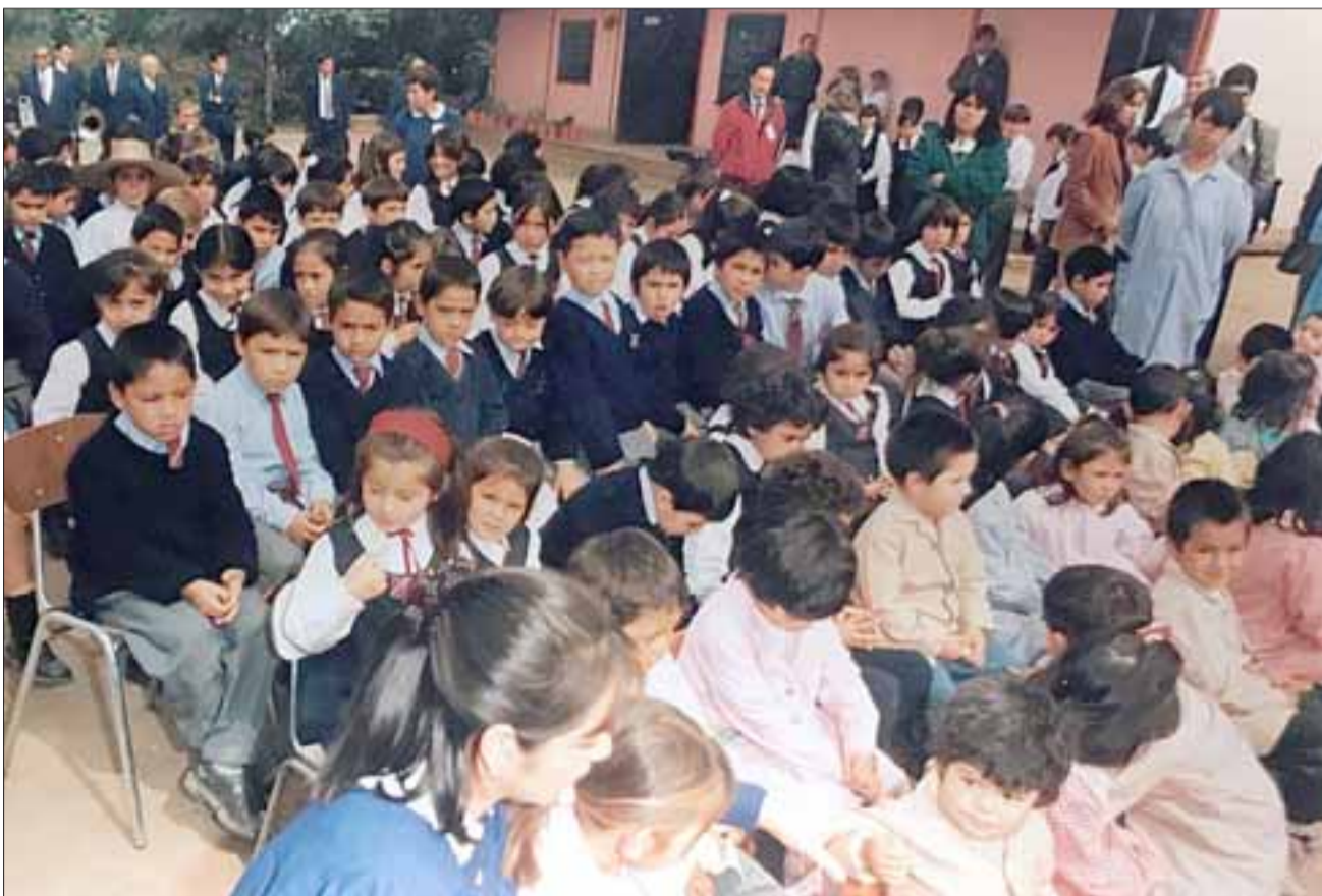
SUS OTROS HIJOS.- Estos niños fueron alumnos de Laura, hoy ya adultos y profesionales la mayoría de ellos.