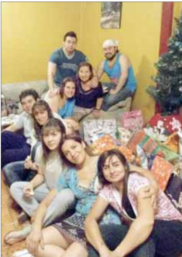
CON SU AMADA FAMILIA.- Aquí vemos a su amplia descendencia, hijos y nietos compartiendo con ella.