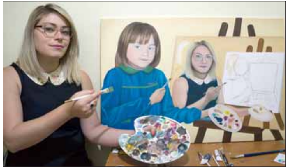
HECHIZO EN 'OLEO.- Aquí vemos a esta pintora trabajando con el surrealismo, ella misma autodibujándose en otra obra.

- Mi pasión por el dibujo y la pintura ha existido desde siempre. Fueron mis