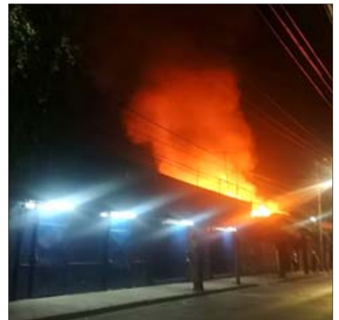
SIGUEN LOS INCENDIOS. - Muchos daños materiales dejó el enorme incendio que afectó un cité y otros inmuebles la noche de este viernes en las esquinas de calle Abraham Ahumada con Artemón Cifuentes.

ros hicieran su trabajo, Diario El Trabajo también