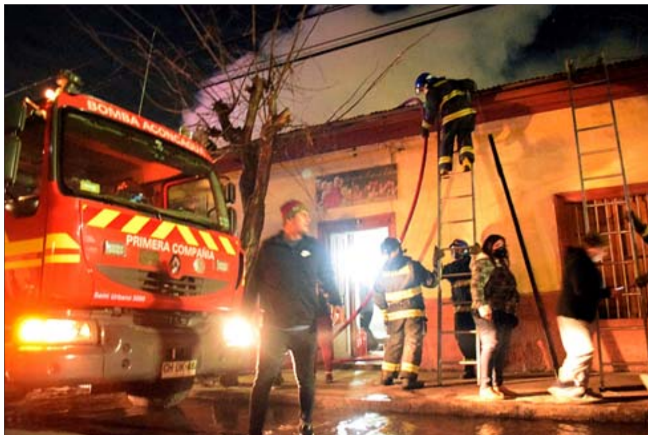
GRANDE BOMBEROS. - Las cámaras de Diario El Trabajo estuvieron en la escena, una vez más los bomberos impidieron una tragedia mayor.

té porque habían muchas llamas, estaban las niñas sacando a los abuelitos del Hogar y los ponían en el suelo, no dudé en abrir las puertas de mi casa para