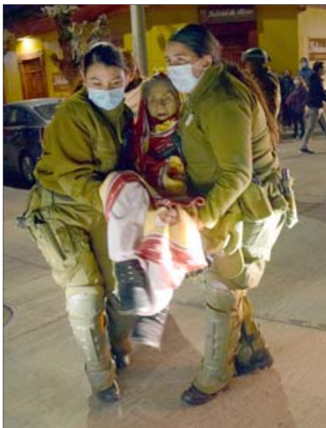
SIEMPRE CARABINEROS. - Varias carabineras también hicieron su trabajo rescatando de la zona de peligro a varios abuelitos.