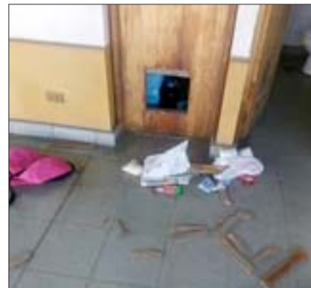
Acá se observan los daños dejados por el solitario delincuente que ingresó con claras intenciones de robar en la Parroquia de Nuestra Señora de La Merced.

uno que al sentir la alarma, «también informó a Carabineros para que concurren al lugar «también alertó a la persona y eso hizo que la persona saliera rápidamente de estas dependencias y finalmente no sustrajera nada de valor del lugar lamentamos el hecho ocurrido durante esta madrugada, pero también agradecemos el apoyo de la comunidad de la Parroquia de la Merced que siempre están atentos y disponibles para ayudar en cuanto se necesitan más en