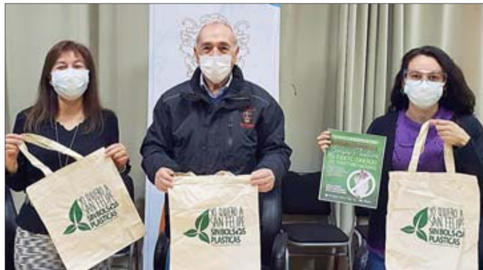
Esta medida se incorporó, de forma paulatina, desde el 2018 y ahora se suman los medianos y pequeños negocios a la medida.