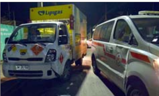
TODOS CORRIENDO. - Un furgón de reparto de gas protagonizó una colisión durante la emergencia con una unidad de Bomberos.