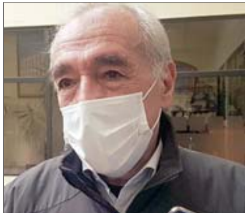
Patricio Freire Canto, alcalde de San Felipe.

En conformidad a lo dispuesto por la Ley Sobre Expendio y Consumo de Bebidas Alcohólicas 19.925; el Concejo Municipal aprobó por unanimidad la propuesta realizada, en sesión extraordinaria, por el alcalde de San Felipe, Patricio Freire , para prorrogar el pago de las patentes de alcoholes, cuyos valores no hayan sido cancelados al 31 de julio del año 2020. La norma fue publicada este viernes en el Diario Oficial y faculta a los alcaldes a extender el plazo de pago de la cuota de julio en dos iguales para el 2021.