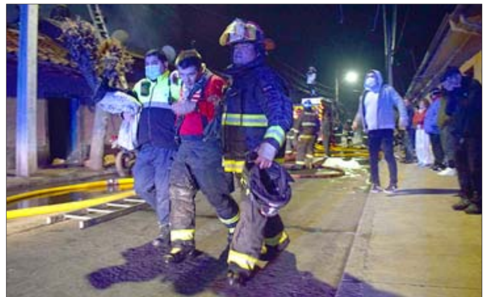
BOMBERO GOLPEADO. - Aquí vemos el momento justo cuando el bombero que cayó de gran altura, era trasladado por sus compañeros a un lugar seguro para recibir atención médica.