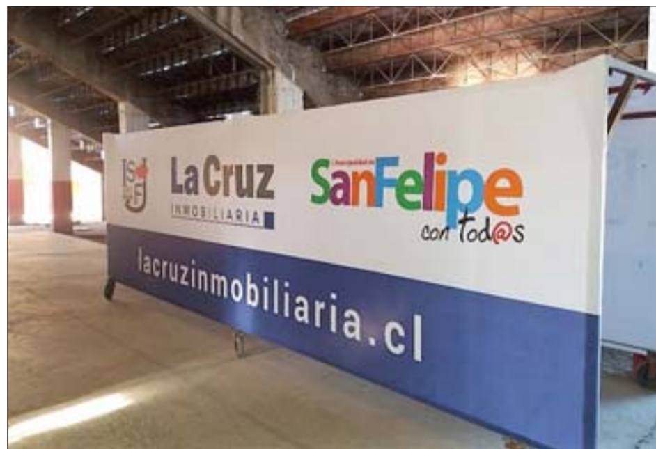
Al tratarse de un estadio antiguo y ya lejos de los estándares actuales, es un misterio si el Municipal será visado para albergar el fútbol profesional.