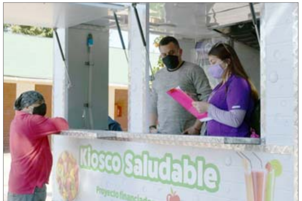
TODO EN ORDEN.- Cada dispositivo del carro fue checado por personal municipal para confirmar que todo funciona perfectamente.