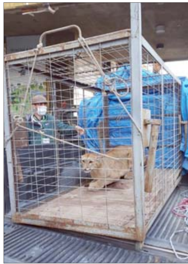
El puma herido en la jaula al momento de bajarlo en el Zoológico Nacional en Santiago.