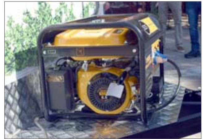
FUENTE DE PODER PROPIA.- Este es el generador eléctrico del Food Truck, puede instalarse en cualquier lugar y funcionar con normalidad.