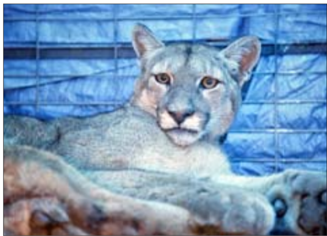
La imagen que impactó del puma herido a bala en el sector de la cuesta Las Chilcas.

El puma es el mayor felido de América después del jaguar. Esta especie se encuentra protegida por ley, y su situación es diferente en cada región de Chile. En las últimas décadas, los pumas han sido casi diezmados por ganaderos que los matan para proteger el ganado.