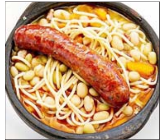
UNA DELICIA. - Este delicioso platillo chileno se estará ofreciendo para llevar a casa, este sábado a las 13:00 horas en la sede de La Santita.