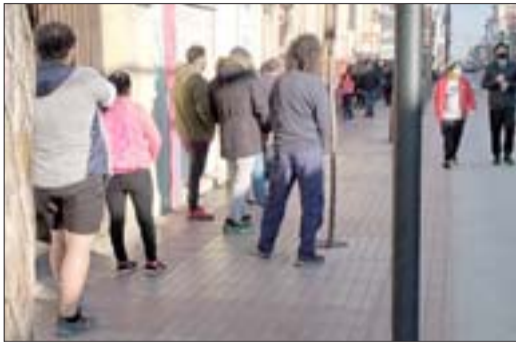
Numerosas personas haciendo fila en un banco

San Felipe va derecho al retorno de la Cuarentena