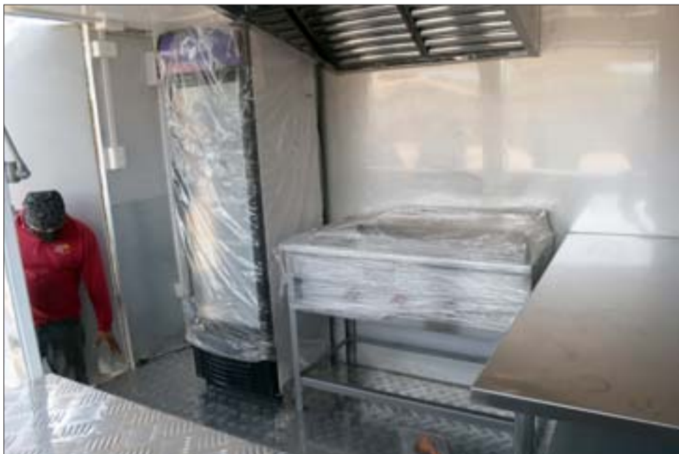
BIEN EQUIPADO.- Al interior del carro vemos la cámara fría y la cocina, todo listo para ser usado.