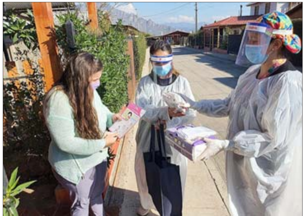
Las entregas se hicieron a domicilio para evitar que las familias salgan de las casas por el tema del coronavirus.