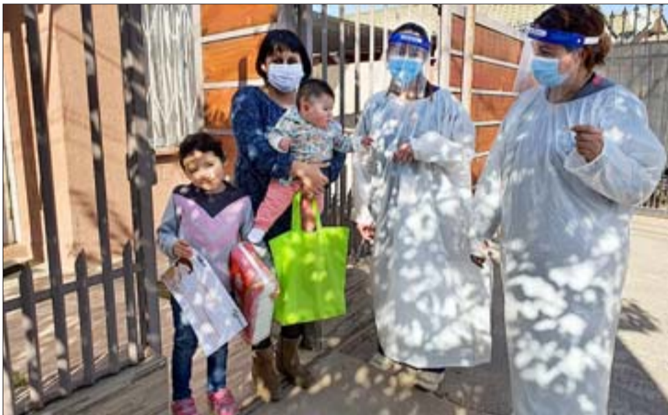
Con la medida se está premiando a las mamitas que cumplieron una lactancia materna exclusiva exitosa mayor a 6 meses.