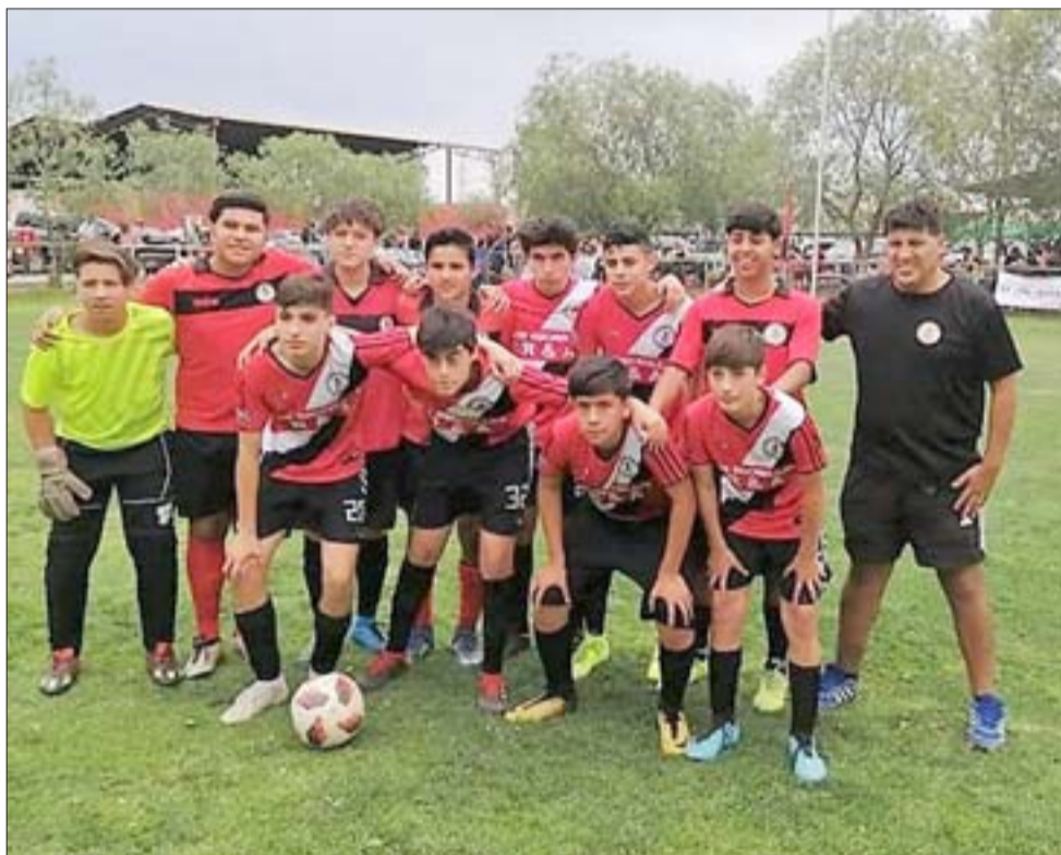
En sus casi dos décadas de existencia, la Escuela de Fútbol Fortaleza se ha convertido en una de las más importantes de la zona.

Por estos días Fortaleza sigue firme en sus valores formativos, donde todos juegan, independiente de sus habilidades o capacidades, lo que la mantiene completamente vigente como uno de los centros de formación más importantes de la zona al tener una matrícula de 70 niños que integran sus 6 categorías activas.