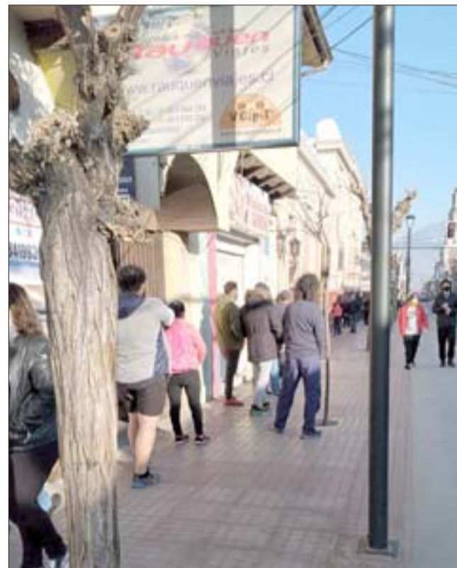
Para muestra un botón: gran cantidad de personas haciendo fila afuera de un banco.

Sólo queda preguntarse: ¿Corremos el riesgo de volver a cuarentena?