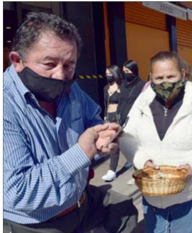
MUNICIPIO AL PENDIENTE. - Desde el Municipio de Llay Llay se contactó vía telefónica con estas personas, para atender de inmediato sus necesidades.

Comedor Solidario del Club Deportivo Santos: