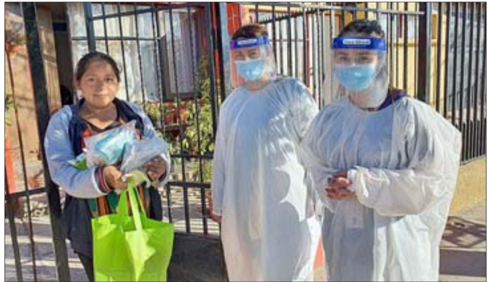
La entrega domiciliar de regalos benefició a 11 mujeres que son mamás o están ad portas de serlo, en el marco de la celebración del mes de la lactancia materna.

En total fueron 11 mujeres las que recibieron estos obsequios, cinco usuarias del Cecosf y seis madres que se atienden en el Cesfam Segismundo Iturra.