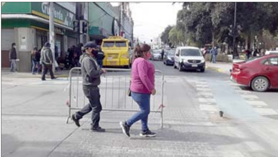
VALLAS PAPALES.- Una valla instalada en Salinas con Prat sirvió para cortar el tránsito en esta última arteria hacia calle Traslaviña.