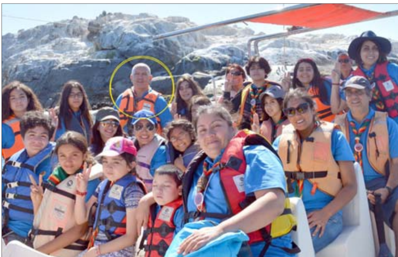
FAMILIA SCOUTS. - Esta es su familia, completamente integrada al escultismo de Scouts en nuestra comuna.