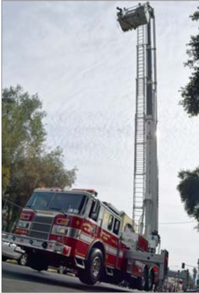
El vehículo de procedencia norteamericana cuenta con una escala mecánica de 40 metros de altura y fue asignado a la Segunda Compañía 'La Internacional'.