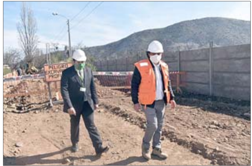
Alcalde Claudio Zurita junto a profesionales de la empresa a cargo de la obra, inspeccionaron el inicio de los trabajos.

El proyecto beneficiará a los vecinos y vecinas que residen en Villa Las Tacas, Villa El Anhelito, Población San José Obrero, Villa Los Almendros, Calle Piedra del León.