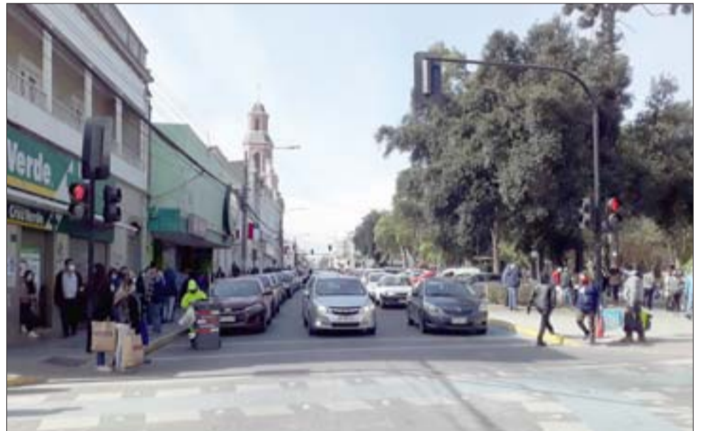
CONGESTIÓN VEHICULAR.- Como en los viejos tiempos, como si nada hubiera pasado, así de congestionado estaba el tránsito ayer en el centro de la ciudad.