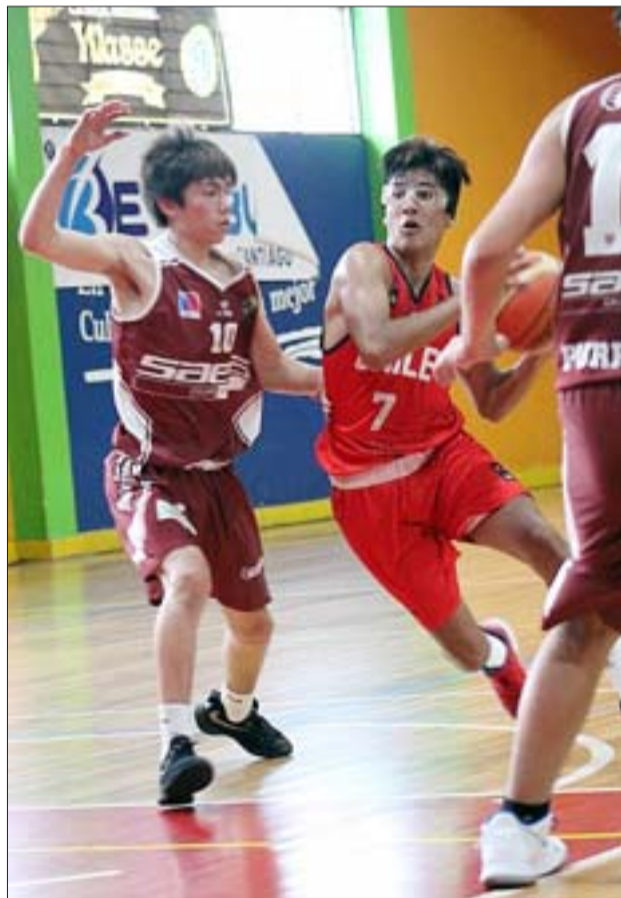
Al ser un deporte que se juega en lugares cerrados, el básquetbol deberá esperar un buen rato para volver.

Paso 2: Transición: Se autorizan actividades deportivas al aire libre en lugares públicos y gratuitos. Concentración máxima de 10 personas