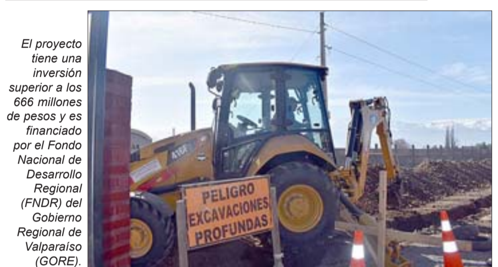
El proyecto tiene una inversión superior a los 666 millones de pesos y es financiado por el Fondo Nacional de Desarrollo Regional (FNDR) del Gobierno Regional de Valparaíso (GORE).