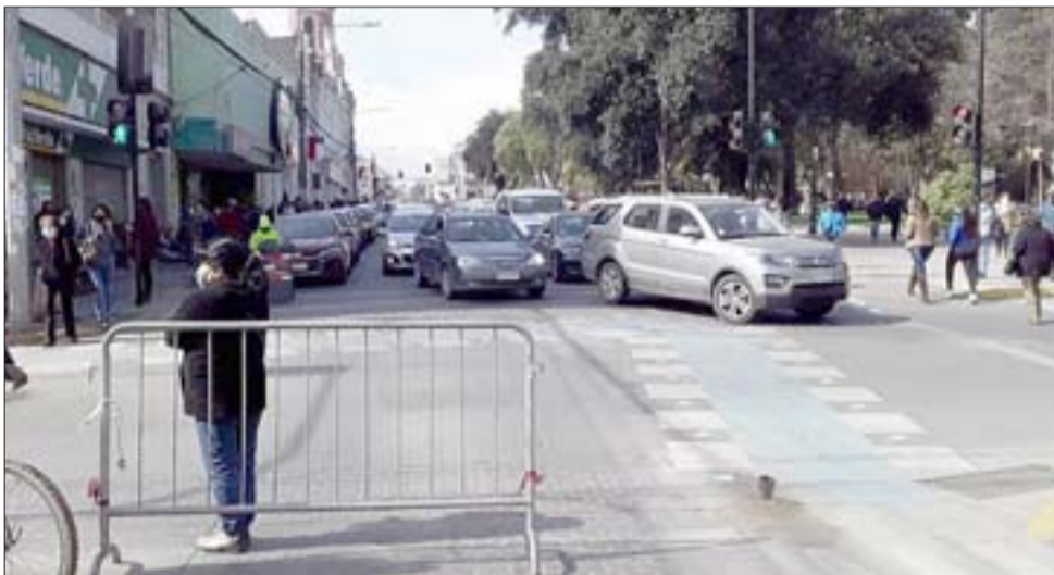
TACOS.- Los vehículos debido al corte debieron doblar por Salinas hacia el sur, aumentando aún más las congestión.