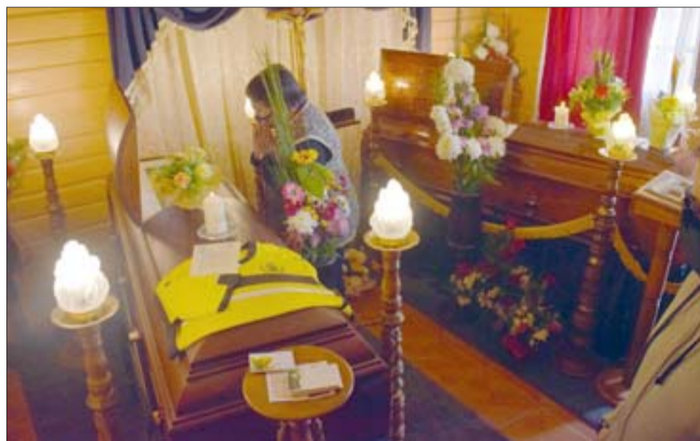
JUNTOS HASTA EL FINAL.- A los dos se les veló en la sala de su casa, su amor fue tan fuerte que ni la misma muerte fue capaz de separarlos.

Los hijos, hermanos y nietos no podían digerir el perder a su padre, estaban desconsolados y buscando la manera de entender por qué el Destino les arrebató de un solo golpe a sus dos