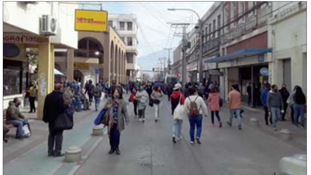
ASÍ NOS CUIDAMOS.- Gran cantidad de personas transitando por calle Prat ayer en la mañana. No era un recital ni un concierto, solo un día lunes...

Importante señalar que San Felipe sigue en la etapa 2 de transición, es decir sólo los fines de semana y festivos se activa la cuarentena.