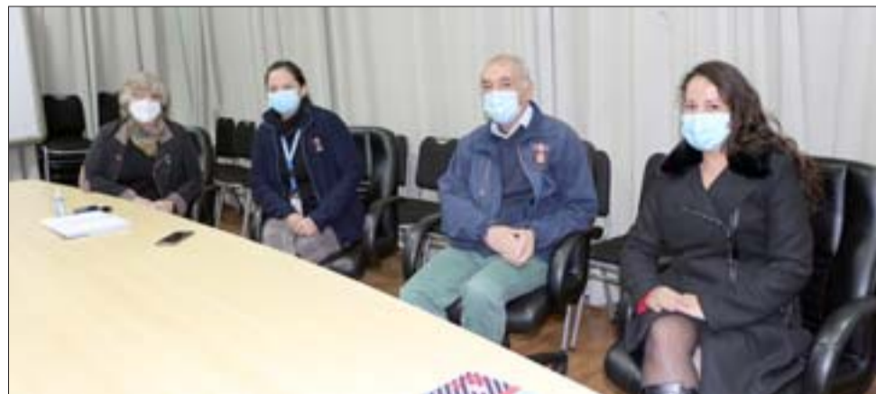
El alcalde Patricio Freire junto a jefaturas de salud municipal llamaron a mantener las medidas de autocuidado debido a que nos convertimos en la comuna en transición con mayor número de contagios desde el desconfinamiento.

tienda la importancia de respetar las medidas, tales como el lavado de manos frecuente, la mascarilla. «Estamos muy preocupados como sanfelipeño, porque pasamos de la etapa 1 a la 2 del plan paso a paso, haciendo todo lo humanamente posible para regresar a la cuarentena, y tenemos a personas que no están comprendiendo lo importante de cuidarnos. San Felipe, tristemente, encabezó el listado de