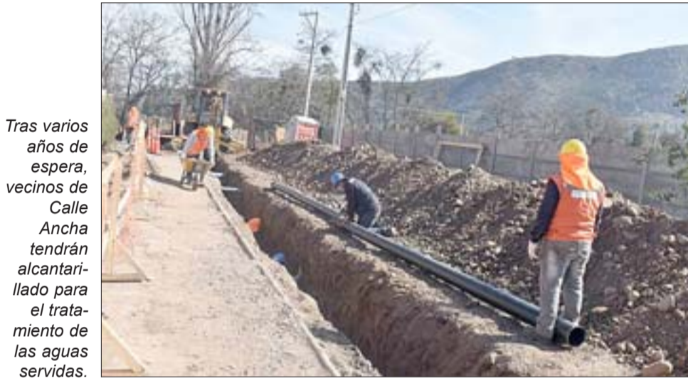
Tras varios años de espera, vecinos de Calle Ancha tendrán alcantarillado para el tratamiento de las aguas servidas.