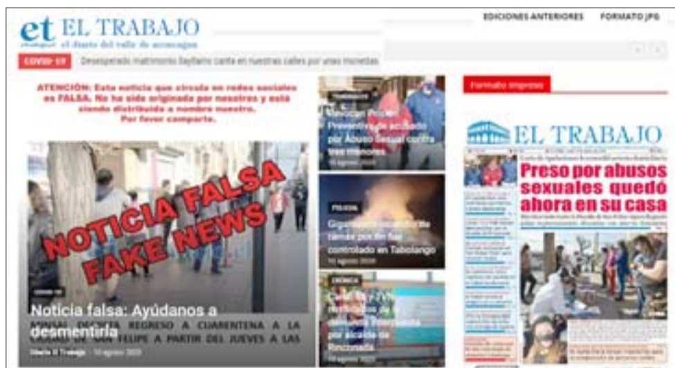
SOMOS UN DIARIO SERIO. - En Diario El Trabajo tuvimos que desmentir la noticia lo más rápido posible, igual la broma ya estaba hecha.

Te invitamos a seguir estas recomendaciones para prevenir eventuales contagios del COVID-19