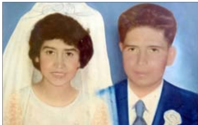
TODA UNA VIDA AMÁNDOSE.- Prácticamente desde adolescentes se unieron en matrimonio, así eran las costumbres en esos tiempos.

seres más queridos en esta vida. Los vecinos por su parte también estaban atónitos ante tal suceso comunitario.