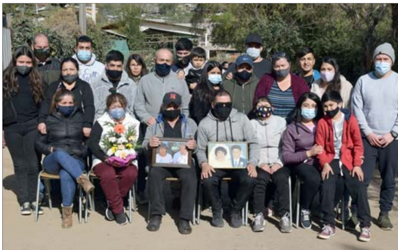
SU DESCENDENCIA.- Aquí tenemos a muchos familiares de este matrimonio, hermanos, hijos y nietos le despiden hoy con amor y desconsuelo.