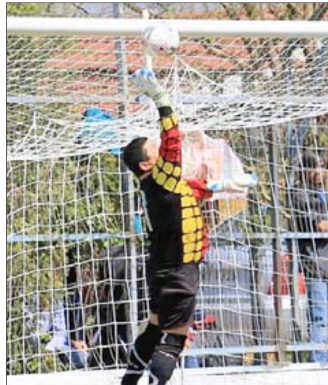
El protocolo sanitario no garantiza que la asociación de fútbol sanfelipeña organice algún torneo.

muy corto y con pocas series en competencia», afirmó, mientras que por el momento evitó entregar una fecha tope respecto a cuándo se tomará la resolución final respecto a si este 2020 se jugará o no. «Mire es preferible esperar, pero lo concreto es que esto (la pandemia) cada vez se complica más y no sería raro que San Felipe vuelva a cuarentena. Creo que si en octubre aún no jugamos es porque ya no habrá un campeonato de nuestra asociación; no forzaremos nada, ya que la salud es lo más importante», finalizó.