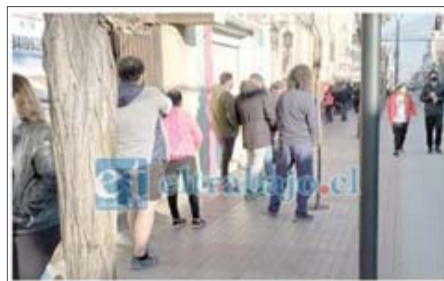
MINSAL DECRETA REGRESO A CUARENTENA A LA CIUDAD DE SAN FELIPE A PARTIR DEL JUEVES A LAS 22:00HRS

IMPORTANTE RECORDAR Se hace importante re-