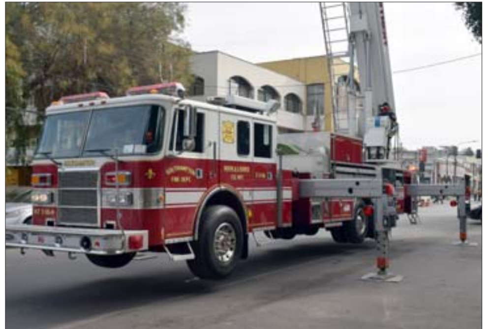
El nuevo carro porta escala fue presentado la mañana de ayer a la comunidad en plena Plaza de Armas.