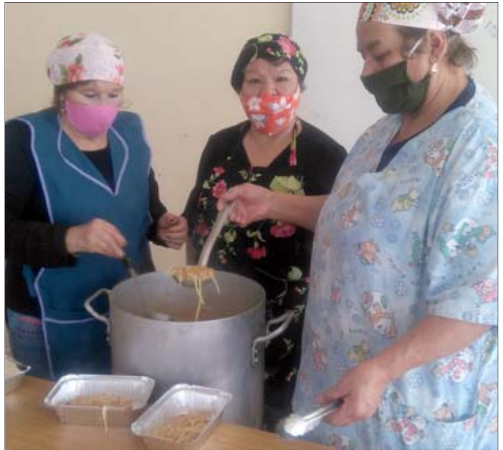
BIEN CALIENTITA.- Aquí vemos a estas vecinas de La Santita, preparando y despachando los almuerzos para quienes llegaron a la sede este sábado.