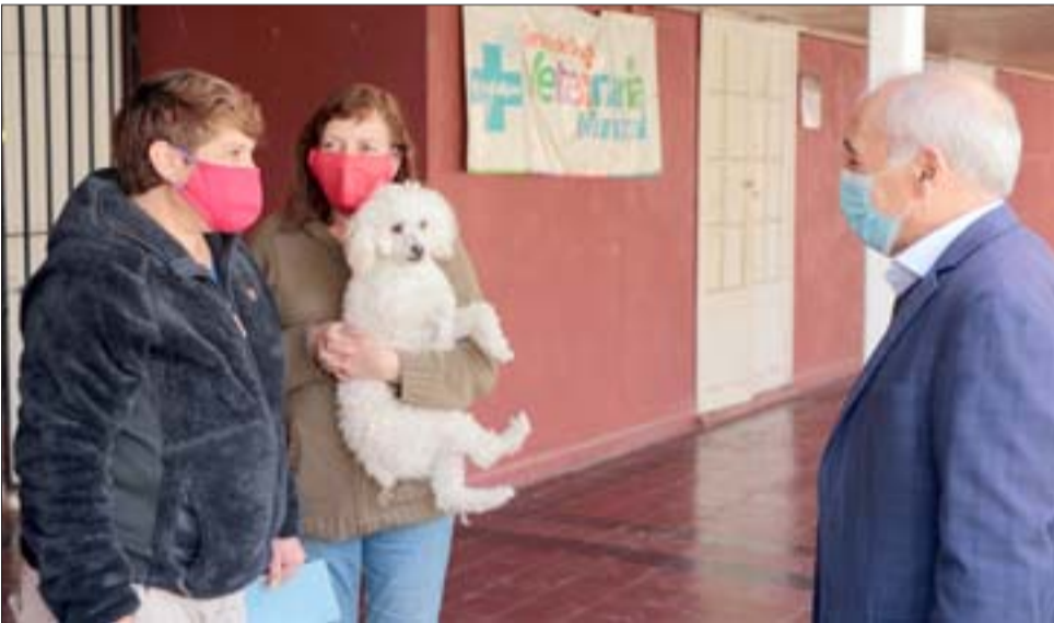
El alcalde Patricio Freire destacó el inicio de este programa de esterilización pues evita el incremento de la población y a la vez es un ahorro para los dueños de las mascotas.

nando, por instrucción del alcalde, porque entendemos que es una necesidad, dado que el costo veterinario es muy alto y debemos mantener esta atención gratuita sobre todo en este tiempo», precisó.