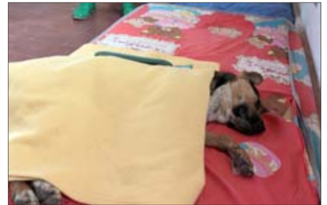
Las mascotas son muy bien atendidas durante el pre y post operatorio, efectuándose 9 cirugías diarias.