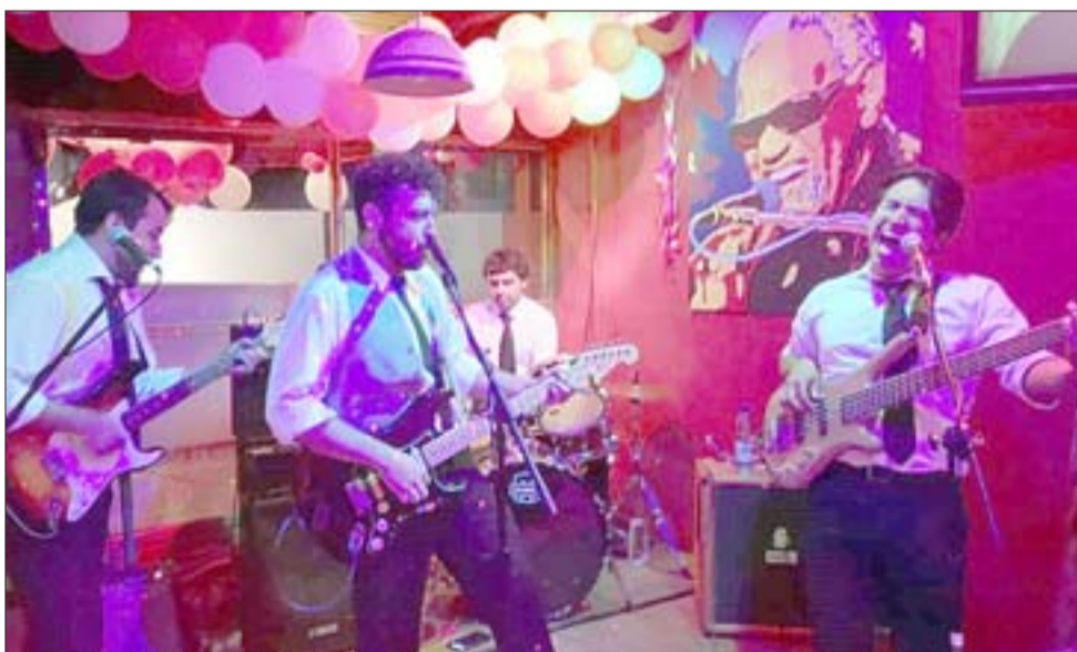
AQUELLOS TIEMPOS. - Así lucían estos músicos locales antes de la Pandemia en los eventos que realizaban en el valle.