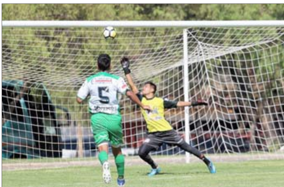
Trasandino tendrá nueve rivales en la temporada 'corta' de la Tercera A.