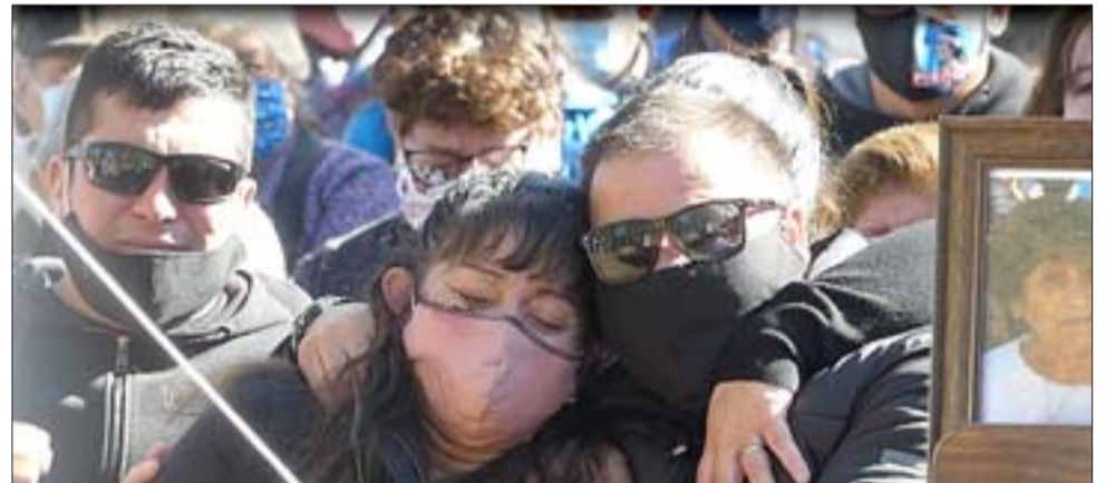
DESGARRADOR. - Nadie pudo contener el llanto tras la fulminante partida de este matrimonio en Las Cabras, todos fueron tocados por el amor y presencia de quienes hoy ya no están con nosotros.