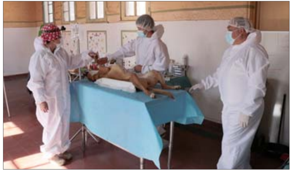
Este lunes partió la esterilización de mascotas. Serán 135 cirugías que se realizarán durante agosto, y posteriormente se continuará en septiembre y octubre.

También tendrán que seguir las instrucciones del personal y mantener una distancia no inferior a un metro de las otras personas. Además, deberán llevar su lápiz personal para firmar el consentimiento de la cirugía.