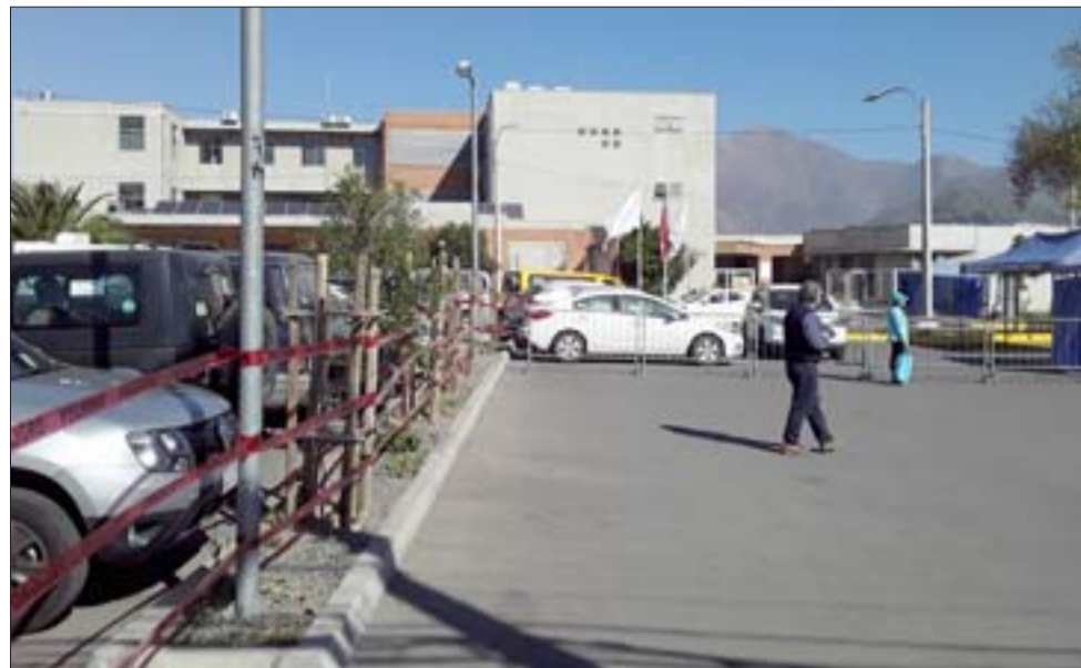
Un insólito suceso se registró este fin de semana en el Cesfam Doctor Segismundo Iturra Taito.