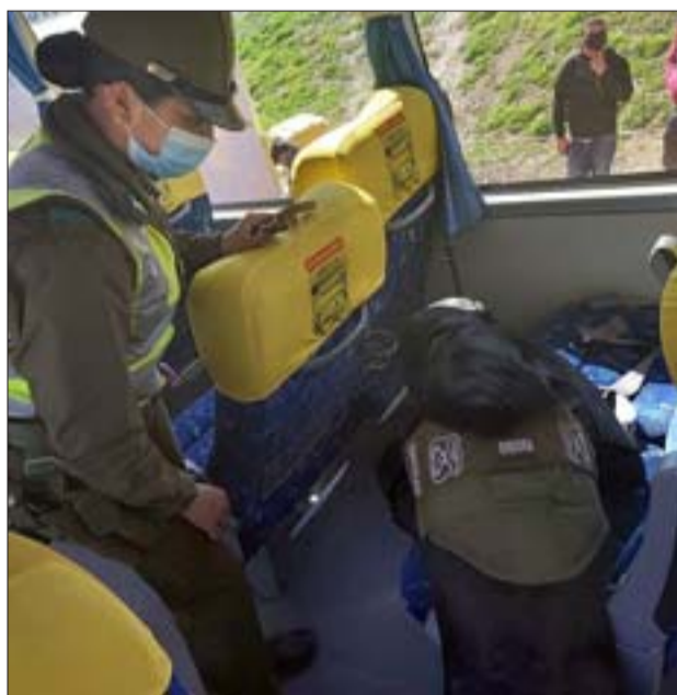
El perro detector de drogas de la Subcomisaría Los Libertadores detectó de inmediato la presencia de sustancias ilícitas.

• Se recuerda a la comunidad que los hechos ligados a drogas pueden ser denunciados de manera anónima al fono 135.