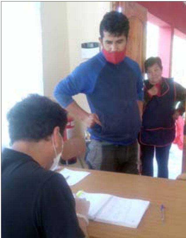
TODO ANOTADO.- Cada vecino registró su nombre antes de recibir los almuerzos en la sede vecinal.

Tal como lo habíamos informado, a toda máquina continúan los vecinos del Comedor Solidario de La Santita cada fin de semana. Las cámaras de Diario El Trabajo estuvieron este sábado registrando la jornada de trabajo comunitario que desarrollan los integrantes del Club Deportivo Santos, y los dirigentes de la junta vecinal del sector en la misma sede.