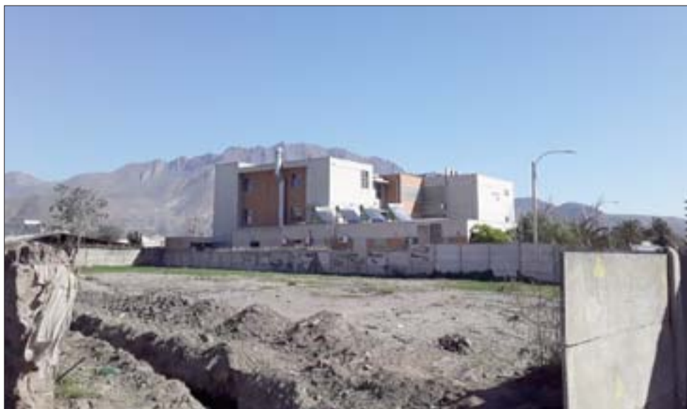
En ese sitio eriazo donde se pretende construir el SAR, se supone que estaba el grupo de sujetos que posiblemente haya lanzado algún objeto al Cesfam provocando daños en un vidrio.