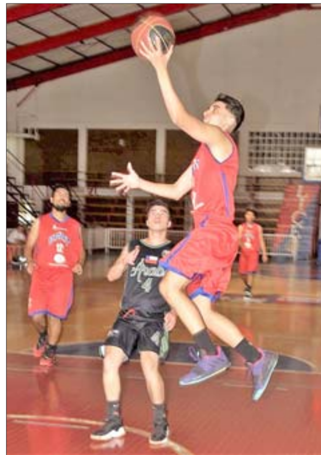
En septiembre se decidiría si este año se jugará algún torneo de la ABAR.