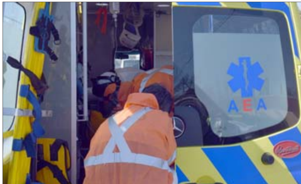
SAMU EN ACCIÓN.- El paramédico del SAMU, Miguel Galdámez, estabilizó a su paciente y lo trasladó grave a Traumatología del Hospital de Los Andes.