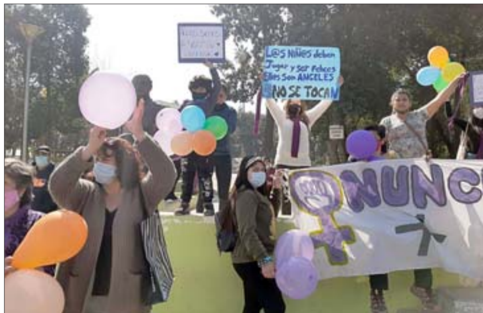
Madres, junto a pequeños también manifestándose por la medida.