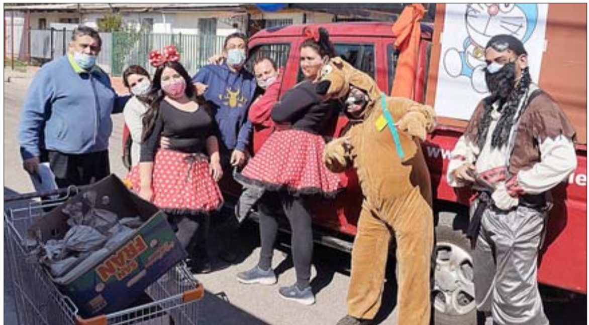
GRACIAS CHIQUILLOS.- Los voluntarios de este equipo de trabajo comunitario programaron este proyecto por varias semanas antes de ejecutarlo.