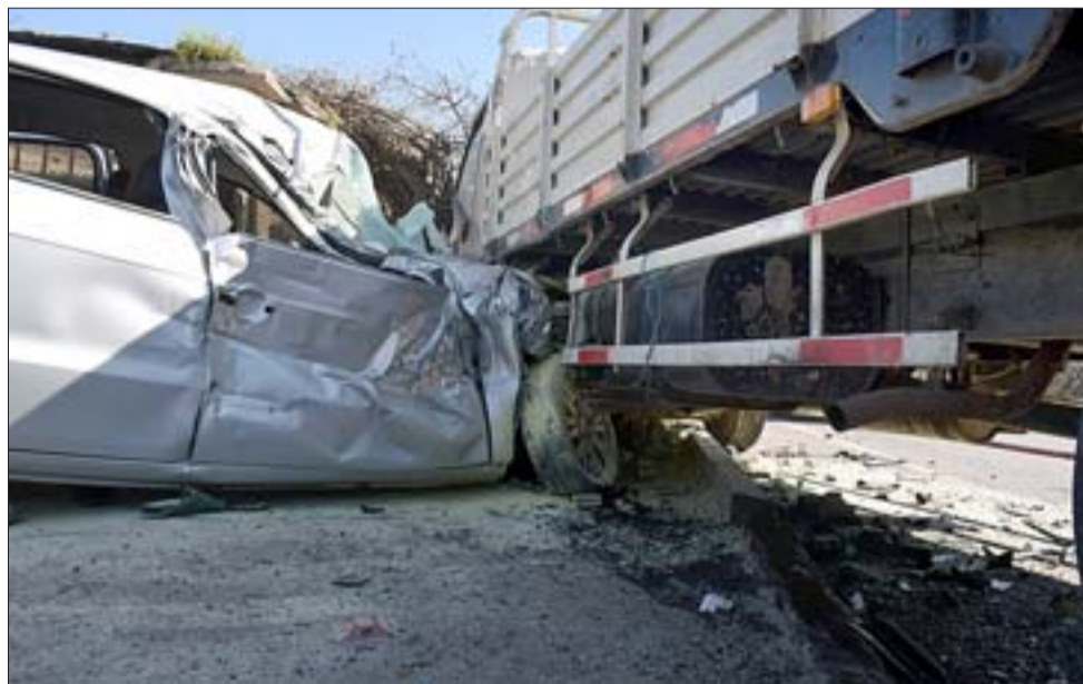
EN INVESTIGACIÓN.- Incrustado debajo del camión quedó el Volkswagen patente KV JX 60, luego que, según la versión del conductor del camión, intentara adelantarlo.

Según se supo, al momento del impacto el auto menor empezó a echar humo y sufrió un amago de