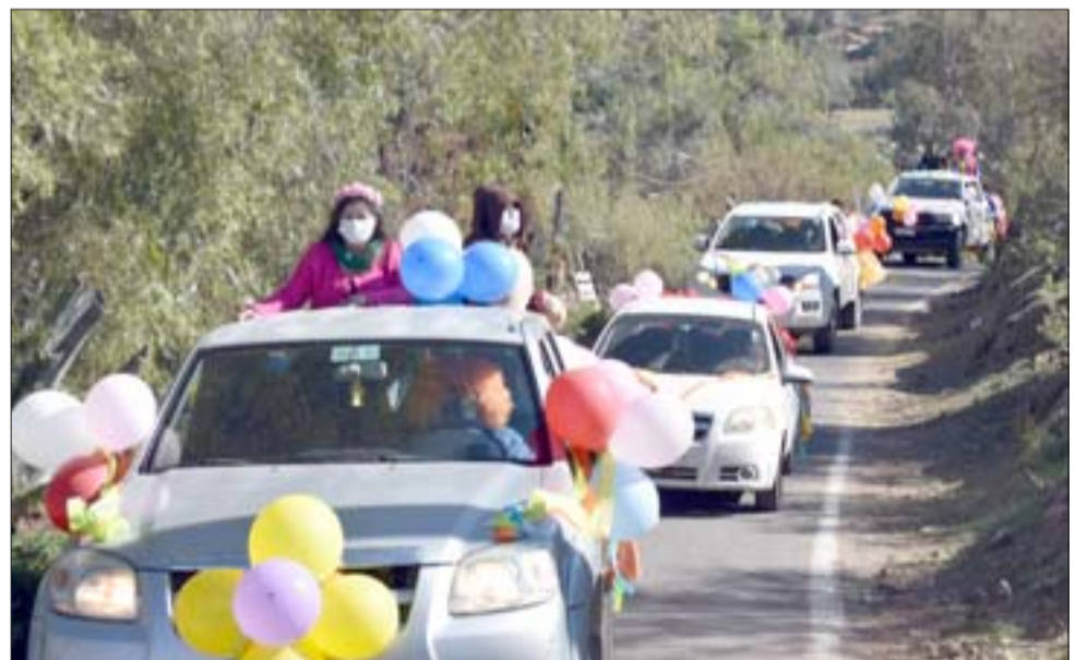
CARAVANA REGALONA.- Aquí vemos la caravana que recorrió toda la comuna de Santa María este domingo para repartir regalos a los niños en su día.