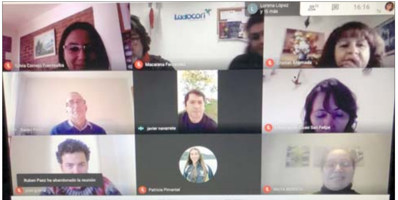
Los directores de los liceos junto a sus equipos participaron en una nueva reunión de la Red de Liceos de San Felipe.

«Sabemos que el Liceo Doctor Roberto Humeres parte en séptimo básico, pero desde la conciencia fonológica, las experiencias que nos pueden relatar las fonoaudiólogas pueden partir en ese curso. Sabemos que ellos no tienen primero básico, entonces utilizamos estrategias en ese nivel, entonces lo que se hizo fue que cada establecimiento trabajó las estrategias, hizo la presentación y la compartió con el resto de los liceos, se fueron retroalimentando y articulando este trabajo porque lo fundamental hoy