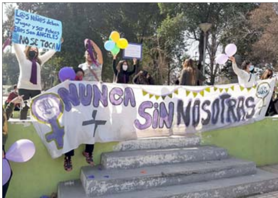
Un grupo de mujeres manifestándose contra la medida de la Corte de Apelaciones que dejó con arresto domiciliario al imputado de abuso sexual a menores de 14 años.

El imputado fue identificado con las iniciales G.T. de 50 años.