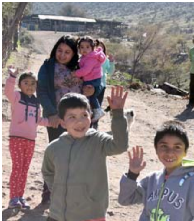
ESPERANDO SU REGALO.- Otros pequeñitos en cambio debieron esperar un rato, hasta que llegaron los regalos.