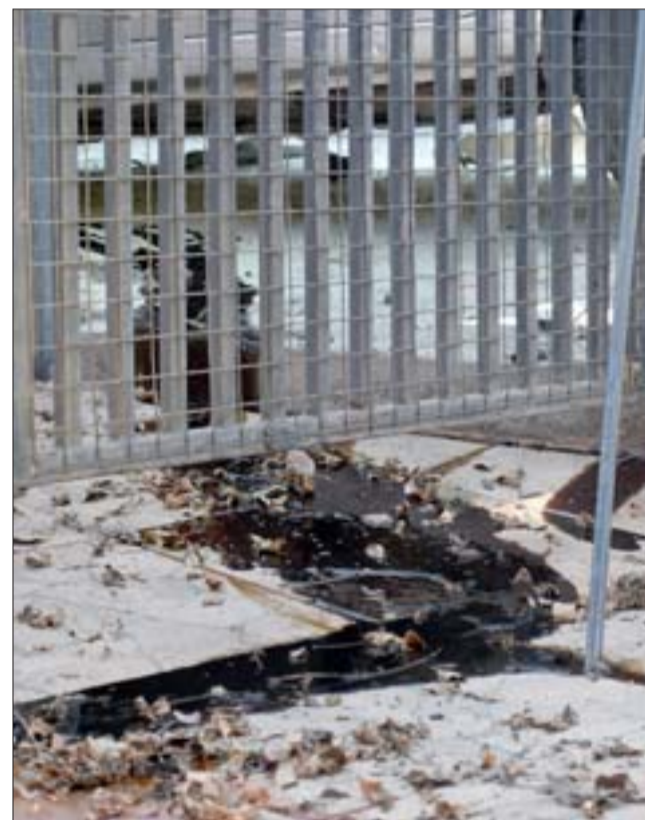
POR POCO EXPLOTA.- En la casa esquinera donde quedó prensado el auto menor, los chorros de aceite del vehículo corrieron por la propiedad.

«Este lunes, minutos antes del mediodía, se registró un accidente vehicular en el paradero 14 camino Tocornal. En el mismo un auto menor quedó debajo de un camión mediano. El conductor del auto menor resultó con fracturas y cortes en su cuerpo. A la llegada de Bomberos el conductor estaba fuera de su vehículo, ya que el mismo se estaba incendiando, pero