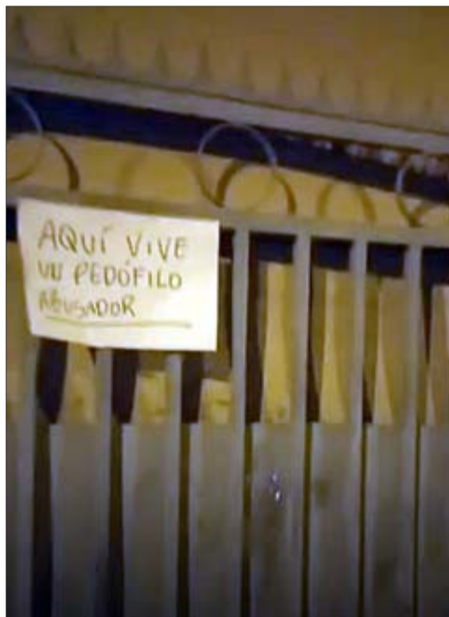
Hasta un cartel 'funando' al imputado colocaron en la vivienda donde éste se encuentra cumpliendo arresto domiciliario.