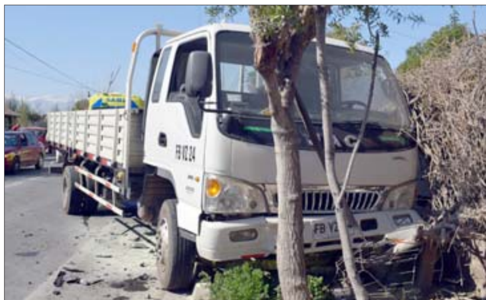
SACADO DEL CAMINO.- Tras ser impactado, el camión terminó chocando contra un paredón al lado de la carretera.