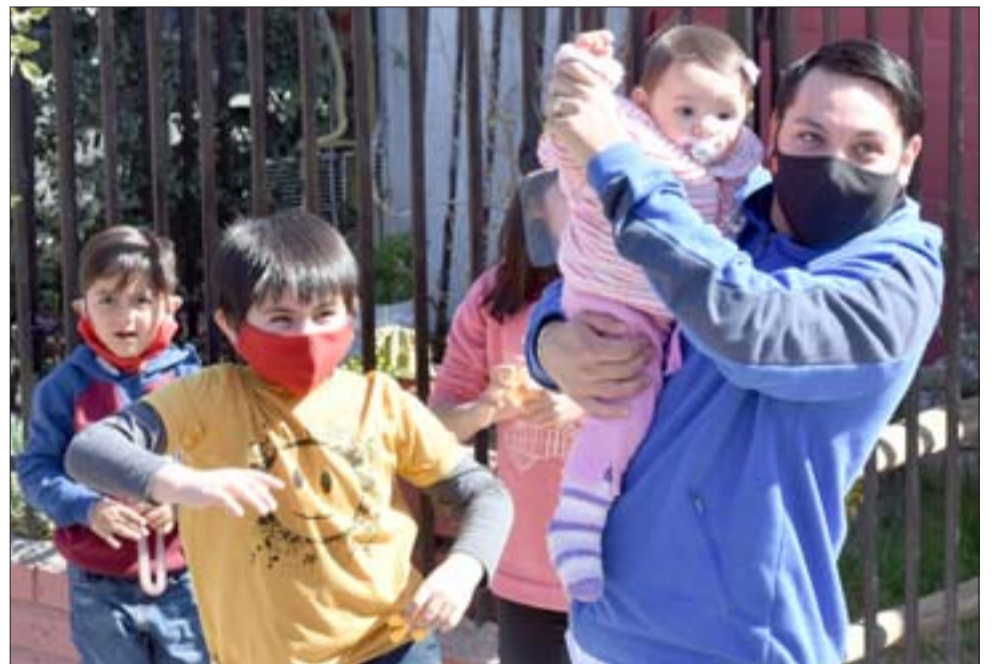
REGALONEADOS EN SU DÍA.- Así reaccionaron estos niños de Santa María, luego que su regalo llegó de manos de personal municipal.