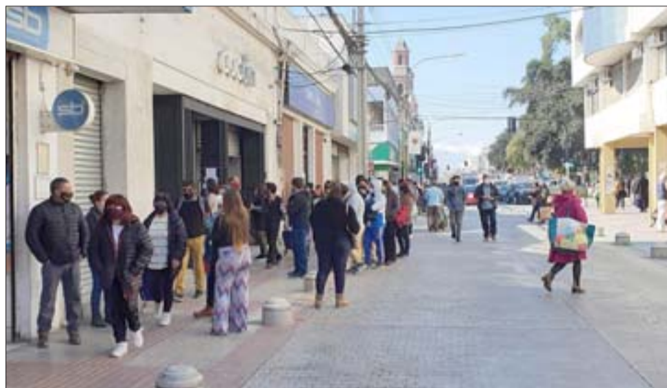
La aglomeración de personas en las calles del centro de la ciudad motivaron la determinación de cerrarlas al uso vehicular.