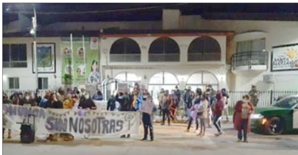
De noche y frente a la Municipalidad de Santa María también se manifestaron.