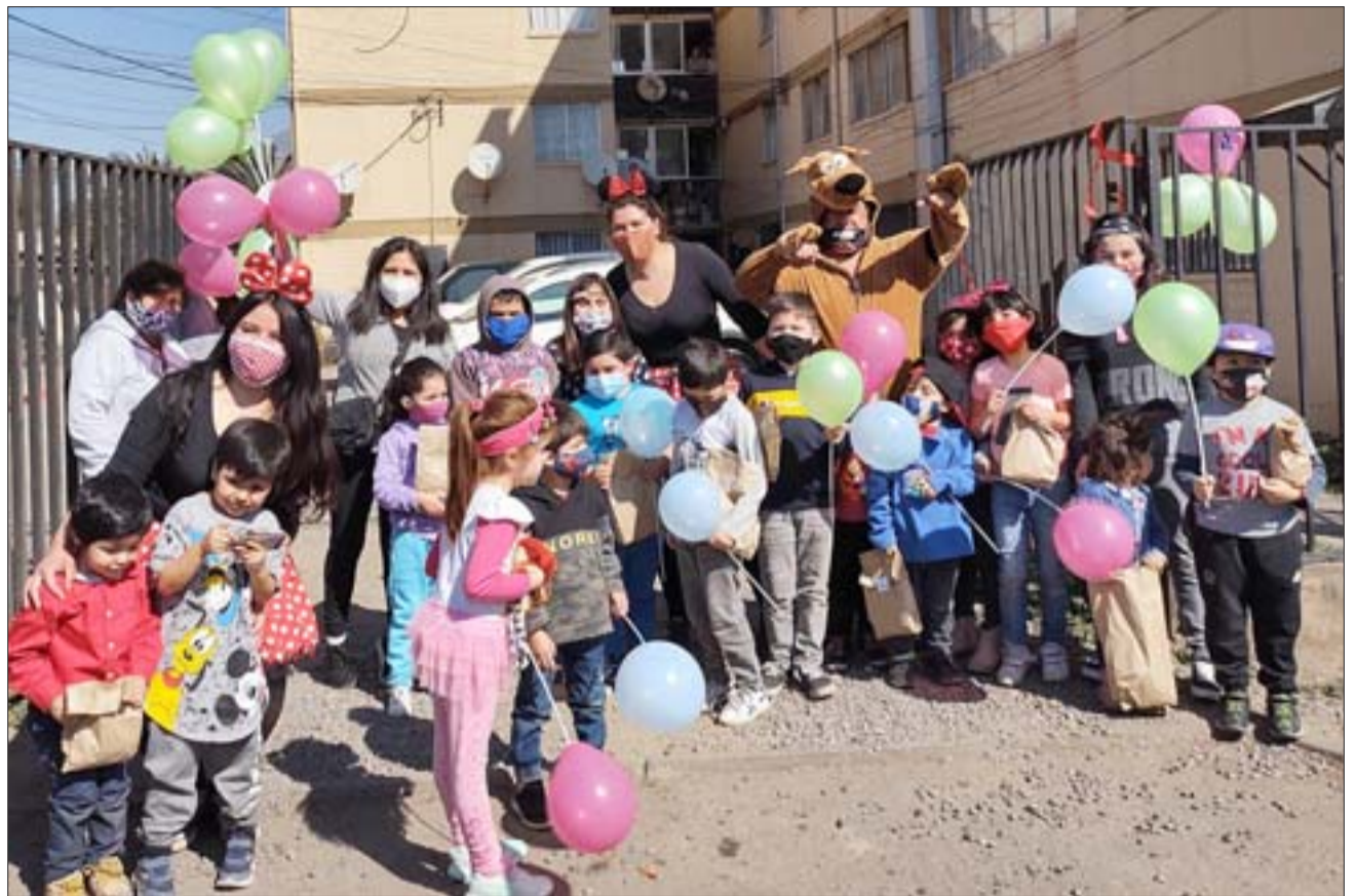
FELICES NUESTROS NIÑOS.- Esta gráfica refleja claramente la alegría que vivieron los niños y vecinos de Departamentos Sargento Aldea en este Día del Niño.