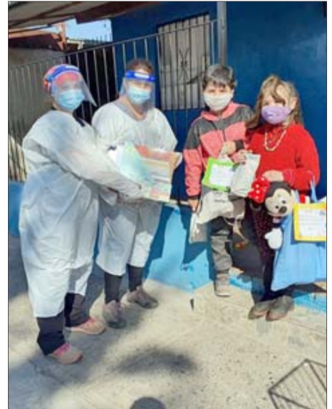
En total fueron once niños, de distintas nacionalidades y de diversos sectores de San Felipe, quienes recibieron estos presentes entregados con todas las medidas de seguridad para evitar los contagios.

Junto con esta acción, también han levantado otras iniciativas, como talleres online o la habilitación de un número de Whatsapp para resolver dudas y consultas de la comunidad +56 9 5959 0101.