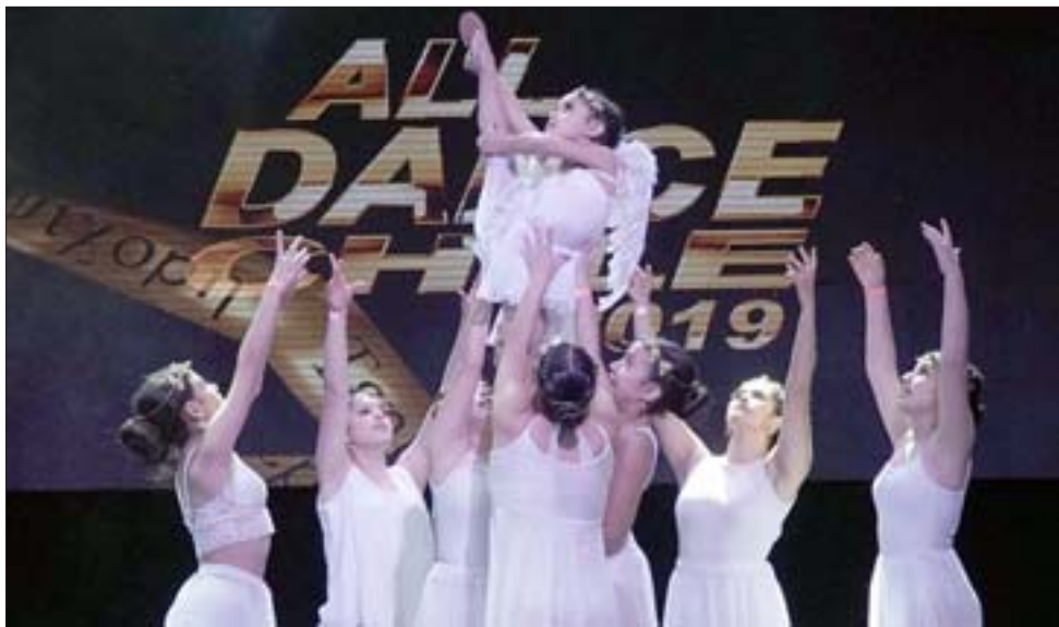
EN LAS GRANDES LIGAS.- Las más chiquititas también han brillado a nivel mundial en esta travesía de fantasía y talento.