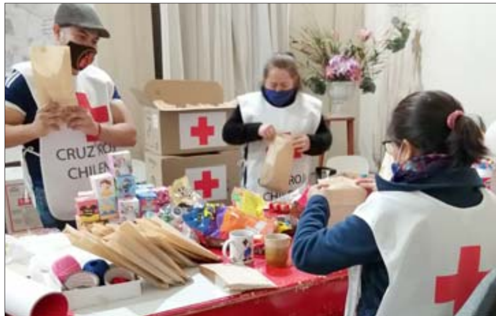
MUCHO TRABAJO. - Los voluntarios dedican horas para empacar y seleccionar la mercadería y asignarlas en las ya esperadas Cajas de Amor.