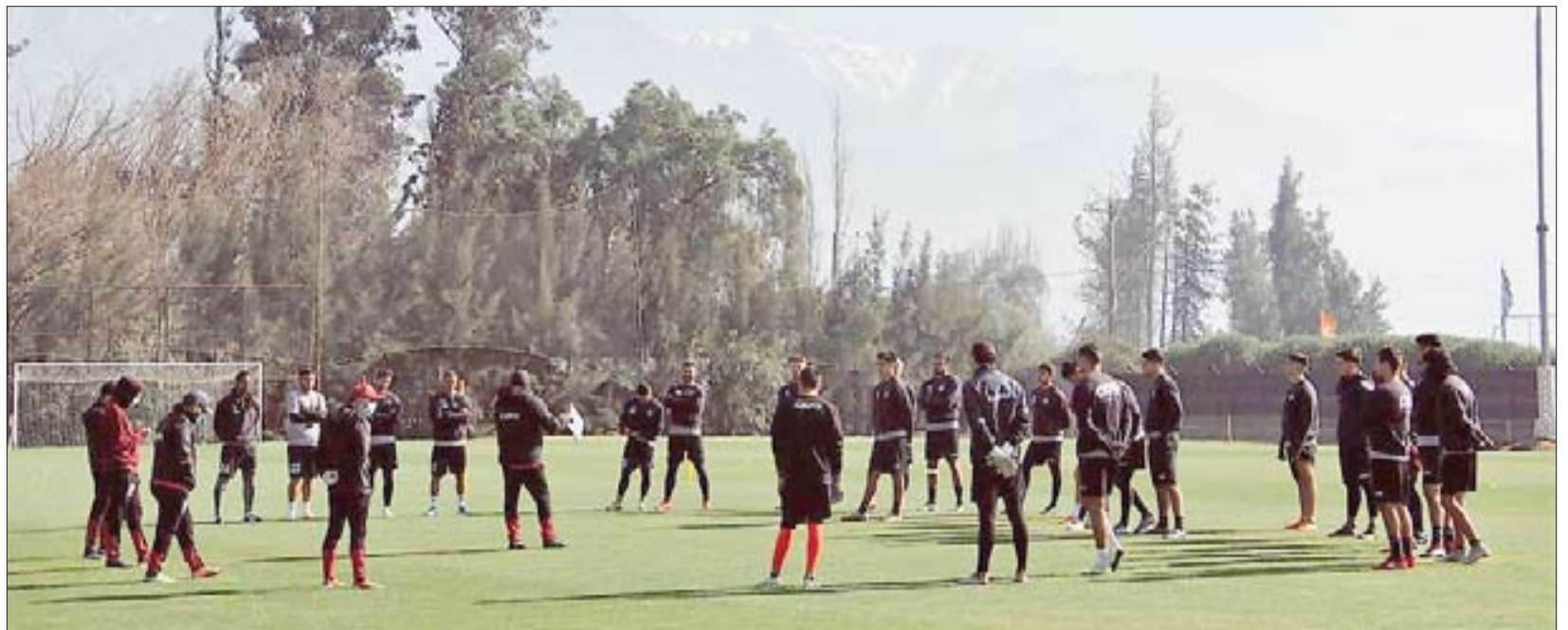
La escuadra albirroja quedará libre en la fecha que marcará el reinicio de la competencia de plata del balompié profesional chileno.