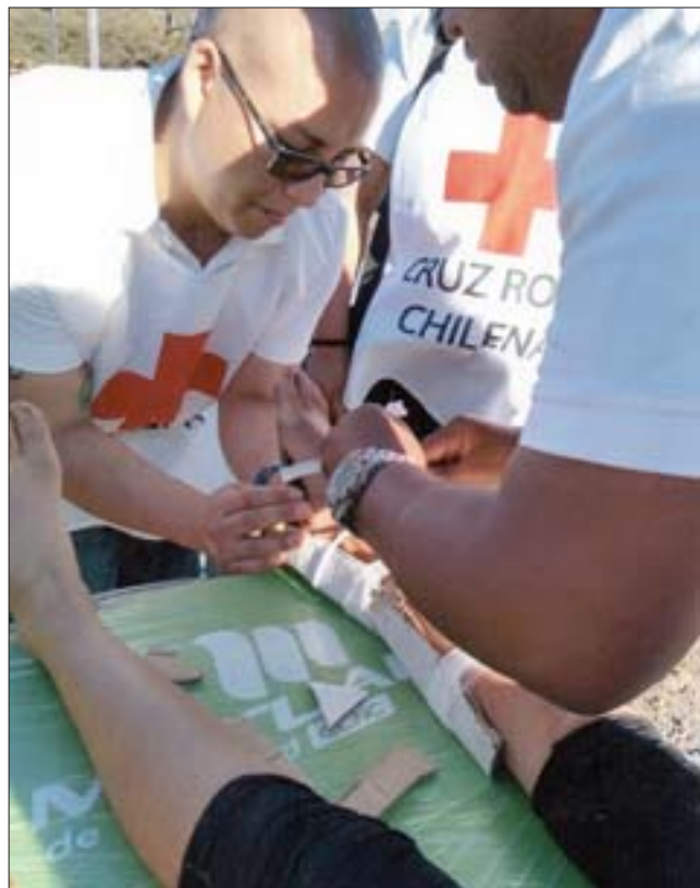
ÚNETE A LA CRUZ ROJA. - Aquí tenemos sólo a varios de los profesionales sanfelipeños que hacen posible esta noble labor, en este caso haciendo una curación durante las protestas de 2019.