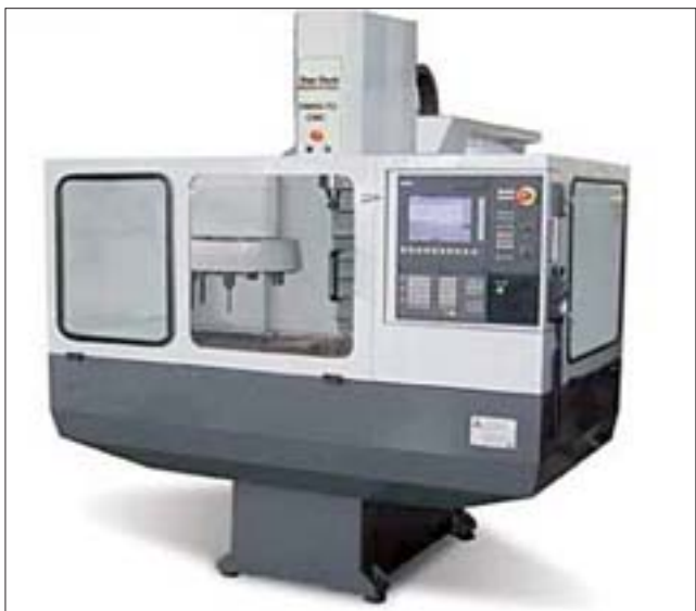
CENTRO MECANIZADO.- Este equipo mide un 1.60 cms. de largo por 1.45 de ancho y 2.5 de alto, permitirá enseñar a los estudiantes los nuevos procesos de fabricación de piezas vigentes hoy en la producción, con posibilidades de simularlos antes de proceder a elaborar las piezas reales.