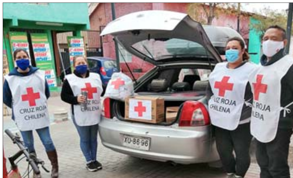
CAJAS DE AMOR. - La Cruz Roja de San Felipe y gracias a su Voluntariado con el apoyo de los sanfelipeños, están llegando con amor y mercadería a todos los rincones posibles de nuestra comuna.