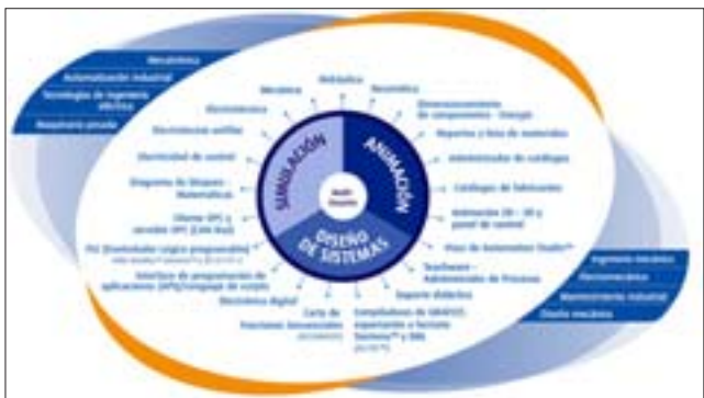
UN CENTRO CIENTÍFICO.- Con este listado de especialidades son las que se pueden interactuar con este centro mecanizado.