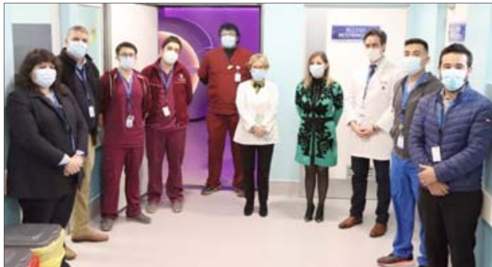
Autoridades de la provincia visitaron las nuevas y modernas dependencias ubicadas en el Hospital San Camilo, en donde pudieron conocer las prestaciones y los beneficios que conlleva el resonador magnético.

realizado 120 exámenes entre pacientes hospitalizados, lista de espera, urgencias y pacientes GES, con óptimos resultados, logrando atender entre 8 y 10 pacientes diarios.