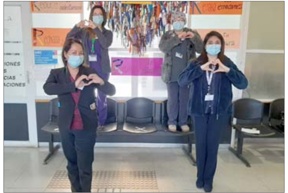
El equipo del Cesfam San Felipe El Real llamó a los usuarios a mantener los cuidados y los controles en lo referente a las enfermedades cardiovasculares, especialmente en el momento en que conmemora el Mes del Corazón.

La directora del Cesfam insistió en que las personas mantengan vigentes sus controles y prevengan enfermedades. « Por lo tanto, in-