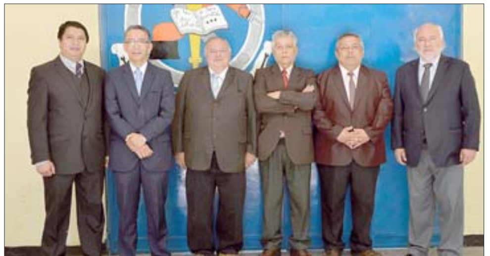
EQUIPO DOCENTE.- Ellos conforman el equipo docente de la Escuela Industrial, quienes siguen trabajando para que los proyectos y avances de su escuela no se detengan.