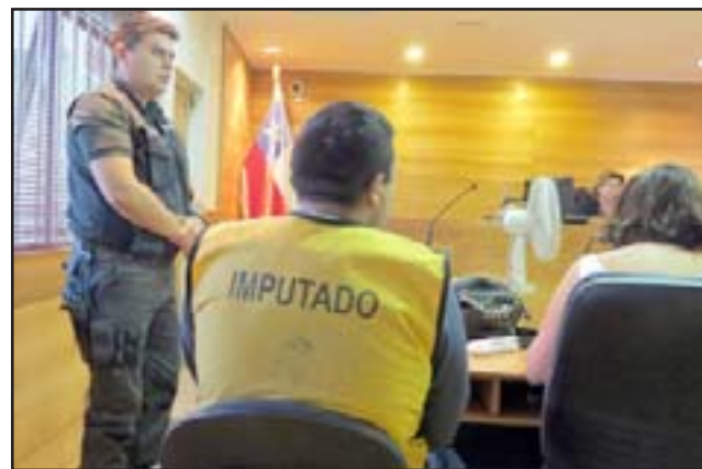
EXCARABINERA INVISIBLE.- Aquí vemos al chofer de ambulancias cuando aceptó un acuerdo reparatorio en marzo. Nunca cumplió.

Luego de ser traído al Juzgado de Garantía de Los Andes, se le requirió en procedimiento simplificado por el delito de Estafa y se fijó