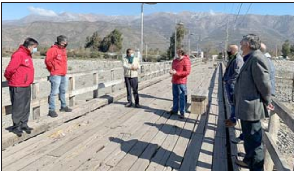
La DOH se comprometió a realizar estudios para apoyar a los emprendedores de la comuna y para utilizar de mejor manera el espacio público que colinda con el río Putaendo.

así utilizar de mejor forma el espacio público que colinda con el río Putaendo».