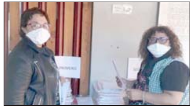
Desde marzo los docentes de la escuela apoyaron el proceso educativo de los estudiantes a través de la entrega de guías de trabajo.

«Hemos tenido muy buena disposición de los docentes, están 24/7 la verdad, conectados con sus estudiantes, y súper buenos comentarios de la implementación de las clases, porque los estudiantes se volvieron a ver las caras, por ejemplo en el segundo