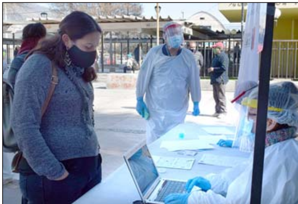
RESPUESTA RÁPIDA. - En total fueron 80 personas las que se vieron favorecidas con estas tomas de muestras Covid, los resultados estarán entre hoy miércoles y este jueves.