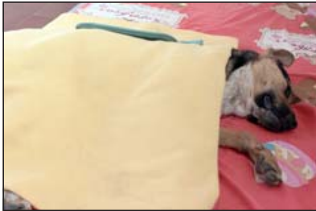
Este proyecto es financiado por el Programa de Tenencia Responsable de Animales de Compañía Mascota Protegida de la Subsecretaría de Desarrollo Regional (Subdere), con un costo de 11 millones de pesos.

inscribir en la misma veterinaria municipal, ubicada en calle Duco 1050.