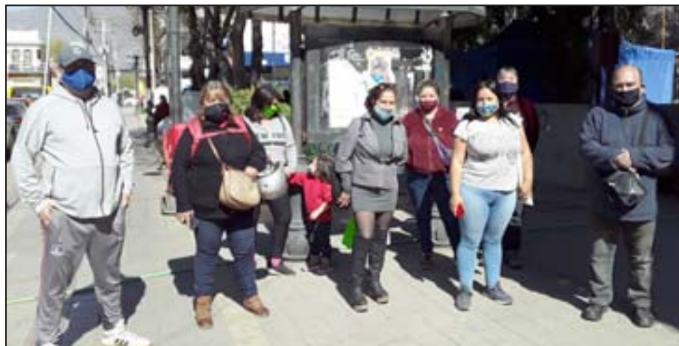
Los extrabajadores de parquímetros en las afueras de la municipalidad tratando de alcanzar una solución al problema.

Ayer llegaron a la municipalidad para ver si podían sostener una reunión en el departamento jurídico, pero todo fue en vano porque les dijeron que tenían audiencias pendientes: «No estaba así es que imagínate, estamos viniendo práctica-