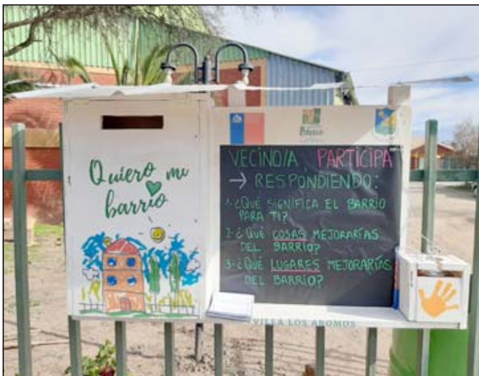
Este proceso participativo será permanente durante el año, con preguntas que mensualmente serán distintas.