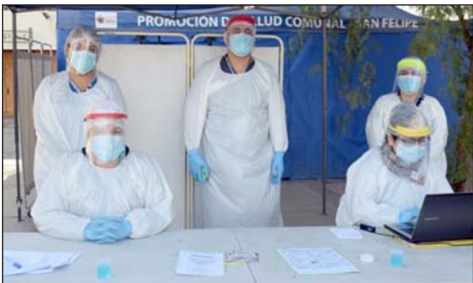
ELLOS AL FRENTE. - Aquí vemos al personal de Salud, minutos antes de iniciarse el operativo en la Plaza Cívica.