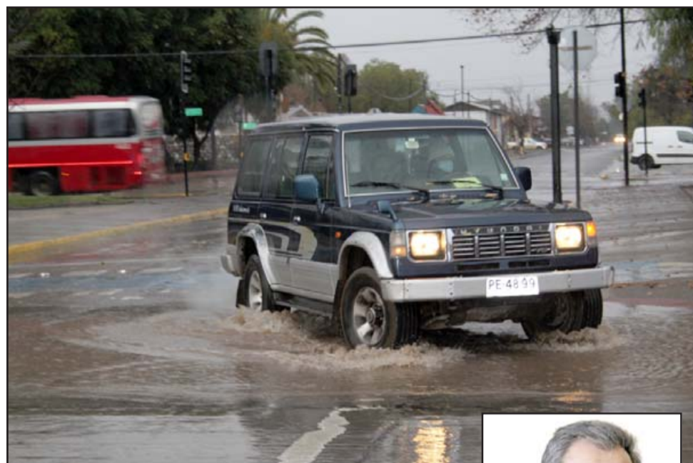
ADIÓS LLUVIAS. - Está apareciendo el Fenómeno de la Niña, que de mantenerse esta tendencia, al haber menor evaporación, habrá menos nubes y por consiguiente, menos esperanza de lluvia en los suelos aconcagüinos.

Nuestro colaborador nos recomienda esperar a que hasta fines de octubre y más allá aún, acumulemos