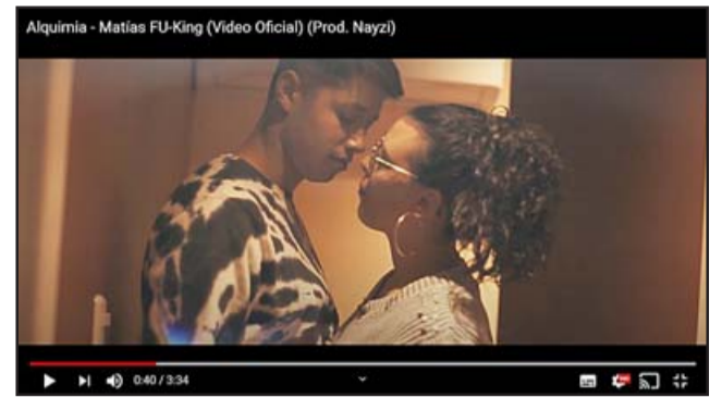
COMO LA ESPUMA. - El chico es apasionado en sus interpretaciones de video-clip, como los grandes artistas.