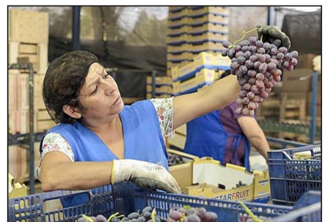
Los subsidios son de postulación permanente, en todo el año, para los trabajadores que perciban una renta bruta mensual inferior a $488.217.

Si la elección fue depósito el beneficiario recibió la transferencia este lunes 31 de agosto en su cuenta Banco Estado registrada. Si eligió pago en efectivo puede cobrar con su cédula de identidad vigente en sucursales del Banco Estado o Servi Estado. De acuerdo con la situación sanitaria se han tomado medidas con respecto al cobro de los pagos en efectivo (pago cash). El canal Caja Vecina estará habilitado para el cobro de los pagos en efectivo, sumándose a la red de cajas de Banco Estado y Servi