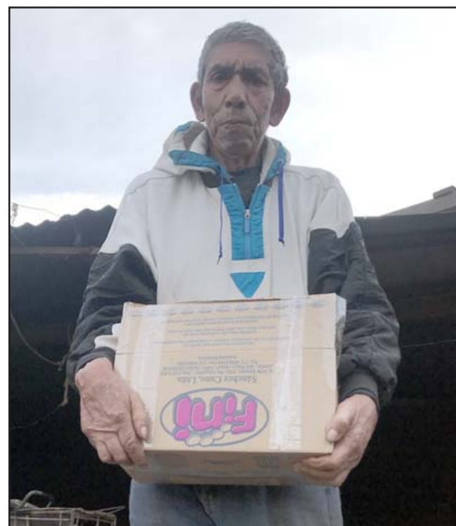
ELLOS AGRADECEN. - Para ayudar en este voluntariado, lo que se necesita es tener un corazón sensible y una mente abierta.

- En el último periodo y por motivo de pandemia van entregadas más de 500 cajas de alimentos, kit de útiles de aseo y vestuario. A futuro el objetivo es trabajar con la comunidad en situación de vulnerabilidad y asesorar a jóvenes de manera profesional, potenciando sus habilidades individuales e integrándolas socio laboralmente. Toda esta mercadería nos llega por donación de per-