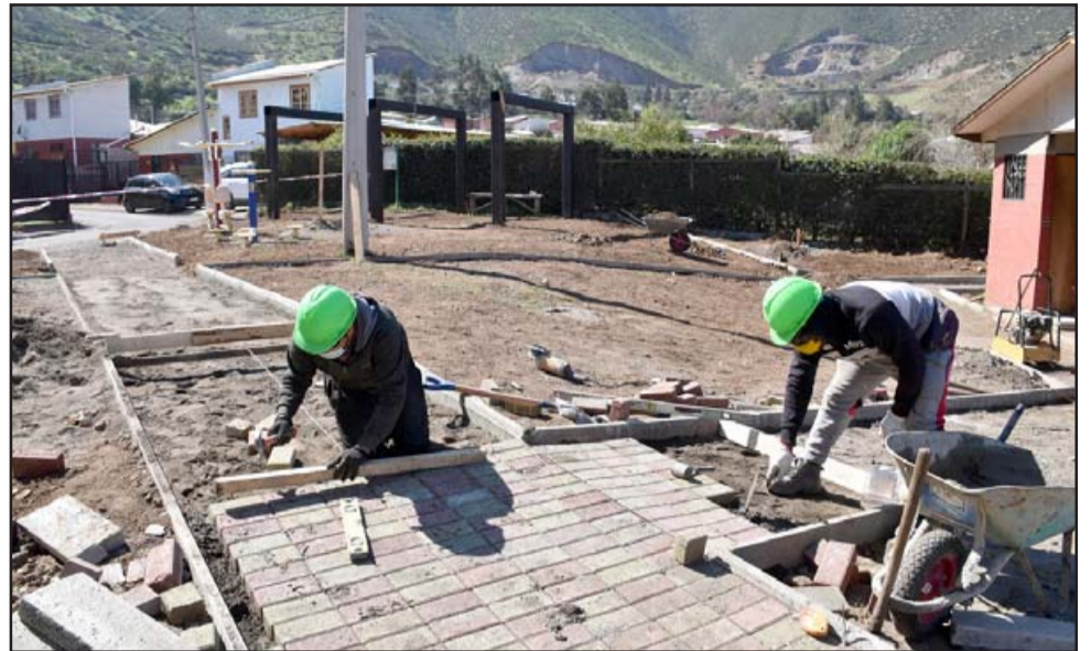
En total se invertirán cerca de 27 millones de pesos en la construcción de una Pérgola con estructura de acero, pavimentos de adoquín tipo dominó en los caminos principales complementado con maicillo y césped, como también la instalación de 6 luminarias públicas LED de 50w y 4 de 200w.

Las obras de construcción de esta nueva plaza comenzaron el 10 de agosto y avanzan según los plazos establecidos. Se espera que esté lista para mediados de octubre.