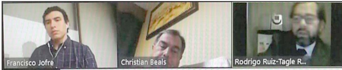
Los participantes en la audiencia de formalización realizada ayer en la mañana vía online.

- Es muy sospechoso porque faltaban tres meses para el término de diciem-