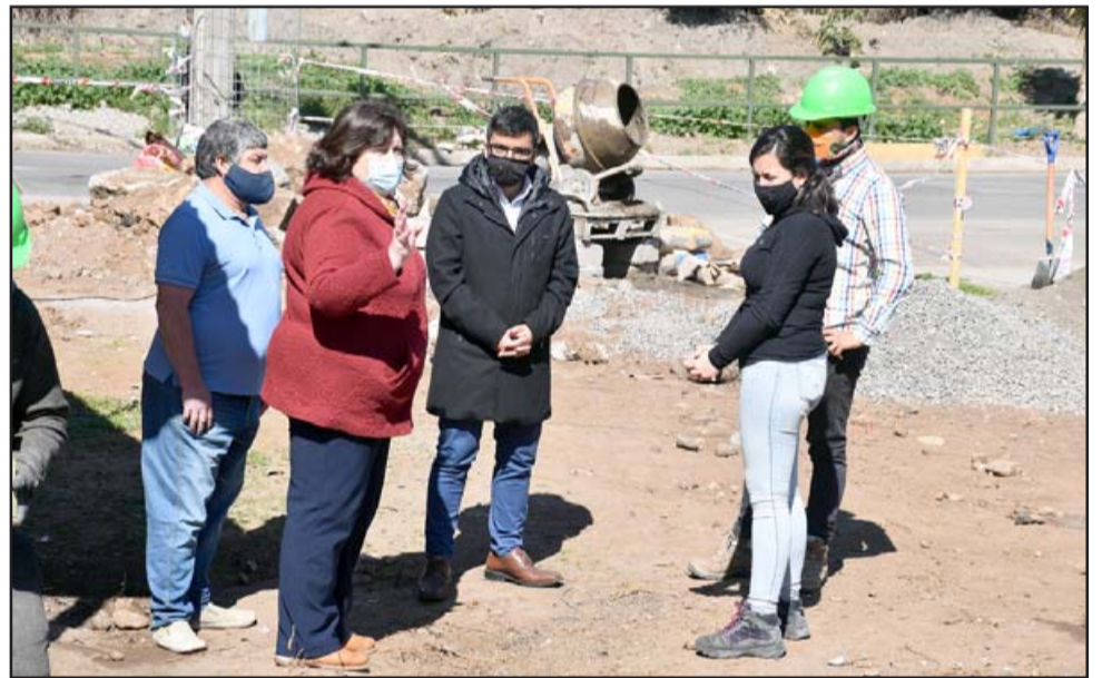
Tras un trabajo coordinado entre el municipio y los dirigentes vecinales, se logró diseñar una plaza para el sector, la que ya se está convirtiendo en realidad.