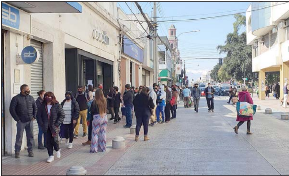
La medida mantiene la suspensión de tránsito, desde las 8 hasta las 15 horas, por calle Prat, entre Toro Mazote-Portus, Portus-Coimas, Salinas-Traslaviña; Salinas, entre Santo Domingo-Prat; y Coimas, entre Santo Domingo-Prat.