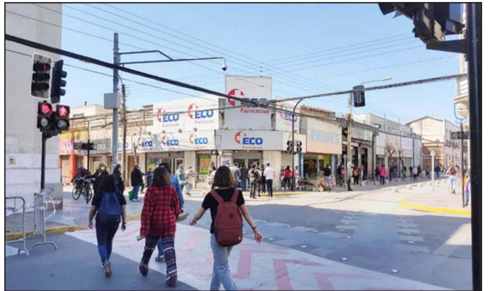
Continúa el cierre parcial de calle Prat, Coimas y Salinas, además de la ampliación de veredas en el perímetro que comprende la Plaza de Armas.