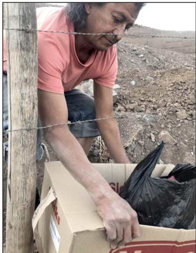
TIEMPO DE AYUDAR. - Cada vecino que vive en rucos, media aguas en sectores rurales de nuestra comuna, ya están recibiendo el abrazo amoroso de este voluntariado sanfelipeño.