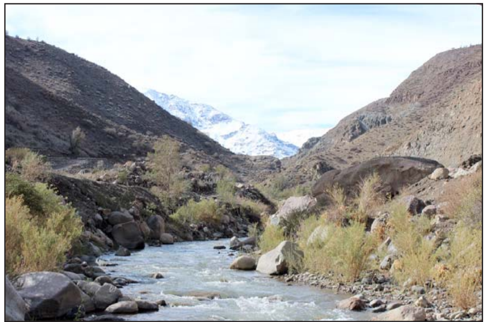
Las fuerzas vivas de la comuna se oponen a que la gran minería destruya el hermoso valle de Putaendo.

2. El Segundo Tribunal Ambiental (con sede en Santiago) declaró el sábado 29 de agosto de 2020, admisible la reclamación de ilegalidad presentada por los abogados contratados