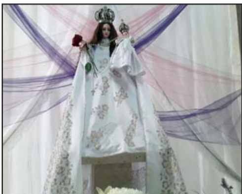
La imagen de la Virgen del Carmen presente en la Parroquia Andacollo.