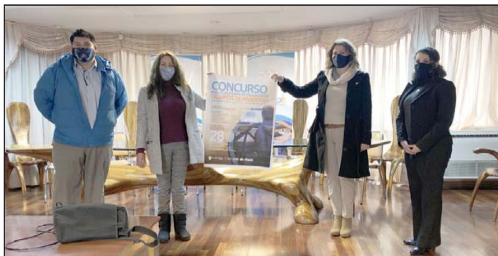
Las directoras y coordinadoras de la Red Comunal de Escuelas Urbanas realizaron la invitación para participar del concurso.