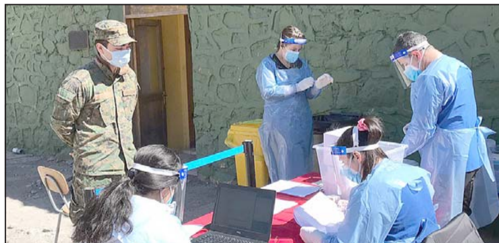
Los conscriptos fueron testeados por funcionarios de los Cesfam Cordillera Andina y Centenario en el Refugio Juncal del Ejército de Chile.

«Estos jóvenes van a permanecer catorce días en el refugio para darles un tiempo similar al de una cuarentena, pero además hemos decidido agregar seis días más que forman parte de su proceso formativo. Queremos agradecer la disposición de los equipos de salud y del Servicio de Salud Aconcagua por llegar hasta este lugar, que es bastante alejado. Son 146 nuevos integrantes, 116 varones, que estarán en este lugar y 30 damas que perma-