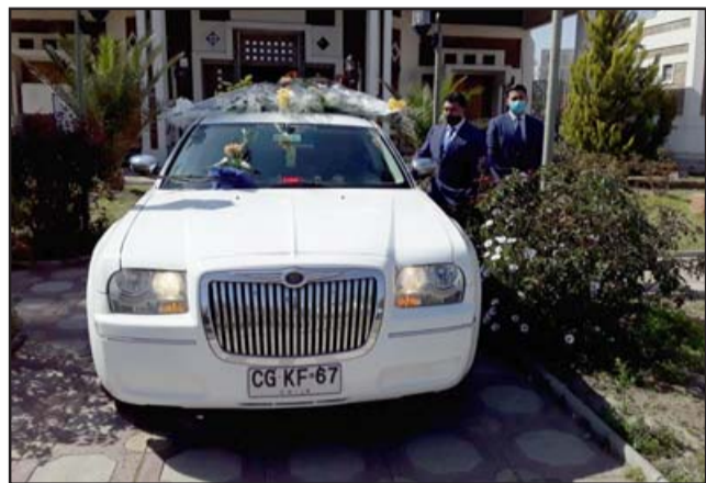
El carro de la pompa fúnebre a punto de salir de la parroquia Andacollo.