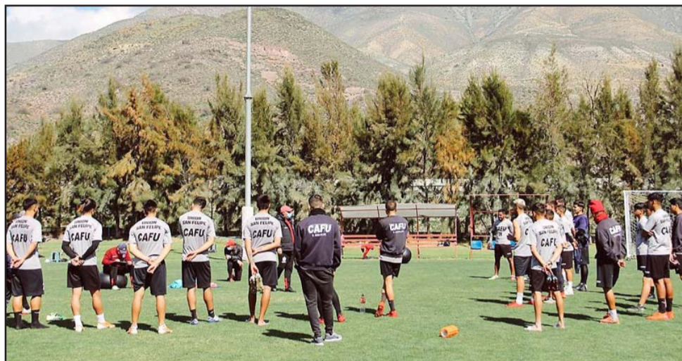
Tres partidos en nueve días deberá jugar Unión San Felipe.