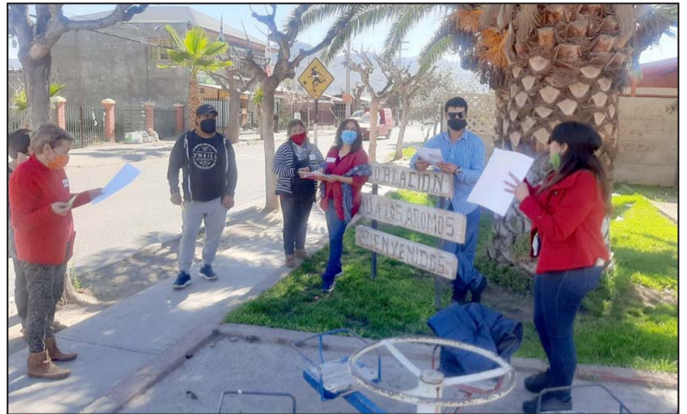
En total participaron 20 vecinos de las cuatro etapas de la Villa, los que se dividieron en dos grupos, 10 participaron en la mañana y 10 en la tarde, adoptando las medidas preventivas contra el Covid-19.

Todas estas actividades se realizan esperando que la obra se ejecute en el mes de mayo de 2021.