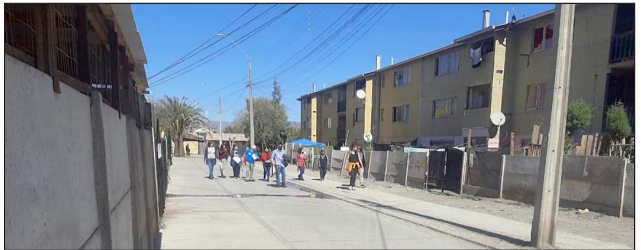
Con un 64% de las preferencias, el pasaje Los Abetos fue el lugar elegido por los vecinos que participaron votando para ejecutar la 'Obra de Confianza'.