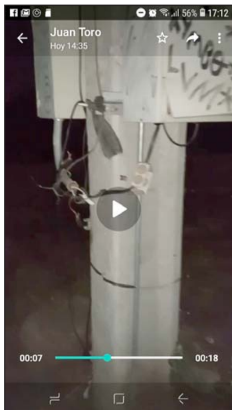
Cables cortados en el transformador.

casas llegó a eso de las 12:30 horas de ayer aproximadamente.