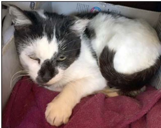
NECESITA UN HOGAR.- Ella es 'Michi', la gatita del grupo, un poco mal humorada pero pronto se le pasará.

Hay que tomar en cuenta que el mundo animalista y la lucha de algunos en beneficio de quienes no se pueden autovar para alimentarse y curar sus heridas callejeras, no se detiene. Hablamos en esta oportunidad de las agrupaciones que velan por el bienestar de nuestros hermanos menores, y puntualmente nos referimos a la Agrupación Cuatro Patas, de quien su tesorera habló este miércoles con Diario El Trabajo .