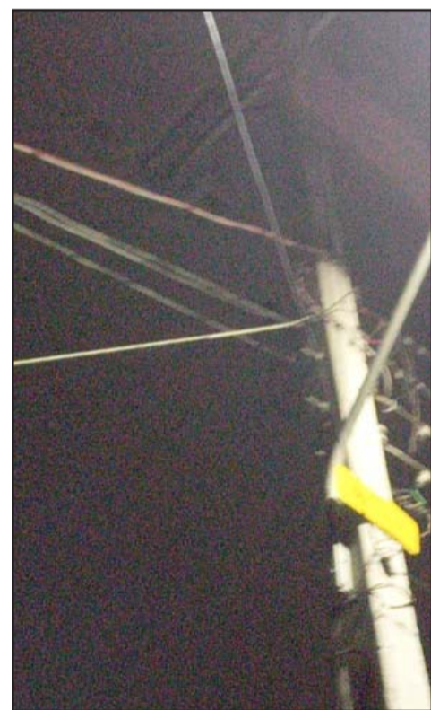
Uno de los cables que llevaba luz a las personas en toma.

casas llegó a eso de las 12:30 horas de ayer aproximadamente.