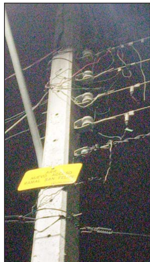
Acá se aprecia la gran cantidad de cables 'colgados' en el empalme.

Importante reiterar que la luz a esas 20