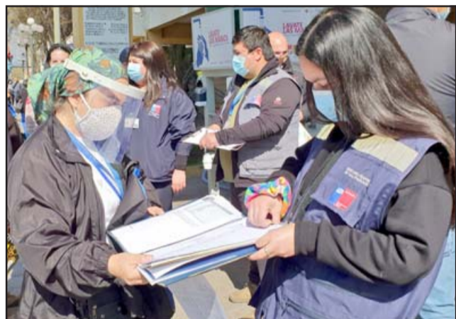
Autoridades de gobierno y municipales iniciaron un fuerte trabajo territorial para mantener el cierre de calles y apoyar al sector gastronómico y de comercio en general.