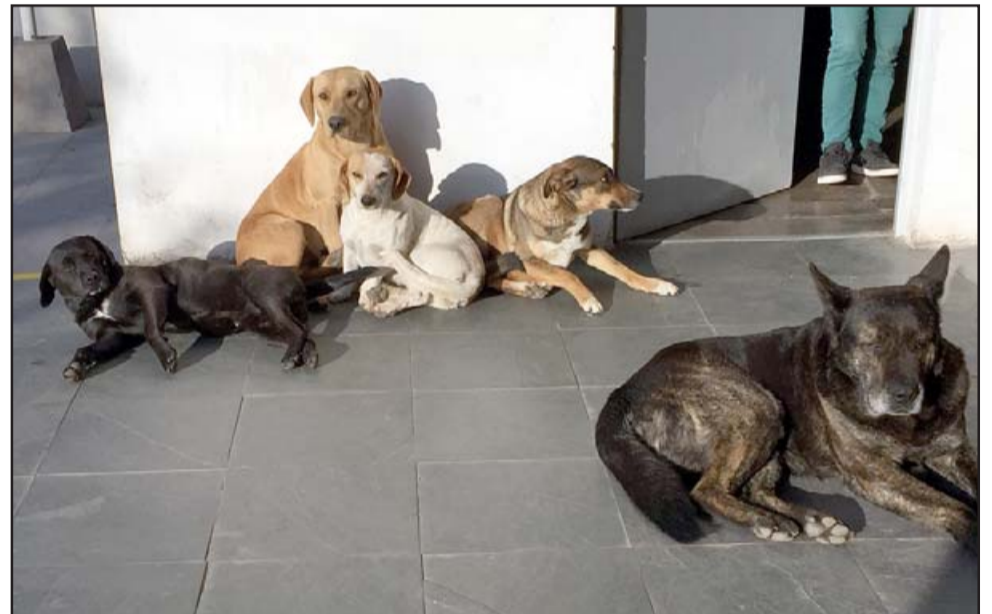
SON MUY PUNTUALES.- En esta gráfica tenemos a los tremendos callejeros esperando su desayuno como lo hacen todos los días.