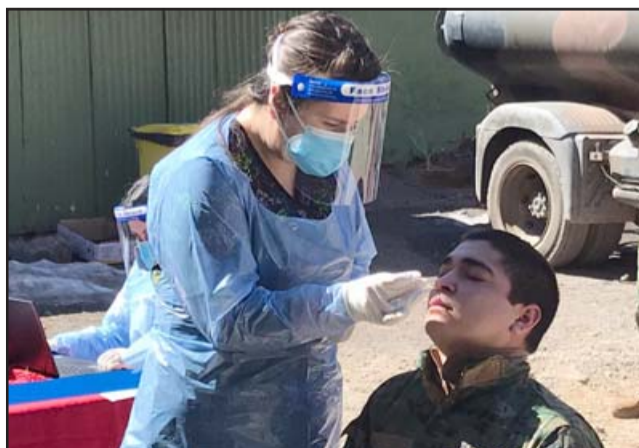
Los jóvenes fueron sometidos al examen preventivo con el fin de asegurar que no estén contagiados con el Covid-19.

que se integran al Servicio Militar. Así como hemos recibido el apoyo de ellos en diferentes actividades como la entrega de medicamentos, alimentos y otras acciones, también nos corresponde testear este grupo de riesgo», destacó la profesional, quien agregó que la búsqueda activa se mantendrá en todo el Valle de Aconcagua enfocándose en las tres áreas de la estrategia TTA.