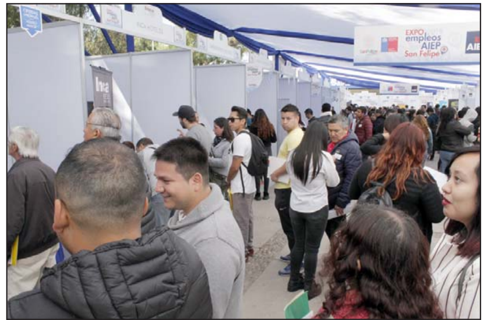
VIENE LA EXPO. - Durante una década AIEP ha realizado estas Expo Empleos en toda la V Región, este año la versión se hará virtual.

- Sí. Hoy, más que nunca la capacitación, reinversión laboral y la empleabi-