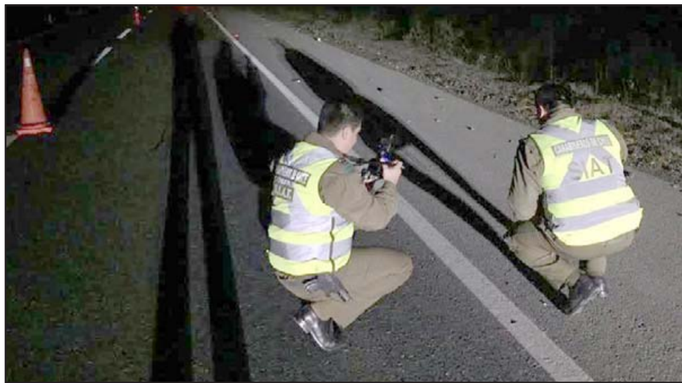
Funcionarios del SIAT de Carabineros investigan las causas reales de esta tragedia en carretera.