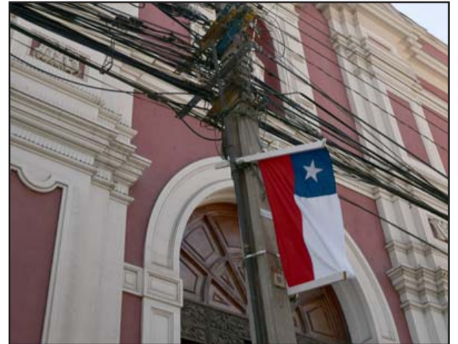
PERO PASAMOS AGOSTO. - Así de triste, a Catedral cerrada, luce esta banderita tricolor en los sucios postes de nuestra ciudad.

Te invitamos a seguir estas recomendaciones para prevenir eventuales contagios del COVID-19