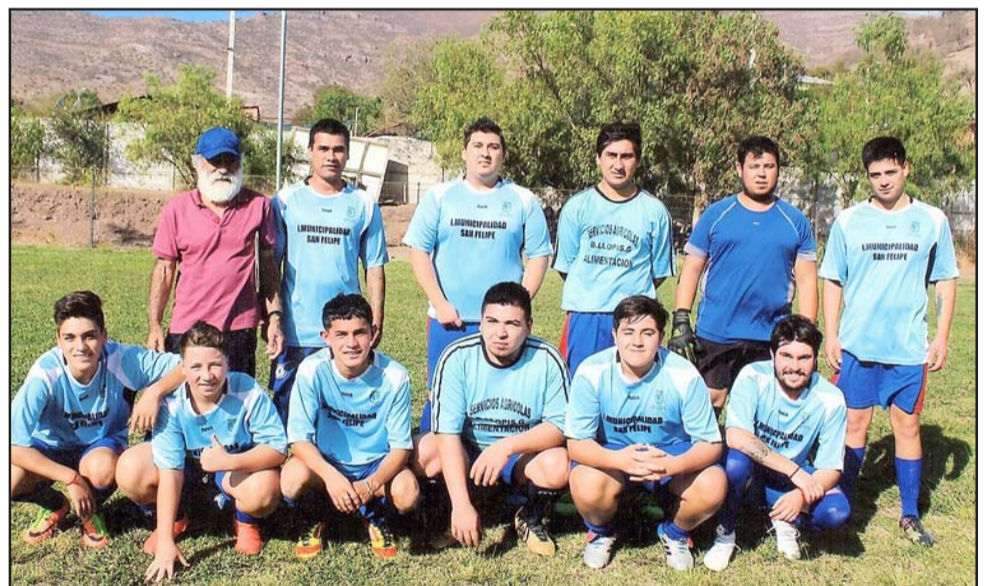
SANGRE JOVEN.- Ellos son los jóvenes del Club, siempre listos para enfrentar los retos en la cancha.