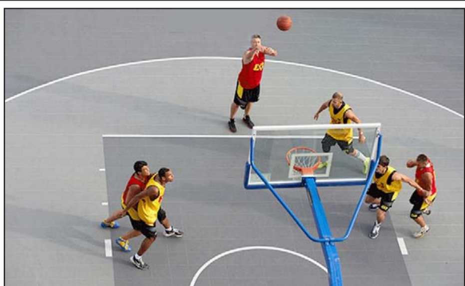
El retorno del básquetbol local se produciría en una primera instancia en un torneo modalidad 3 x 3 (foto referencial).