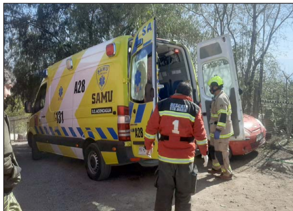
Personal del SAMU y Bomberos de Santa María con la persona herida al interior de la ambulancia..