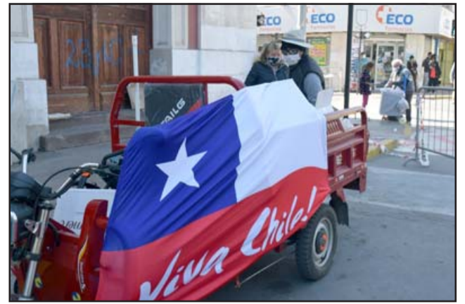
EN EL CORAZÓN. - Este comerciante sanfelipeño en cambio, ya adornó su carrito con nuestra Bandera Patria, pues la fiesta se lleva en el corazón. ¿Y tú, cómo vivirás las Fiestas Patrias?