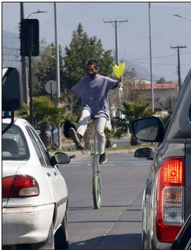
SIN PICARDÍA. - Las cámaras de Diario El Trabajo captaron a este 'malabarista' improvisado en el semáforo del Hospital San Camilo, la mañana de este jueves.

Llegaron las Fiestas Patrias, ya instalaron las banderas y los malabaristas urbanos se tomaron los cruces de semáforos, de lo que no estamos seguros es de si tendremos cueca, chicha en cacho y peñas en la comuna, pues la crisis sanitaria sigue aún como si fuera mayo.