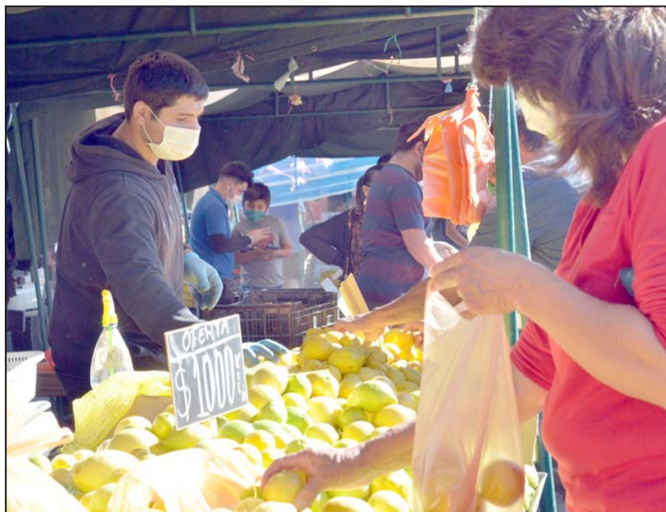
Desde hace ya dos semanas está funcionando la Feria Diego de Almagro solo en chacarería, situación que cambia este domingo cuando se incorporen los puestos de bazar y paquetería.

«El llamado que hacemos a las vecinas y vecinos es que aquellos que vayan a concurrir a realizar sus compras, no lo tomen como un paseo, tienen que mantener las medidas de autocuidado necesarias, con el propósito de no retroceder a la Fase 2 ó 1, lo que significaría suspender la feria nuevamente», comentó.