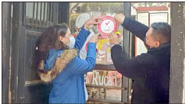
El conocido restaurante 'La Ruca' ya cuenta con su certificación de 'Confianza turística' que acredita que cumple con los protocolos sanitarios para abrir parcialmente su local.

Restaurante La Ruca, Ricardo Figueroa , indicó que este sello es de mucho valor para entregar confianza a los clientes: «Se abre una ventana de esperanza para volver a trabajar, todo con el apoyo de Sernatur y el municipio».