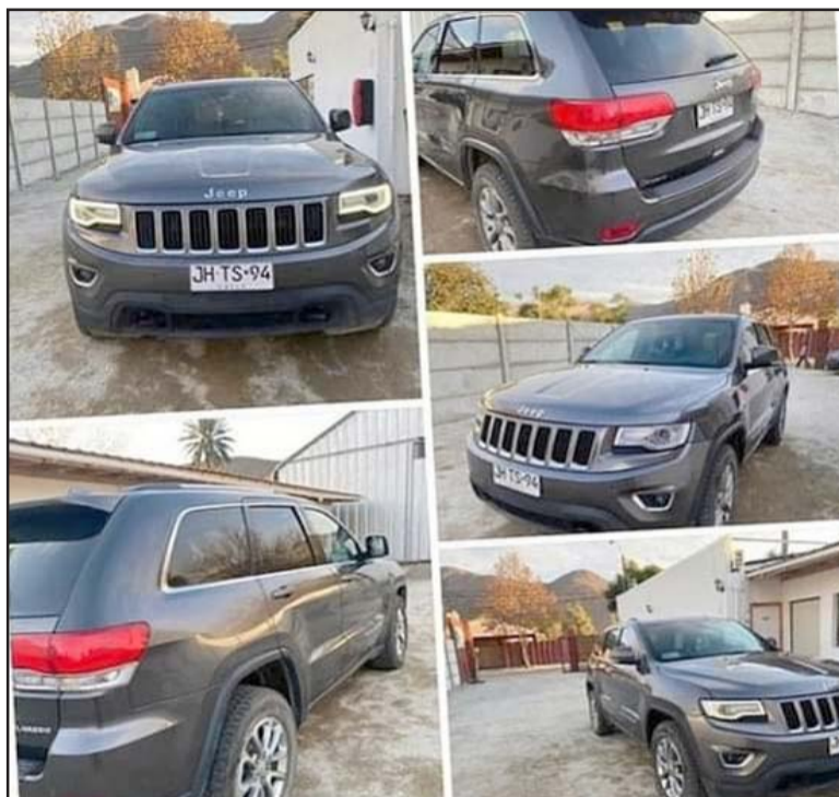
Este es el Jeep que en cuestión de minutos fue robado a una empresaria de Putaendo.

Comentó la afectada que hizo la denuncia correspondiente, no habiendo resultados positivos al respecto tras la búsqueda realiza-