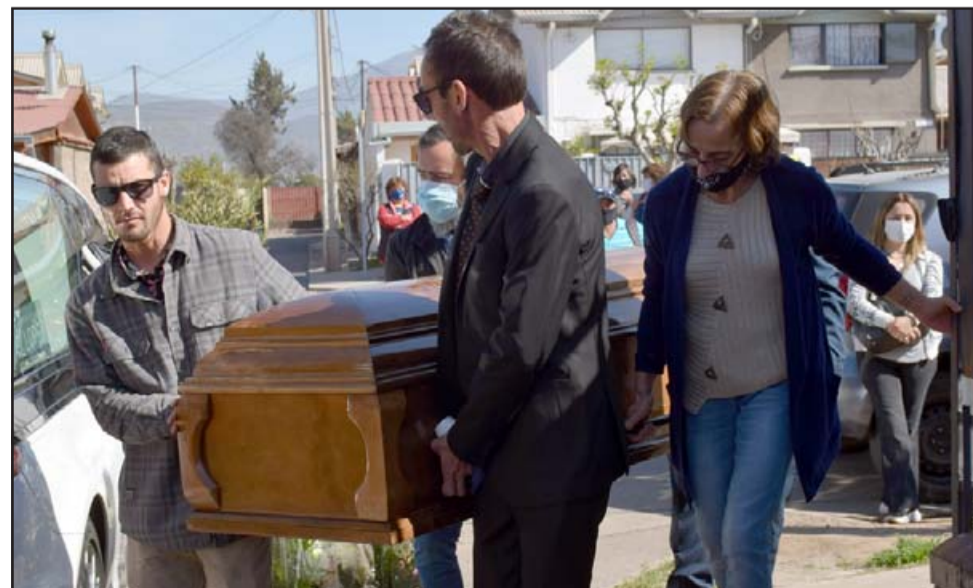
SERÁ CREMADA.- Sus restos mortales fueron trasladados este lunes hasta Santiago, donde será cremada en pocos días.