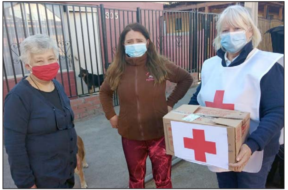
SIGAMOS DONANDO. - A muchos lugares y familias llega la ayuda en mercadería y mascarillas que nuestros lectores donan a la Cruz Roja.