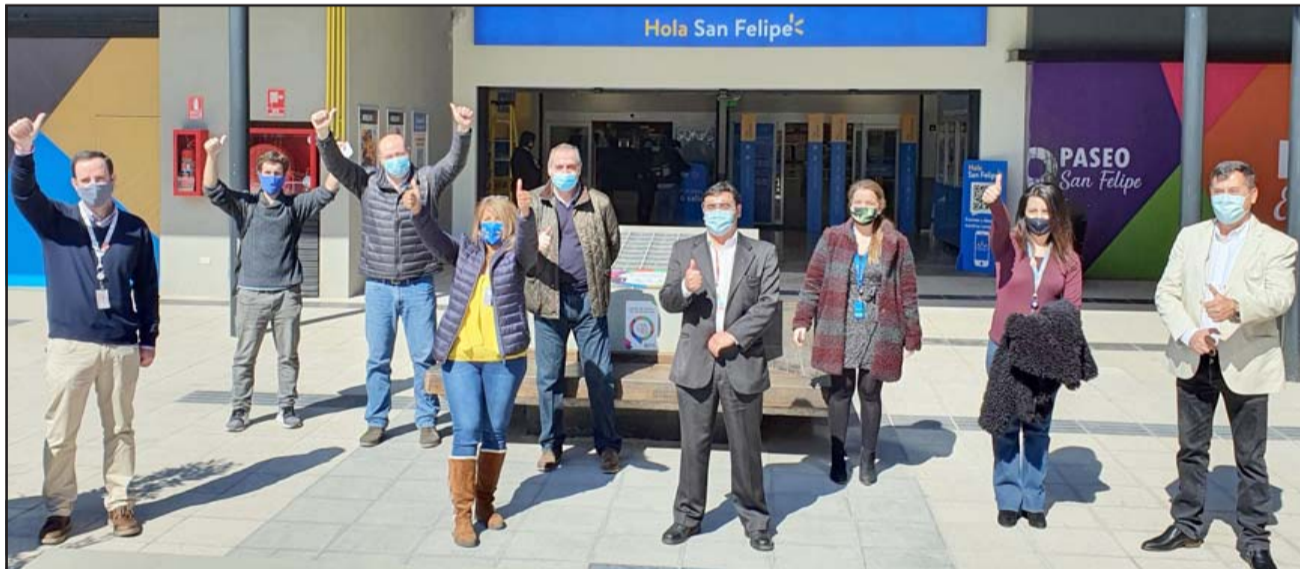
HOY ABREN AL PÚBLICO.- Personal del gigante comercial y la primera autoridad comunal posan en los exteriores del enorme local.