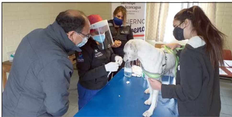
Un total de 1.986 mascotas se espera puedan ser identificadas a través del Programa Veterinario en Terreno en las comunas de la provincia de San Felipe.