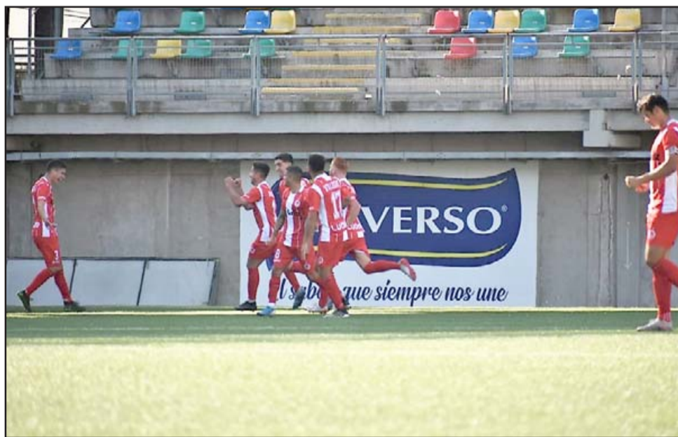
El cuadro aconcaiguino llega al partido de hoy antecedido de un sólido triunfo ante Melipilla.