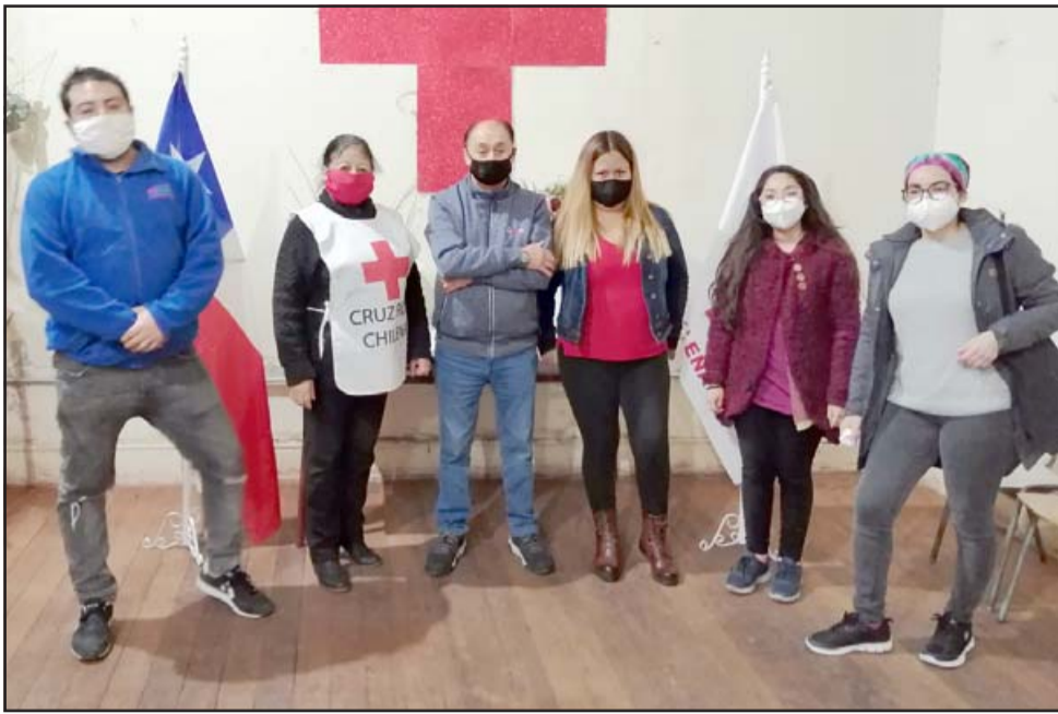
GRANDES COLABORADORES. - Óptica Remet es una colaboradora de la filial de la Cruz Roja desde hace 7 años, aquí los vemos codo a codo con los voluntarios.