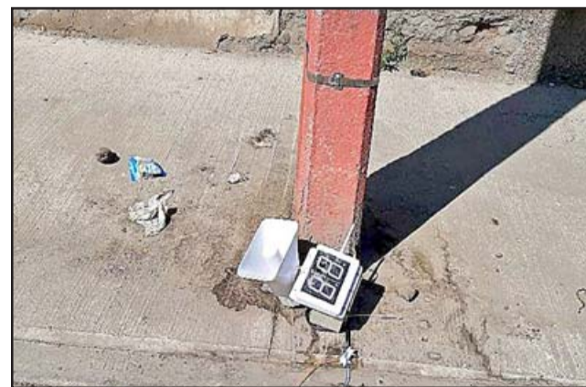
Pesar provocó el acto de vandalismo que afectó a una de estas centrales de monitoreo, las cuales son de bastante utilidad para la comunidad.