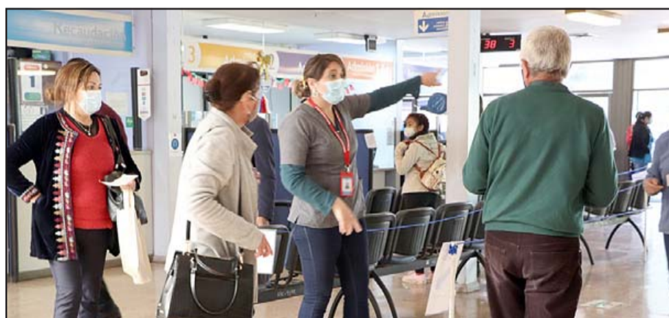
Este lunes 14 de septiembre, con la reapertura de los policlínicos de atención de especialidades, se dio inicio a la 'operación retorno' para volver a atender a los usuarios.

más una sala de espera al exterior del establecimiento para evitar aglomeraciones.