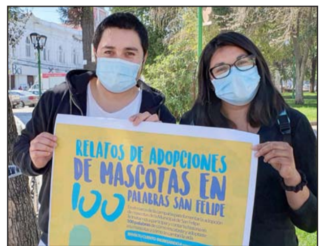
El plazo para presentar los relatos vence el 30 de septiembre; luego todos los escritos que lleguen se publicarán en las redes sociales, desde el 1 y hasta el 13 de octubre; mientras que la premiación y publicación se efectuará el 16 de octubre.

Todos los relatos quedarán plasmados de forma digital y definitiva en un libro en PDF 'Relatos de adopciones de mascotas en 100 pa-