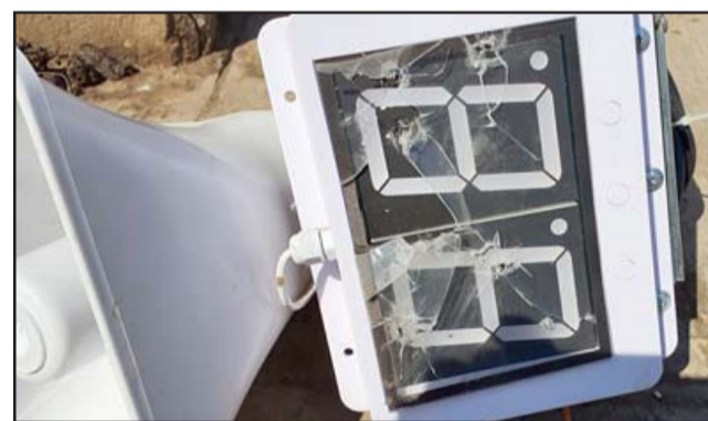
Desconocidos destruyeron una central de monitoreo del programa Alarmas Comunitarias que se implementó en la comuna.