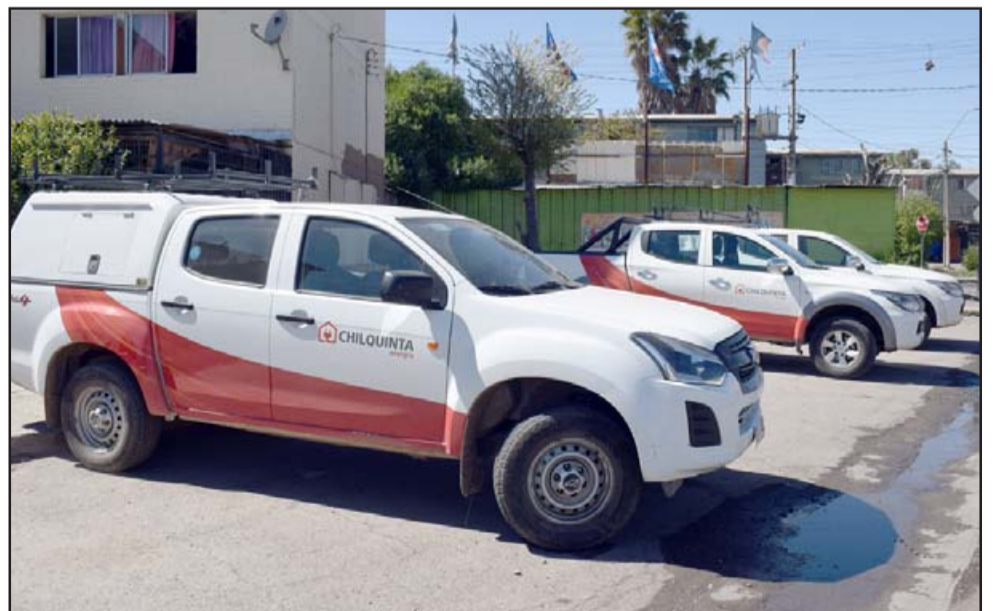
EN TERRENO.- Varias brigadas de trabajo de la empresa Chilquinta trabajaron este lunes en estas poblaciones para reparar el daño.