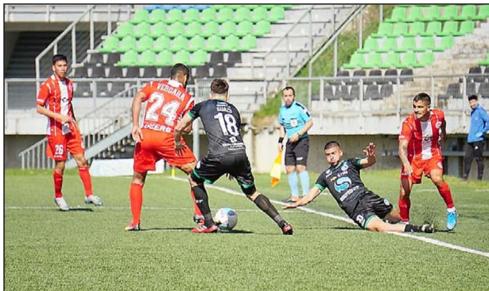
Los sanfelipeños llegan a la nueva fecha tras caer por la cuenta mínima ante Puerto Montt.