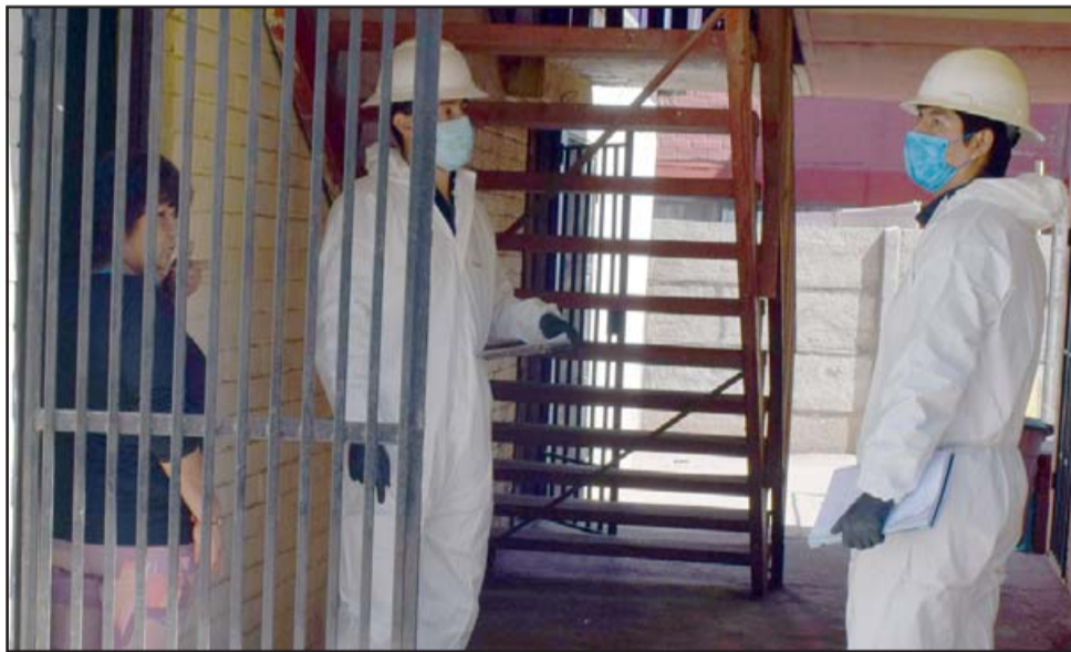
ELABORAN CATASTRO.- Funcionarios a contrata de Chilquinta visitaron casa por casa para crear un catastro de daños en el vecindario.

https://www.chilquinta.cl/hurto-energia , mediante el cual es posible realizar denuncias, incluso de manera anónima o bien llamando a los teléfonos 800362586 y 229389901 . Roberto González Short