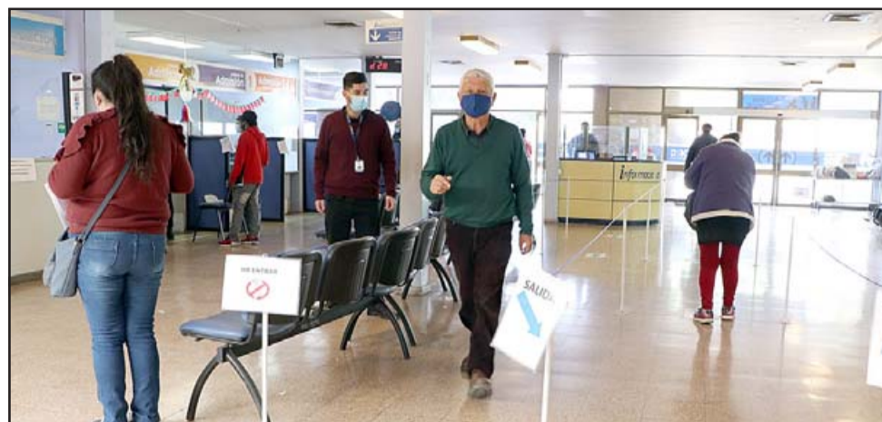
Se han dispuesto nuevos flujos de entrada y salida e indicaciones de distanciamiento, promoviendo además una sala de espera al exterior del establecimiento para evitar aglomeraciones.

Se han dispuesto también nuevos flujos de entrada y salida e indicaciones de distanciamiento, promoviendo ade-