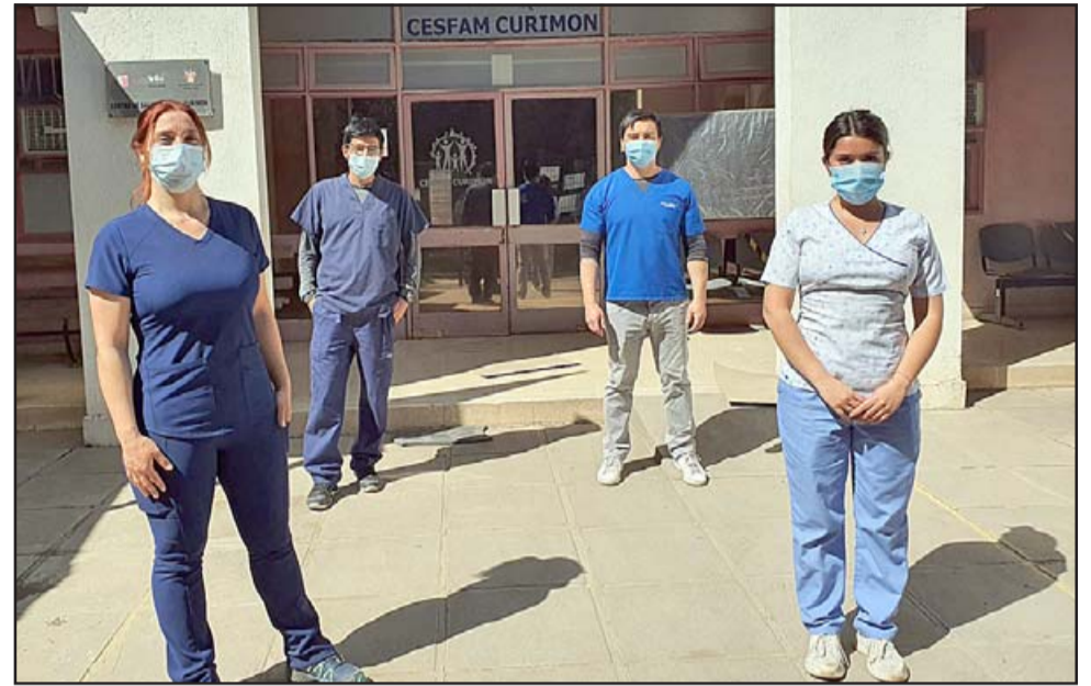
Este programa cuenta con un equipo compuesto por un médico, una enfermera, una técnica en enfermería y un kinesiólogo.

Para ello, las visitas de los profesionales se realizan diariamente, donde además de las atenciones, también hay un proceso de educación para los pacientes y sus