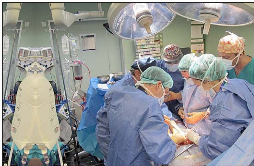
EN LISTA PARA TRASPLANTE.- Sólo un trasplante de médula será lo que le permita a este niño salir adelante. (Referencial)