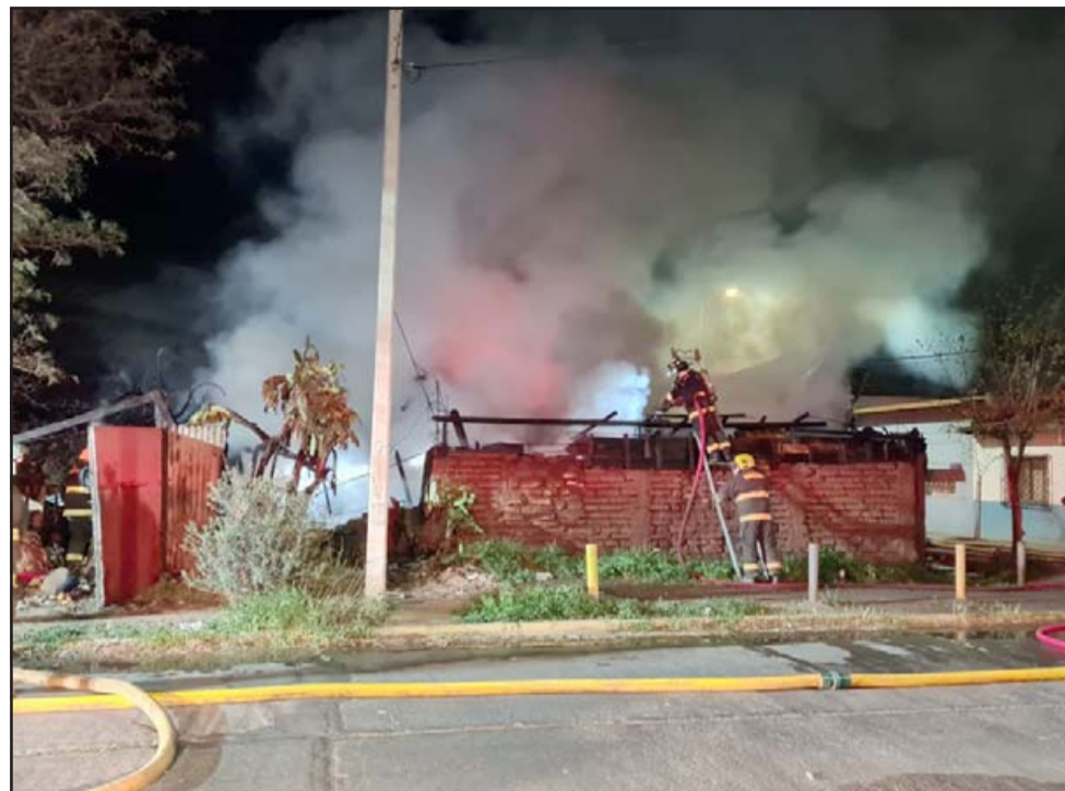
Bomberos en plena faena para controlar incendio en calle Ana Galindo con Viterbo Tapia.

Otro tipo de gas que está afectando mucho y por el aumento de las temperaturas, es el que sale de los alcantarillados. Al respecto dijo que hacían los monito-