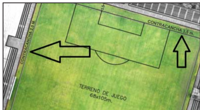
AMPLIA CONTRACANCHA.- Ambas flechas señalan los espacios de contracancha, hablamos de 2.0 metros en las líneas de los marcos, y 3,5 metros en los laterales.