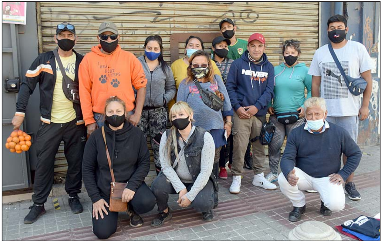
AMBULANTES UNIDOS. - Ellos son parte del gremio informal de vendedores ambulantes del damero central de San Felipe, quienes se han unido para luchar por su derecho a trabajar de manera regulada.

- Estamos hablando de las calles Prat y Santo Domingo, esas son las que en el Municipio ya estamos solicitando o creo que son las que nos podrían asignar, sin embargo la que nos conviene es este boulevard de Prat,