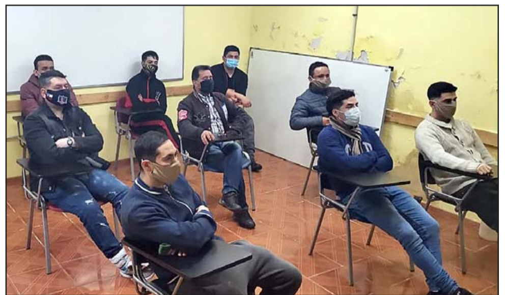
Estas charlas tienen una duración aproximada de una hora y en ella se tratan temáticas relativas al Covid-19 y el autocuidado.

El profesional agregó que más adelante «queremos