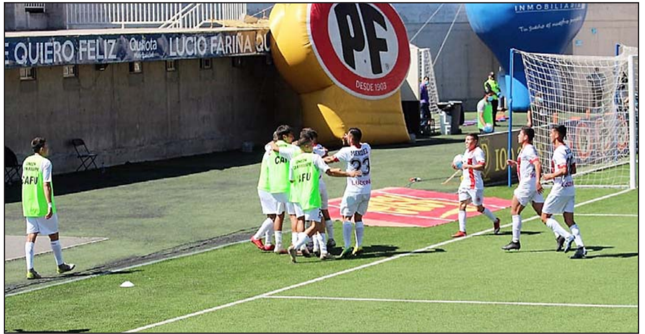
El equipo albirrojo festejando uno de los goles del triunfo sobre San Luis.

El empate trajo calma en las huestes sanfelipeñas, pero eso no cambiaba la forma en que se desarrollaba el encuentro al no haber ma-