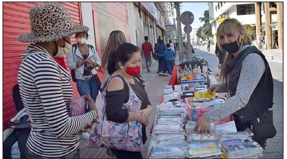
COMERCIO INFORMAL. - Las cámaras de Diario El Trabajo registraron estas imágenes la mañana del sábado en el boulevard de calle Prat.