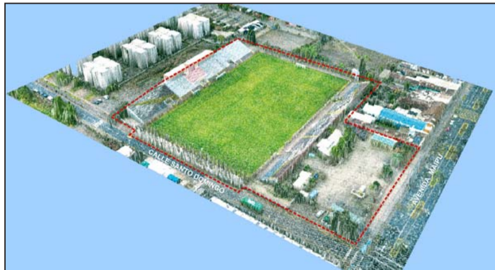
MALLA PERIMETRAL.- Las tachas en rojo señalan la demarcación donde serán instaladas mallas perimetrales nuevas y de mejor calidad.