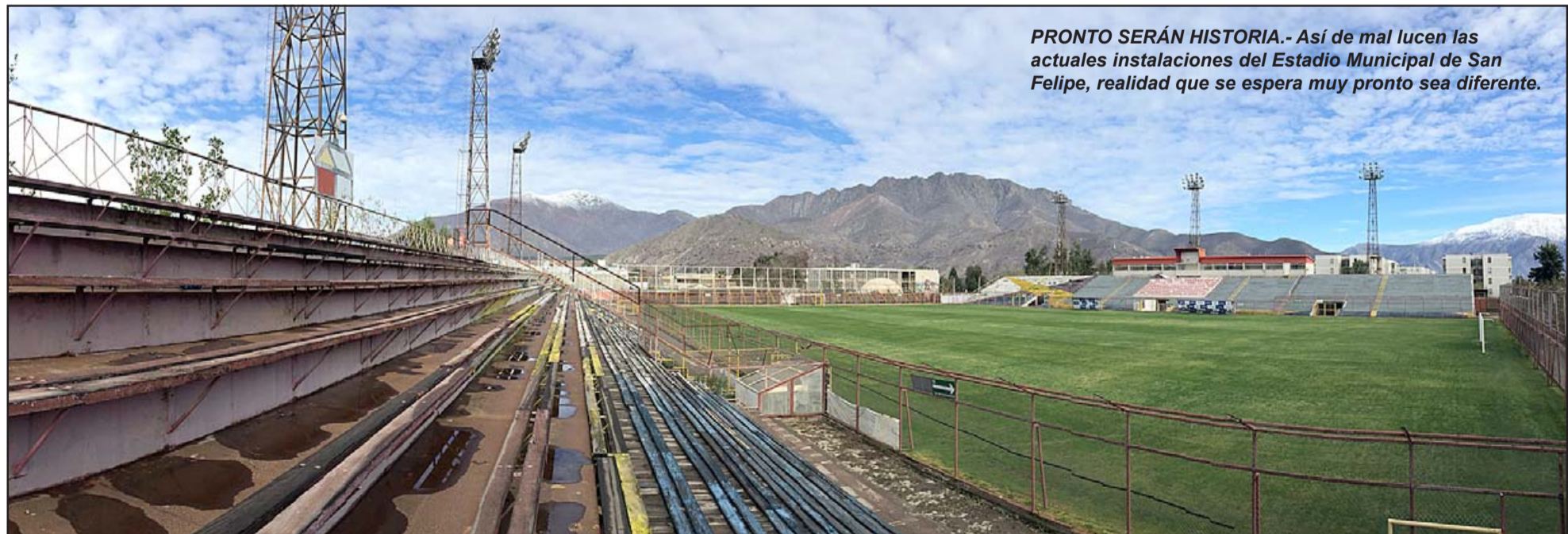
PRONTO SERÁN HISTORIA.- Así de mal lucen las actuales instalaciones del Estadio Municipal de San Felipe, realidad que se espera muy pronto sea diferente.