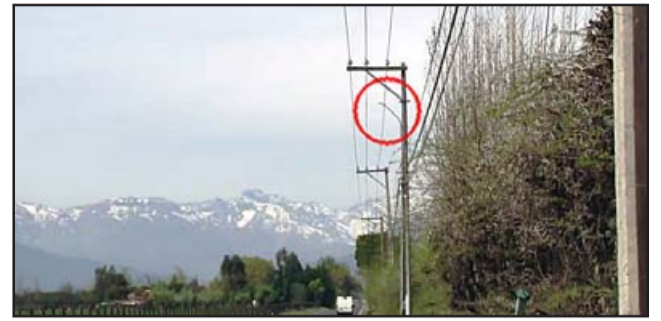
La PDI investiga este nuevo robo a los recursos públicos, este robo fue denunciado el mismo jueves.

El alcalde de Rinconada acudió hoy mismo a la PDI a realizar la denuncia correspondiente, la que busca dar con los responsables de estos hechos y nos comentó: «Efectivamente, en los sectores de Los Villares y Valle Alegre nos robaron luminarias completas, con el brazo soporte incluido y también la luminaria sola. Es muy lamentable y condenable este hecho, ya que recién en julio pasado terminamos de instalar estas luminarias LED en toda nuestra comuna, con el objetivo principal de generar mayor resguardo y seguridad para nues-