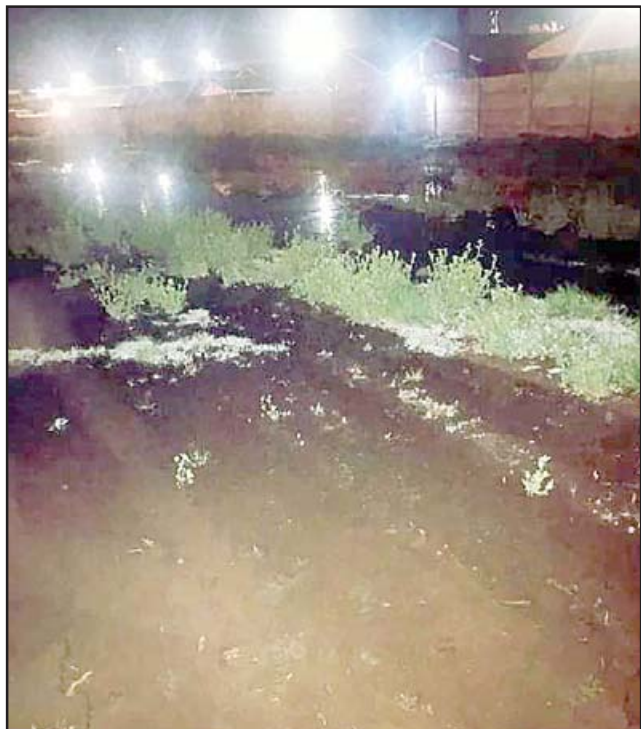
El canal totalmente desbordado. Vecinos culpan a la falta de limpieza por parte de los canalistas.

Toda esta situación ocurrió el día sábado en la noche.