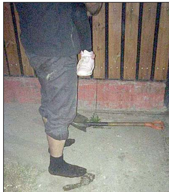
En calcetines tuvo que salir el afectado junto a uno de sus hijos.

Sobre lo que se puede hacer, indicó que le habían solicitado hacer tipo una demanda colectiva por la utilización de los canales y a quien corresponda. El regante o los canalistas del lugar, «porque tiene que ver con la limpieza, mantención de estos canales, eso lo pensamos hacer, si está la motivación de los vecinos, sí lo vamos a hacer y acom-