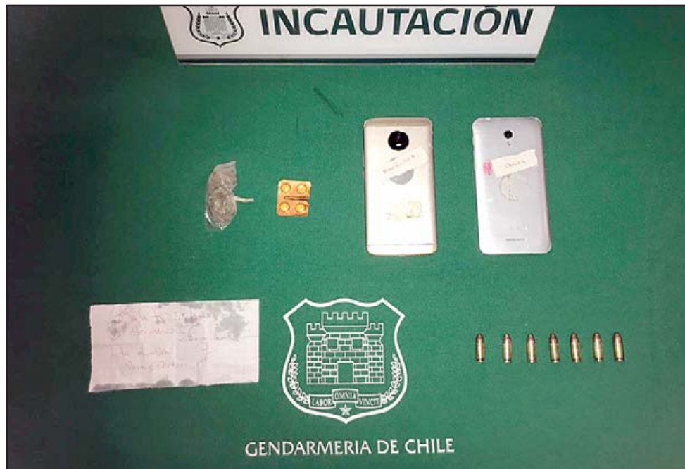
Siete municiones 9mm, marihuana, dos teléfonos celulares, cuatro comprimidos de Clonazepam y un mensaje se encontraban al interior del 'pelotazo' detectado este domingo por Gendarmería.

De lo sucedido se informó al fiscal de turno, quien