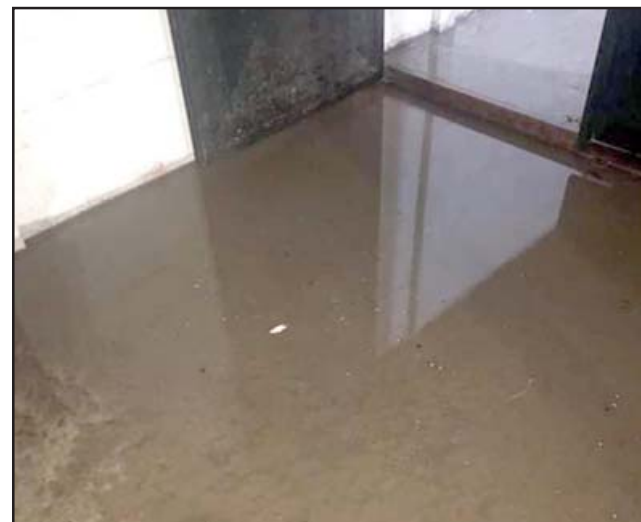
El agua al interior de la casa llegó fácilmente a unos cinco centímetros.