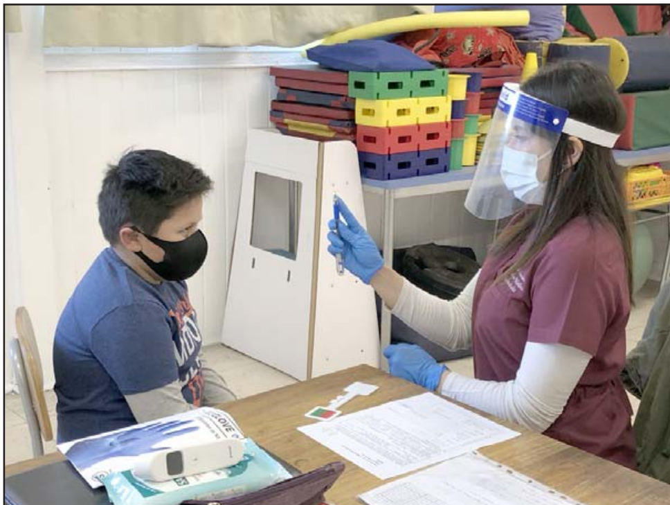
Alumnos que fueron derivados desde los establecimientos municipales fueron atendidos la semana pasada.

te, generalmente es anual, lo más severo es una vez al año para ver si cambia los lentes en el caso de oftalmología, los que son leves cada