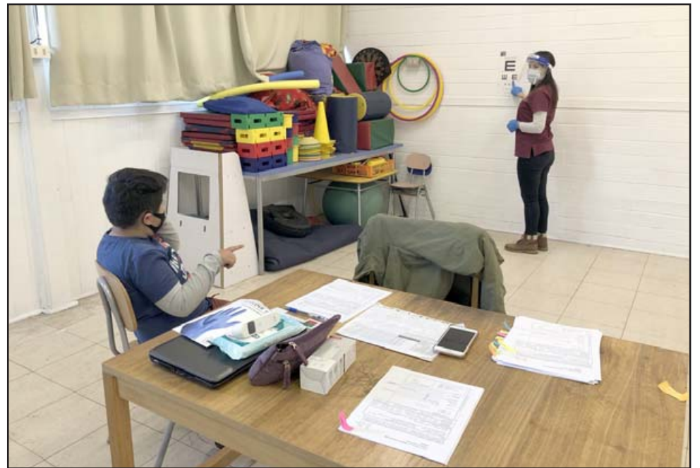
Los niños reciben atención de oftalmología, otorrino o traumatología.

«Son muchos niños que nos derivan de las pesquizas y que luego están en control con nosotros. Tenemos un sistema donde mantenemos toda esta información, sobre cuando al niño le toca control nuevamen-