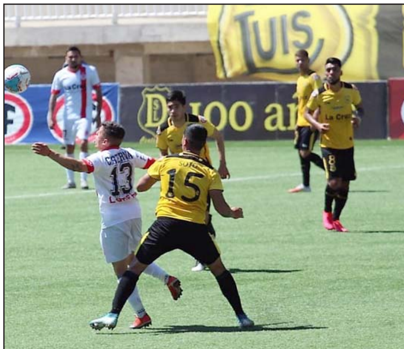
El conjunto albirrojo llegará al duelo del jueves tras haber ganado dos partidos en línea.