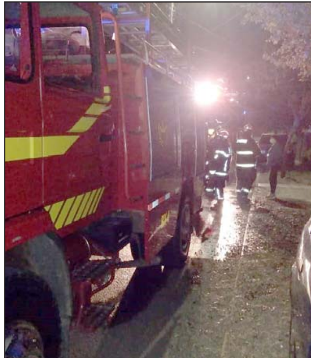
Personal de Bomberos llegó al lugar pero no pudo hacer gran cosa por tratarse de una propiedad privada.