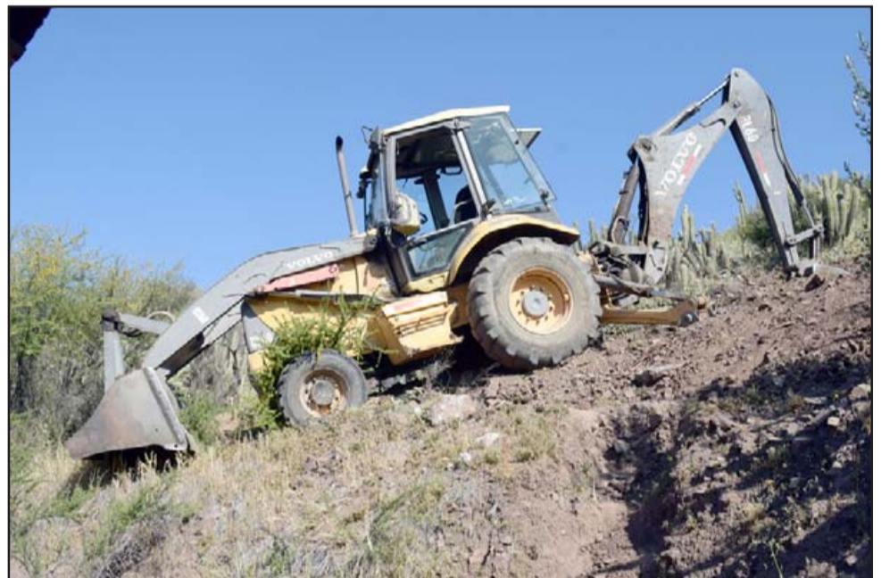
LA HORA DE LA VERDAD. - Para que esta máquina pueda ser rescatada se necesita de potencia y experticia al maniobrar.