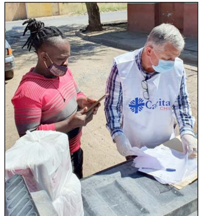
TRANSPARENCIA. - Cada entrega de recursos asistenciales a estas familias es confirmada en las actas de la organización.

- Esta ayuda a las familias comenzó a ser entregada por un grupo de voluntarios que pertenecemos a los movimientos Madrugadores de Aconcagua y Encuentro de Padres en el Es-