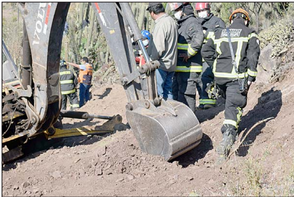
EN SUSPENSO. - Gracias a esta pala y las bases mecánicas la tragedia no sucedió. Hoy miércoles sabremos qué pasó con este accidente laboral.