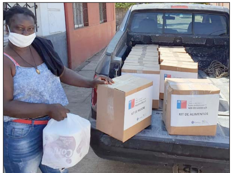
JUSTO A TIEMPO. - Los migrantes haitianos, peruanos, venezolanos y ecuatorianos, entre otras nacionalidades, están aliviadas con estas cajas de mercadería e insumos de aseo para adultos mayores también.