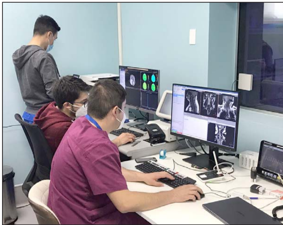
Los exámenes que han tenido mayor resolución son las resonancias de columna, cerebro y músculo esqueléticas, las que en conjunto suman cerca del 75% de las prestaciones.