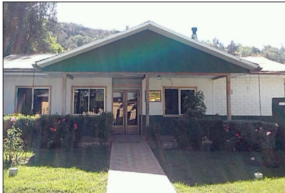
El padre de la menor y eventual autor de las lesiones, fue detenido y trasladado a la tenencia de Carabineros de Putaendo.

Con todos los antecedentes expuestos anteriormente y luego de tomar conocimiento de los hechos, el