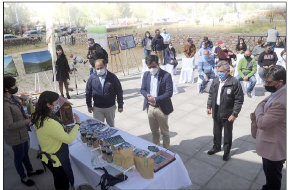
La mañana de este lunes se desarrolló la ceremonia oficial de conmemoración del 'Día Mundial del Turismo 2020' en el Valle de Aconcagua, la que tuvo lugar en Putaendo por decisión de los diferentes municipios de las provincias de San Felipe y Los Andes.