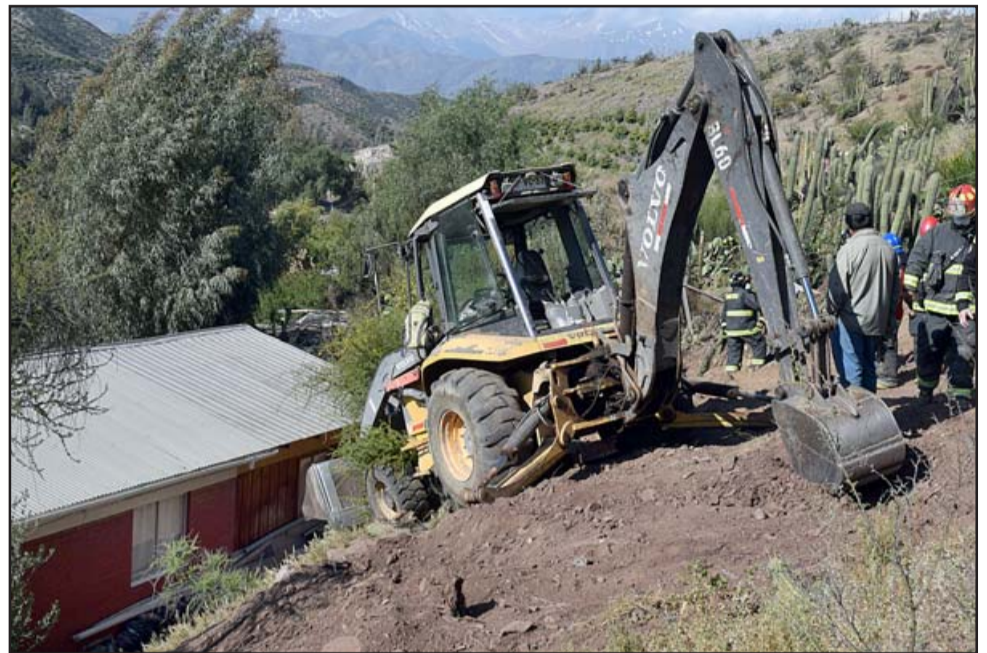
PELIGRO INMINENTE. - Esta pesada máquina estaba a pocos centímetros de caer sobre esta vivienda. Hasta el cierre de nuestra edición todo era incertidumbre.