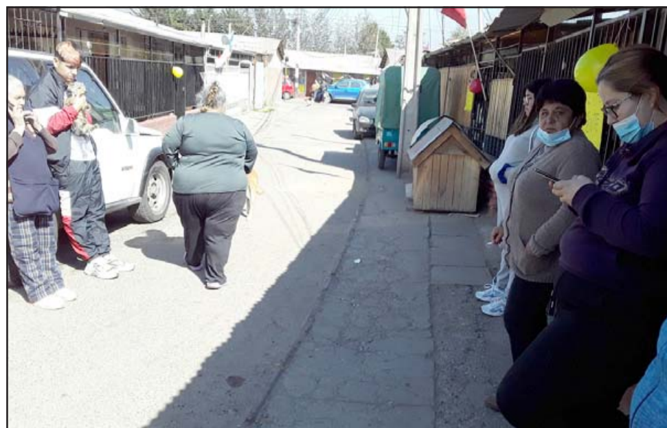
Tristes los vecinos al no poder ver correr por el pasaje a la pequeña que tanto querían.