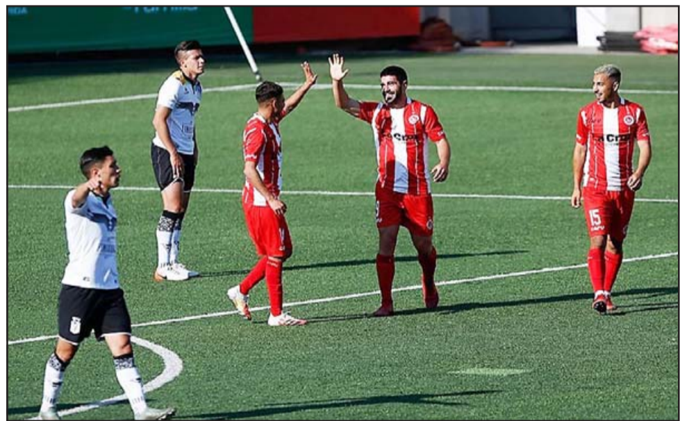
Con la categórica victoria de ayer Unión San Felipe trepó a la primera posición del campeonato.

Esta victoria -que es la tercera en línea- permite al Uní Uní quedar en la primera posición junto a Ñublense.