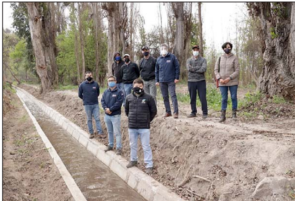
La obra contempló la construcción de un revestimiento de 414 metros de longitud, lo que permitió eliminar las pérdidas por infiltración y asegurar una distribución más eficiente del recurso hídrico.

«Para limpiar la acequia, que llevaba el agua al tranque, teníamos que sacar con pala el sedimento hasta casi cuatro metros de altura, situación que vivi-