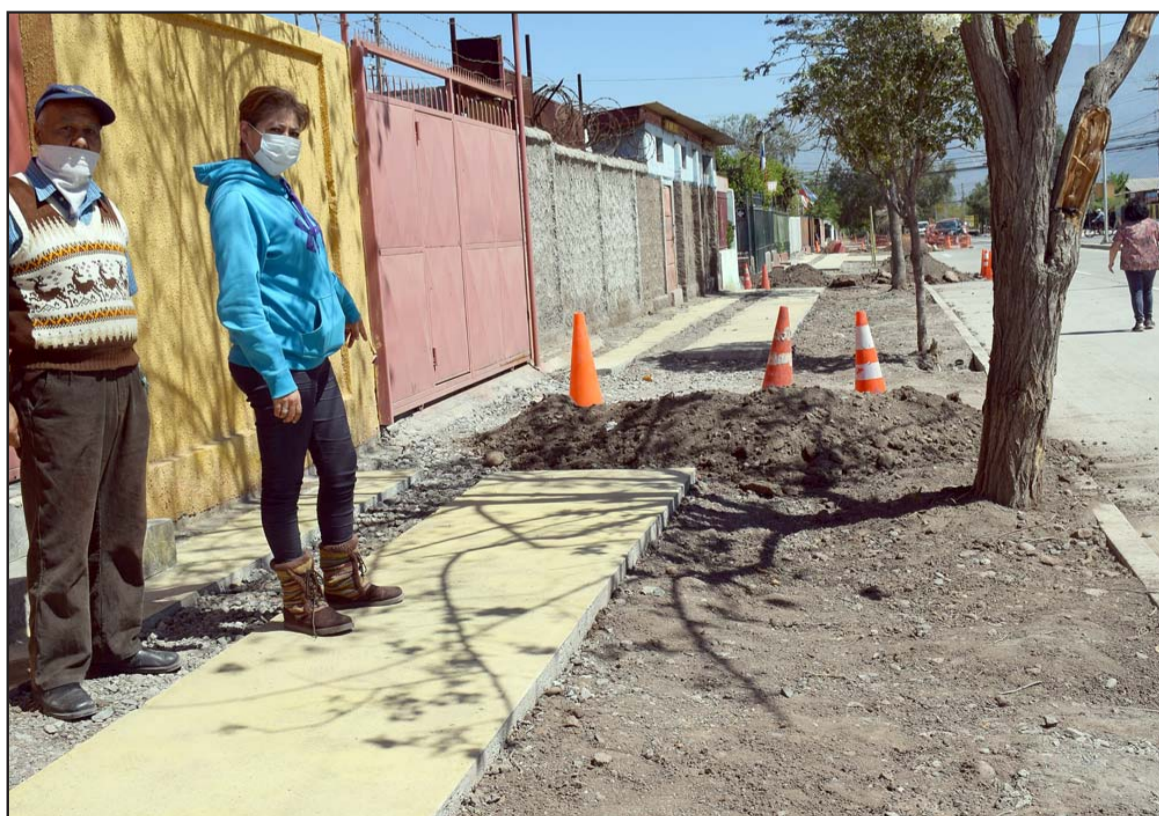
¿QUIÉN SE HARÁ CARGO?- Estas partes en tierra antes de la obra estaban pavimentadas, la empresa a cargo se niega a reparar lo que destruyó.