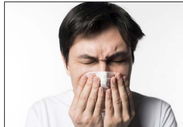
Una situación que ha despertado la preocupación de la comunidad es la dificultad para distinguir una simple alergia de un caso activo de coronavirus.