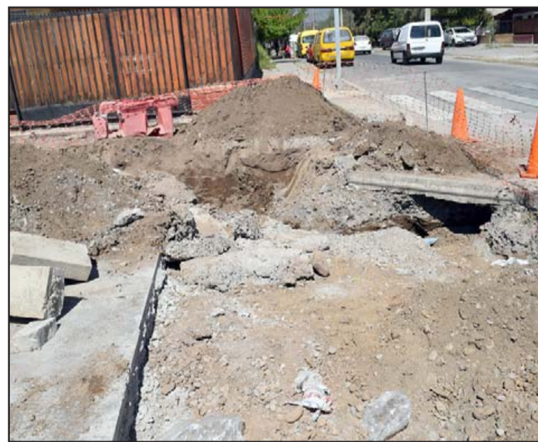
HOYOS PROFUNDOS. - Así están los vecinos del lugar, sin horas de agua todos los días, y sus veredas hechas barro, en donde aseguran algunos, un par de abuelitos ya tropezaron y se golpearon.