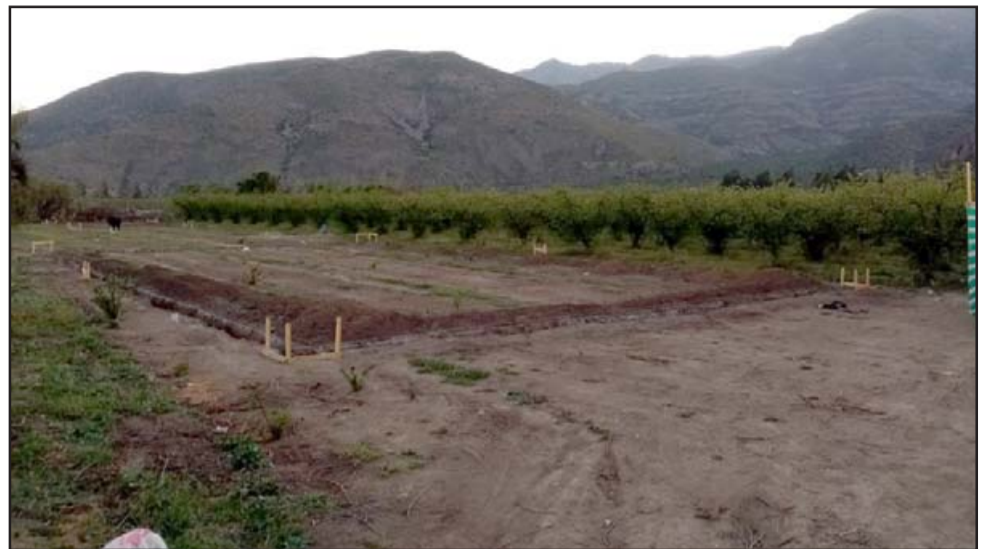
Este es el terreno donde se estaría levantando un galpón a modo de bodega y para que ahí viva un cuidador, aseguró Moreno.

- Muy buena esa pregunta, nosotros solamente somos una iglesia cristiana, con uno o dos cultos por semana, lo normal cantar, alabar a Dios y convivir como lo ha-