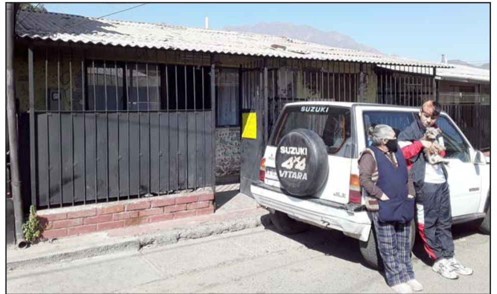
En esta casa vivió la pequeña donde todas las personas la querían.