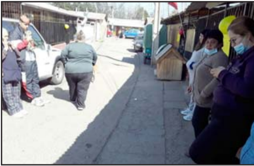
Todo el pasaje sufrió con brusca partida de bebé

Familia vive dramática y violenta experiencia