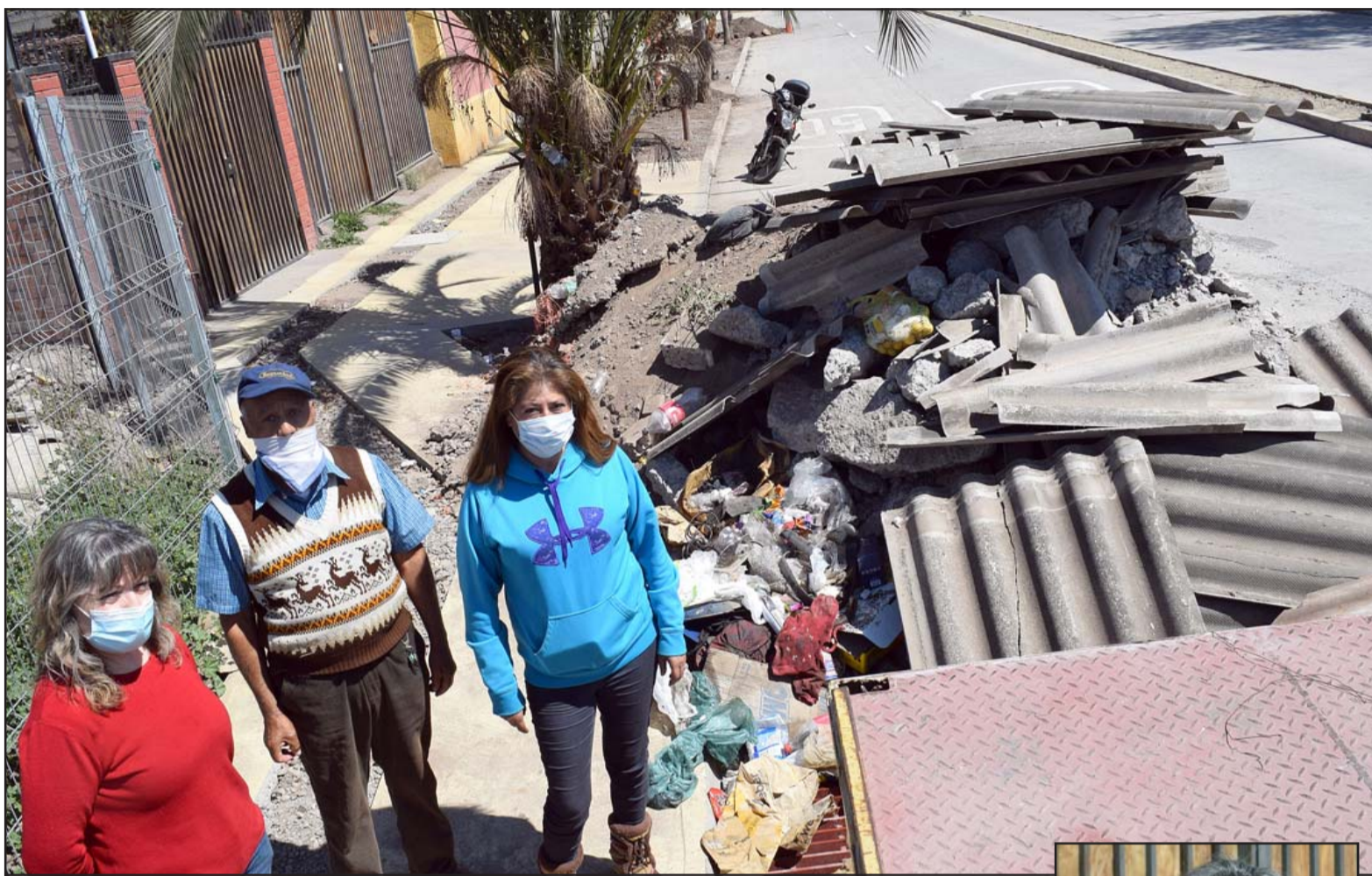
EXIGEN REPARACIÓN. - Estos vecinos de Población Hermanos Carrera Orolonco en la avenida del mismo nombre, muestran a Diario El Trabajo los escombros de su pavimento, una vez que la empresa constructora lo removió.