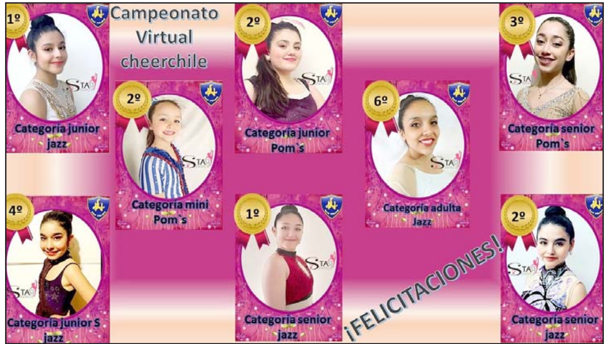
Las alumnas estaban felices con su participación y ahora se preparan para un nuevo torneo a nivel nacional.