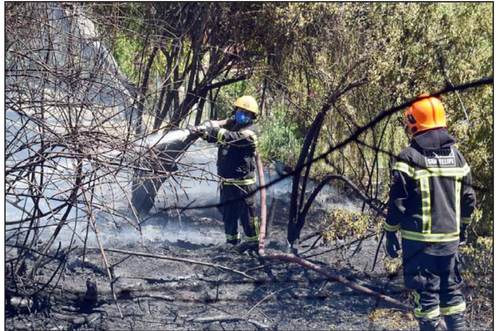
FUE CONTROLADO.- Los 'Caballeros del Fuego' lograron controlar el avance de las llamas, mismas que amenazaban con destruir unas tres viviendas.

Aún al cierre de nuestra edición se recibieron nuevos llamados por rebrotes de fuego en el lugar. No se registraron viviendas sinistradas ni personas heridas. Roberto González Short