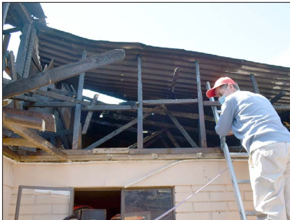
DAÑOS TOTALES.- Especialistas del Departamento Social de la Dideco inspeccionaron este lunes los daños en las viviendas afectadas.