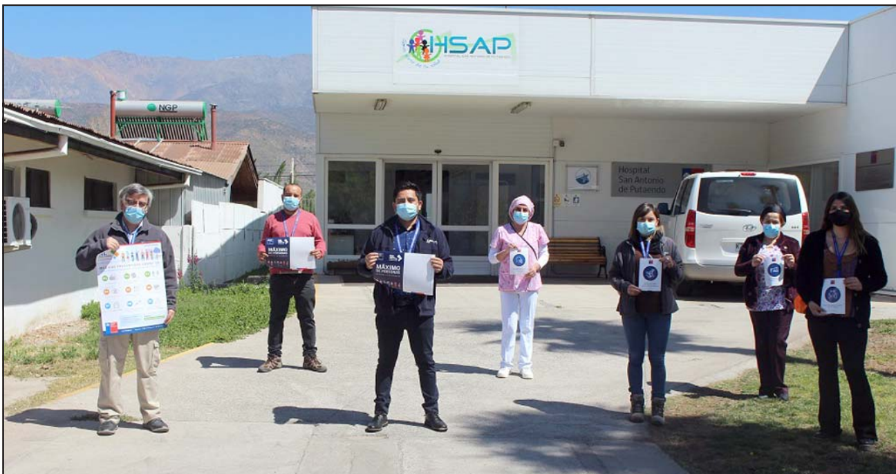
La entrega de señalética se enmarca dentro del plan Paso a Paso Contigo del ISL y su objetivo es evitar la exposición del público al Covid-19.

En la ocasión participaron integrantes del Comité Paritario de Higiene y Seguridad del HSAP, quienes han contribuido de manera significativa en la promoción de estrategias de autocuidado al interior del Establecimiento.