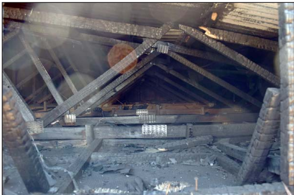
TODO DESTRUIDO.- Así quedó el cielo raso de las viviendas siniestradas, ningún cable es utilizable, ni la madera ni el techo.