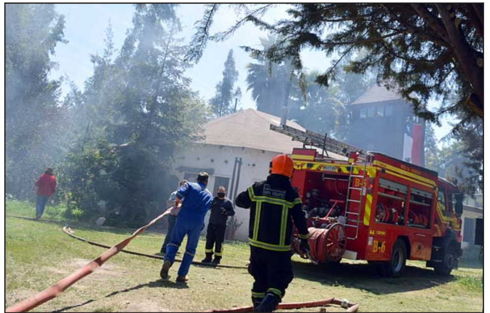
SIEMPRE BOMBEROS.- Esta vivienda estuvo en grave peligro ante el avance del fuego desde un terreno baldío, los bomberos nuevamente evitaron otra tragedia.