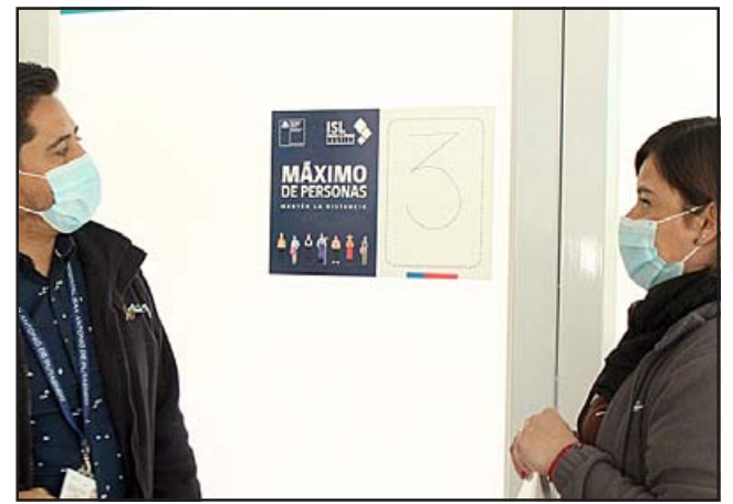
El ISL hizo entrega de señalética que fija el aforo máximo en dependencias como salas de espera y otras instalaciones de uso común, además de graficar las medidas de protección personal.

nio, Rodolfo Osorio , es altamente valorable el trabajo en red con otras instituciones públicas, lo que ha permitido implementar con éxito estrategias de prevención de propagación del coronavirus. «Es un gran apoyo para el hospital, es-