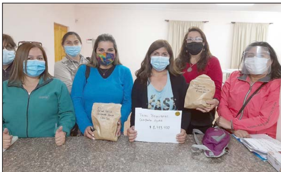
FUERZA SOLIDARIA.- Estas vecinas de Villa El Señorial se pusieron las pilas y reunieron casi un millón y medio de pesos para apoyar a sus vecinos.