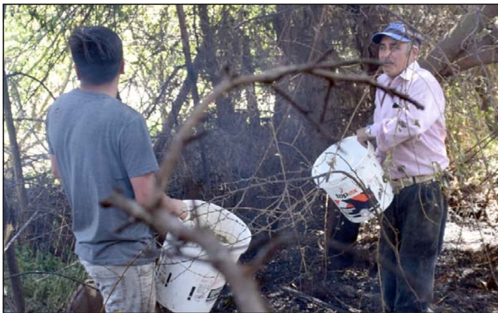
AYUDA OPORTUNA.- Algunos vecinos apoyaron con baldes a controlar las llamas, al menos para impedir que consumiera las viviendas.