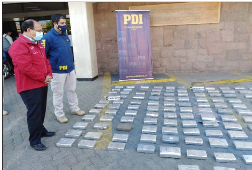
En la imagen el gobernador Claudio Rodríguez junto a un funcionario de la PDI observan la importante cantidad de droga incautada.

En este operativo se incautó un camión y un semi-