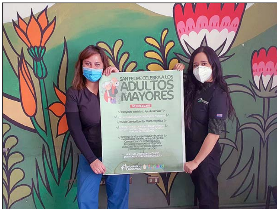
Bajo el lema 'San Felipe celebra a sus adultos mayores', se potenciarán actividades online mediante las redes sociales de 'San Felipe Salud' para generar distintas iniciativas orientadas a la entretención, educación y desarrollo de actividad física y emocional.

Entra las actividades destacan los 'lives' que se desarrollarán durante todos los miércoles, a partir de las 15.30 horas, a través de Facebook live de 'San Felipe