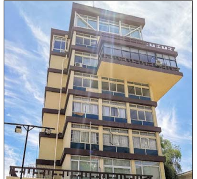
Tras una sanitización a las dependencias de la gobernación, dicha repartición continuó con la atención de público.

Asimismo, se informa que actualmente, la atención de público continúa de manera habitual entre las 09.00 y 14.00 horas, todo ello cumpliendo con los protocolos preventivos instruidos por la Autoridad Sanitaria.