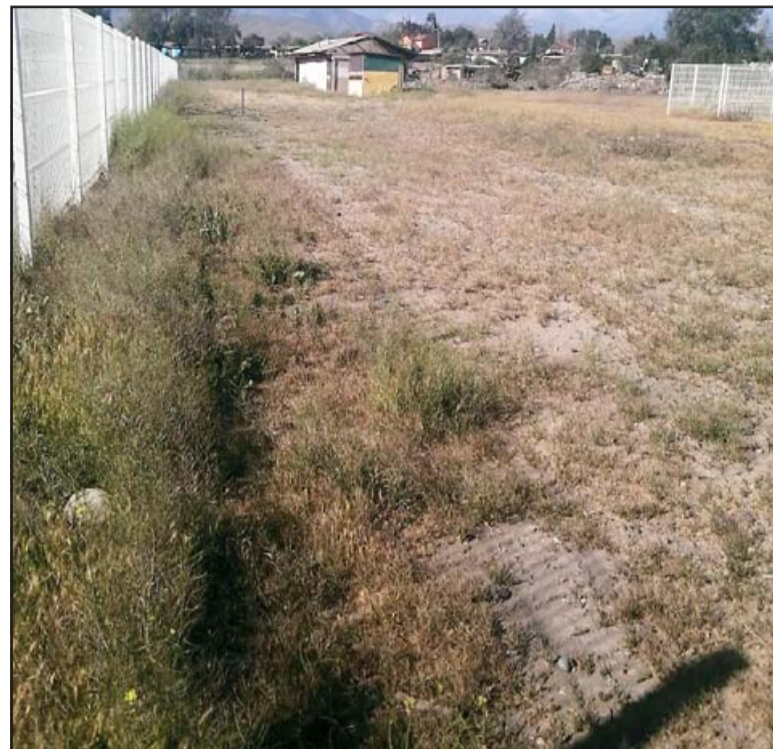
En el fútbol local se entusiasman con la idea de mejorar el Complejo ANFA.