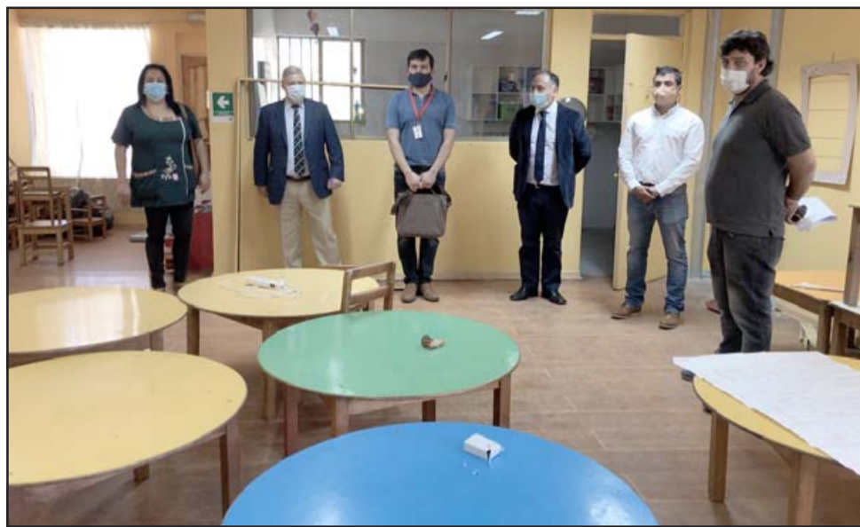
Las autoridades recorrieron las dependencias que ya se están remodelando.

El jardín infantil y sala cuna tiene 72 niños matriculados este año, que se dividen en los niveles de sala cuna menor y sala cuna mayor, más el nivel medio heterogéneo de 2 a 4 años, y ellos cuentan con tres salas con baños incorporados y distintos patios.