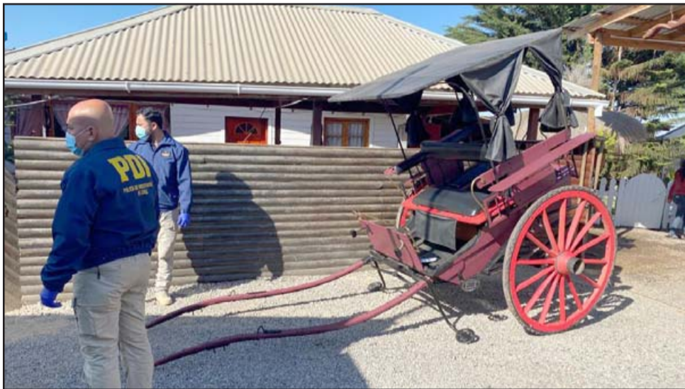
La calesa siendo incautada por la BIDEMA de la PDI.

Más de 300 imágenes desaparecidas al retirarse Franciscanos: