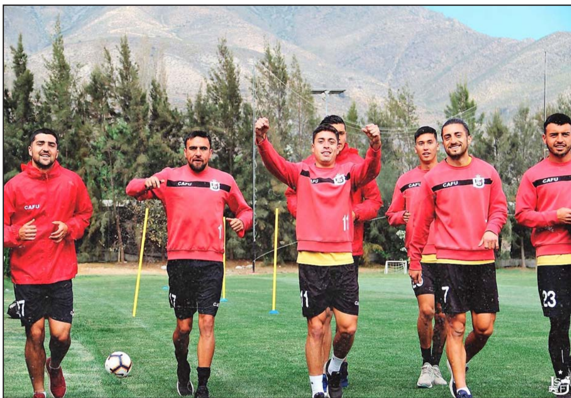
PURA ALEGRÍA.- El conjunto sanfelipeño llega al duelo de hoy precedido de cuatro triunfos en línea.

El juego entre capitalinos y aconcagüinos que pondrá término a la décimo tercera fecha del campeonato, será dirigido por el juez Benjamín Saravia.