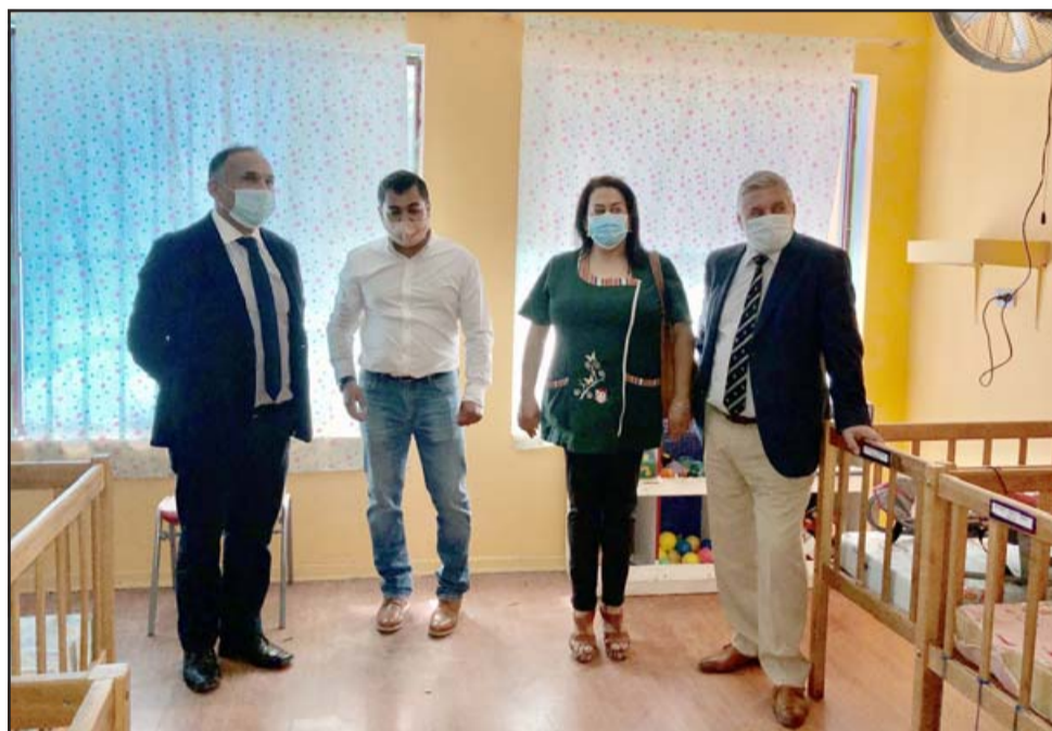
El proyecto significa una inversión superior a los 40 millones de pesos.