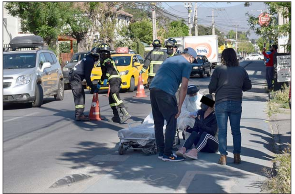
Tras el accidente la mujer quedó en el suelo, siendo asistida por personal del SAMU con apoyo de Bomberos.

Por lo que pudimos apreciar en el lugar de los