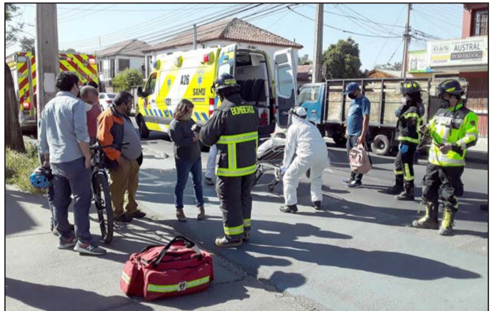
La mujer en la camilla siendo subida por un funcionario del SAMU (de blanco). Al costado izquierdo la bicicleta en la cual se movilizaba.

EL SUSTO DE SU VIDA. - Esta ciclista literalmente se dio una 'vuelta de carnero' cuando bajaba por la ciclo vía de Avenida Tocornal al ver que sorpresivamente salía marcha atrás un camión desde el estacionamiento que tiene Supermercado Santa Isabel en esa misma avenida, porque se asustó apretando el freno delantero, lo que llevó a una detención violenta cayendo al suelo.