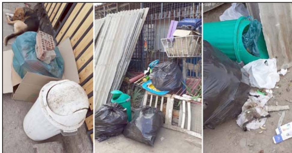
PROBLEMA RESUELTO.- Luego de la denuncia publicada por Diario El Trabajo la empresa Veolia respondió a nuestro medio y la Dipma aclaró la situación, además que la basura ya fue retirada del pasaje.

«En el contexto de la denuncia realizada a Diario El Trabajo, por parte de los vecinos de Villa Juan Pablo II, indicando que hay problemas con la recolección de los residuos domiciliarios, queremos señalar lo siguiente: En primer lugar, lamentamos las molestias de los habitantes de dicho sector y aclaramos que nuestros procesos de recolección de residuos cumplen