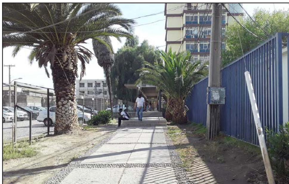
En este lugar se produjo el asalto la noche del viernes que recién pasó.

Señalar que la empresa encargada de arreglar este tipo de fallas es SINEC.