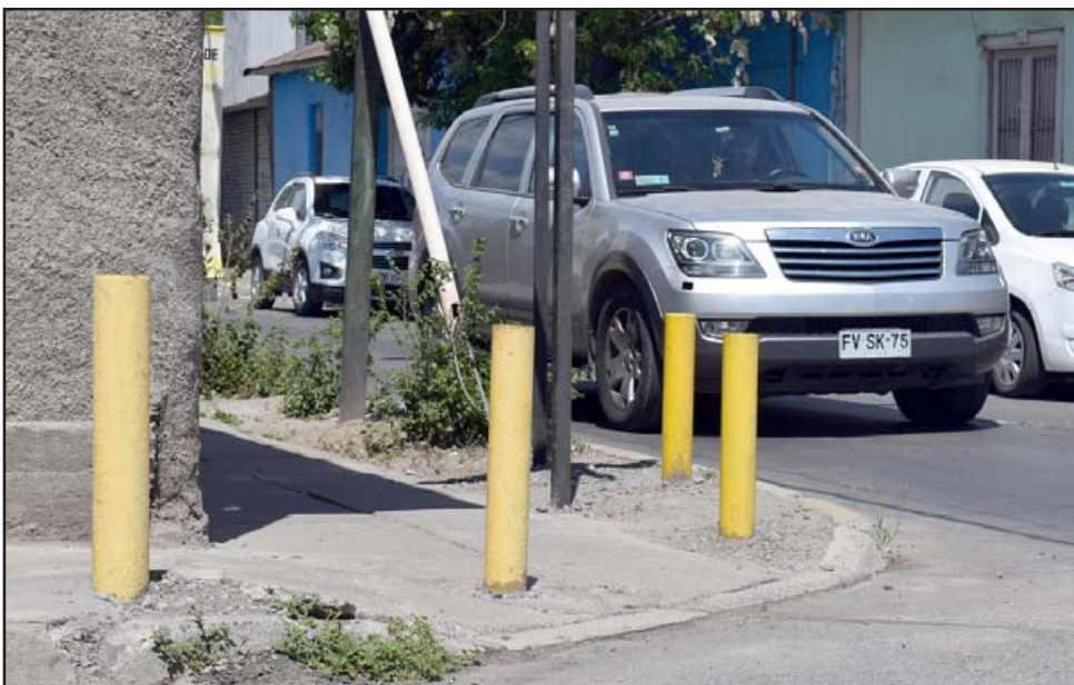
TRABAJO A MEDIAS. - Estos pequeños postes antes tenían un propósito, el Municipio al cambiar el sentido de las calles, hizo que ahora de nada sirvan.