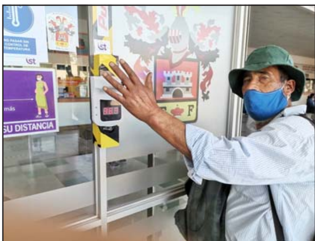
En la imagen un usuario del terminal tomándose la temperatura en el nuevo termómetro digital instalado en el lugar.

La instalación del aparato se realizó el día viernes 9 de octubre.