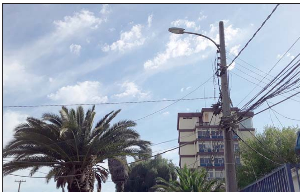
Este es el foco que la empresa encargada de reparar, hasta ayer no lo había hecho, pese a haber sido avisada supuestamente el martes pasado.