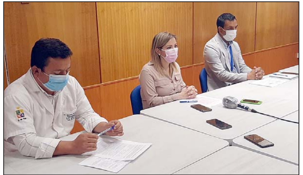
El Servicio de Salud Aconcagua realizó el lanzamiento local de la semana de la Salud Mental, enfatizando en la importancia de la red de atención en todo el valle.

La autoridad resaltó que se está implementando un regreso paulatino a las consultas y acciones en cada establecimiento, lo que también incluye las prestaciones de salud mental. «Estamos llevando a cabo un plan de retorno seguro a las actividades presenciales, porque tenemos que cuidar no sólo a los usuarios sino también a los funcionarios. Sabemos que este retorno puede evidenciar ciertas patologías o situa-