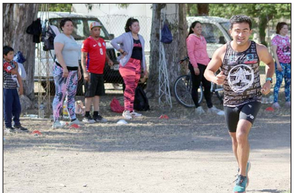
NECESITAMOS PISTA DE ATLETISMO.- Los atletas de nuestra comuna se las tienen que aguantar cada vez que hacen ejercicios en el Estadio Fiscal.