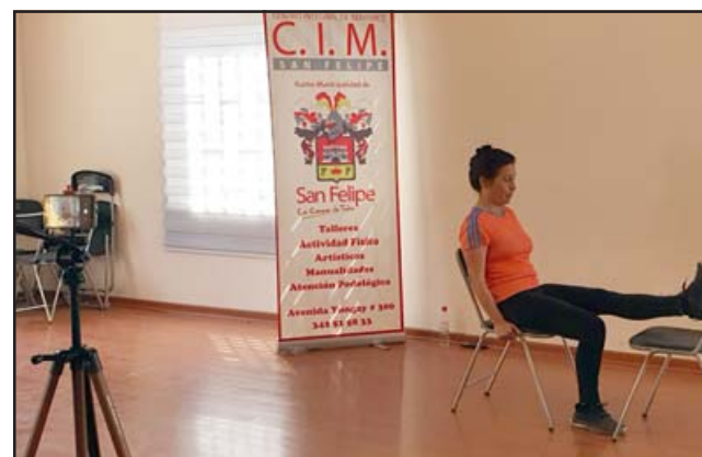
Las cápsulas en video son grabadas en el mismo recinto con el objetivo que los adultos mayores mantengan cierta actividad física que les permita reactivarse tras varios meses de confinamiento obligatorio.