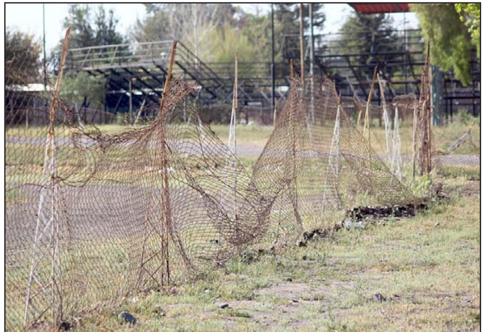
SIN SEGURIDAD.- Las mallas perimetrales ya están inservibles, al parecer el Municipio pronto las cambiará.