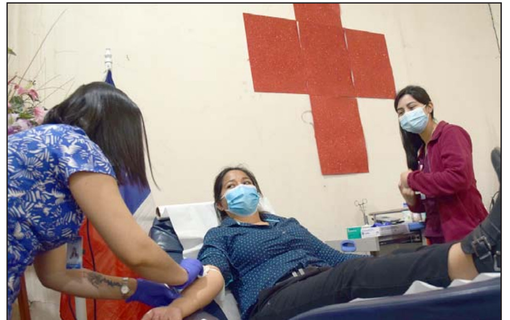
INDEFINIDAMENTE.- Ya no tienes que ir al Hospital San Camilo para donar sangre, ahora esto se realiza en la filial de San Felipe de la Cruz Roja.

Has tenido relación sexual con una nueva persona hace menos de ocho meses (con o sin condón); Has tenido relaciones sexuales con más de una persona en los últimos ocho meses (con o sin condón); Has tenido relacio-