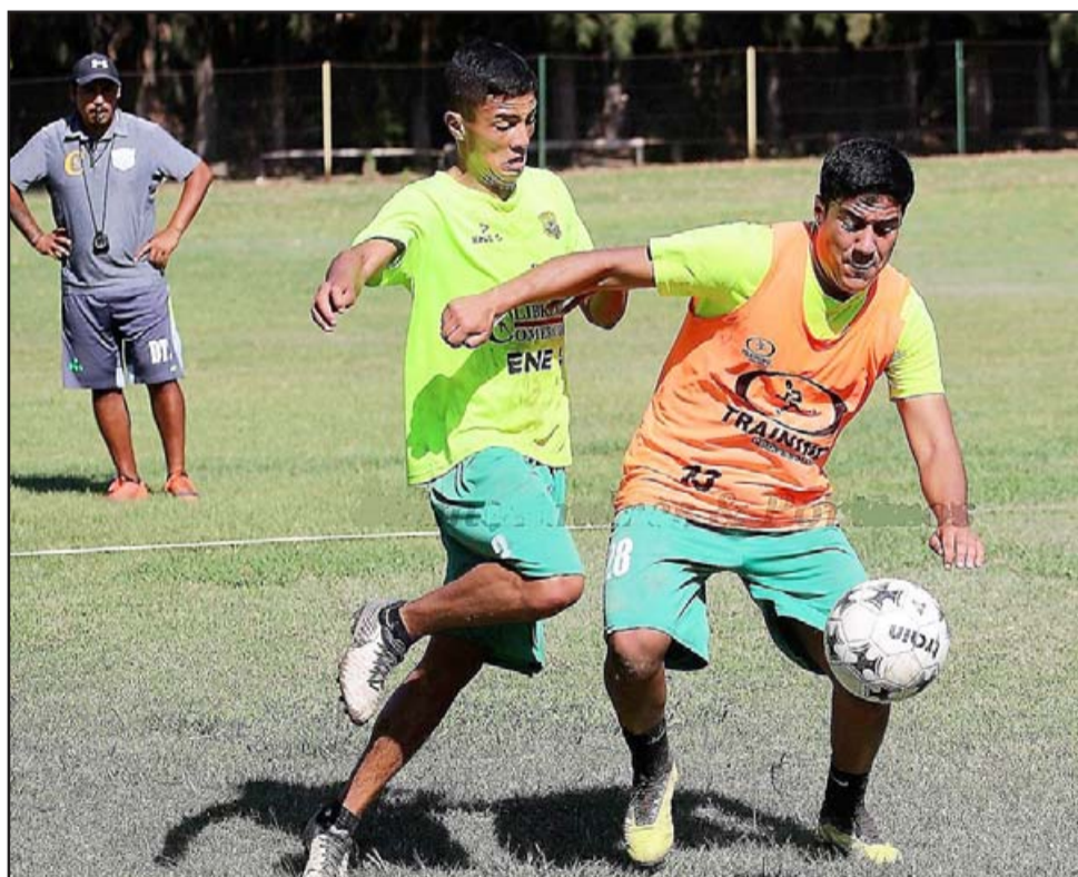
En un futuro muy cercano el plantel de Trasandino retomará los entrenamientos.

la Tercera División dio a conocer que ya contaban con los permisos respectivos y que por estos días trabajan en la confección de la modalidad de la competencia; la fecha de inicio y las obligaciones que deberá cumplir cada institución para poder participar.