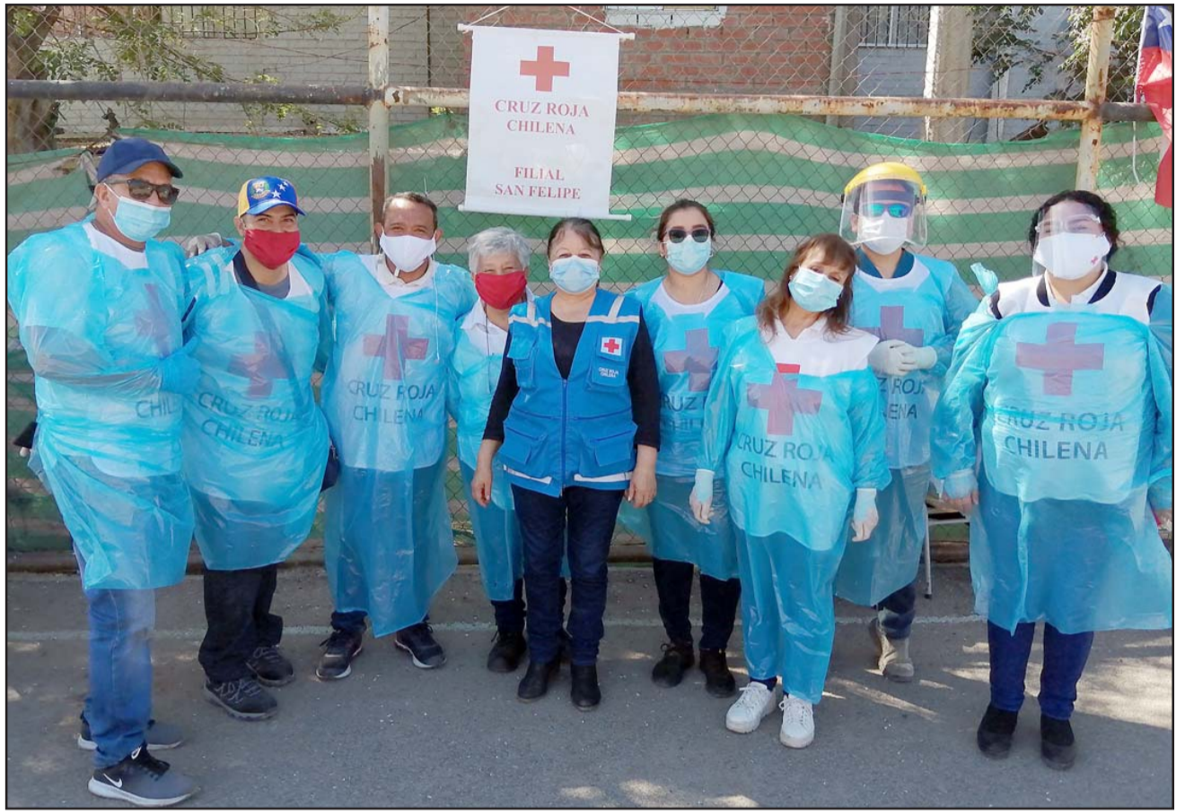
SIRVIENDO EN TERRENO.- Parte del gran voluntariado de la Cruz Roja sirviendo en terreno este Día del Migrante.

«Importante señalar que en esta actividad se tomaron muestras para el examen PCR, la junta vecinal por su parte hicieron una Olla Común para los vecinos migrantes y chilenos también, nosotros como Cruz Roja estuvimos en la cancha tomando las medidas de protección Cruz Roja San Felipe, nos insta-