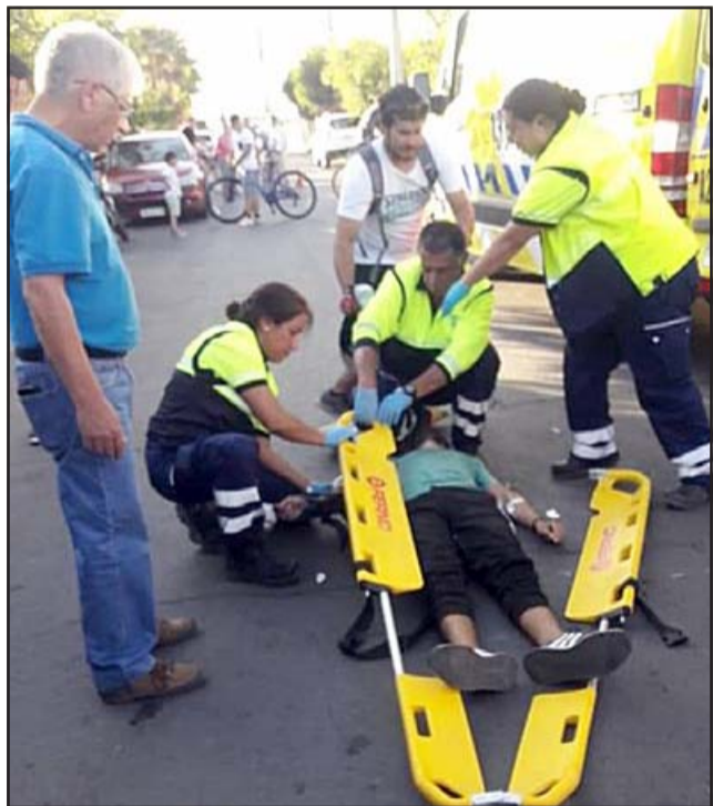
Y EL PROBLEMA SIGUE.- Este conductor al parecer, perdió una de sus manos en este accidente en Avenida Brasil.