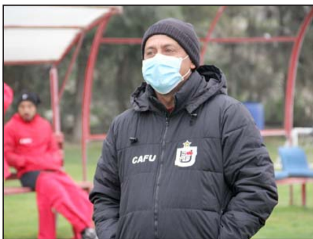
El entrenador califica de positiva la campaña de su escuadra.

hacernos muy fuertes, porque de local la misión será siempre sumar de a tres», finalizó.