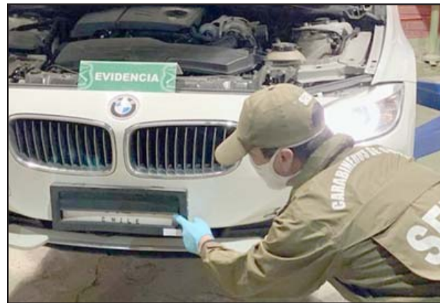
Al revisar los uniformados el portamaletas del vehículo, se encontraron una bolsa con 200 miguelitos.

Por el cúmulo de delitos y la alta pena asignada la receptación, el fiscal Gerto-