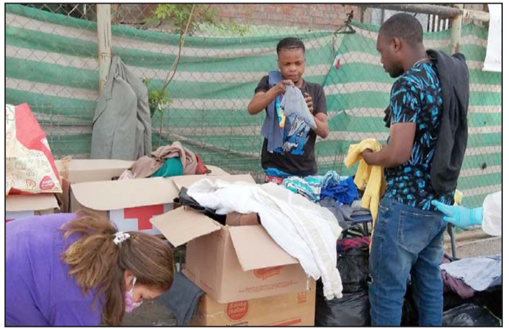
ROPA DONADA.- Los vecinos eligieron a su gusto la ropa y zapatos que para ellos se dispusieron durante la jornada.