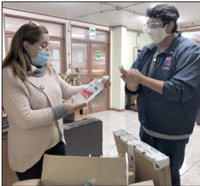
La entrega de kits que se realiza a todos los establecimientos municipales fue supervisada por Junaeb.

«Las familias que voluntariamente deseen volver a clases, lo hagan con la certeza de que los niños van a tener protocolos, espacios y elementos de seguridad para tener un retorno totalmente seguro y gradual a las clases presenciales», dijo la autoridad.