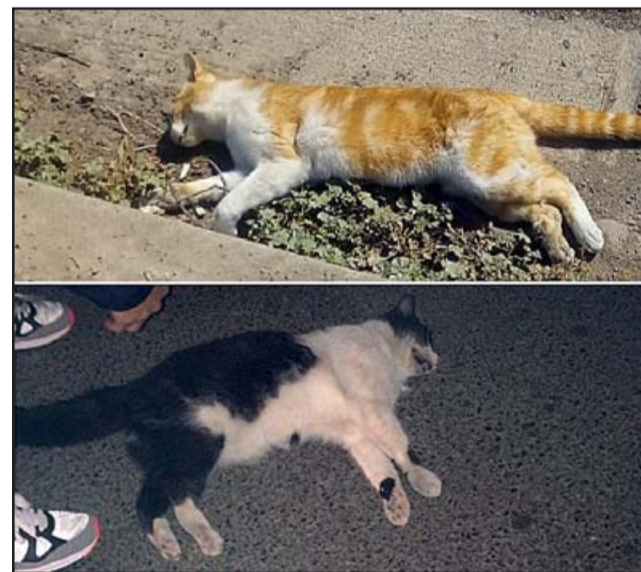
TODOS EN PELIGRO.- Estos dos gatos agotaron sus Siete Vidas intentando cruzar Avenida Chile, ¿y si fuese un niño?