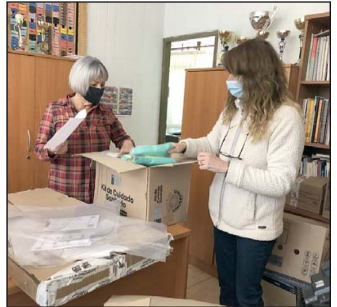
El equipo directivo del Liceo San Felipe revisó los kits que llegaron para proteger a alumnos, docentes y asistentes de la educación.

«Hemos recibido un total de 730 kits sanitarios. Hoy con el encargado hemos estado revisando que vinieran en correctas condiciones y viniese la cantidad que corresponde. Obviamente pasa a ser un aporte porque ese gasto ya no corre de parte del establecimiento con los fondos que corresponden, todo aporte es bueno sobre todo para las estudiantes. Viene destinado para el total de las estudiantes y para los funcionarios, aún cuando sabemos en un posible retorno, eso será parcelado,