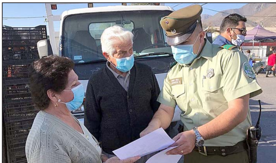
TODOS ALERTA.- Adultos mayores son informados, al igual que los jóvenes, sobre qué hacer en caso de alguna emergencia.

MUY INTERESADOS.- Esta vecina mostró su interés por la información que esta carabiniera le entrega.