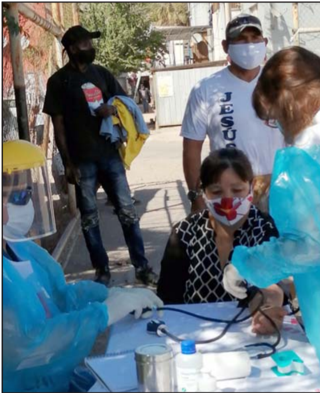
SALUD PARA TODOS.- Otros vecinos se tomaron la presión y recibieron atención en distintas áreas que ofrece la Cruz Roja y sus profesionales.