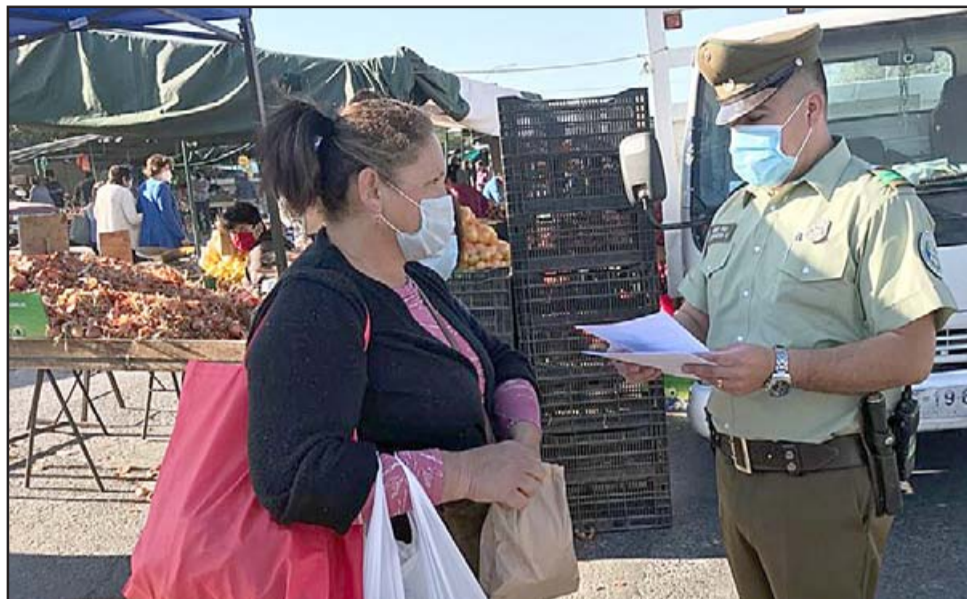
CAMPAÑA EN LA COMUNA.- En las ferias de nuestra ciudad estos carabineros hacen su trabajo informativo y preventivo con los sanfelipeños.