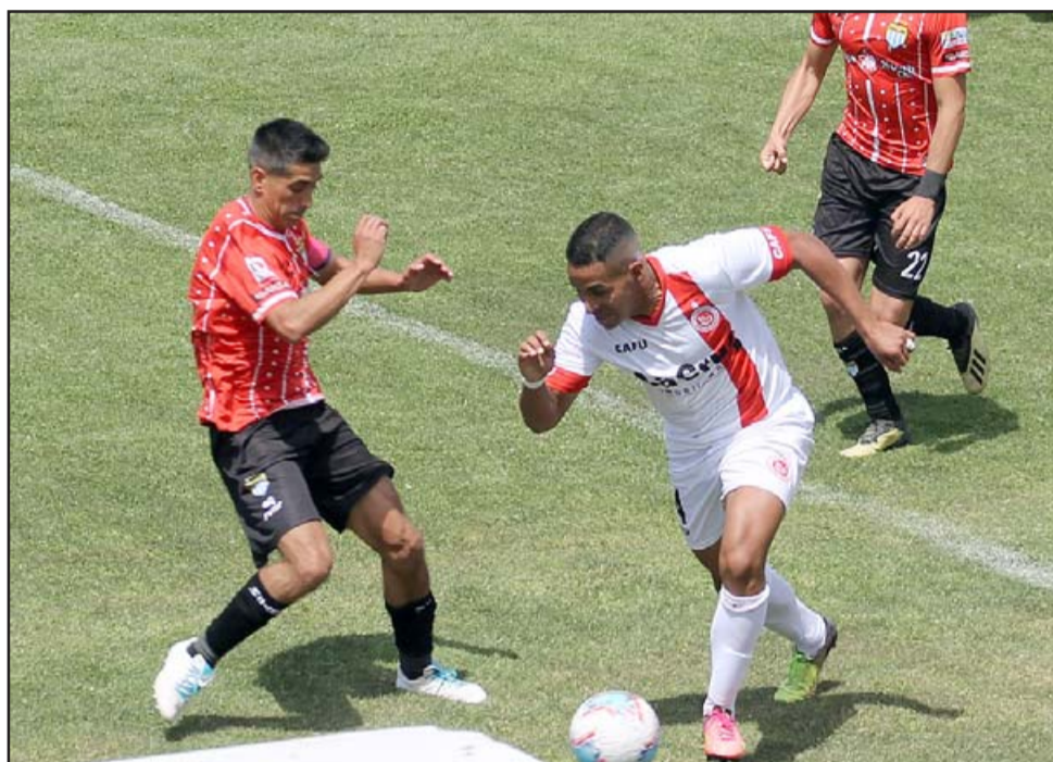
Unión San Felipe finalizó la primera rueda del torneo en la quinta posición.

El martes pasado Unión San Felipe volvió a ser local en el estadio Municipal, y el retorno no fue