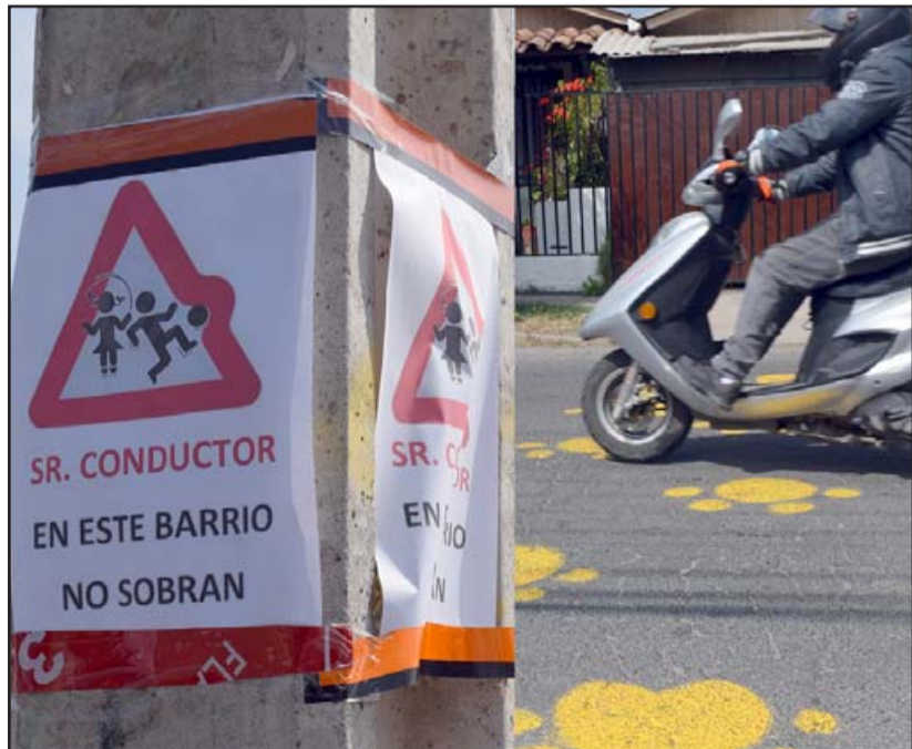
CAMPAÑA EN PROCESO.- En todas partes los vecinos ponen anuncios, y hasta huellas amarillas en el pavimento.