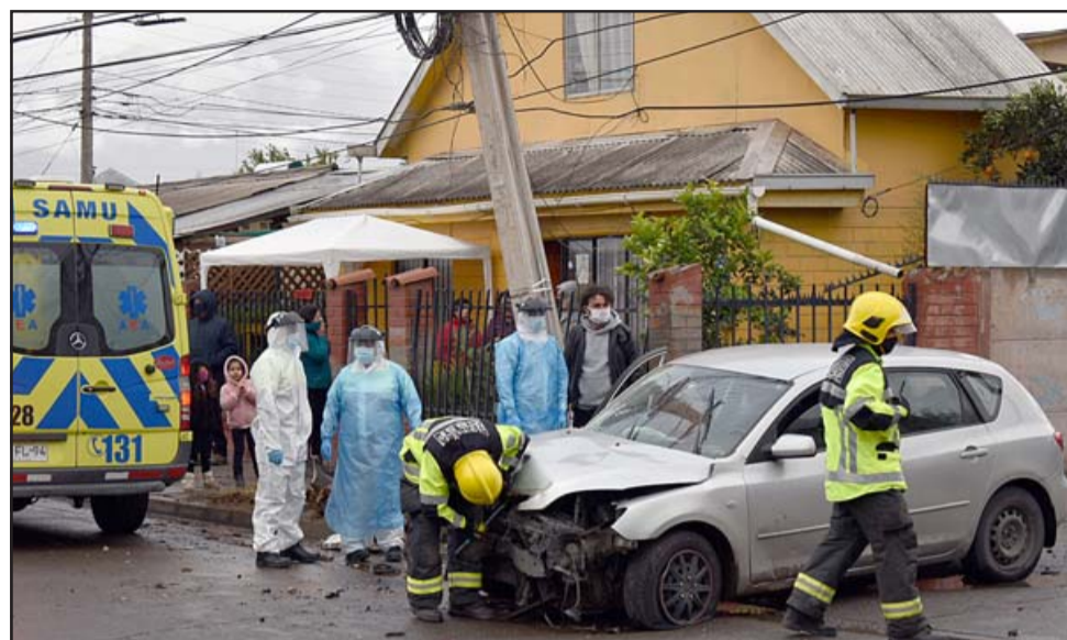
¿DEBE MORIR ALGUIEN?.- Recientemente este automóvil se estrelló contra este poste a gran velocidad. Los vecinos aseguran sentir mucho temor con este tipo de conductores en tan insegura avenida.