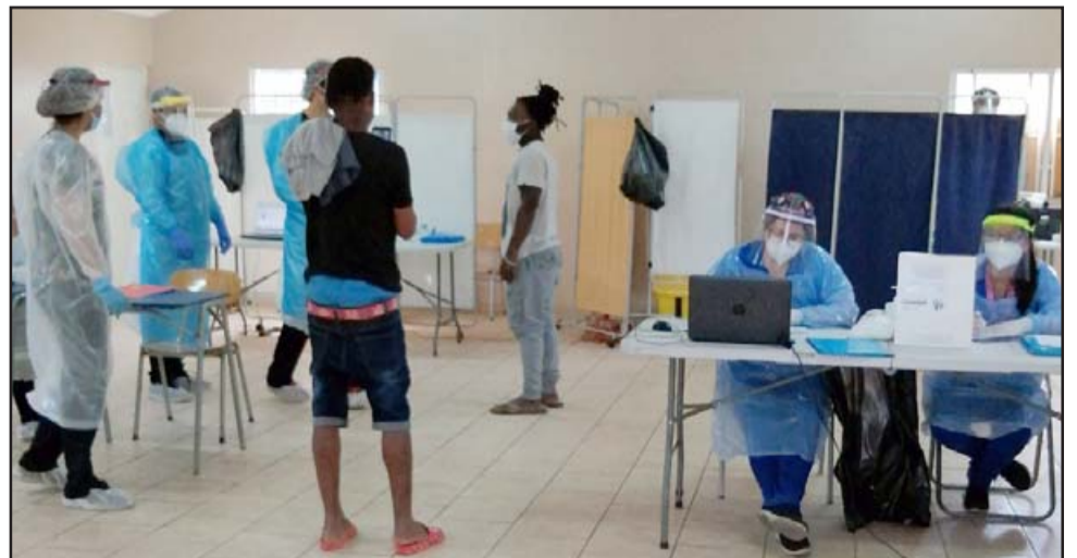
ATENCIÓN COVID.- Personal médico de los Cesfam Segismundo Iturra y San Felipe El Real hicieron exámenes PCR a los migrantes que lo solicitaron.