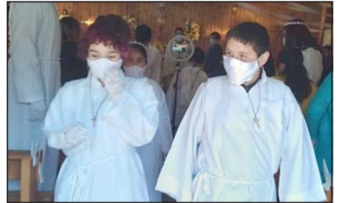
AVANZANDO.- Aquí vemos a varios niños recibiendo su Primera Comunión.

Para este sábado y domingo 7 y 8 de noviembre, anunció el párroco Claudio Acevedo , se realizarán 30 primeras comuniones, y serán divididas en dos fechas