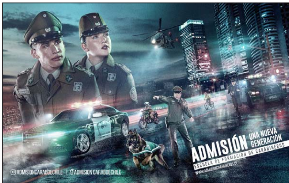
El proceso mantiene vacantes para varones debido a que la instancia para mujeres ya se completó, para continuar nuevamente en enero de 2021.

La inscripción de un postulante continúa luego con exámenes de tipo psicológico, físico, exámenes de salud, entrevistas personales, mediciones de conocimientos, entre otros. Una vez concluida la etapa de pruebas, el oponente obtiene una nota con la que disputa un cupo entre la totalidad de los jóvenes que postularon a nivel nacional.