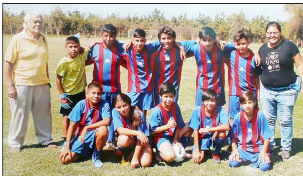
SIEMPRE MALILLA. - Aquí tenemos al legendario formador de ligas menores del Club Deportivo Juventud Antoniana.

«Desde que yo era niño me encantan los deportes de contacto, fui boxeador pero lo que más me apasiona es el fútbol, eso me llevó a trabajar por mucho tiempo en la antigua Digerder (Dirección General Deportes y Recreación). Durante todos estos años, después de salir de La Marina en 1964, me empeñé en sacar cursos deportivos para poder dar formación a los niños. Nací en Barrio Norte Unido de Arica, luego de esta preparación con cursos de coach logré ser contratado por los municipios de San Fe-