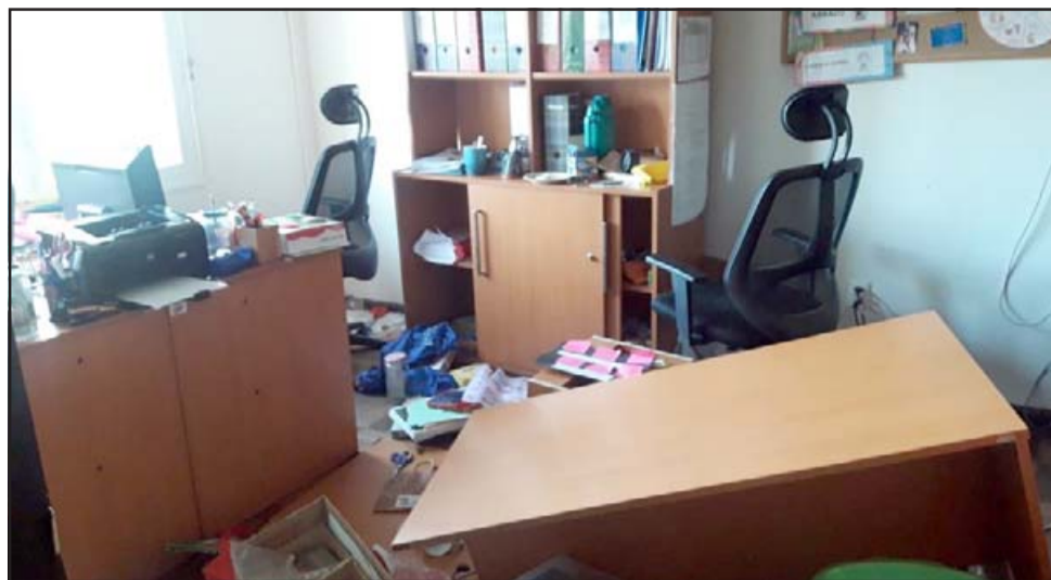
Así dejaron el o los delincuentes que entraron a robar al interior de las dependencias de la DAEM.

Importante señalar que a este lugar ya han entrado a robar en varias ocasiones.