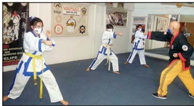
Integrantes del club Marcela Sabaj durante uno de sus entrenamientos antes del Covid-19.

En sus 26 años de vida el club Marcela Sabaj ha realizado 18 campeonatos en San Felipe, eventos que se tomaban la agenda en la ciudad al reunir cientos de competidores de todo el país. También la institución ha partici-