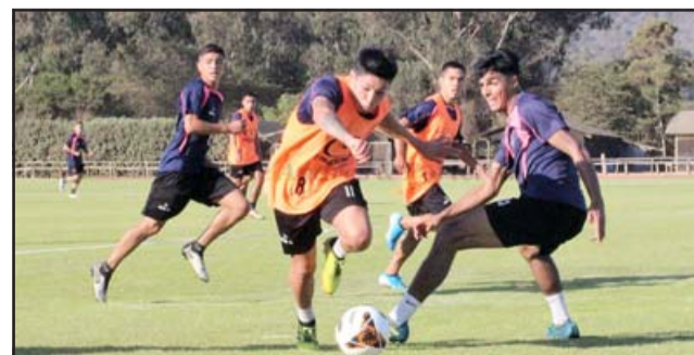
A inicios del próximo mes debería producirse el regreso a los entrenamientos de Trasandino.