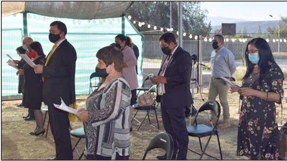
Fieles de la iglesia a nivel local, Pdta. de la Junta de Vecinos y pastores, asistieron a la ceremonia realizada el sábado 10 de octubre.