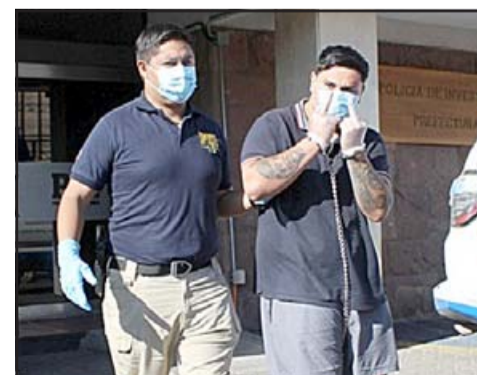
Los antisociales fueron detenidos y pasaron a disposición del Juzgado de Garantías.