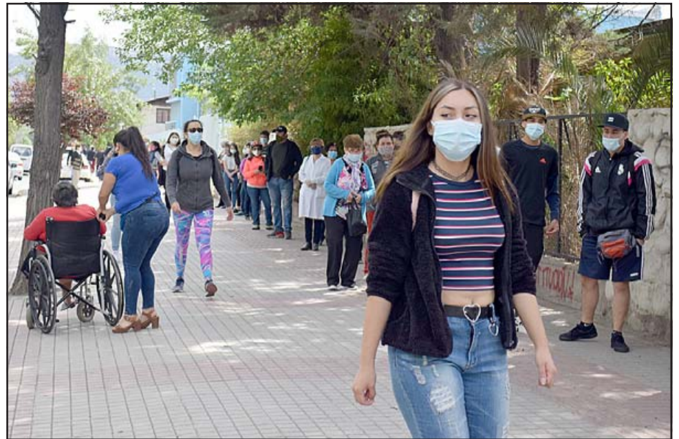
CHILE DESPERTÓ.- Jóvenes, adultos y adultos mayores, muchos en sus sillas de ruedas llegaron a su centro de votación para cambiar Chile.

Respecto al vocal de mesa que presentó síntomas de Covid-19, indicó que los antecedentes que tenía él como autoridad era que «efectivamente una persona que le tocaba cumplir su rol como vocal de mesa, llegó con cierta sintomatología al lugar e inmediatamente se aplicó el protocolo, que significa que el personal del Ejército tiene la seguridad al interior del establecimiento del local de votación, se procede a aislar a esa persona, se llama al SAMU, el SAMU lo lleva al centro de salud que corresponde y de esa manera poder llegar a confirmar o no si esa persona tenía efectivamente Covid o no.