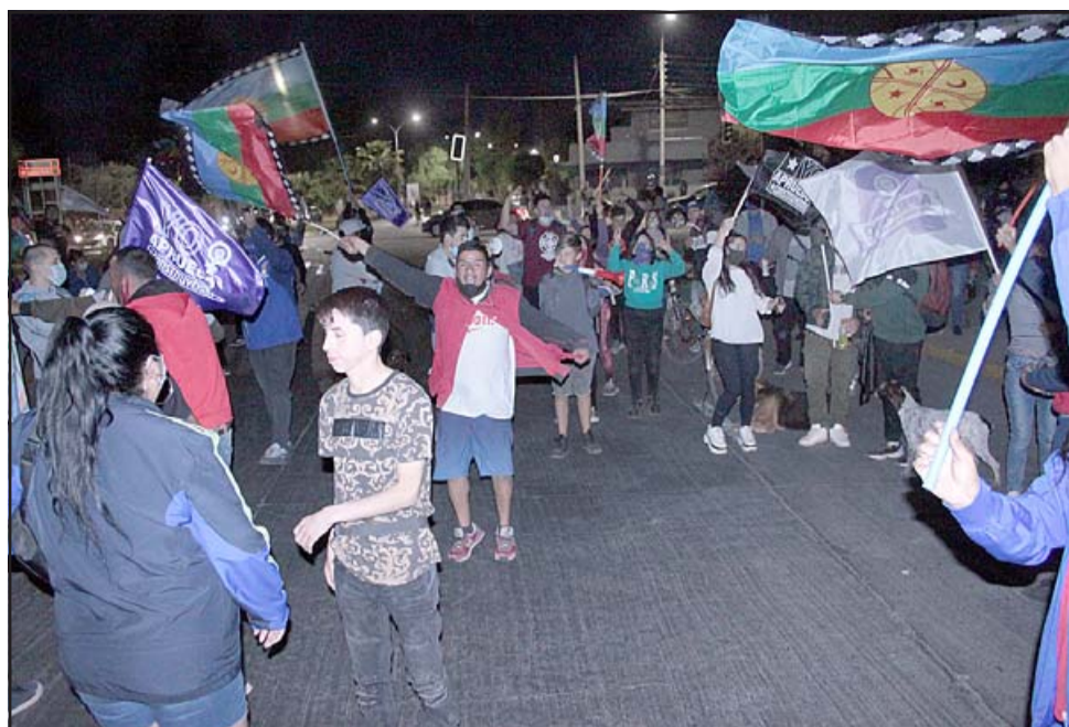
LOCURA POR EL APRUEBO. - Al final de la jornada la gente se dio cita de manera espontánea en la esquina de la cancha de tenis, en Yungay con Chacabuco.

En todo caso hubo buenos comentarios de la gente, en el sentido que estuvo muy expedito, fue una palabra que se usó mucho ayer