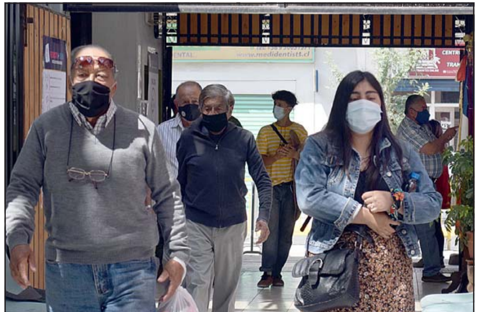
UNA NUEVA RUTA.- A paso firme como estos sanfelipeños, así se hicieron escuchar varios millones de chilenos este domingo de manera pacífica.