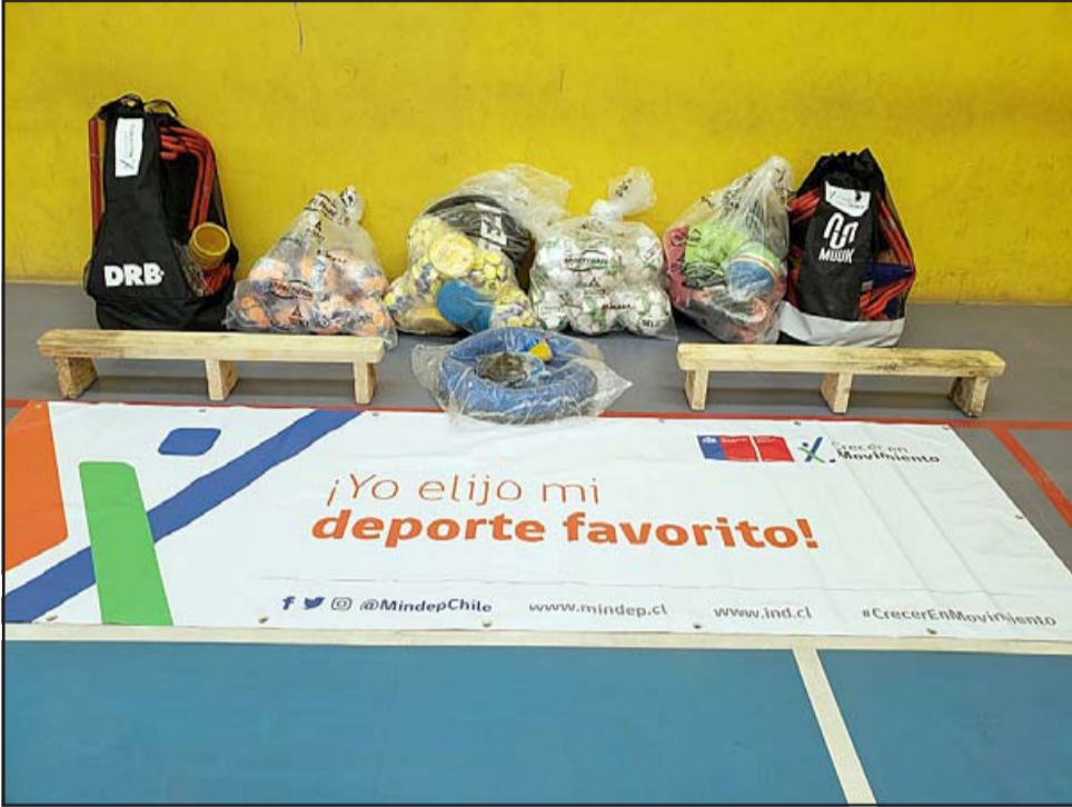
El material está destinado a los talleres que se imparten en el Liceo Corina Urbina.

El profesional agradeció la entrega realizada por el IND, ya que viene a facilitar la práctica deportiva de las alumnas del establecimiento educacional sanfelipeño, que se ha caracterizado por impulsar el deporte entre las jóvenes.