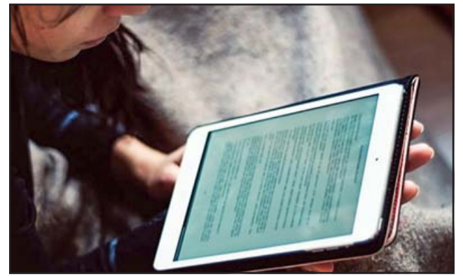
El Concejo Municipal aprobó para la adquisición de Tablets con conexión a Internet para ser entregadas a los alumnos más vulnerables del sistema municipal.

«Los Tablets valen alrededor de 160.000 pesos, los