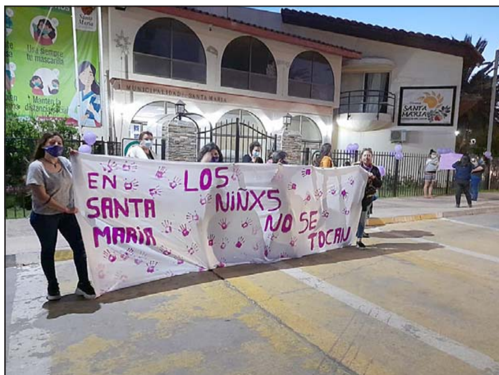
Las mujeres de Santa María una vez conocida la noticia salieron de inmediato a la calle.

Los antisociales fueron identificados como C.C.N.A. (26), J.J.F.M. (23), D.E.F.M. (32), M.A.A.G. (34), B.J.V.S. (26), todos con domicilio en Los Andes y el menor J.I.S.H. (17) con residencia en Colina. Cabe recordar que en 2017 M.A.A.G. y B.J.V.S. fueron detenidos por asaltar una parcela en el sector El Carrizo en la comuna de San Esteban, donde se hicieron pasar por oficiales de la PDI. La totalidad de los aprehendidos quedó a disposición del Juzgado de Garantía para ser formalizados por diferentes ilícitos.