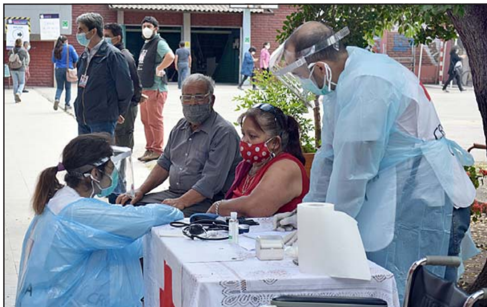
SIEMPRE PRESENTE. - La Cruz Roja también se entregó por completo al servicio de quienes necesitaron un empujoncito durante la pesada jornada.