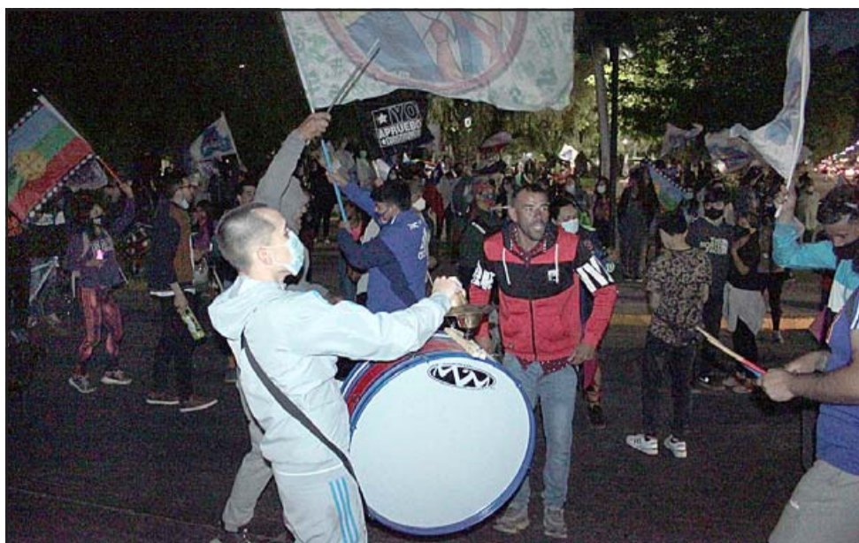
CELEBRANDO. - Las cámaras de Diario El Trabajo registran el carnaval que se armó en la esquina de la cancha de tenis 40 minutos después de cerradas las urnas.

Se supo de algunos reclamos por la demora en la constitución de mesas, pero definitivamente eso se solucionó.