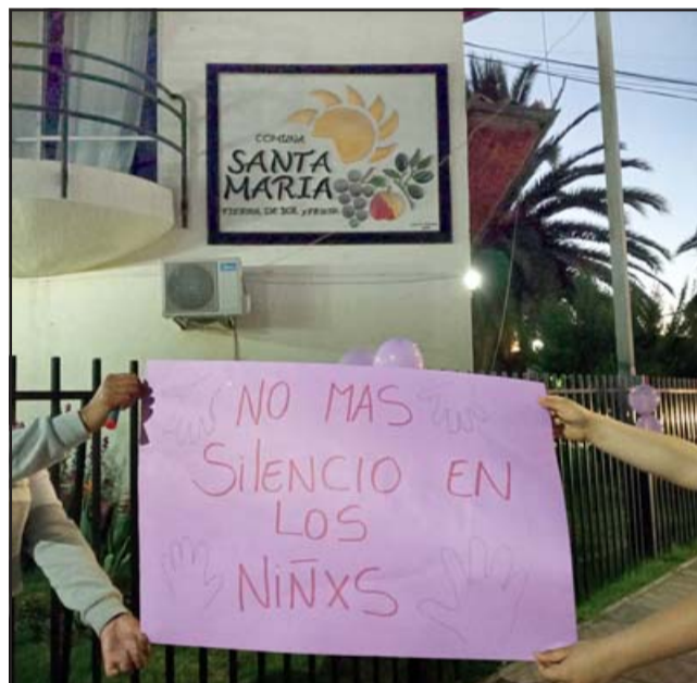
Frases en apoyo a los niños se pudo leer, luego que el imputado fuera nuevamente formalizado por más cargos de abuso sexual.

Cabe recordar que el imputado estaba cumpliendo Arresto Domiciliario en su casa en Santa María.