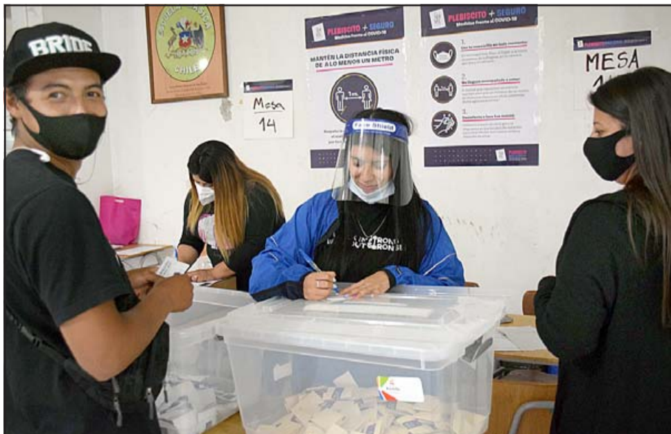
AL FINAL DEL DÍA.- La Mesa 14 fue una de las primeras en iniciar el conteo de votos en el Liceo Roberto Humeres.