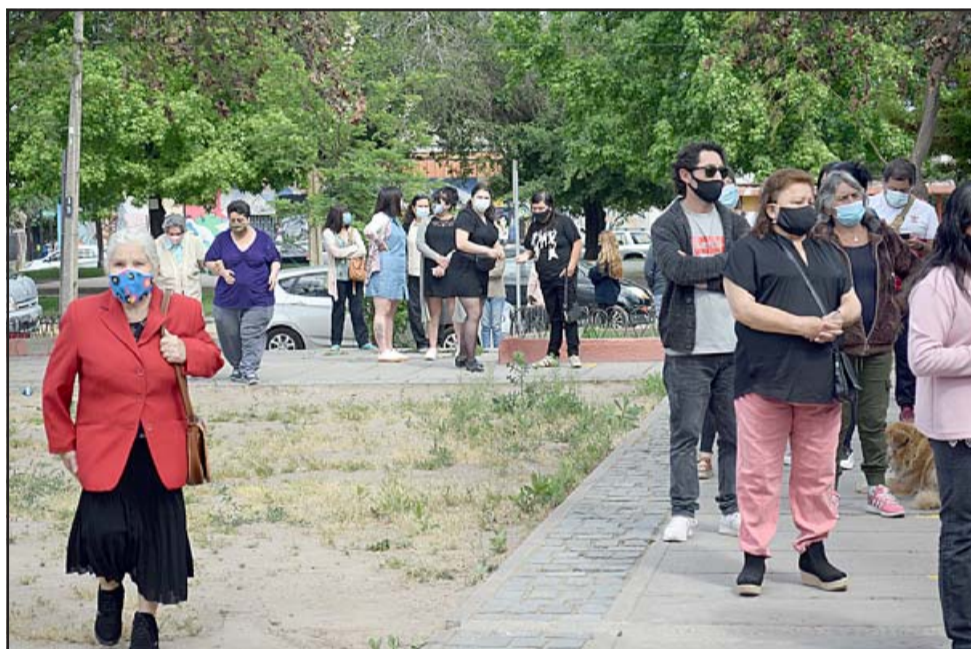
CIUDADANOS DE ORO. - Las filas fueron muy largas, pero los adultos mayores no debieron esperar mucho.