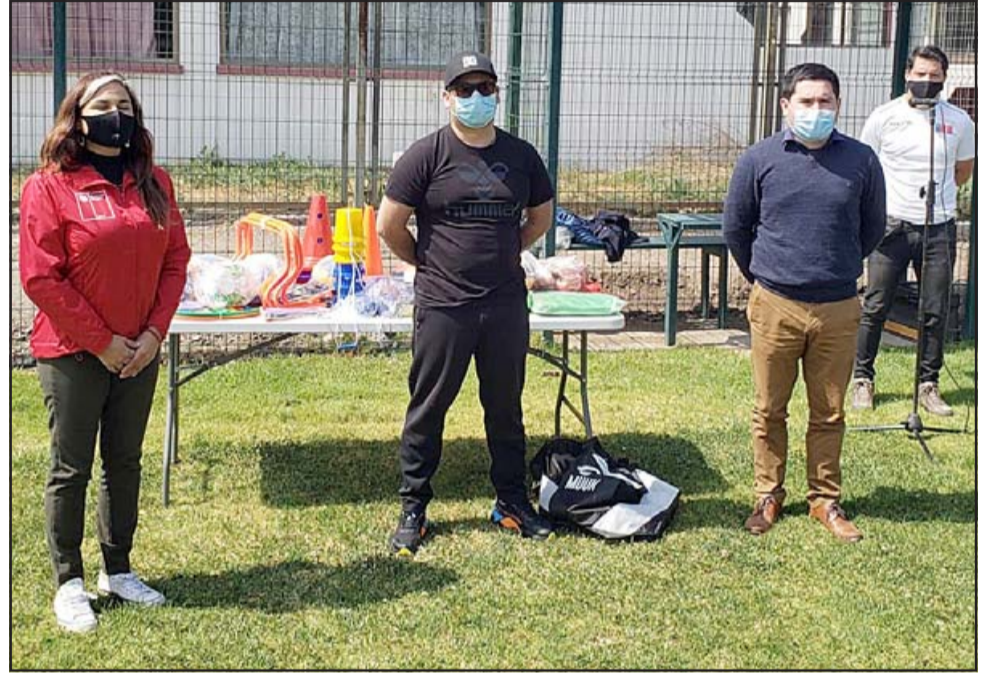
La ceremonia se realizó en la comuna de Panquehue. El material deportivo fue entregado a los distintos talleres que se desarrollan en diferentes comunas de la provincia.

Te invitamos a seguir estas recomendaciones para prevenir eventuales contagios del COVID-19