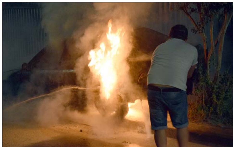
Con una manguera de jardín el propietario del vehículo intenta desesperadamente apagar el fuego.

Reiterar que el incendio intencional del automóvil se produjo este domingo 25 de octubre a eso de las 22:00 horas aproximadamente, en la intersección de las avenidas Michimalonco con Julio Montero.