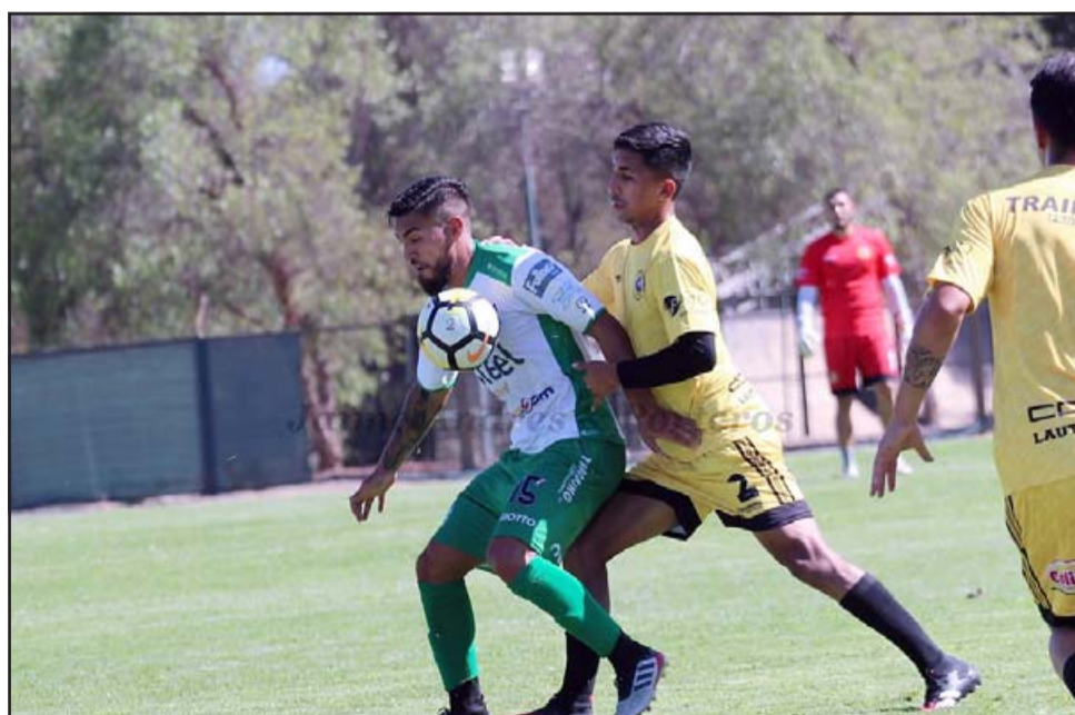
Ante la imposibilidad de usar el estadio Regional Trasandino jugará sus duelos de local en el estadio Municipal de San Felipe.

El directivo reconoció que en un principio la idea era jugar en La Calera, pero como el Municipal de San Felipe fue visado por la autoridad, de inmediato se convirtió en la primera opción. «La Calera era el primero, incluso el Santa Laura, pero felizmente San Felipe tiene su estadio aproba-