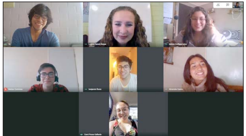
Los alumnos participantes lograron un destacado resultado en la primera etapa y ahora se encuentran en una segunda parte de las olimpiadas.

que mantendrán la relación del Mar para continuar realizando actividades en las distintas áreas del conocimiento.