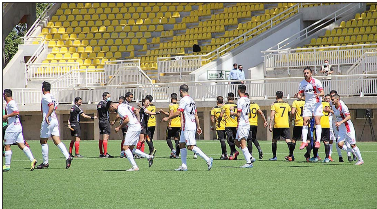
Unión San Felipe y San Luis serán los encargados de abrir los fuegos en la rueda de revanchas del torneo de plata del fútbol chileno.