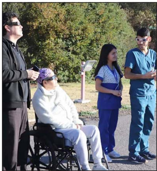
TARDE INOLVIDABLE. - Aquí la vemos la tarde del martes 2 de julio de 2019, cuando profesionales del CRI la sacaron al patio para ver el Eclipse.