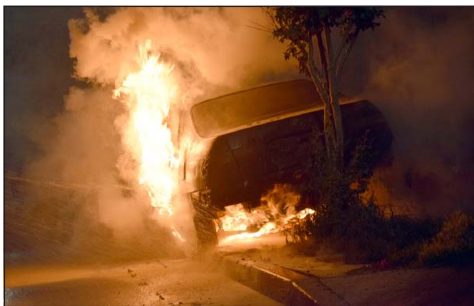
En la imagen se puede apreciar el vehículo prácticamente envuelto en llamas, el que sufrió severos daños.