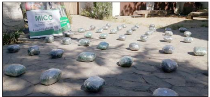
Un total de 46 paquetes de marihuana fueron incautados, droga que se encuentra avaluada en 470 millones de pesos.

to, el imputado provenía de la ciudad de Parral. «Realizó un viaje hasta la ciudad de Ovalle de la cual provenía al momento de su fisca-