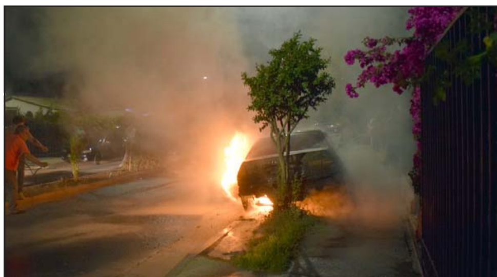
El incidente causó bastante expectación en el sector, llamando la atención de numerosos vecinos que contemplaban atónitos lo sucedido.