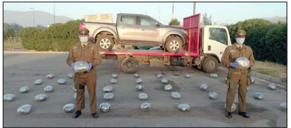
En la imagen personal de Carabineros sostiene la droga, atrás el camión y la camioneta donde se transportaba la marihuana elaborada.

Este procedimiento contó con la asesoría de personal del OS-7 de Aconcagua, y según indicó el subprefec-