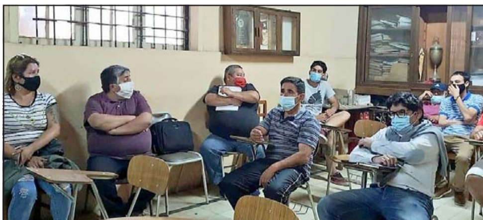
A la cita asistió la mayoría de los presidentes de los clubes que son parte de la asociación de fútbol de San Felipe.

pio. La verdad yo sigo en el predicamento de 'ver para creer' y solo resta esperar que de una vez por todas logremos algo y al fin las promesas sean una realidad», afirmó el dirigente.