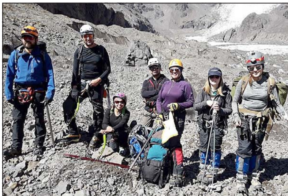
El Club de Montaña Santa María también resultó favorecido con el Fondo Social Presidente de la República.