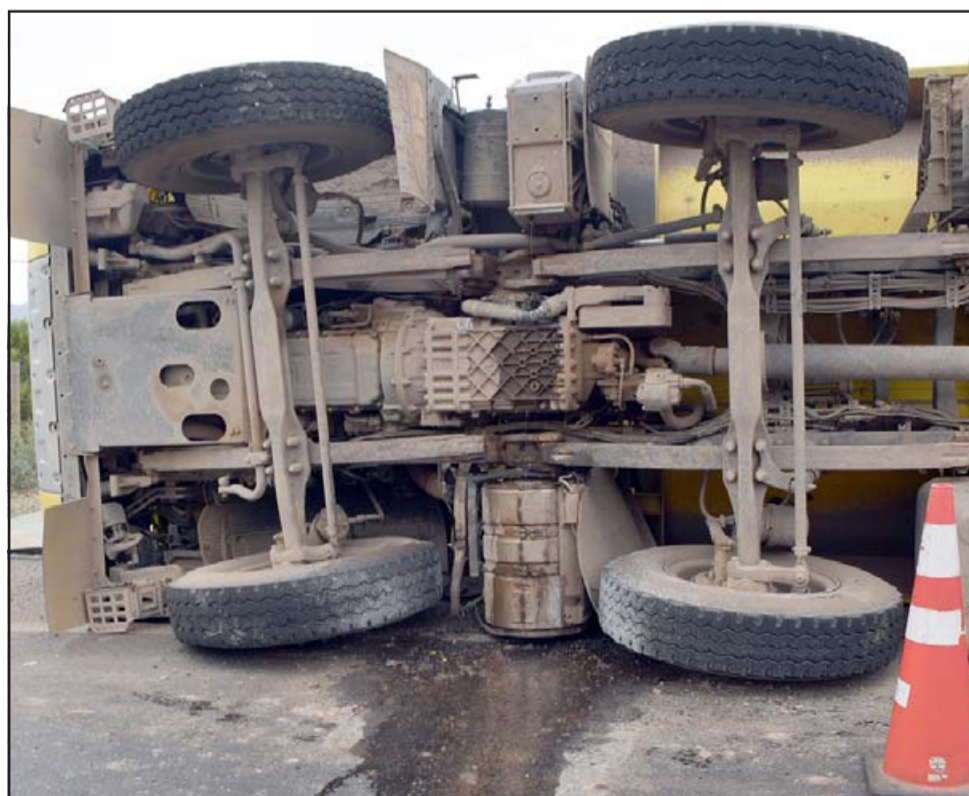
PELIGROSO ESCENARIO.- El combustible del pesado camión se derramó, pero no hizo explosión.