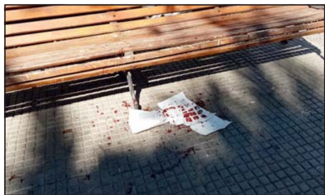
Rastros de sangre quedaron en el lugar de la agresión.

posteriormente una de las afectadas fue herida con un arma cortante en la espalda y la otra víctima, que era su hermana, fue herida con la misma arma cortante en su mano derecha.