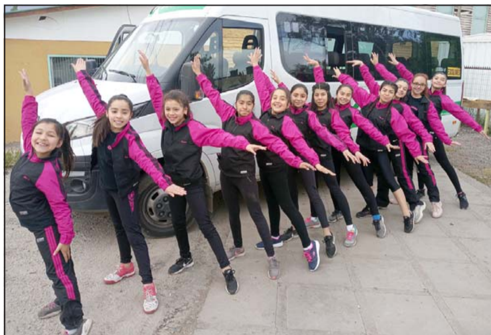
TREMENDAS PATINADORAS.- Ellas son las regalonas artistas de la Academia de Patinaje Artístico Sol del Valle Aconcagua.