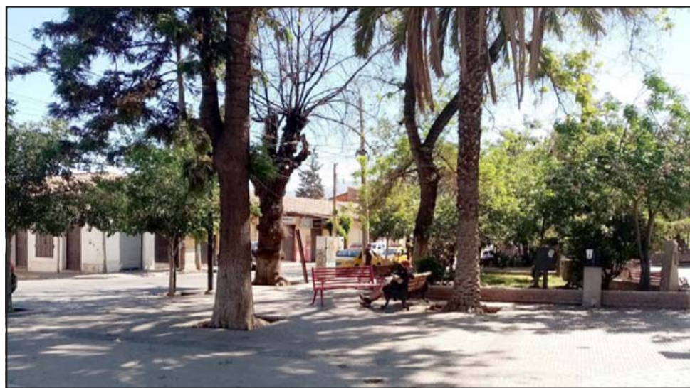
En este lugar se produjo la agresión.