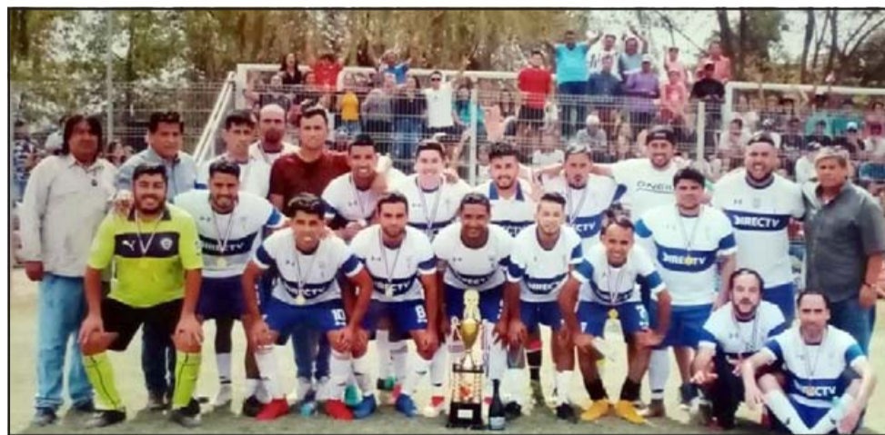
ALIANZA CATÓLICA.- Ellos son la tercera serie del Club Deportivo Alianza Católica de El Llano, quienes reciben estos recursos justo a tiempo.