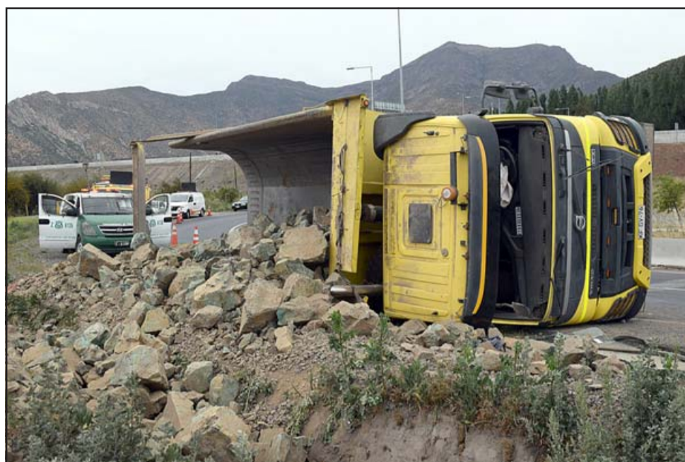
LA ROTONDA MALDITA.- Nuevamente en la rotonda Lo Campo vuelve a ocurrir otro volcamiento de camión, esta vez se trató de esta tolva cargada de mineral.