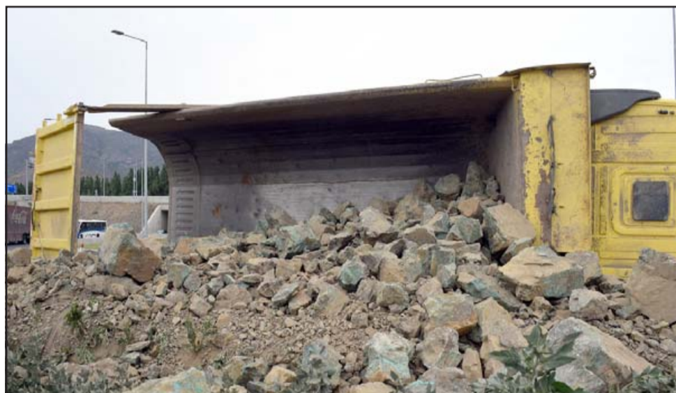
LA MISMA HISTORIA.- Debajo de estas piedras pasa un canal de regadío, en esta ocasión estaba seco.