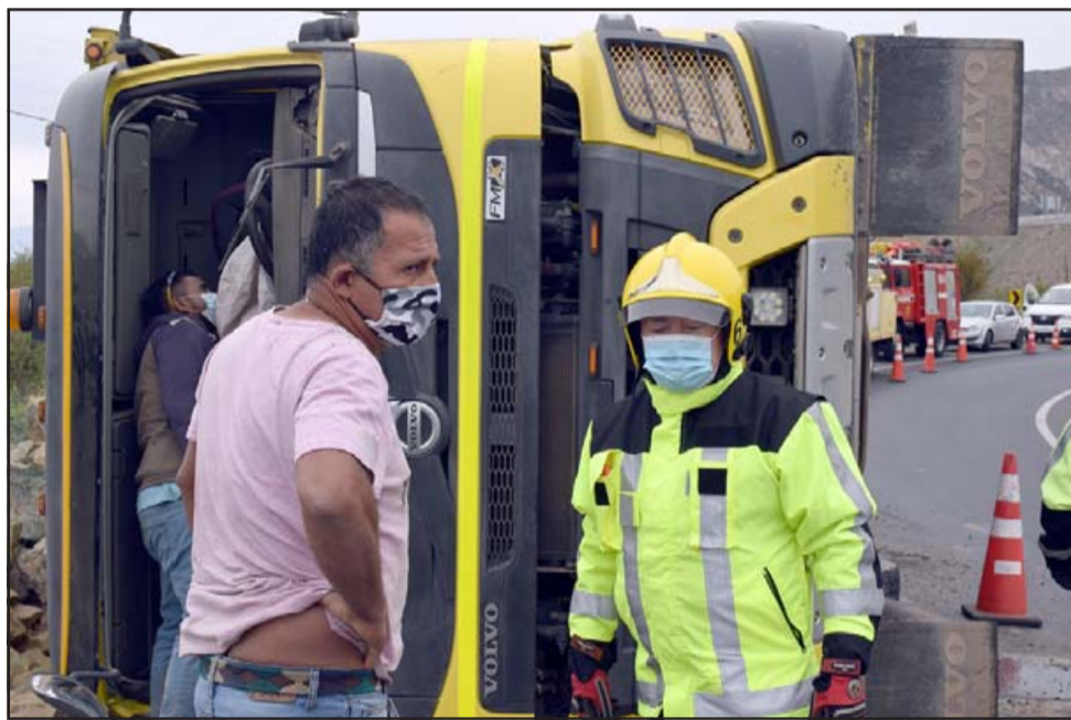
EN EL LUGAR.- Las cámaras de Diario El Trabajo registran el momento en que este bombero le informa al conductor que ya puede hacerse cargo de su camión y retirarlo del lugar.