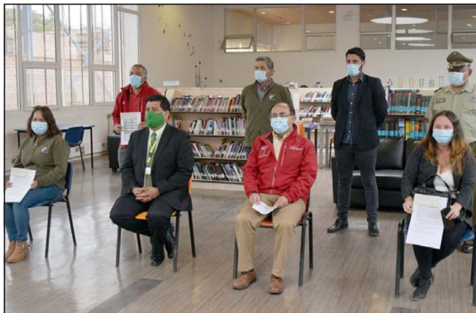
LLEGAN RECURSOS.- La entrega de estos cheques se realizó en la Biblioteca Pública Gabriela Mistral en el centro de Santa María.