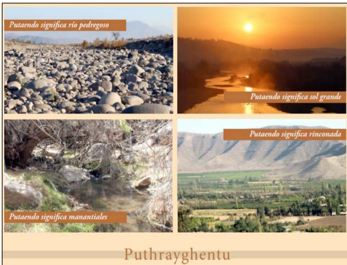
OLOR A PUTAENDO.- La palabra 'Putaendo' significa 'Río pedregoso', pero en el Imaginario Colectivo cada población de dicha comuna lleva su esencia en cada uno de sus rincones.