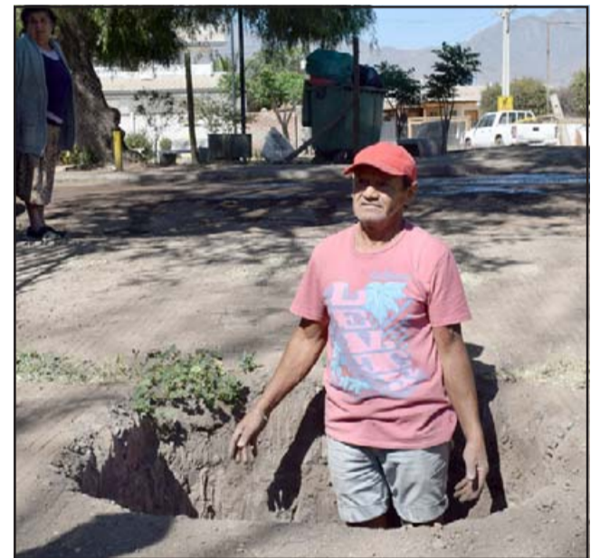
PELIGRO EN SU PATIO.- En la entrada de su casa la empresa constructora hizo hoyos profundos, lo que impide el tránsito seguro para los vecinos.