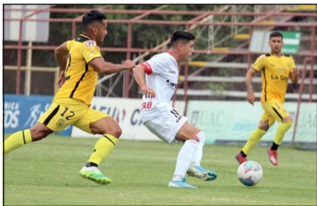
Unión San Felipe cumplió una mala y preocupante presentación en el arranque de la segunda rueda.

Por más que se mire desde una óptica positiva, no es un ejercicio simple intentar encontrar puntos positivos tras la actuación frente a San Luis de Quillota. Terminar valorando un empate en calidad de local, es un serio llamado de atención respecto a que hay cosas que deben mejorar con urgencia, porque de lo contrario, y si no se hacen las correcciones, el equipo estará -en lo futbolístico ya está- lejos de los objetivos planteados para este 2020.