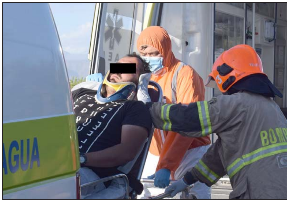
MUCHOS HERIDOS.- Los heridos trasladados fueron cinco, pero otras tres personas resultaron con golpes leves y erosiones que no ameritaron ser llevadas al centro hospitalario.