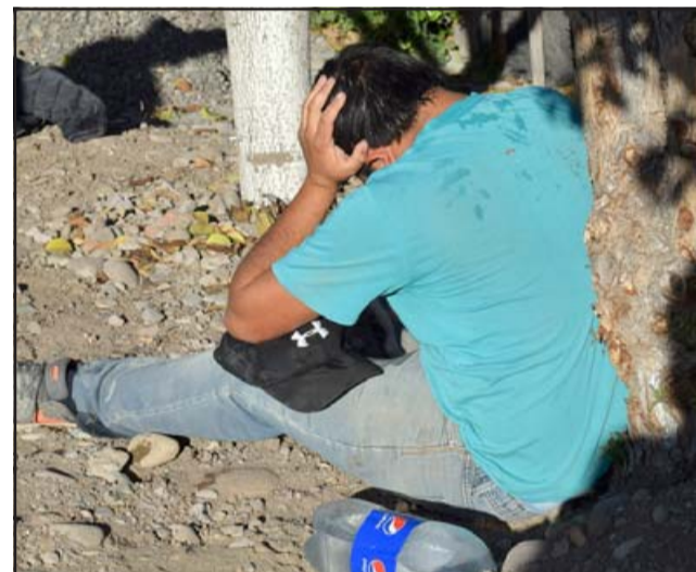
EN EL LUGAR.- Antes que los paramédicos atendieran a esta persona ya las cámaras de Diario El Trabajo estaban ahí, cerca del accionar de los profesionales del SAMU y Bomberos.

CHOQUE FULMINANTE.- Esta es la camioneta que venía de Panquehue a San Felipe, según testigos su conductor no pudo evitar la colisión.