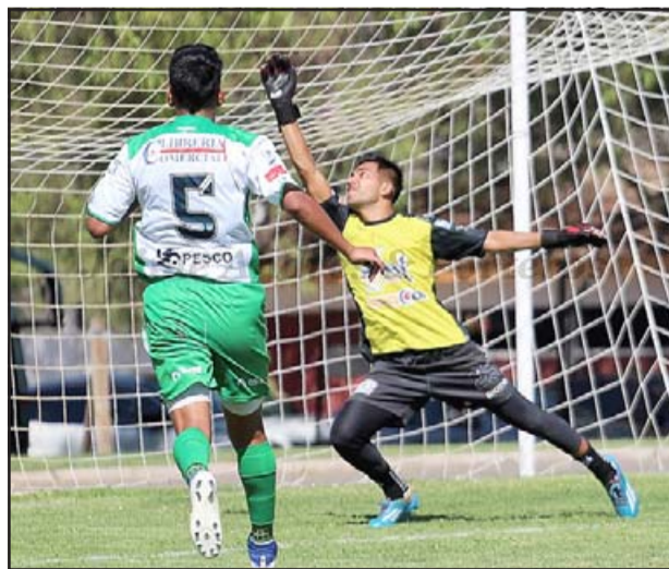
Tras meses de inactividad, para ayer en la tarde estaba agendado el retorno de Trasandino a los entrenamientos.

circulado con mucha fuerza el rumor que éste sería por grupos a raíz de que están contra el tiempo. La idea es armar tres zonas (Norte, Centro, Sur) de cuatro equipos cada