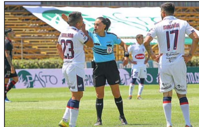
La sanfelipeña impartiendo justicia en el duelo jugado en La Pintana.