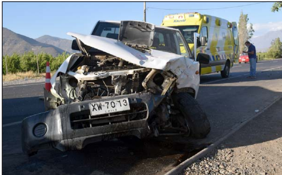
TRÁGICO ATARDECER.- Esta fue la camioneta que habría generado la triple colisión, según testigos, las responsabilidades las determinarán las autoridades pertinentes.