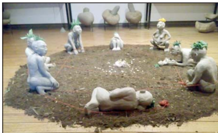
MUSEO COMUNITARIO.- Muchas son las etapas históricas del valle de Putaendo recreadas en estas salas museográficas.