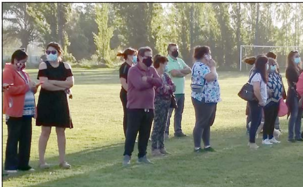
BUSCAN SOLUCIONES.- Los vecinos han realizado varias reuniones con la empresa a cargo de las obras y esperan que sus reclamos sean atendidos.