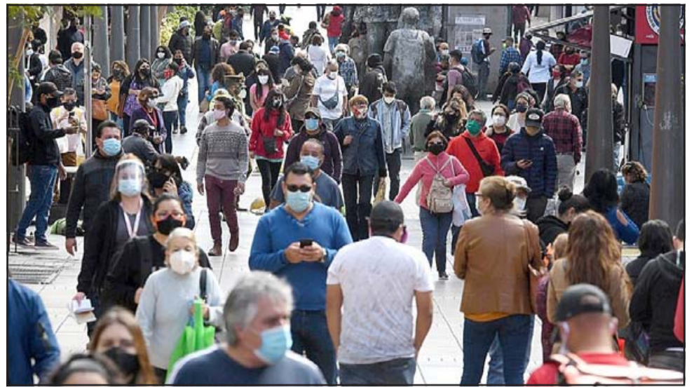
SALIENDO POCO A POCO.- Mientras que en la Región Metropolitana ya algunas comunas están en Fase 4 de Apertura a partir de esta semana, en el Valle de Aconcagua seguimos esperando avanzar también.