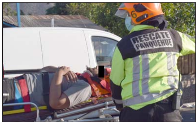
SIEMPRE BOMBEROS.- También Bomberos de Panquehue estuvieron brindando asistencia médica a los heridos.

ese instante estaba en el lugar de los hechos.