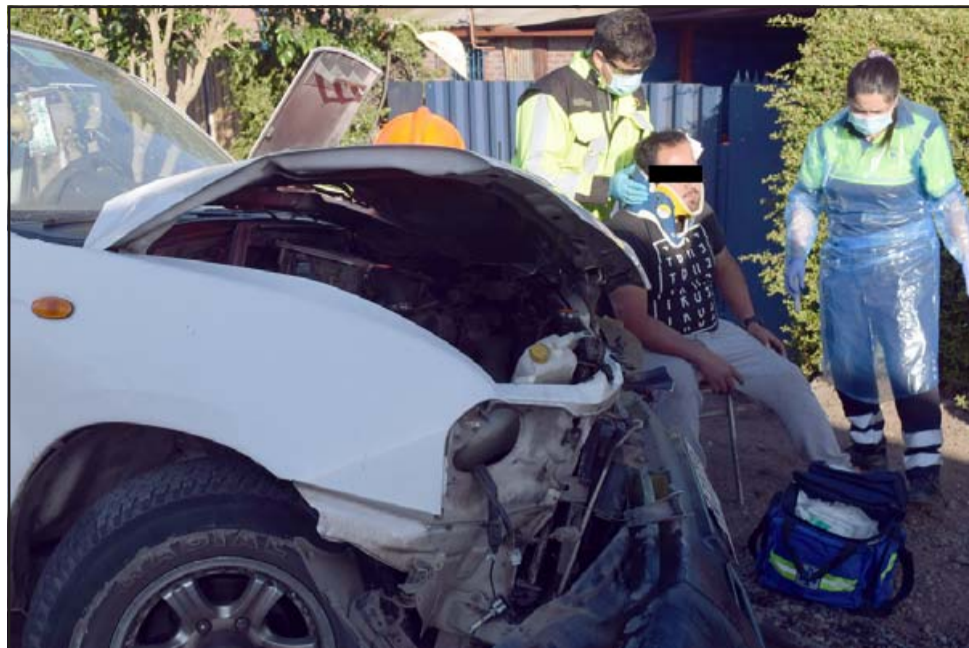
MILLONARIOS DAÑOS.- Al fondo tenemos a uno de los heridos que viajaba en esta camioneta, quien fue trasladado al Hospital San Camilo.