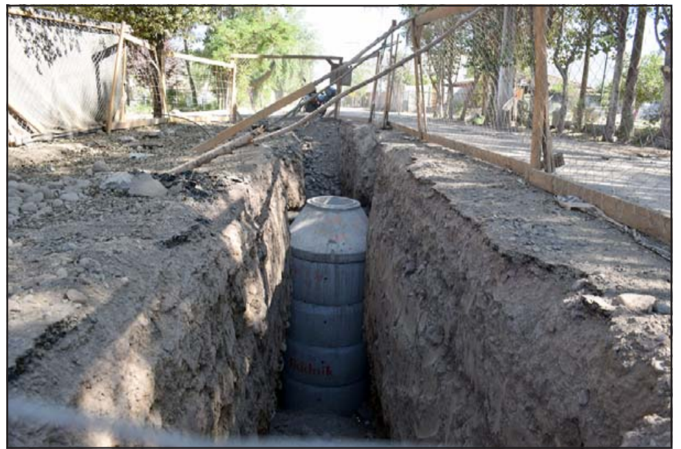
PELIGRO EN EL CAMINO.- Esta es sólo una de las tantas fosas abiertas en la calle principal de La Troya, no la cierran, no la habilitan ni permite el libre tránsito a los vecinos.

que están remojando pero el resto del tiempo no lo han hecho, sabemos de algunos pasajes donde instalan las cámaras y cierran, a los días regresan y vuelven a romper porque cierran sin probar las cámaras».