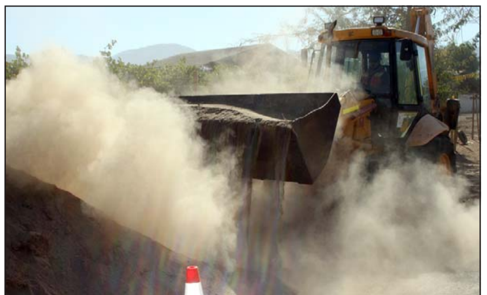
TRAGANDO POLVO.- Todos en La Troya aceptan algunas incomodidades, pero no por tantos meses.