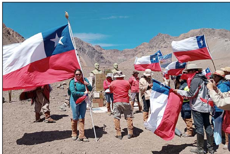
FALTA MUY POCO.- La tradicional cabalgata próximamente podría establecerse de manera oficial como una ruta oficial histórica, patrimonio nacional y de la humanidad.

tora cultural parte de Corporación Cultural de Putaendo: «Un trabajo cooperativo que reúna las fuerzas de estas organizaciones puede concretar un trabajo serio que releve realmente el valor histórico, social, cultural e identitario de la ruta. Quizá estamos a las puertas de una iniciativa que transforme la realidad provincial, por eso el apoyo profesional es muy necesario para su concreción». En Diario El Trabajo también invitamos a las personas y comunidad toda a sumarse a esta empresa, escribiendo a: putaendocultural@gmail.com