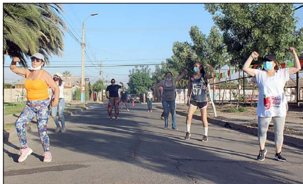
VIBRANDO CON LA ZUMBA.- Aquí están las vecinas en plena Zumba, no hubo tiempo para descansar.