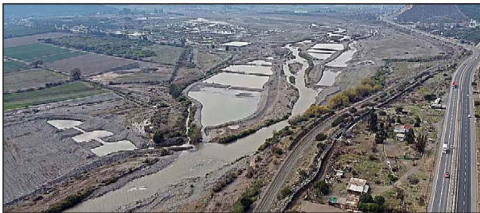
Este convenio regirá hasta fines de abril de 2021, y permite priorizar el consumo humano ante la mega sequía que afecta a la región.

Para priorizar el consumo humano, el acuerdo considera que durante el turno de 36 horas, Esvál