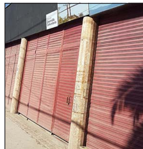
Los montos cuestionados en la Dideco bordean los 100 millones de pesos (en un caso 83 millones y en otro 23), resultado de una investigación sumaria en curso.