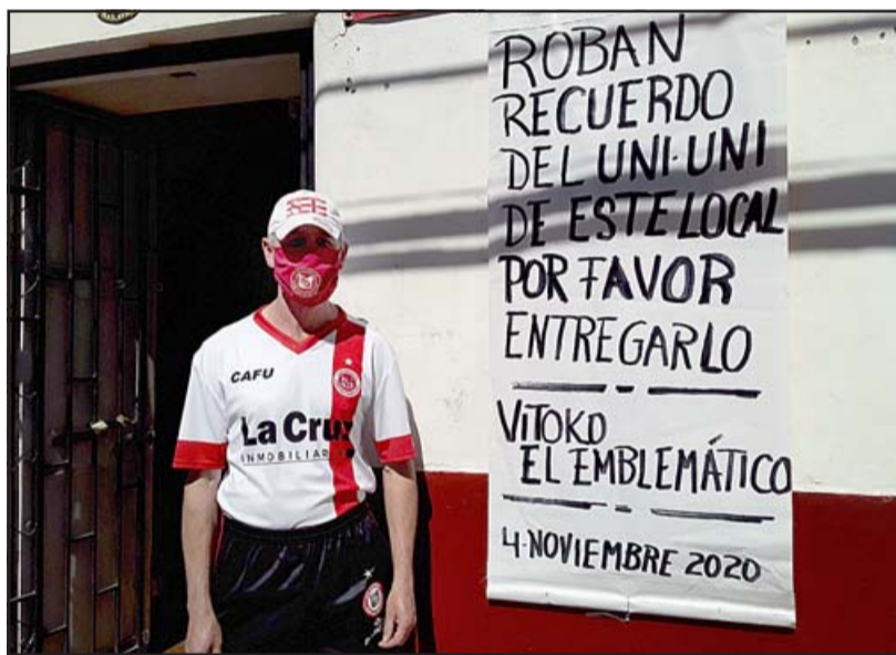
Con un letrero cuenta su desgracia del robo de la camilla de madera usada por los históricos del Uni Uni.

mación, es fácil de identificarla, porque está con la insignia de Unión San Felipe, la van a ubicar de inmediato, yo la ponía acá afuera de mi local en Traslaviña y me la sacaron, por eso reitero si alguien sabe algo me avise por favor, porque es un patrimonio no tan solo mío sino que del hincha de la gente en general de San Felipe», indicó. Reiteró que se trata de una camilla de madera.