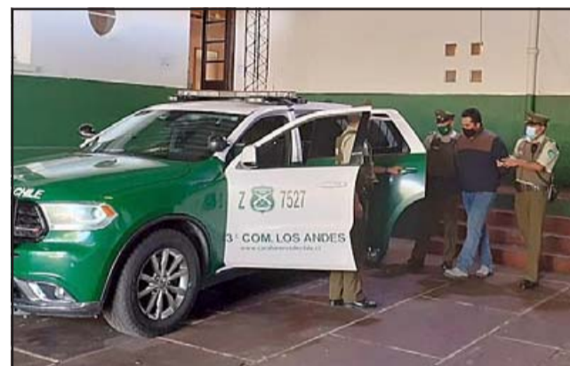
El agresor fue detenido por Carabineros y la Brigada de Homicidios quedó a cargo de las diligencias para establecer las circunstancias del hecho.

Según se pudo conocer, la víctima fatal mantenía antecedentes policiales y en junio de este año había ingresado a robar a una parcela de esa comuna, ocasión en que disparó un tiro de escopeta al cuidador quien resultó con diversas lesio-