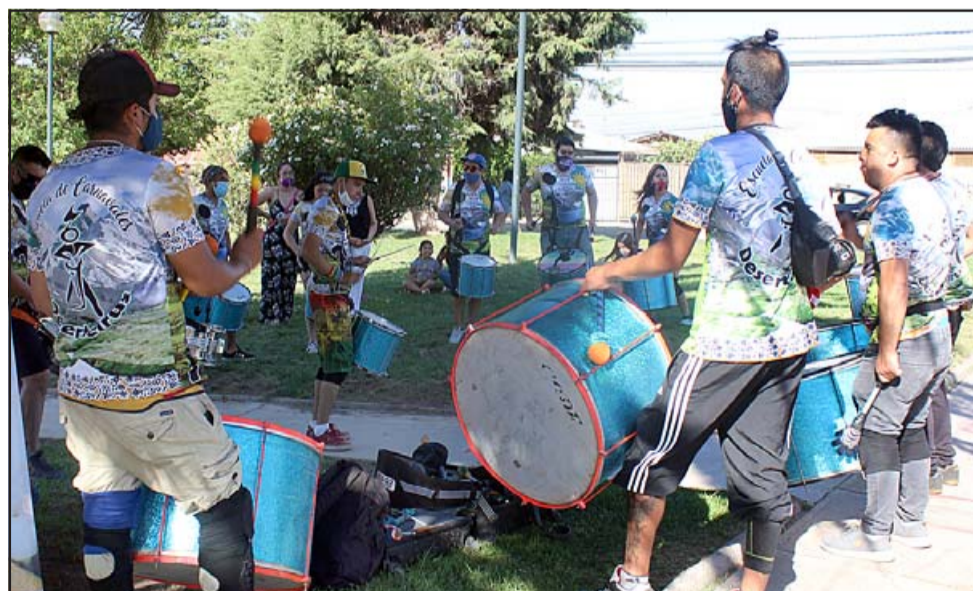
VUELVEN A LA CARGA.- Deserteirus, la tremenda batucada de Aconcagua, también hizo retumbar sus tambores.