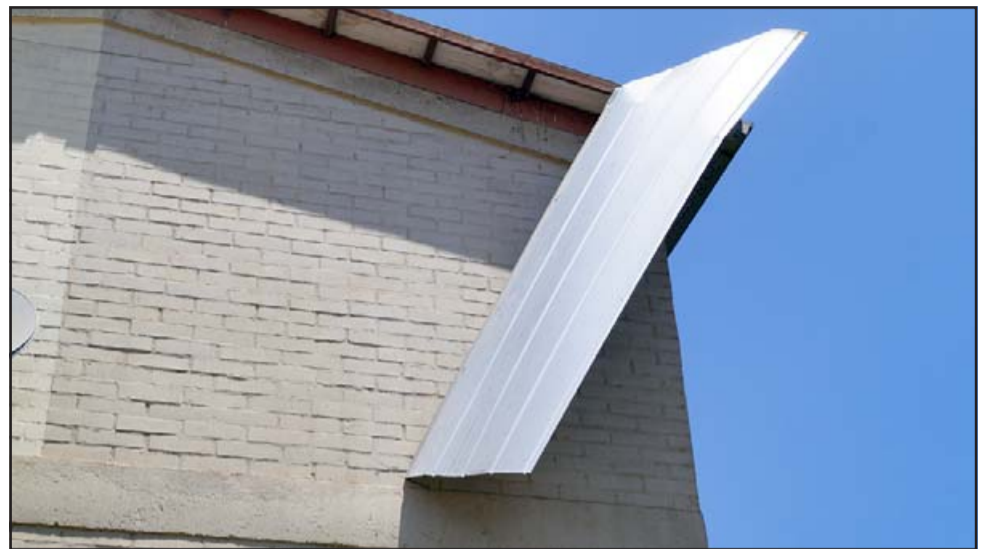
PELIGRO INMINENTE.- Así luce esta peligrosa lámina desde hace cuatro meses cuando el viento la removió del resto de la techumbre.