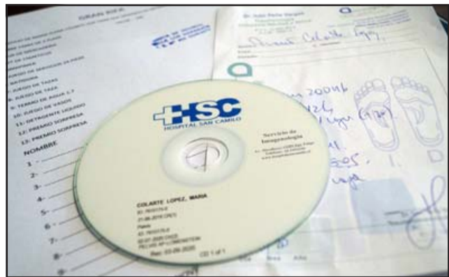
A COMPRAR NÚMEROS.- Diario El Trabajo revisó documentos e imágenes del Hospital San Camilo relacionadas a este problema de salud de esta vecina.