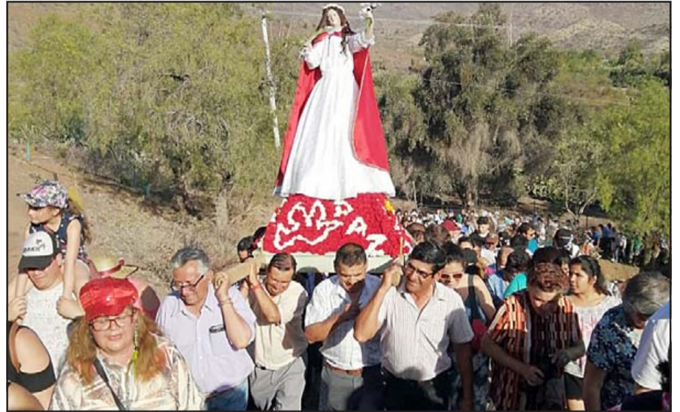
ANTES DEL COVID.- Así lucían las calles de Santa Filomena y cada rincón de Santa María cuando la imagen era llevada en andas antes de la pandemia.

El corrido inició a las 15:00 horas por toda la comuna de Santa María, partiendo desde la Capilla Sagrado Corazón de Jesús del sector El Pino, subiendo por Tocornal hacia Capilla San Pedro Apóstol El Llano, siguió luego por Población San Francisco en Calle Placilla, Foncea, entrando a Calle El Medio hacia Capilla San Vicente de Paul, bajando hacia Capilla Nuestra Señora del Carmen de San Fernando (No entró al Maitén) siguió por San Fernando hacia Santa María centro, (No entrando a Nieto Sur y Norte), bajando por Latorre hasta Población Los Robles, Calle El Canelo hasta Calle El Amancay, devolviéndose hacia Calle Rodríguez pasando por fuera de las poblaciones Padre Hurtado y Maraville, entrando a Población Roberto Huerta hasta Calle Irarrázaval, en dirección a la Plaza de Armas de Santa María, pasando