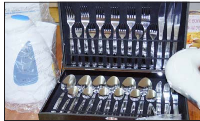
Aquí tenemos parte de los buenos premios de esta Rifa Solidaria a beneficio de esta vecina de Curimón.

- Hay un hervidor de agua eléctrico, un lujoso juego de cuchillería, una batidora eléctrica y una caja de mercadería,