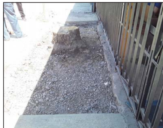
Acá está el tronco y la parte que no ha sido pavimentada y que le impide a la vecina Gladys poder salir con su madre recién operada en silla de ruedas.

- Es que tengo que sacarla en silla de ruedas y no puedo salir por ningún lado con la silla de ruedas, tenemos que sacarla casi en brazos.