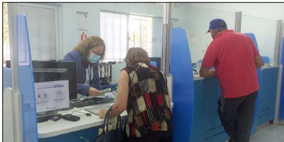
En un 50% se han reducido las filas y tiempos de espera en Fonasa San Felipe con las medidas que se han ido implementando.

A partir de lo anterior, el director regional de Fonasa, Gustavo Mortara , precisó que estas iniciativas complementarias tienen por propósito evitar que las personas acudan de manera presencial a la sucursal y así disminuir el riesgo de contagio por Coronavirus; además de hacer más rápida la