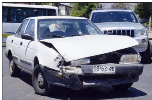
unidad del SAMU, la unidad de rescate R8 de Bomberos y Carabineros.

El choque de este martes no fue tan violento como los demás ocurridos en nuestra ciudad. En esta ocasión fueron dos autos menores los que colisionaron en el cruce Yungay con Chacabuco, sector cancha de tenis, resultando una persona lesionada, la que fue trasladada al Hospital San Camilo. Sólo este auto blanco resultó con daños materiales.