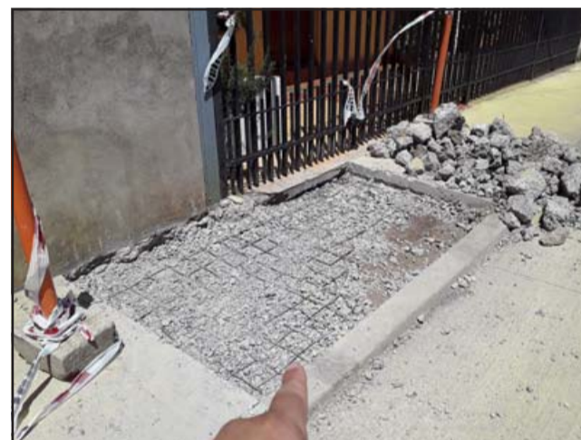
De trabajos de pavimento mal realizados se quejan los vecinos, los cuales tienen que estar siendo reparados.