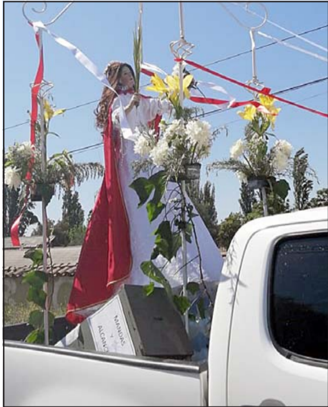
TRISTE PEREGRINACIÓN.- Así de solitaria lució este domingo la patrona de Santa Filomena al pasar por las poblaciones de esa comuna.

Cabras hasta Calle San Martín hasta la cancha luego bajando en dirección a La Higuera, pasando por fuera de Población David del Curto en dirección a Lo Galdámez, Tabolango, El Zaino, Jahuelito para terminar en el terreno del costado de portal del Hotel Jahuel (donde Bomberos ocupan los estacionamientos).