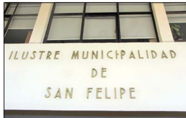
Funcionarios municipales a honorarios se declararon en estado de movilización a raíz del anuncio de despidos.

5. Lamentamos profundamente que las reiteradas declaraciones del Sr. Alcalde Suplente en los medios de comunicación promuevan ante la comunidad local y nacional el cuestionamiento la calidad técnica y ética como trabajadores, argumentando nuestra situación contractual, sin el justo proceso de evaluación. En relación a lo anterior es imperante clarificar que desde la constitución del Sindicato (año 2018) se ha solicitado enérgicamente a la autoridad de turno la incorporación de procesos de evaluación homogéneos, transparentes y anuales de los trabajadores, a objeto de validarnos en nuestra función técnica dentro del Municipio, sin embargo esa solicitud no ha sido acogida por ninguna de las administraciones que han transitado durante este periodo.