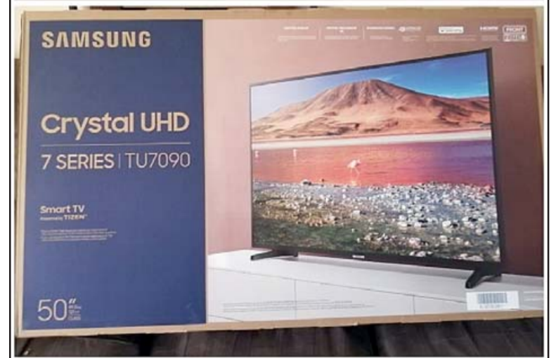
La lista junto al premio mayor, un smart TV de 50 pulgadas marca Samsung.