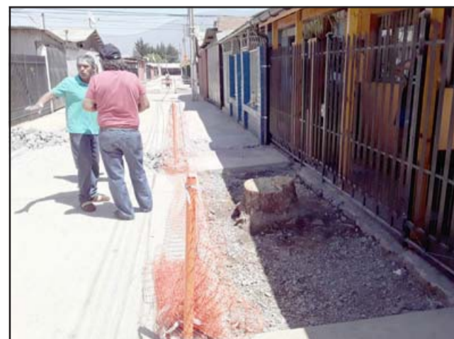
Los vecinos conversando sobre los problemas que hay en la pavimentación.