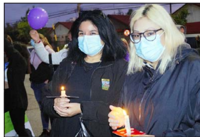
SIGUEN REZANDO. - Muchas personas también con sus velas en mano cantaron y rezaron el Padre Nuestro frente al hospital sanfelipeño.