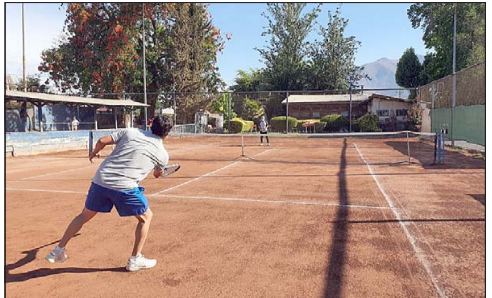
Preocupación han desatado los rumores sobre el traslado del centenario Club de Tenis de San Felipe.