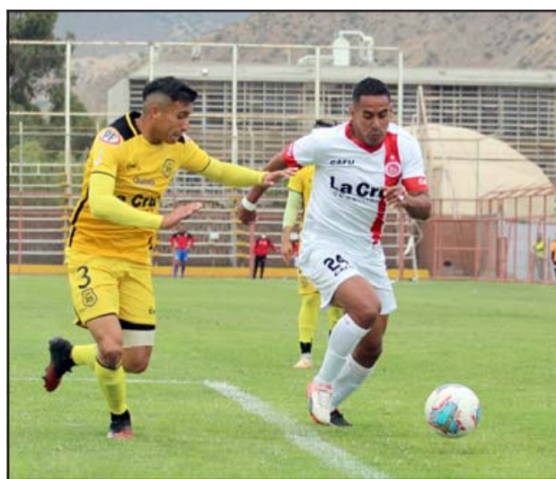
El lunes 30 de noviembre Unión San Felipe se pondrá al día en el torneo de la Primera B.

Con esto la escuadra sanfelipeña quedará en un buen pie, ya que en la práctica tendrá la posibilidad de jugar tres partidos seguidos como local, porque el 25 de este mes recibirá a Cobreloa, luego a Valdivia y posteriormente a Barnechea, en lo que se convertirá