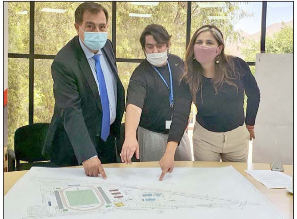
El proyecto tendrá un costo cercano a los seis mil millones de pesos y se estima que demorará cerca de tres años en completarse, proyectándose su desarrollo por etapas.

«San Felipe es un semillero de nuevos deportistas, lo que significa que hay nuevas disciplinas en las que podemos trabajar, de avanzar en esta propuesta», sentenció.