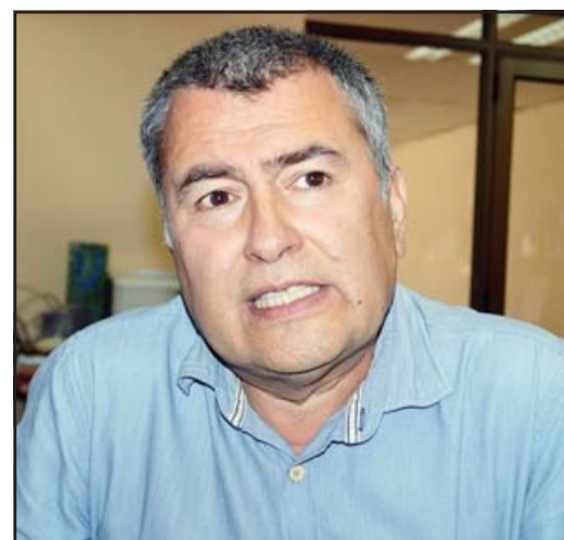
Exgobernador de San Felipe y actual Secpla de Santa María, Eduardo León Lazcano.

- Hoy día tenemos dos crisis fuertes que nos han hecho repensar nuestra forma de hacer las cosas y desarrollarnos, por eso tenemos que repensar San Felipe. Por un lado tenemos una crisis social producto de la pandemia, donde hemos visto a un Chile, a San Felipe, de manera cruda, ha sido un año muy duro este 2020, y vemos cómo la gente la ha pasado y la sigue pasando muy mal, creo que debiéramos tener una red de protección social mucho más fuerte, poder pedir con mayor fuerza el derecho al acceso a la salud, a la cultura, a la educación. Hemos visto también cómo esas fallencias se han manifestado en la necesidad de ollas comunes, entonces hay un eje importante que tiene que ver con el tema social, pero tampoco hay que olvidarse de la crisis ambiental muy fuerte, el cambio climático