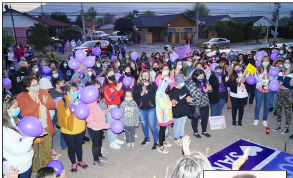
GRAN VELATÓN. - Más de 150 personas se dieron cita este martes en la noche en el frontis del Hospital San Camilo para dar fuerza a quien está con muerte cerebral.