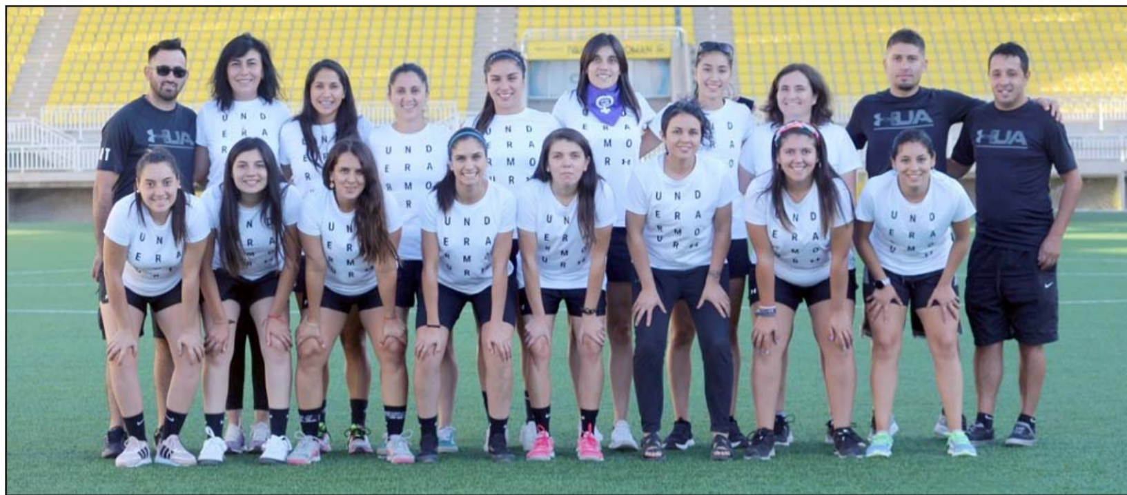
Alianza Curimón es uno de los equipos aconcagüinos que siguen en carrera en la Copa de Campeones de mujeres.

La realización de la parte final del torneo se programaría para el sábado 19 y