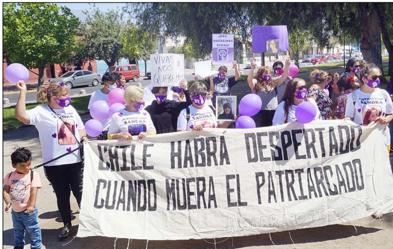
SIGUE LA PRESIÓN. - Este miércoles en la mañana y tarde, en el bandejón de Yungay con calle San Martín hubo otra manifestación.