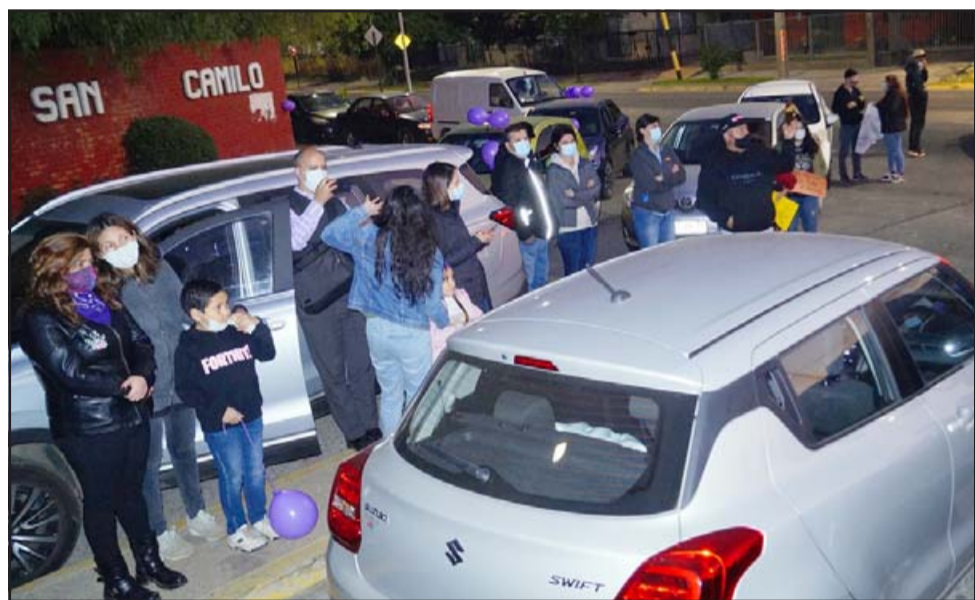
MASIVO APOYO. - Familias enteras llegaron al lugar, casi colapsaron la entrada del portón principal al estacionamiento del centro hospitalario en Avenida Miraflores.