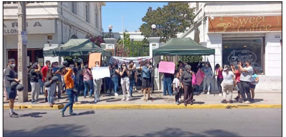
La comunidad educativa del Liceo Parroquial de Rinconada de Los Andes se manifiesta en el frontis de las oficinas del Obispado ubicadas en calle Merced, frente a la plaza de Armas de San Felipe.