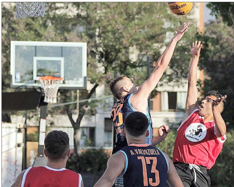
Por ahora y mientras no se llegue a la fase 5, en el seno de la ABAR sólo se piensa en un torneo 3 x 3.

minutos y experiencia, algo fundamental en la carrera de un futbolista, además que me entusiasma mucho la idea de llegar nuevamente a Primera con Unión San Felipe», finalizó.