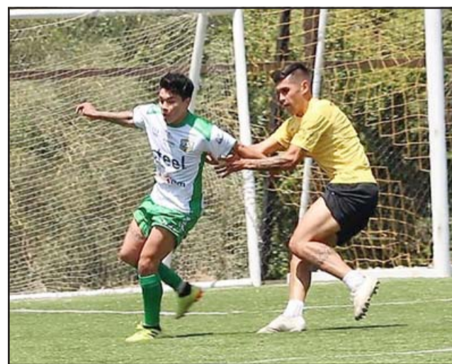
Trasandino ganó claramente su primer encuentro amistoso de Intertemporada.

Respecto al resultado y marcador con que finalizó el