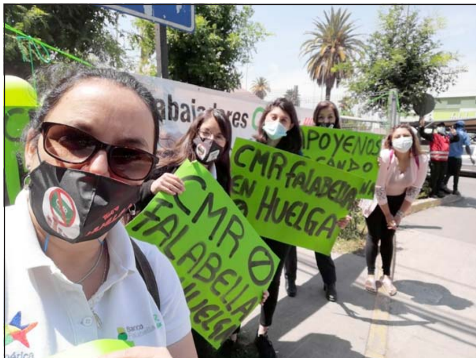
Trabajadoras de CMR frente al Open Plaza de Avenida O'Higgins.

En San Felipe oficialmente son 25 personas que trabajan para CMR, de las cuales 13 están en huelga porque el resto está traba-