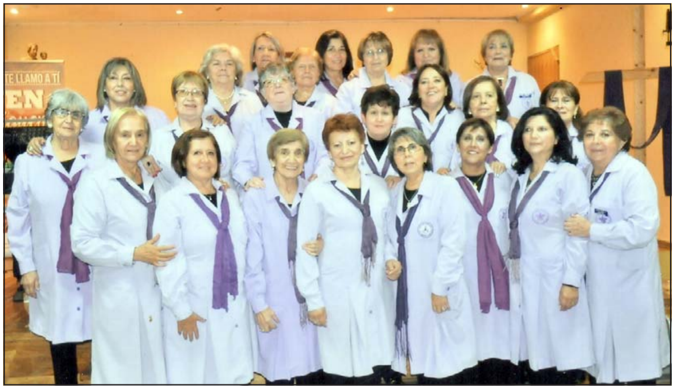
NUESTRAS DAMAS DE LILA.- Ellas son parte del voluntariado de amor que desinteresadamente atienden a las personas enfermas de cáncer en su fase terminal.

Según explicó esta profesional, ellas realizan sus rondas de visitas cada 15 días y