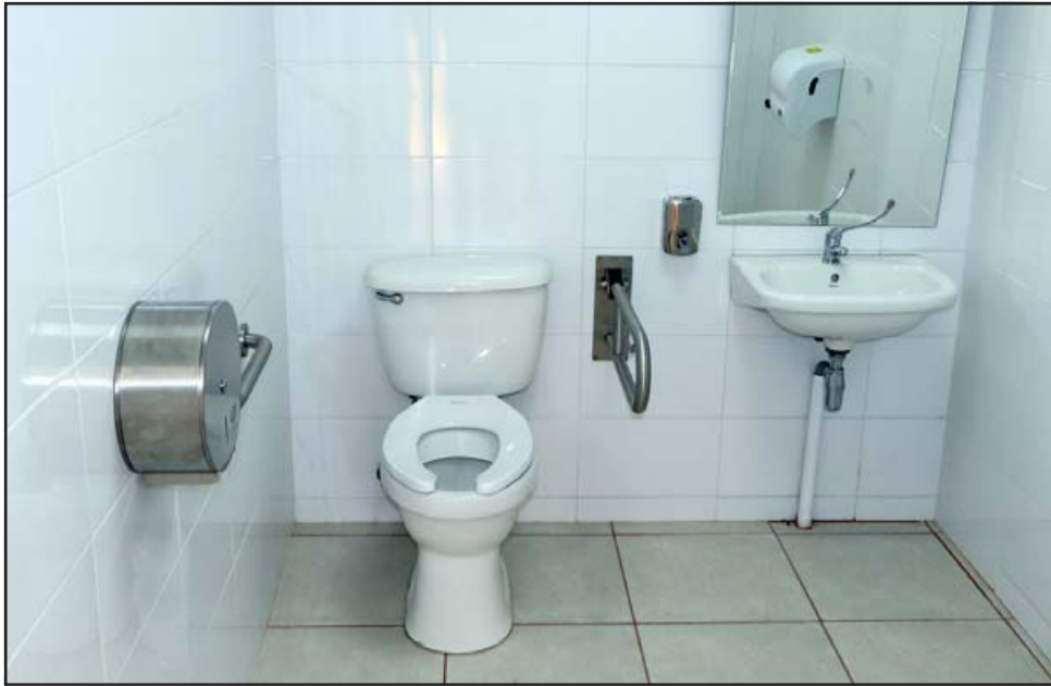
La obra ejecutada por mandato de la Municipalidad de Panquehue, fue financiada con recursos de la modalidad FRIL del Fondo Nacional de Desarrollo Regional (FNDR).