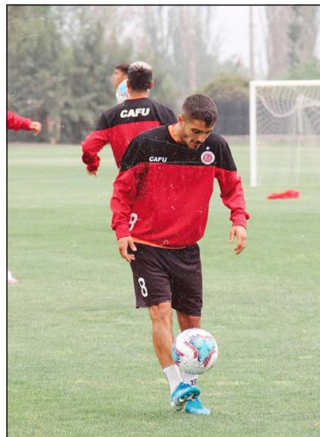
El equipo sanfelipeño intentará sacar partido del mal momento por el que atraviesa 'El Pije'.