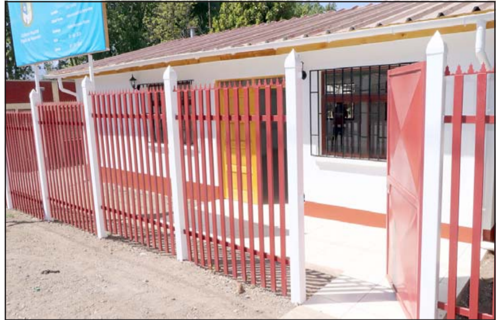
Esta es la fachada del nuevo edificio de la sede del Adulto Mayor del sector Viña Errázuriz en Panquehue.