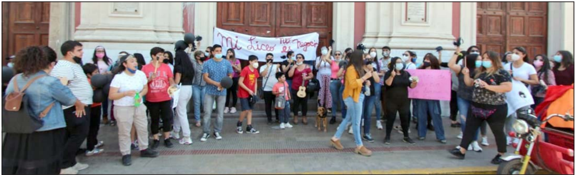
La manifestación también se llevó a efecto frente a la Catedral de San Felipe ubicada en calle Prat con Coimas.

El Liceo Parroquial Teresita de Los Andes de Rinconada, se encuentra ubicado precisamente en esa comuna, atiende una matrícula sobre los 500 alumnos aproximadamente, es particular subvencionado, pertenece al Obispado, pero siempre ha sido administrado por un particular, que en este caso es una profesora.