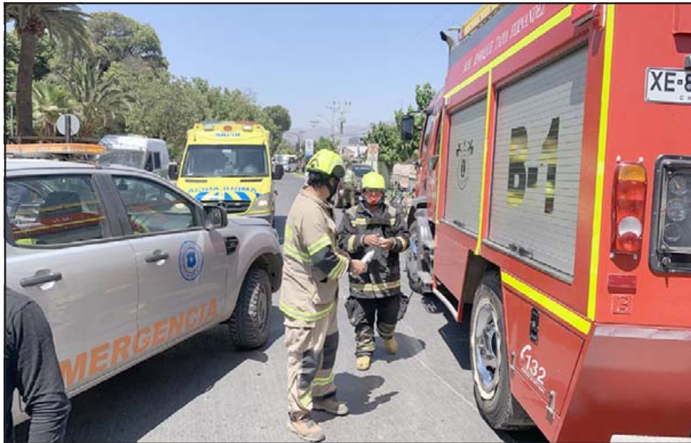
UNA TRAGEDIA. - La SIAT de Carabineros investiga esta tragedia, mientras que Bomberos también hizo su parte para salvar al adulto mayor.

Bomberos de Santa María a tener que acudir al lugar, llegaron a la emergencia dos ambulancias del SAMU, un móvil básico y uno avanzado, también Carabineros