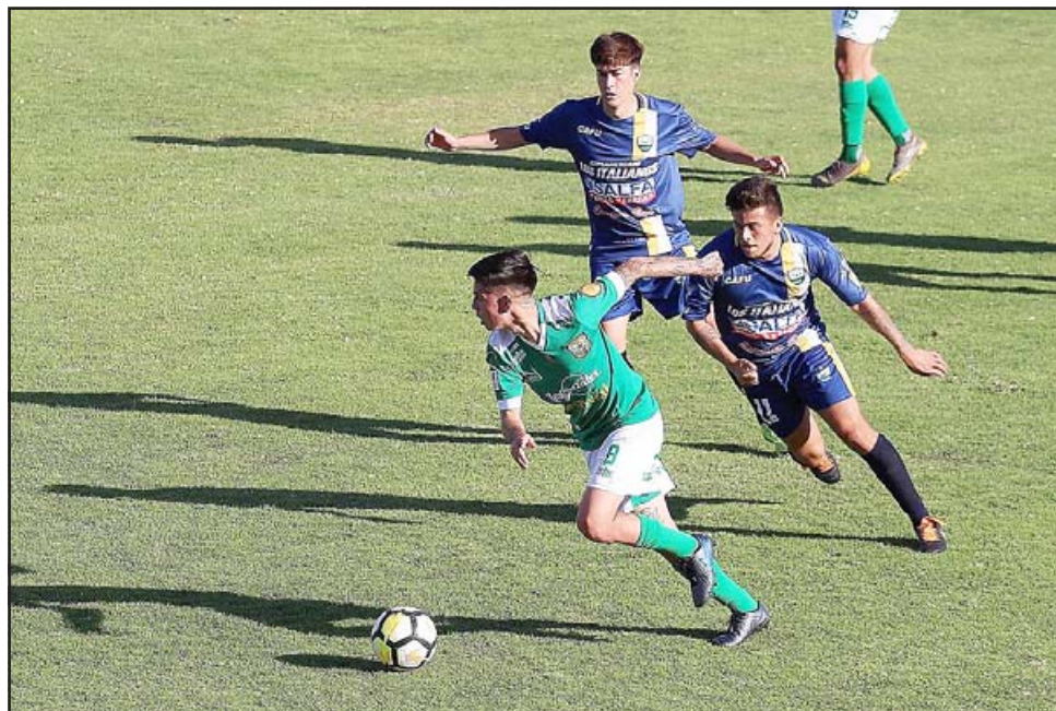
Contra todos los pronósticos previos Trasandino fue derrotado por Ovalle en su estreno 2020.