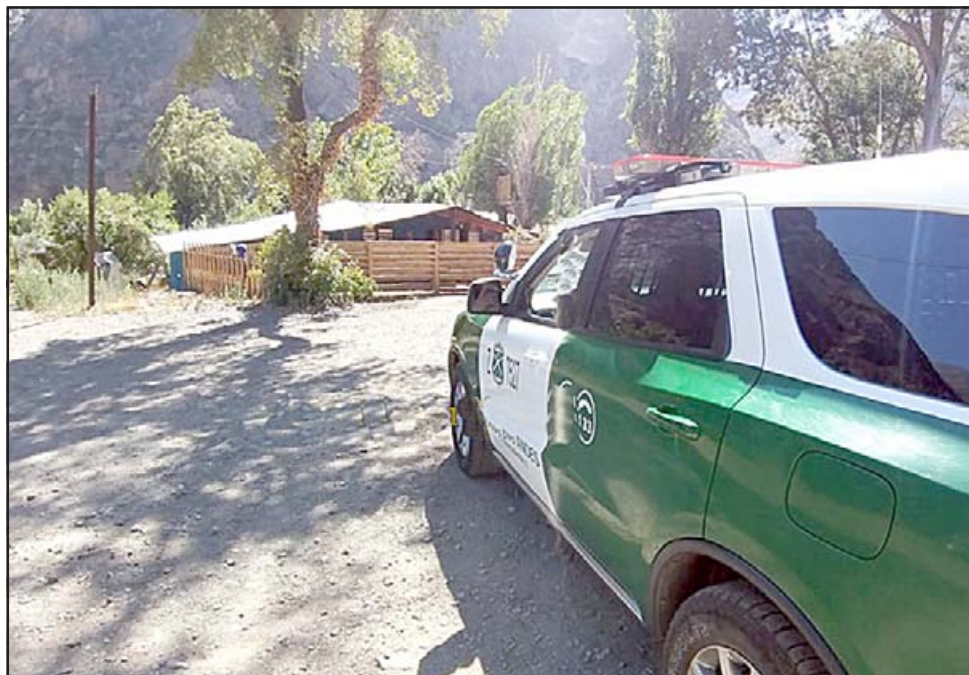
Este es el sector donde ocurrió el hallazgo del cuerpo de la pequeña niña.