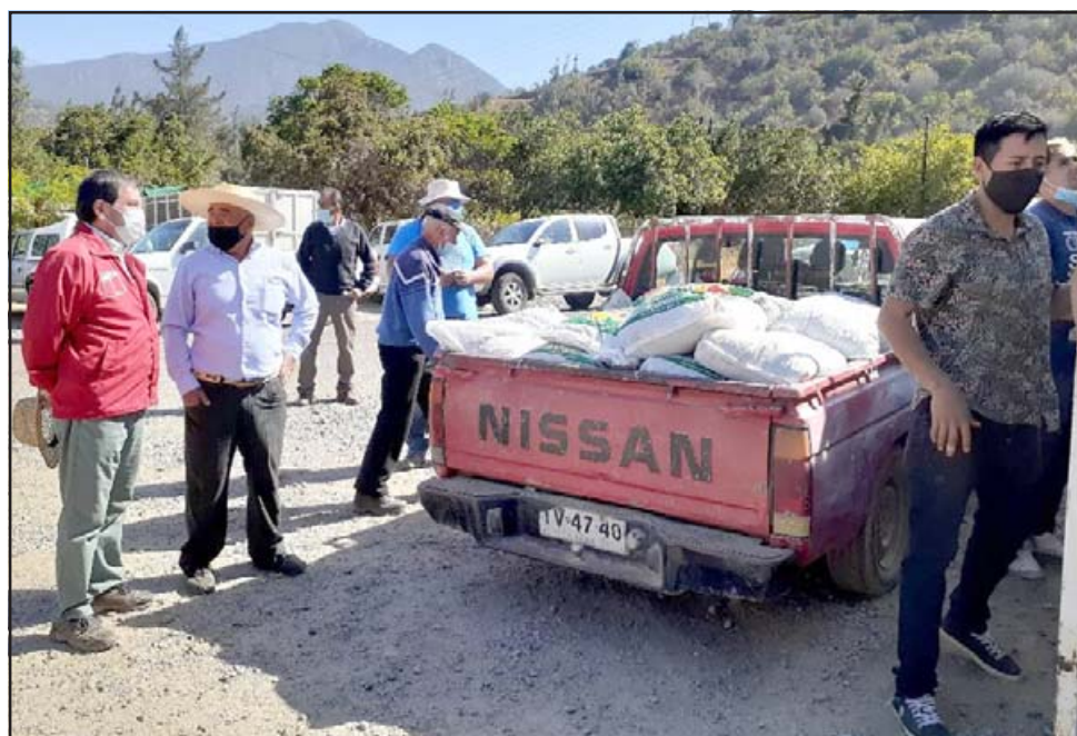
Cerca de 22.000 sacos de pellets de alfalfa, comenzaron a ser entregados a más de 2.000 productores de las provincias más afectadas de la región para alimentar su ganado, y mitigar así los efectos de la situación hídrica.

Cabe señalar que con esta ayuda complementaria se busca beneficiar a un total de 2.310 usuarios ganaderos de Indap de las provincias de Petorca, San Felipe , Los Andes, Marga Marga y Quillota. Para la distribución de la ayuda se cuenta con el apoyo técnico de Indap y la coordinación de la Seremi de Agricultura e Intendencia.