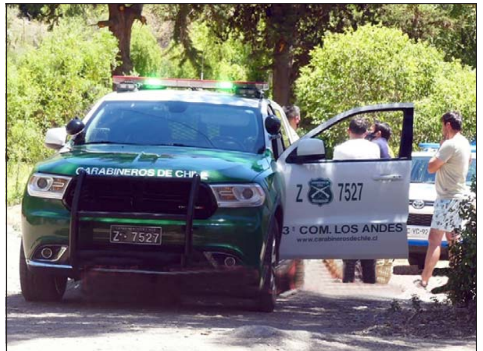
La PDI y Carabineros desarrollando las primeras diligencias investigativas en torno a este macabro crimen.