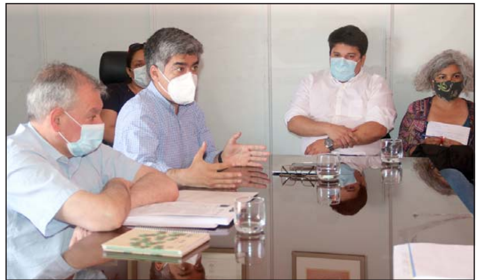
En la reunión se clarificó el actual proceso administrativo que se lleva a cabo para normalizar la directiva del APR.

«Hemos avanzado bastante y creo que tenemos prácticamente solucionado el problema de la falta de agua. Espero que se pueda generar alguna solución completa a todo el sector de Las Coimas, sobre todo el sector alto,