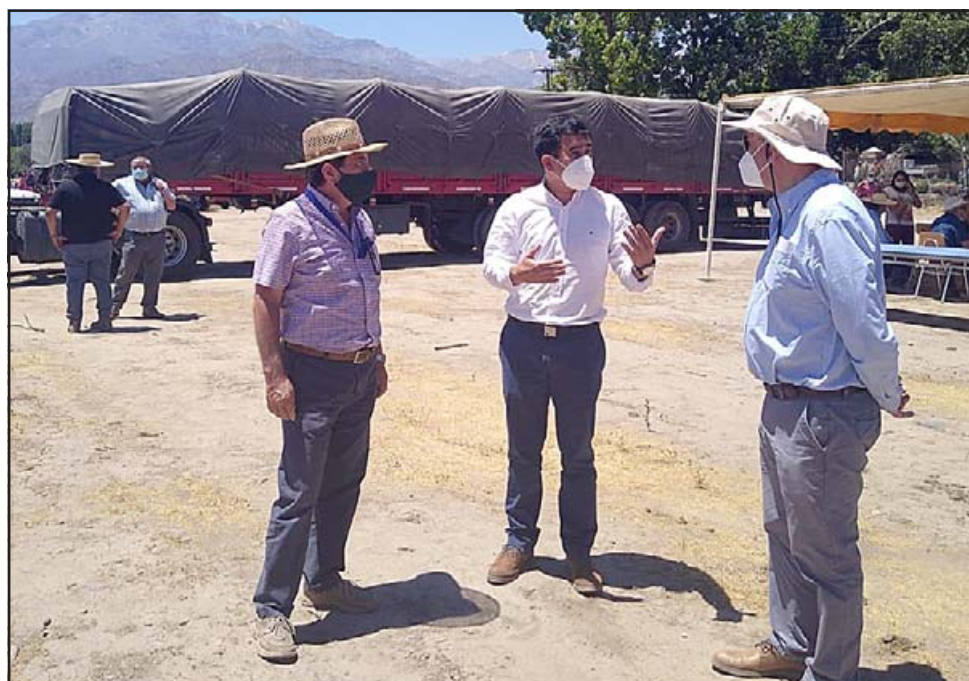
Con esta ayuda complementaria se busca beneficiar a un total de 2.310 usuarios ganaderos de Indap de las provincias de Petorca, San Felipe, Los Andes, Marga Marga y Quillota.