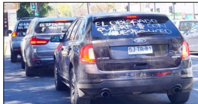
MUCHO RUIDO.- La caravana de autos dio varias vueltas por el centro de San Felipe, luego sus ocupantes bajaron para protestar frente al Obispado.