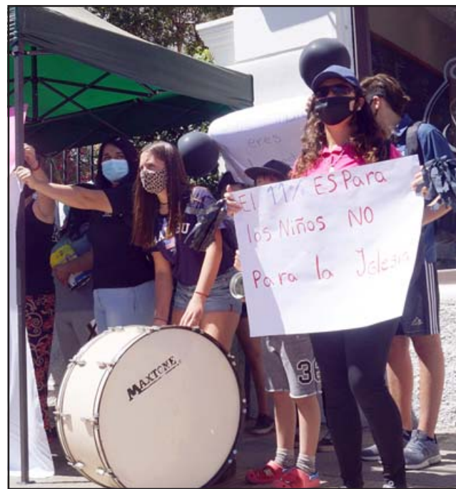
CON MUCHA FUERZA.- Los más jóvenes llegaron con sus tambores y pancartas para oponerse a los designios del Obispado.