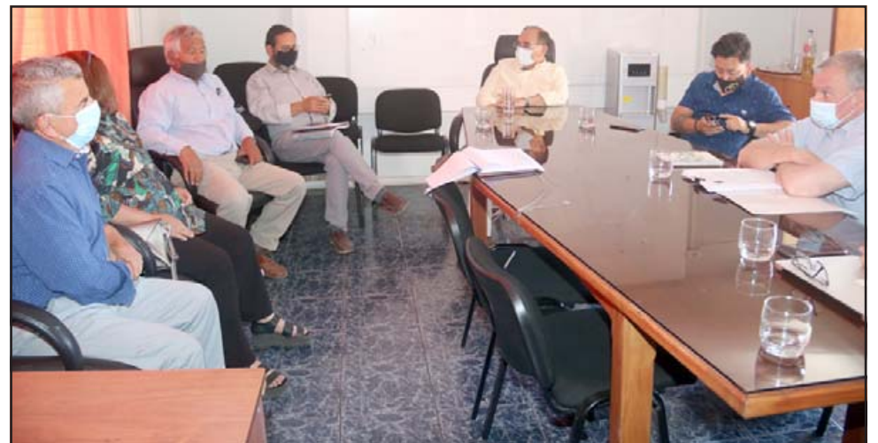
También se estudia una solución de corto plazo, donde La DOH pretende extraer agua desde pozos ubicados en el sector de Quebrada de Herrera, a través de la instalación de tuberías en una extensión de 3,5 kilómetros.

Esta actividad se desarrolló el este sábado, desde las 10:00 a las 13:00 horas y desde las 16:00 a las 18:00 horas, en la sede de la Junta de Vecinos Calle Larga. Para los socios, es importante que concurrir a esta convocatoria con el carnet de identidad y la boleta de agua (para obtener el número de medidor).