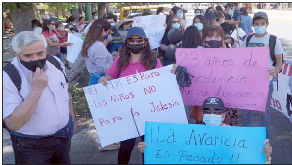
SIGUEN LAS PROTESTAS.- Con gran fuerza se hicieron escuchar decenas de profesores y estudiantes del Liceo Parroquial Teresita de Los Andes, en contra de la administración del Obispado.