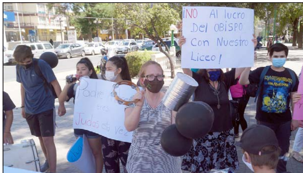
TODAS LAS EDADES.- Con distintos protagonistas y de todas las edades se siguen manifestando los vecinos de Rinconada en nuestra ciudad.