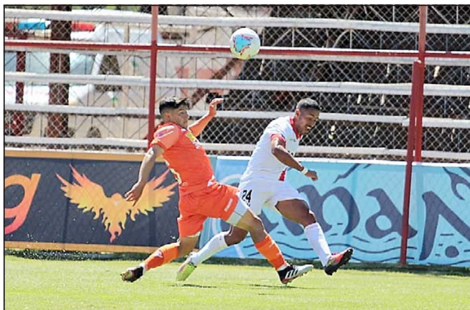
De ganar esta tarde los aconcaquíinos podrían escalar a la cuarta posición.