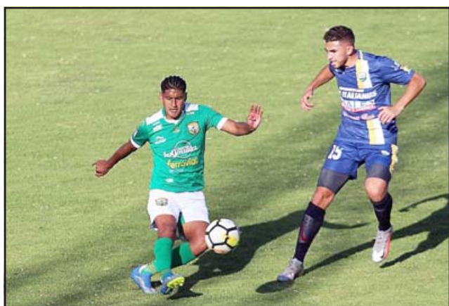
El equipo andino debió hacer como local en el estadio Municipal de San Felipe.

En el otro partido del grupo norte del Torneo A de la Tercera División, Limache dio cuenta de Quintero Unido por 4 goles a 0.