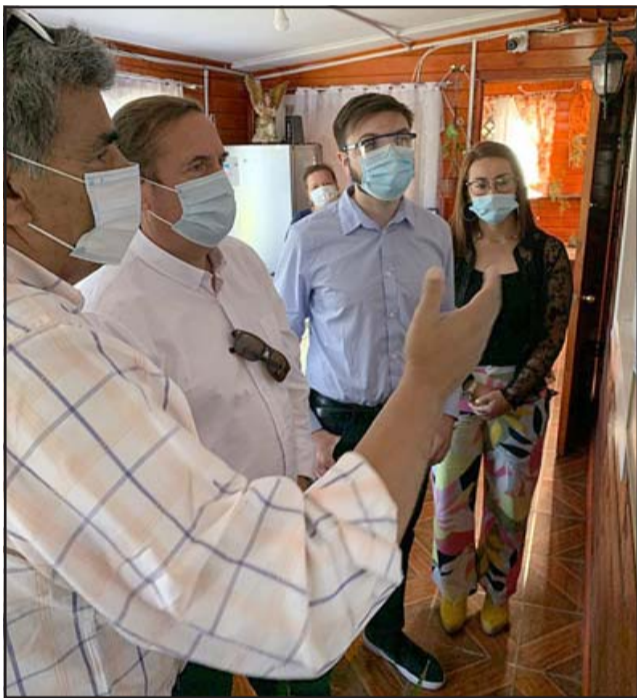
El parlamentario orientó a los vecinos en torno a proyectos en materia de seguridad y desarrollo urbano.