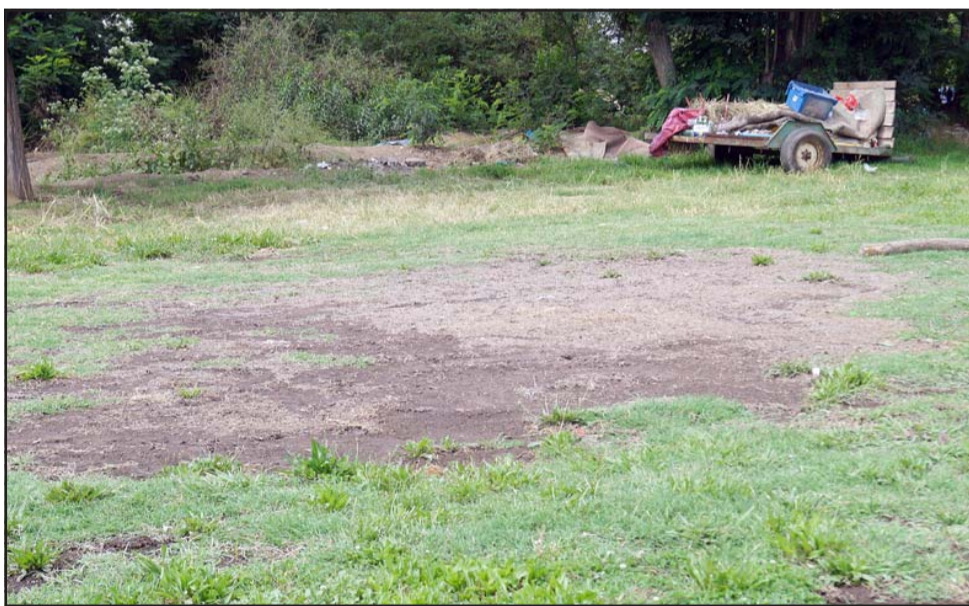
MUCHOS DAÑOS.- Así quedó la cancha luego que los gitanos la ocuparan por dos años, haciendo también fogatas en el césped.