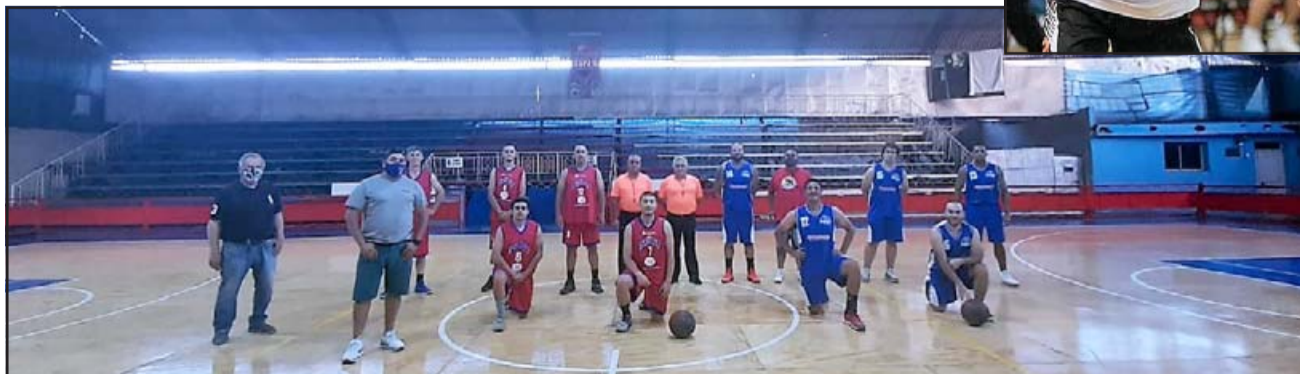
El equipo adulto del Prat en el nuevo piso del coliseo de la calle Santo Domingo.

ven aconagüino pueda seguir su carrera en el gigante del norte.