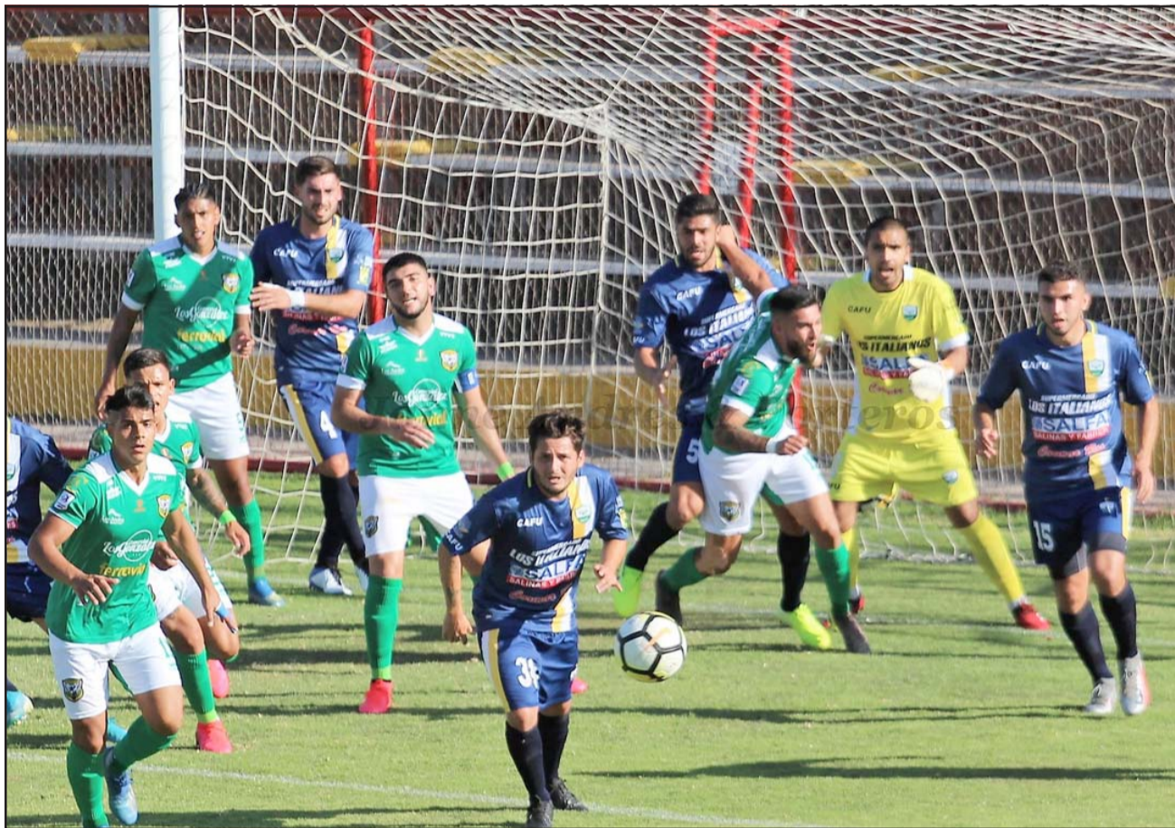
El equipo de Los Andes está obligado a hacerse fuerte de local en el Municipal de San Felipe.

Los hinchas del 'Tra' que quieran ser testigos del duelo frente a los costeños podrán disfrutarlo en la plataforma movilticket.