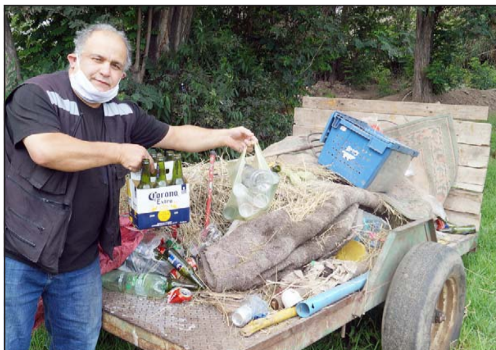
EN EL LUGAR.- Diario El Trabajo visitó el lugar este jueves, encontrándonos con gran cantidad de botellas vacías de licor.