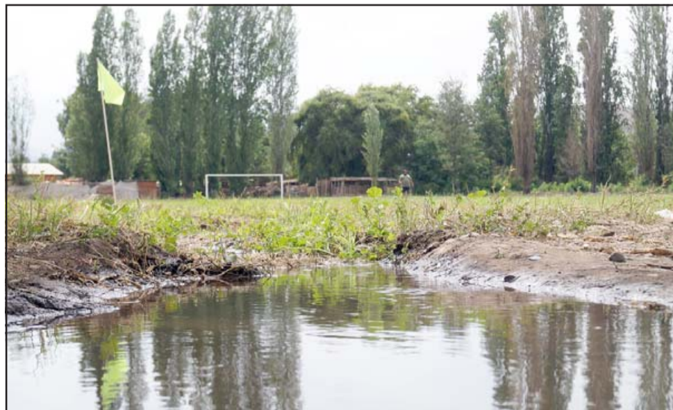
AGUA BENDITA.- El panorama ahora es otro para esta cancha, pues luego de dos años sin ser regada, ahora bebe el preciado líquido para recuperarse y lucir verde.