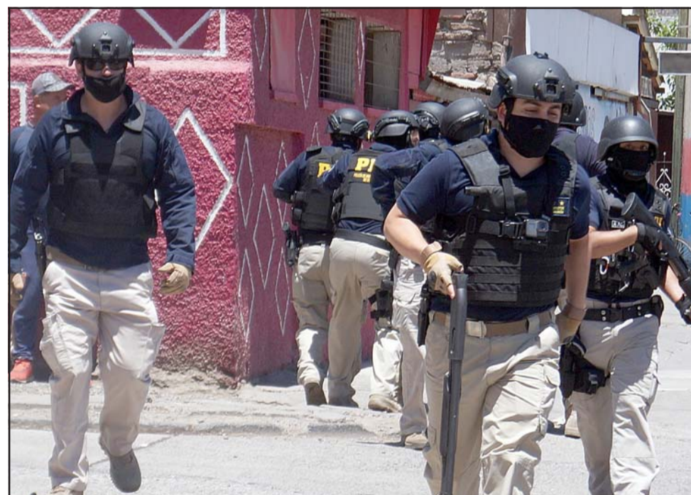
'OPERACIÓN 4 VILLAS'.- No fue una coincidencia que con la llegada de León a la PDI de San Felipe se viera acción y resultados policiales en las calles de nuestra ciudad.