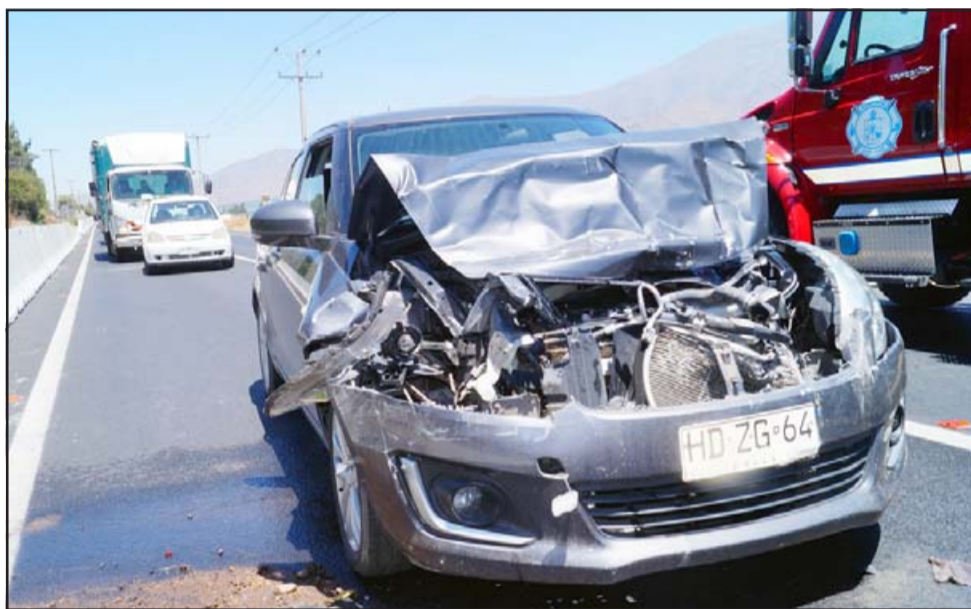
EL CHOQUE DEL DÍA.- Así quedó el vehículo que colisionó la camioneta 4X4, su conductor no se percató del tránsito diferido a raíz de los trabajos de mantenimiento en la ruta.