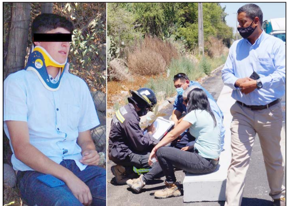
ATURDIDOS.- Los ocupantes de ambos vehículos debieron esperar casi 40 minutos a que una unidad del SAMU llegara al lugar, mientras los bomberos atendieron en la medida de lo posible a los afectados.