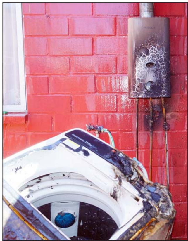
PELIGRO EN CASA.- Así quedó el calefón y la lavadora tras la fuerte explosión, gracias a la Providencia los daños no fueron mayores.