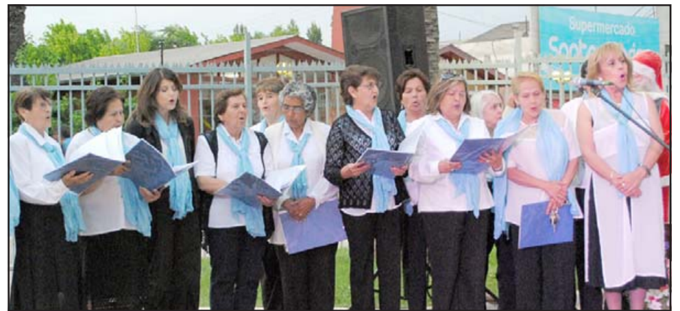
CORO ECOS DE CATEMU. - Ellos son los integrantes del Coro Ecos de Catemu, músicos aconcaquíinos que se integran a esta nueva convocatoria global por Internet.