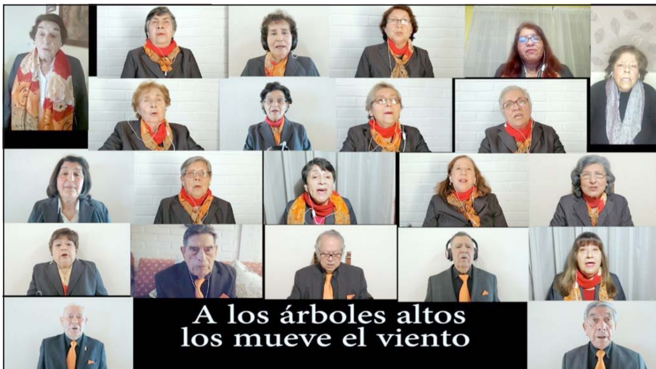
CORO ADULTO MAYOR SAN FELIPE. - Por años estos adultos mayores han cantado a la vida, a las Fiestas Patrias y navidades.