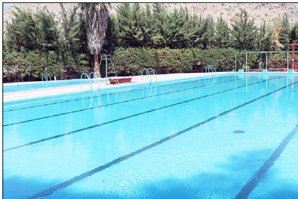
A partir de ayer jueves se abrió la temporada 2020-2021 de la piscina municipal en el Estadio Fiscal.

El profesional sostuvo que esto lleva a crear dos bloques de funcionamiento, en la mañana y en la tarde, «el espacio horario entre ambos permitirá sanitizar el recinto y que más personas puedan usar la piscina durante el día».