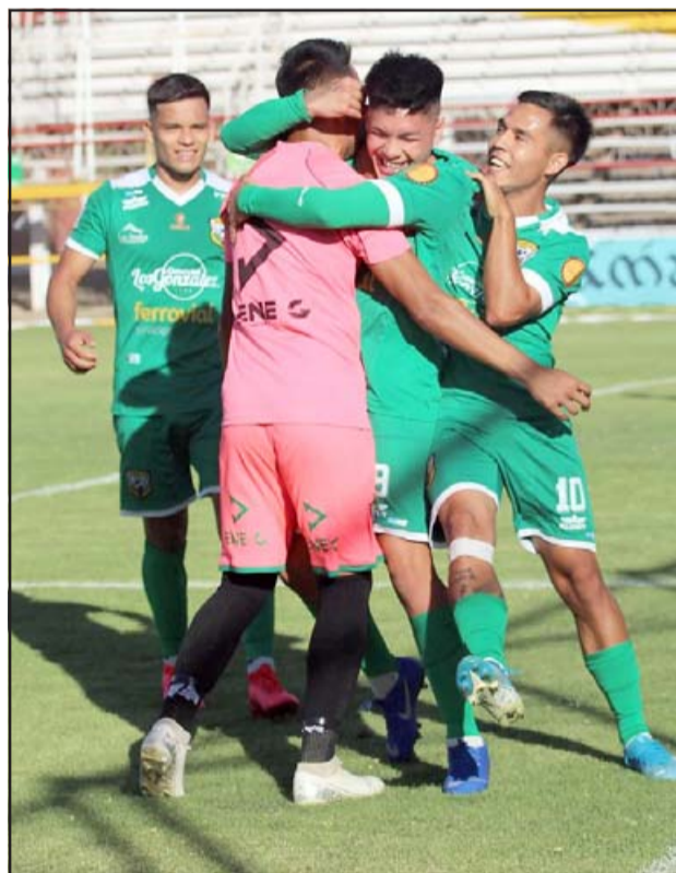
Trasandino buscará ante Ovalle seguir con los festejos para empezar a asegurar su incursión en la postemporada.

El pleito entre ovallinos y andinos fue agendado para las cinco de la tarde de este domingo en el estadio Diaguítas. En tanto el otro partido del grupo Norte que animarán Quintero Unido y Limache fue programado para el mismo día y horario en la cancha Raúl Vargas en la comuna costeña.