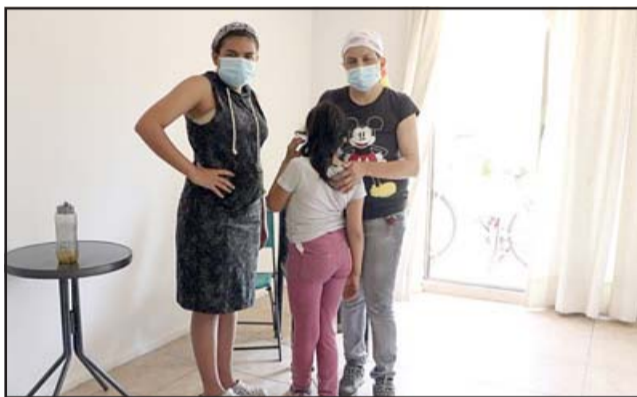
Buscando apoyo consiguió un beneficio que le permitió instalarse en un departamento que se encuentra prácticamente vacío.