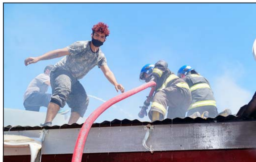
EN EL LUGAR.- Las cámaras de Diario El Trabajo captaron el justo momento cuando este vecino apoya a los bomberos en el techo.

«Yo me estaba bañando tranquila cuando oí y sentí la explosión, cuando