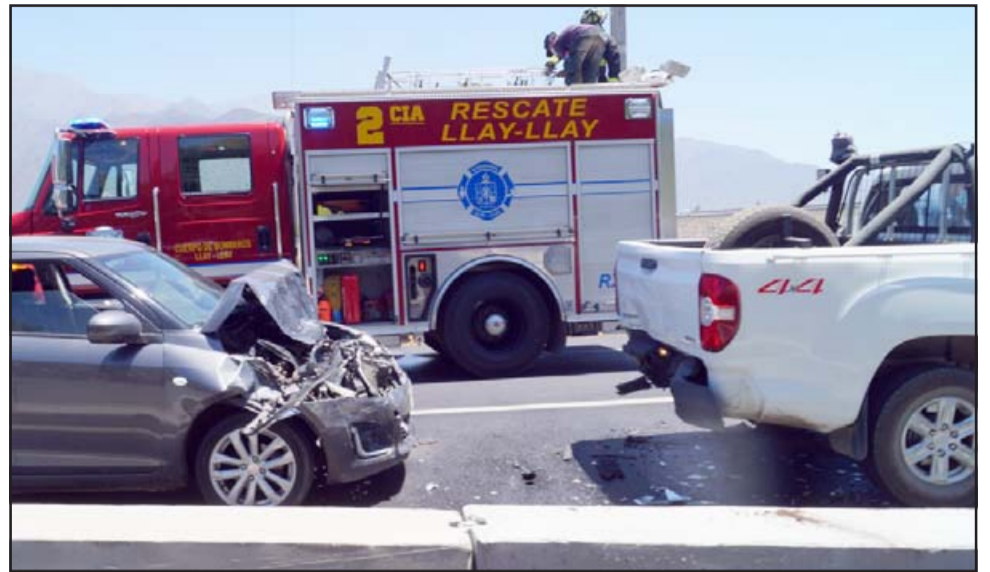
AYUDA OPORTUNA.- Una unidad de Bomberos de Llay Llay que transitaba por el sector fue la primera en atender esta emergencia.