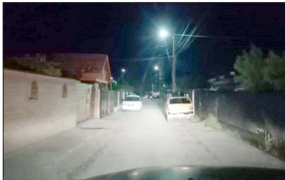
Este es el pasaje de Villa Mercedes en Putaendo donde se produjo el asalto.