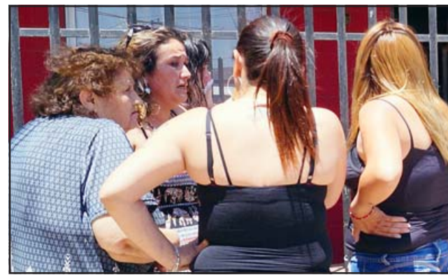
Las vecinas brindaron consuelo a esta familia afectada, gracias también a Bomberos que evitaron que el fuego retomara fuerza.