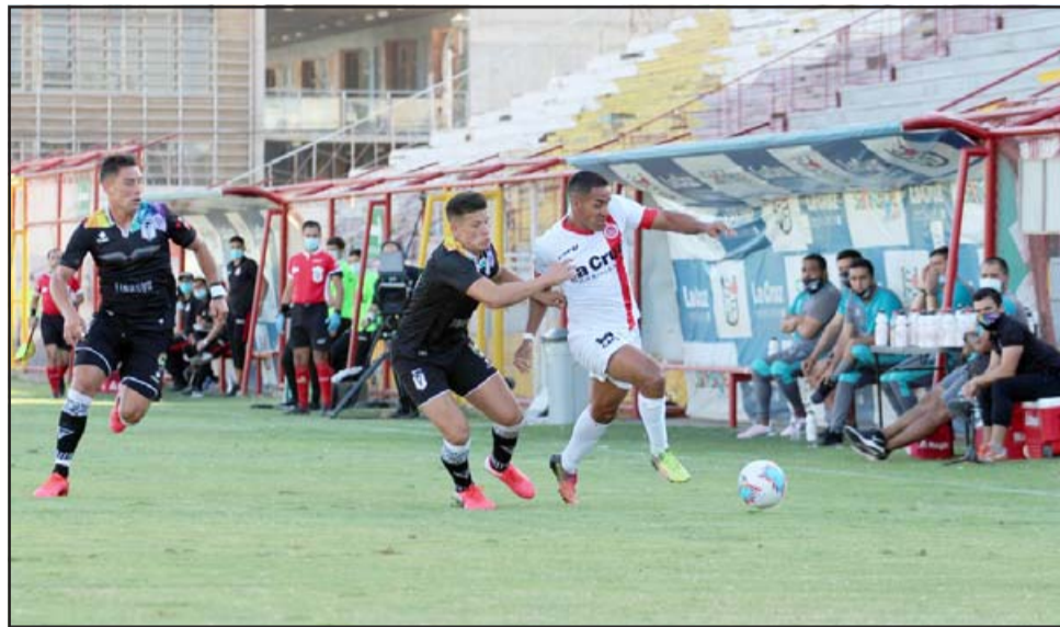
Al igual que en el partido pasado, esta tarde los sanfelipeños podrían escalar al primer lugar de la tabla.