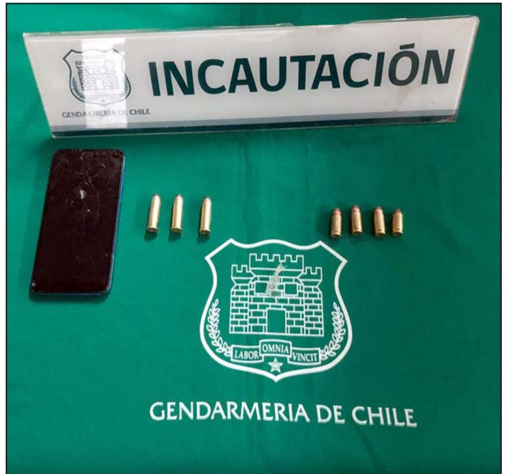
En el interior de un pañal desechable se encontraba un teléfono celular y municiones de alto calibre, 9 milímetros y 38.

De forma inmediata se informó de lo ocurrido al ministerio público, que determinó que efectivos de la PDI llevaran a cabo el procedimiento respectivo. Además, Gendarmería inició una investigación interna.