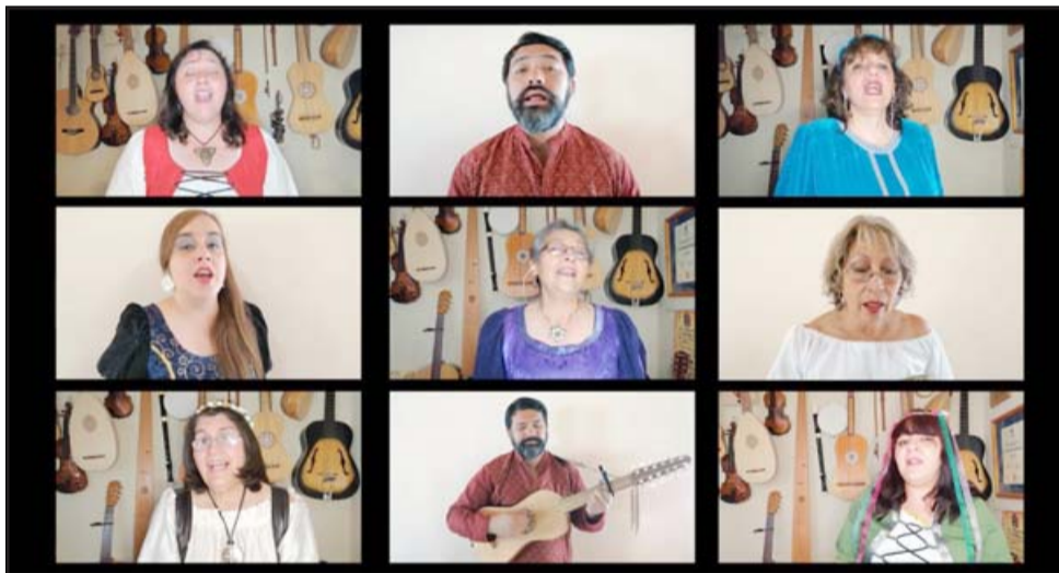
NUESTRA CAMERATA. - Aquí están los tremendos de Camerata Aconcagua, quienes no necesitan presentación en nuestro valle.