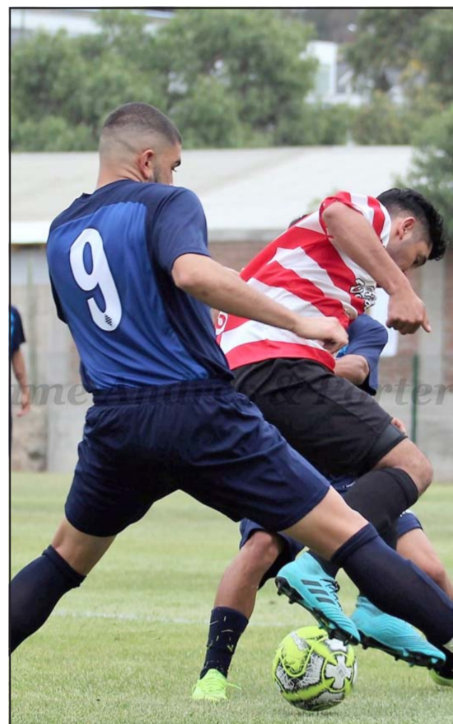
La idea de la ARFA Quinta era culminar en el corto plazo los torneos de Campeones.

Es un hecho que el nulo avance en el programa Paso a Paso y el evidente riesgo de un retroceso del mismo en la región, provocará que quede en suspenso la realización de la Súper Copa de Campeones, evento con el que el balompié aficionado buscaría llenar el vacío competitivo en que lo ha sometido el Covid-19.