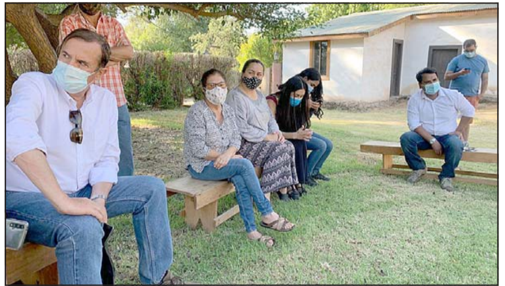
En el sector Las Compuertas, en Catemu, el parlamentario también pudo reunirse con los dirigentes del lugar.