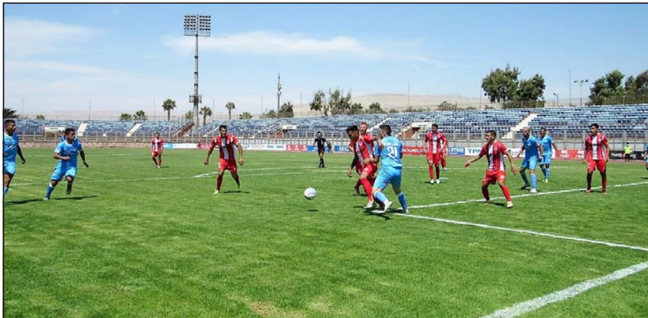
El partido fue de trámite parejo pero los nortinos supieron sacar provecho de sus oportunidades.

quista del trasandino no solo significaba el triunfo parcial, sino que también se traducía en que el cuadro sanfelipeño asumía el liderazgo absoluto de la Primera División B.