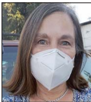
Dra. Carmen Castillo Taucher, exministra de Salud.

Diario El Trabajo logró consultar sus impresiones a la ya candidata Carmen Castillo al puesto de alcaldesa tras su victoria electoral: «Siento mucha alegría porque podremos ahora hacer muchas y distintas actividades para cumplir los sueños y anhelos que podemos compartir con los vecinos y vecinas. Feliz de estar hoy día en esta condición de poder trabajar por nuestro San Feli-