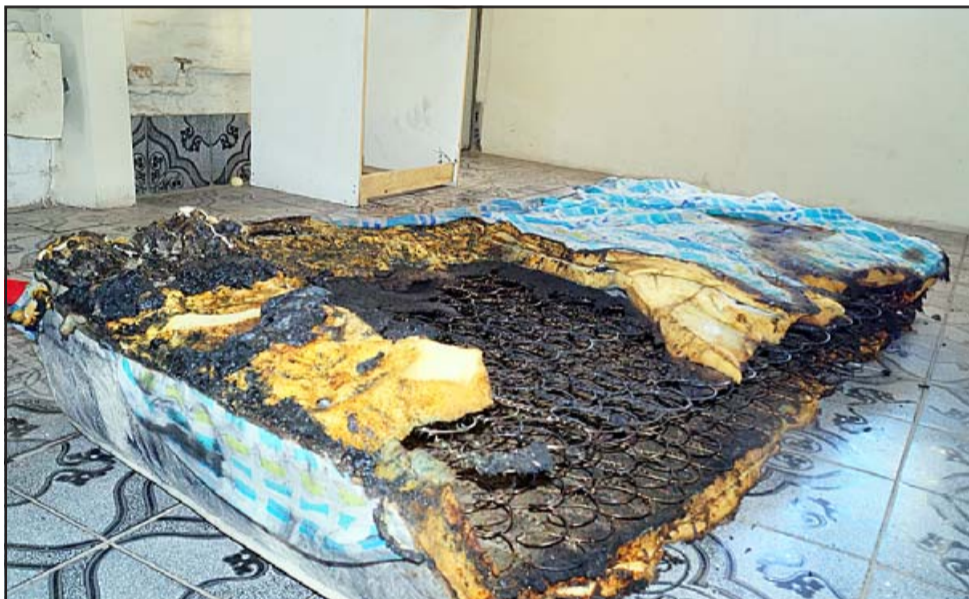
TRAGEDIA FAMILIAR.- El colchón de las niñas también quedó destruido por las llamas. Es una dicha que no hayan víctimas fatales que lamentar.