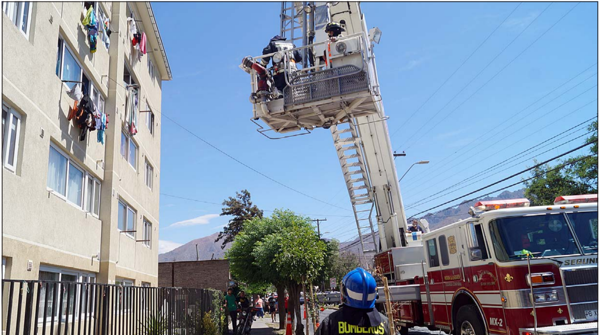
TRABAJO A GRAN ALTURA. - La unidad MX 2 de Bomba La Internacional se utilizó también en este trabajo de rescate de personas y extinción del fuego.

sonal del SAMU con dos ambulancias, Carabineros también, una de las menores fue trasladada al Hospital San Camilo, la verdad que esta situación fue bastante complicada, la ventana con su marco y cristales cayeron como a 30 metros del departamento, y porque la gran cantidad de humo