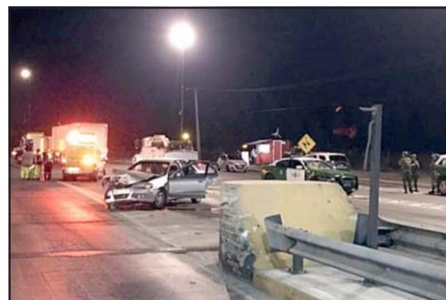
Recordar que este hecho se produjo el día 3 de marzo en Peaje Las Vegas.