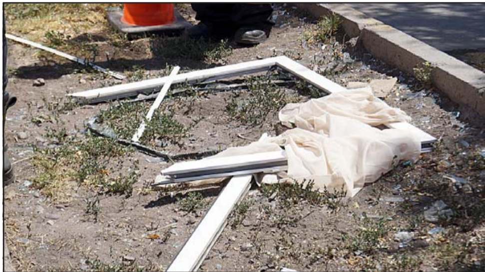
POTENTE EXPLOSIÓN. - A 30 metros de distancia del departamento fueron a caer el marco de la ventana y sus cortinas.