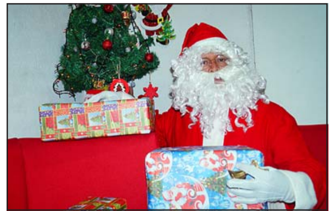
NAVIDAD EN CASA.- Este año el Viejito Pascuero se quedó con muchos regalos y dulces en su hogar, la pandemia evitó que él saliera a repartirlos.

vengan a visitar, pues hace años que no me vienen a ver' , fue algo tremendo, no pude evitar el llanto, pasó como media hora, nos retiramos del lugar, hasta que pude recuperarme del impacto emocional que recibí en esa oportunidad. Este voluntariado es de grandes satisfacciones pero a la vez de grandes aprendizajes, hace poco tiempo yo andaba entregando alegría a los niños con mis 'duendes', mi madre estaba muy mal de salud hospitalizada, en aunque tenía que sonreír a los niños yo estaba muy triste por mi madre, pedí en mi corazón