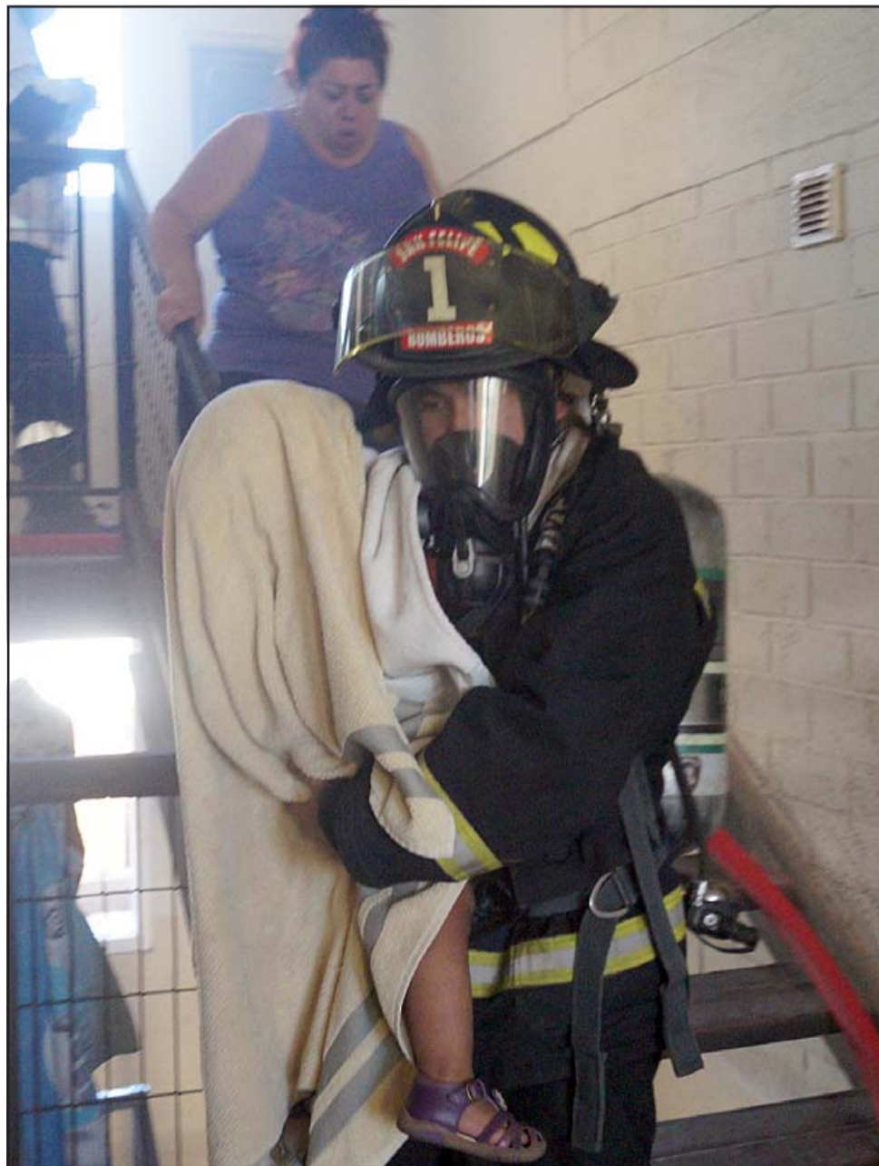
NUESTROS HÉROES.- Este heroico bombero rescata con vida y cubierta de con una toalla mojada, a esta niña de 4 años de edad, quien sufrió serias quemaduras en su pequeño cuerpo.