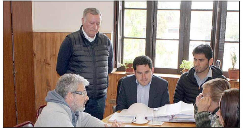
Aquí vemos a todo el equipo de gestión en 2019, coordinando esfuerzos para llegar a la actual realidad de Bomberos de Panquehue.

aprobada y quedamos a la espera que el Gobierno Regional pueda destinar los recursos para que se pueda ejecutar esta iniciativa. La estructura considera construir una sala de máquinas nuevas, pues Bomberos de Panquehue tiene una particularidad en contar con más máquinas que lo que corresponde, esto debido al tema de la carretera internacional CH 60, se considera también sala de guardia, comedores, dormitorios, un salón de honor para sus actividades internas, sala