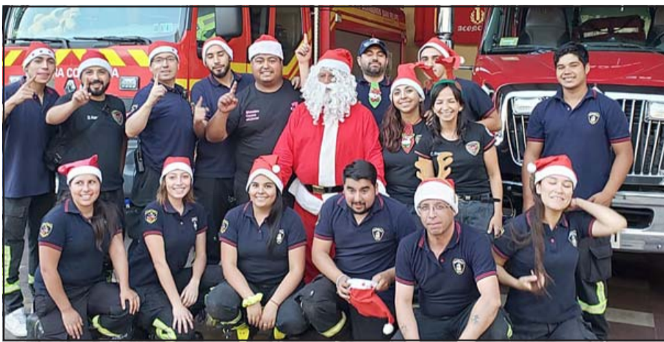
CON SUS DUENDES.- Aquí lo vemos con sus 'Duendes' de la 1ª Compañía de Bomberos.