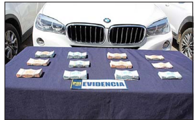
Además, se efectuaron allanamientos en diferentes domicilios donde se incautaron 19 millones de pesos en efectivo y tres vehículos de alta gama.

contra la medida cautelar de Arresto Domiciliario Total, mientras que los otros dos sujetos quedaron en Prisión Preventiva.