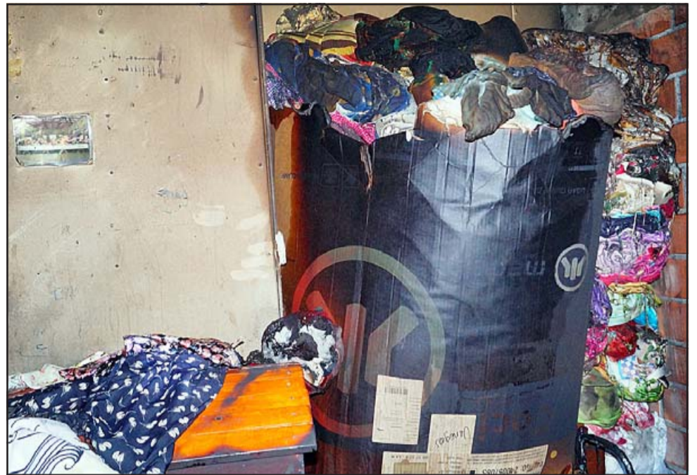
MUCHAS PÉRDIDAS. - Así quedó la ropa de toda la familia dentro del departamento 48 del Block 220, luego que las llamas envolvieran a los presentes tras la explosión.

Diario El Trabajo que «fue una explosión ocurrida en el cuarto piso de los departamentos Sargento Aldea, al parecer fue la explosión de una cocinilla, tuvimos varias personas lesionadas las que fueron evaluadas y atendidas por personal del SAMU, inicialmente se nos reportaron