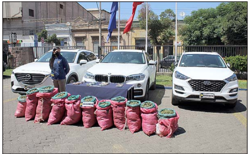
La Brigada Antinarcóticos y Contra el Crimen Organizado de la PDI de Los Andes detuvo a una banda de traficantes integrada por tres hombres y una mujer, además de incautar un millonario cargamento de marihuana.

Además, se efectuaron allanamientos en diferentes domicilios donde se incautaron 19 millones de pesos en efectivo y tres vehículos