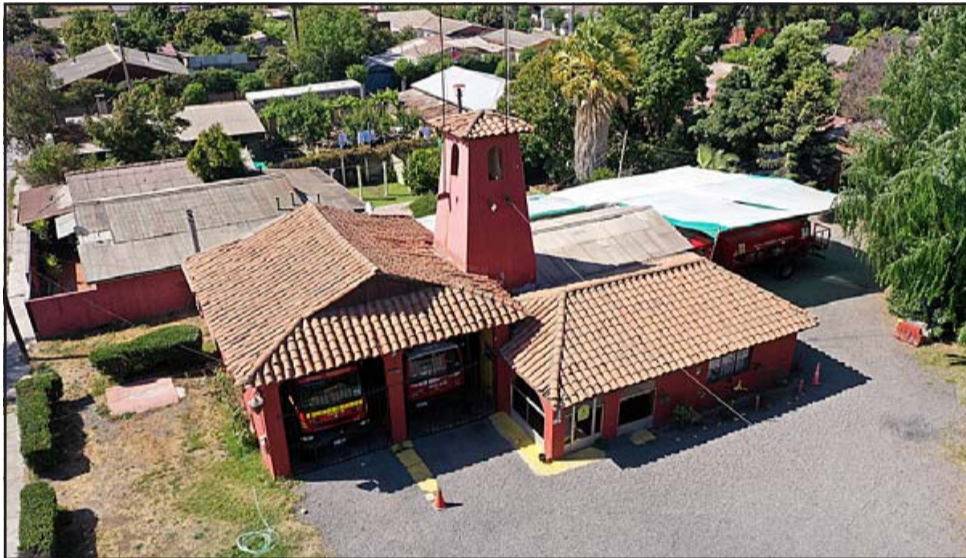
Esta es una vista aérea del cuartel de la Sexta Compañía de Bomberos de San Felipe, funcionando en Panquehue.

ros y emergencias con materiales peligrosos, además de las emergencias asociadas a una ruta internacional, debido al aumento poblacional y de voluntarios. El actual cuartel data desde hace 40, siendo a la fecha no apto para albergar a voluntarios, debido a que presenta una infraestructura deteriorada y obsoleta para las necesidades actuales.