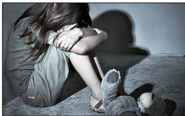
QUEDÓ EN LIBERTAD.- El sospechoso fue hasta el comedor donde se encontraba la hija de 13 años de su nuera y comenzó a efectuarle tocaciones en sus genitales por sobre la ropa. (Referencial)

Durante el transcurso de la celebración el imputado comenzó a ingerir bebidas alcohólicas y a eso de las 19:00 horas, mientras el grupo familiar estaba compartiendo, fue hasta el comedor donde se encontraba la hija de 13 años de su nuera y comenzó a efectuarle tocaciones en sus genitales por sobre la ropa, según lo destacado por el portal