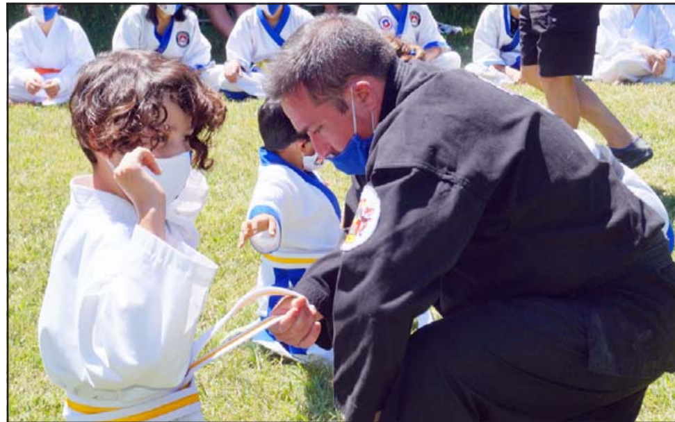
FAMILIA DEL KARATE.- Los más experimentados de la jornada apoyaron también en el ritual de Pase de grado.