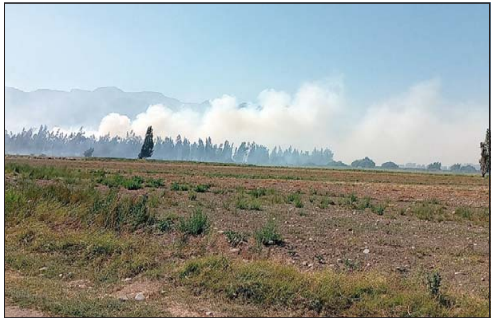
Este fue el incendio que nuevamente puso en el tapete la mala relación que hay entre Bomberos y Conaf.