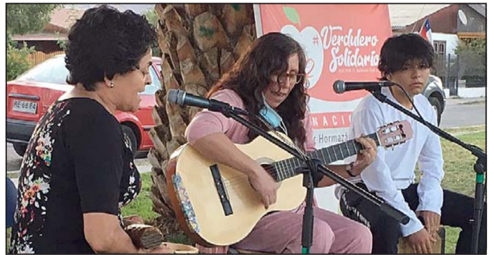
MÚSICOS DEL BARRIO.- Varios vecinos del barrio improvisaron su propia orquesta y compartieron con los presentes sus talentos. Ellos pertenecen a la feligresía de la Iglesia Andacollo.