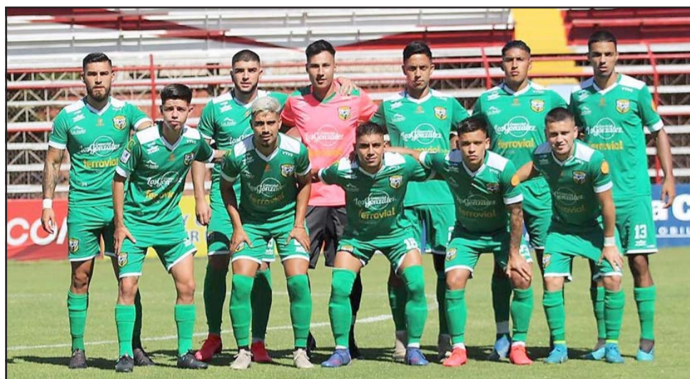
La intención de hacer las cosas para mejor terminó en un verdadero bochorno para Trasandino.

«Cabe mencionar que nuestro plantel que viajó a la Cuarta Región, fue debidamente testado con test