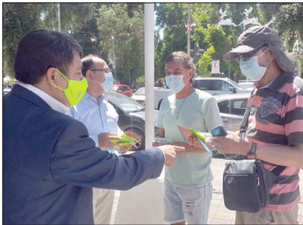
La mañana de este lunes el gobernador junto al director regional de Senda hicieron un llamado a la comunidad a evitar el consumo de drogas y alcohol en estas fiestas de fin de año, anunciando el uso de narcotest en los controles.

que estas fiestas de fin de año sean en familia, sean fuentes de lindos recuerdos y no fiestas que sean marcadas por accidentes o desgracias».