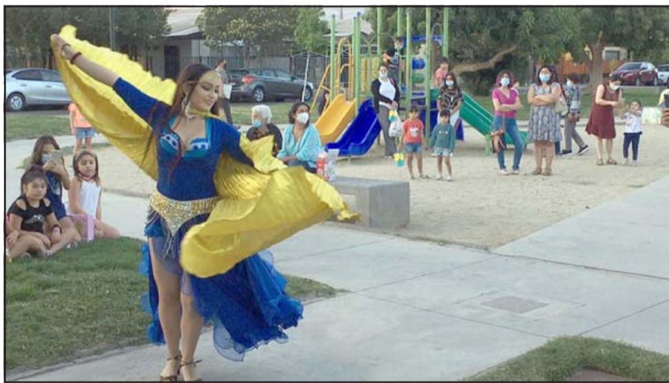
DANZA ÁRABE.- Esta deslumbrante bailarina de danza árabe deslumbró a peques y grandes con su imponente presentación.