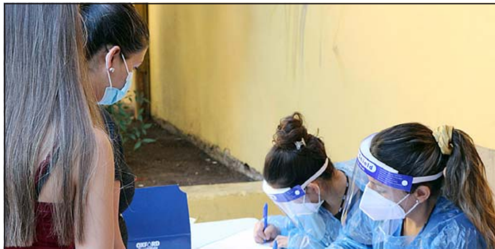
Debido a la importancia que tuvo el testeo, este miércoles 23 de diciembre, de 10.00 a 14.00 horas, la misma unidad se ubicará en la Plaza de Armas, frente al Odeón.

que tuvo, este miércoles 23 de diciembre, de 10.00 a 14.00 horas, la misma unidad se ubicará en la Plaza de