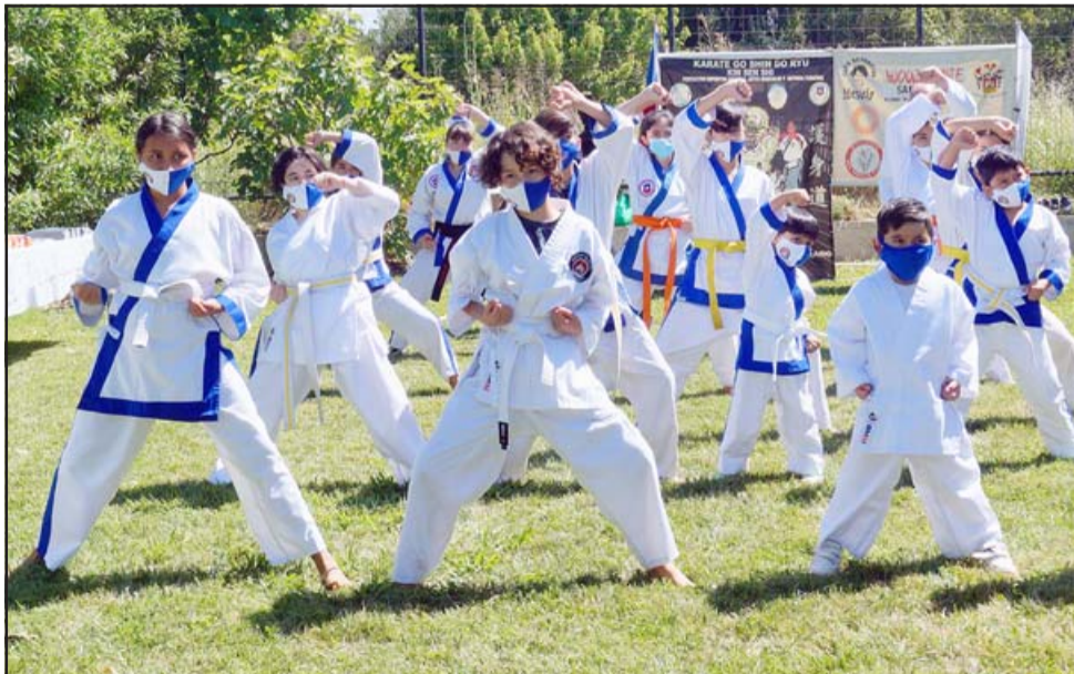
SANGRE HODORI.- Ellos son parte de la nueva Generación 2021 que superó el año más difícil de este siglo hasta el presente.