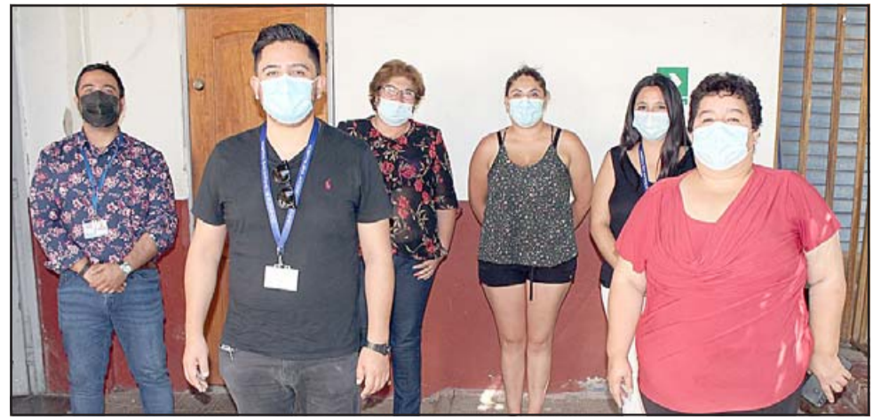
El Hospital San Antonio de Putaendo estableció una coordinación con la UNCO vecinal 'Valle de Putaendo', para conocer las inquietudes y sugerencias de los vecinos.

A la fecha se han concretado dos reuniones con la Unión Comunal de Juntas de Vecinos Valle de Putaendo. La primera de ellas sirvió para realizar un diagnóstico y recoger inquietudes de la comunidad. En la segunda cita el Hospital informó de los cambios im-