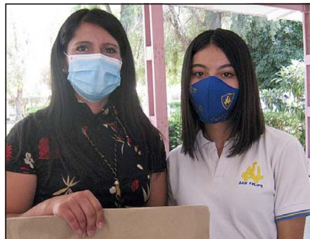
Los estudiantes que recibieron los tablets que les permitirán conectarse a internet, desde el mes de marzo, se mostraron agradecidos por este apoyo tecnológico.

«Veo más bien en el Colegio de Profesores una decisión más política que médica de obstruir el retorno.