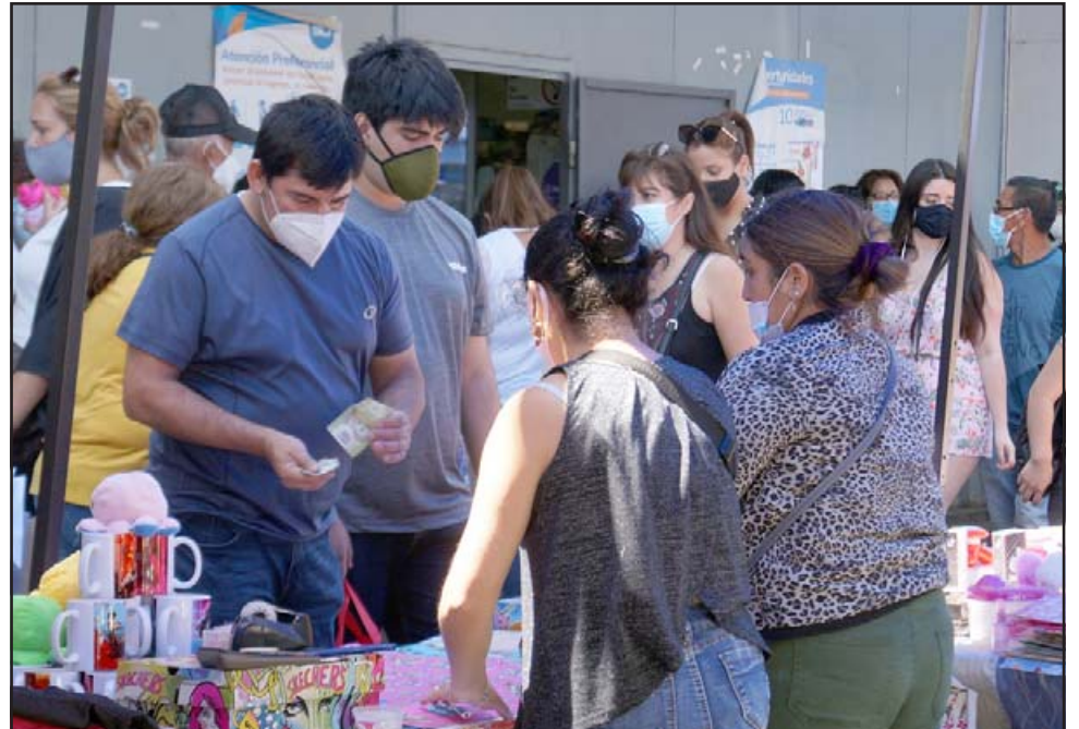
COMPRAR Y COMPRAR. - Las aglomeraciones están a la orden del día, la ansiedad de comprar y comprar es incontrolable para estas personas.