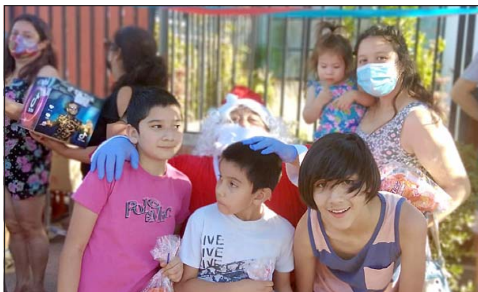
DULCES Y REGALOS. - Regalos y dulces para cada uno en muchas poblaciones, la jornada terminó la tarde noche de este miércoles.