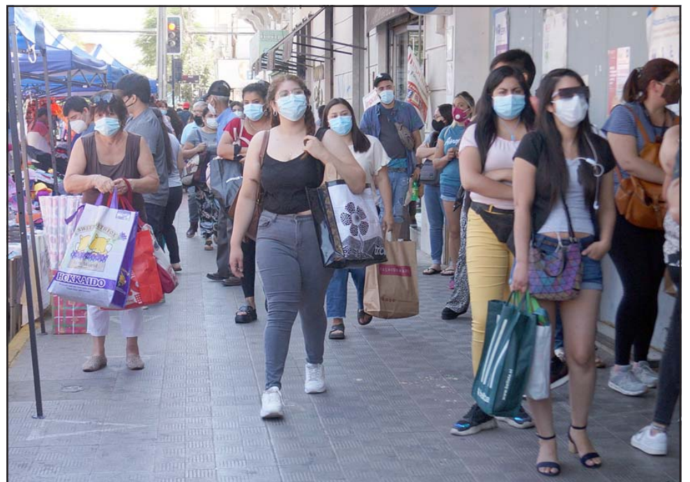
COLAPSO INMINENTE. - Hoy jueves se espera que la afluencia de personas será desmedida, pues como buenos chilenos dejamos siempre para el final comprar los regalos.