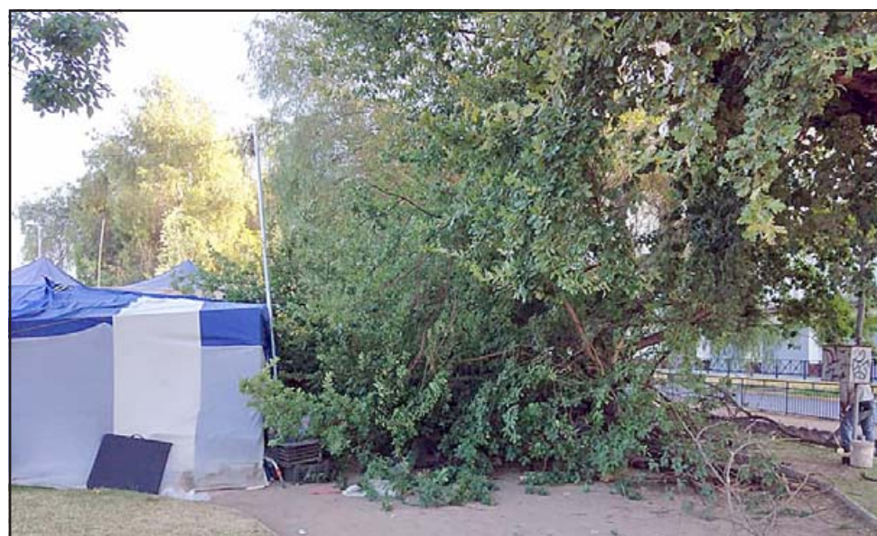
La gigantesca rama cayó sobre dos puestos ubicados en el lugar, en los cuales afortunadamente no había nadie durmiendo como sí ocurre en otros puestos.