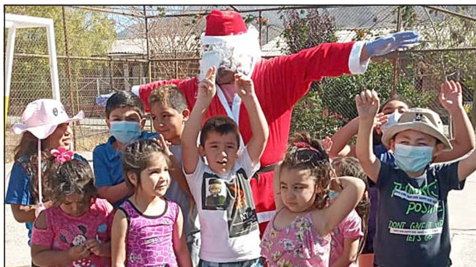
NAVIDAD TREPIDANTE. - Aquí lo vemos con otro grupo de amiguitos de nuestra comuna, esta semana fue una gran jornada para el Viejito Pascuero.