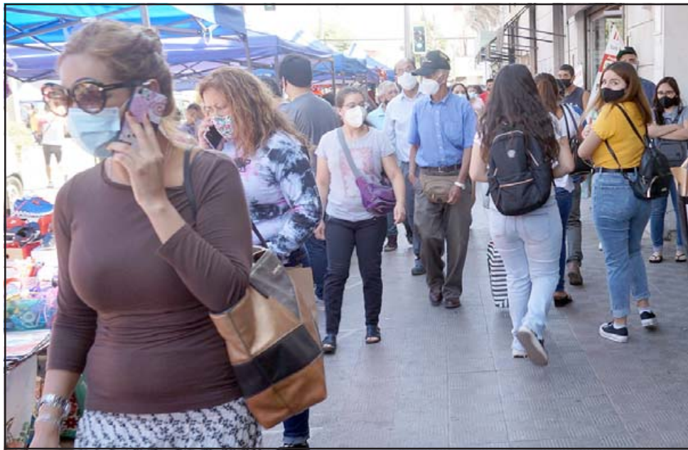
MASIVA NAVIDAD. - Esperamos que todos usen mascarilla y se cuiden guardando la distancia correspondiente.