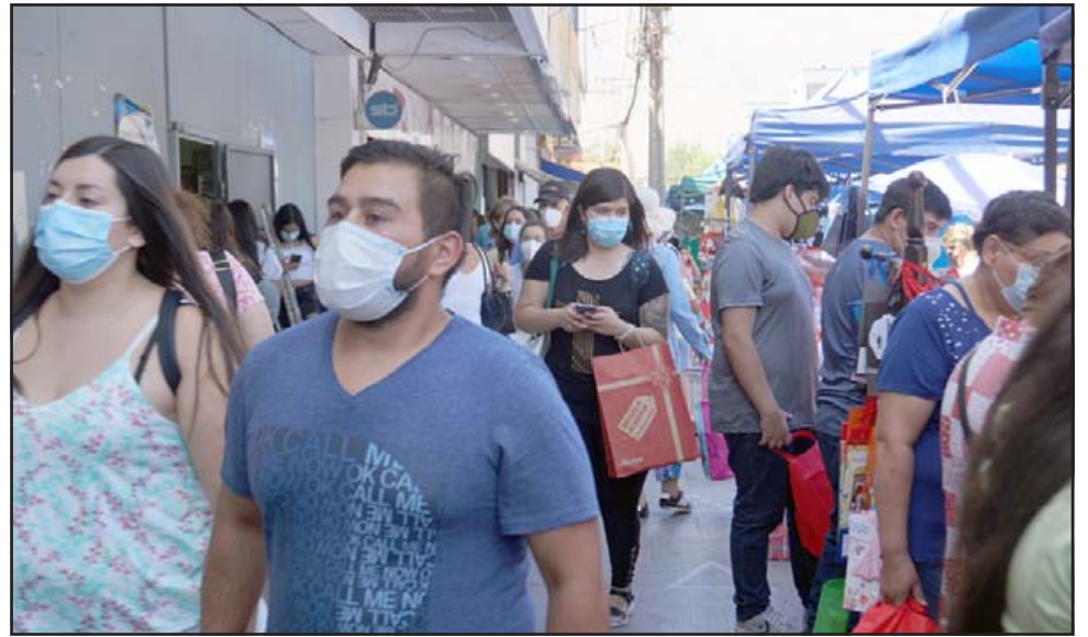
A CUIDARNOS MÁS. - Este es el escenario urbano en nuestra ciudad, debemos destacar, eso sí, que casi todas las personas, los clientes y vendedores, están usando sus mascarillas.

Hace algunas semanas se lamentaban algunos porque el Municipio perseguía a los comerciantes ambulantes, eran pocos, sin embargo ahora estamos en el otro extremo, en el que pareciera no haber fiscalización sobre la cantidad de puntos de ventas y también de clientela. ¿Quién responderá ahora por lo que viene para 2021?, pues insistimos, no hemos visto fiscalizaciones de la autoridad.