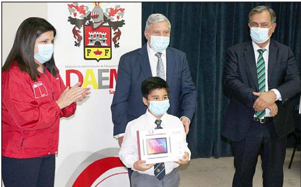
Once alumnos de diferentes establecimientos fueron seleccionados para recibir estas tablets, equipos que serán entregados masivamente en el mes de marzo próximo.