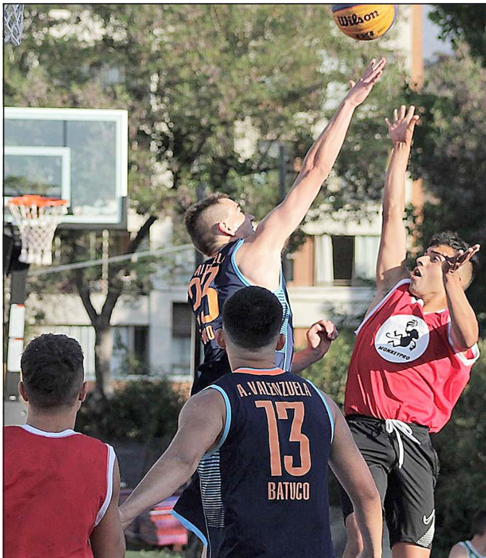
Los mejores de Chile en el básquet 3 x 3 se reunirán en enero próximo en Santa María.

Luego de un 2020 mudo en materia competitiva en disciplinas tan masivas como el básquetbol, el próximo año partirá con todo ya que el sábado 9 de enero se realizará el torneo FIBA 3x3, que reunirá en Santa María a los mejores exponentes del país.