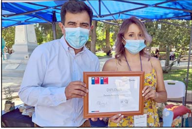
Cada uno de los expositores recibió su correspondiente diploma por su participación en la Expo Fosis.