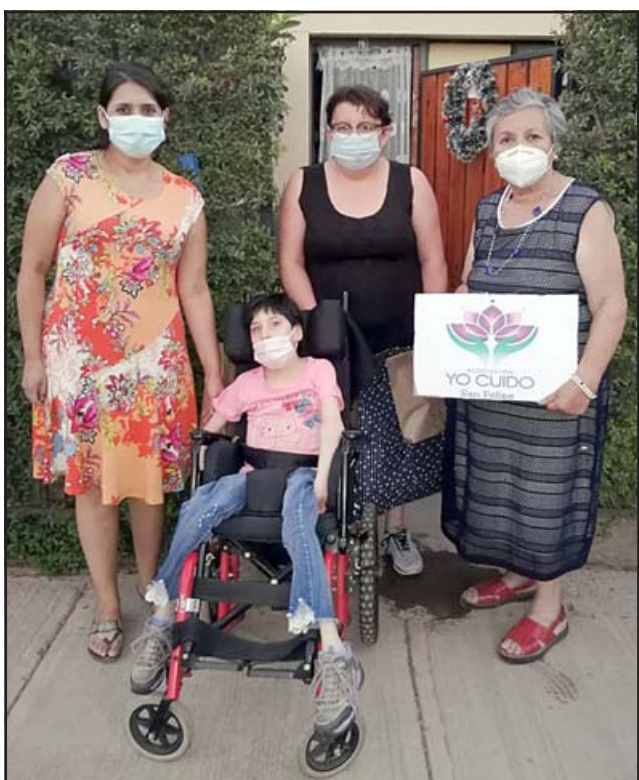
A CADA RINCÓN. - Este Pascuero también visitó a los niños de la 'Asociación Yo Cuido de las Madres Cuidadoras'.

será en un camión que adaptamos para este paseo a contar de las 19:00 horas por todas las poblaciones de San Felipe.