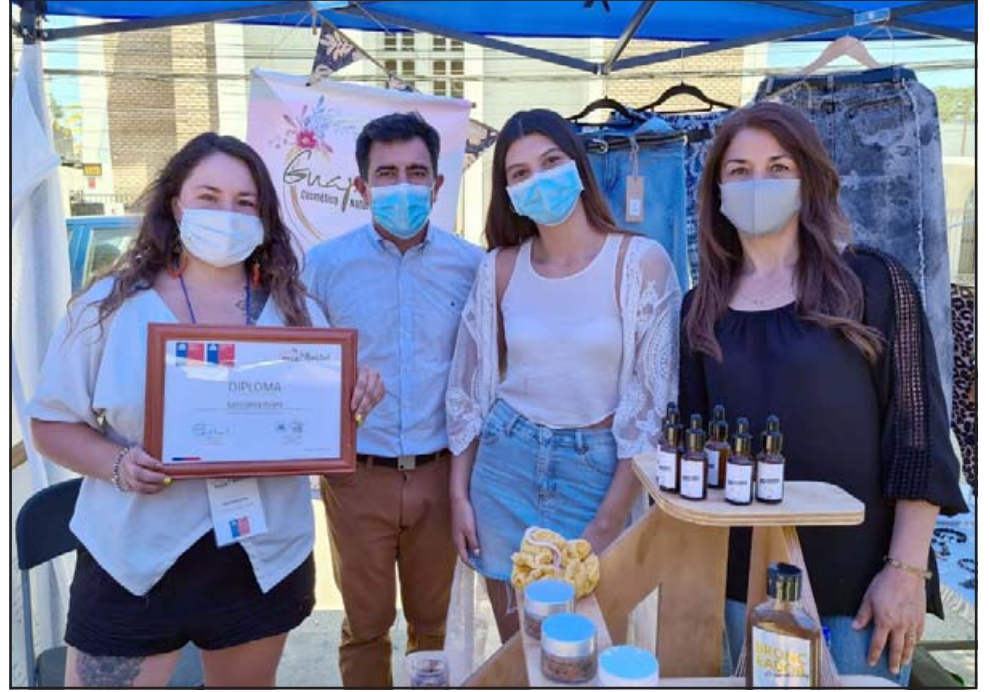
En total fueron 35 expositores de la provincia que presentaron excelentes productos para encontrar el regalo especial para esta Navidad.

La máxima autoridad provincial además agregó los beneficios que deja para los expositores haber participado de esta Expo: «Los expositores van a recibir adicionalmente, un toldo, una mesa, mantel y sillas; por lo que estamos muy contentos por la realización