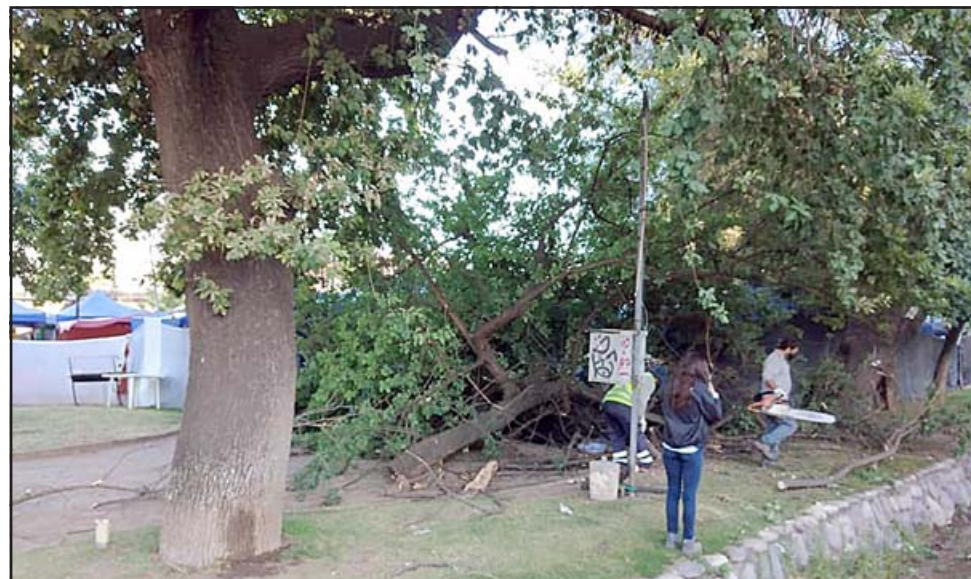
Desde tempranas horas en la mañana el personal municipal procedió a despejar el lugar.

Agradeció una vez más que no hubiera personas heridas: «Como digo el niño alcanzó a arrancar, a la hora que no arranca hubiera estado debajo, hubieran visto la silla como quedó a donde estaba sentado él. Es una cuestión que dan ganas de llorar, también la gente porque vimos todo el problema, era el árbol muy grande, ahora el alcalde está ordenando que corten un gancho que también se