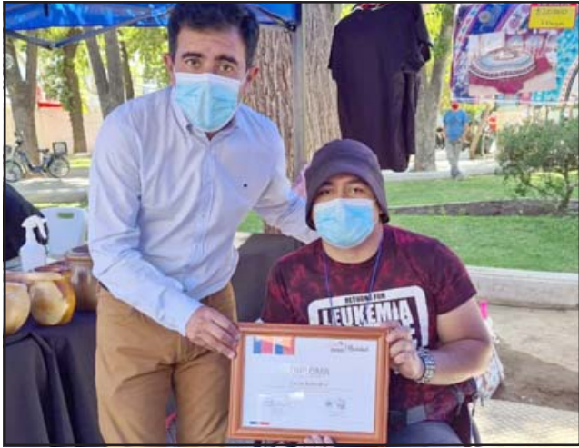
Los emprendedores que participaron de esta versión de la Feria Fosis se mostraron satisfechos por las ventas realizadas.

LOS ANDES.- Con gran éxito y luego de tres días finalizó en la Plaza de Armas de la comuna de Los Andes la Expo FOSIS Navidad, la cual reunió a 35 expositores de la provincia con excelentes productos para encontrar el regalo especial para esta Navidad.