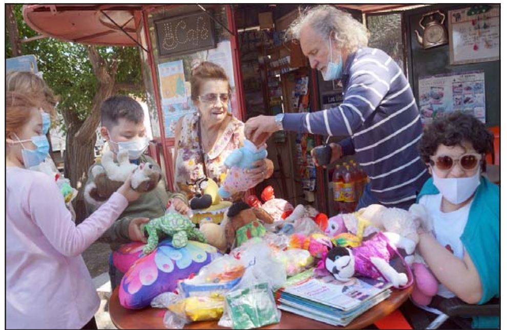
PARA TODAS LAS EDADES.- Hasta esta adulta mayor del barrio llegó con sus nietos para elegir sus peluches, son juguetes en excelente estado.