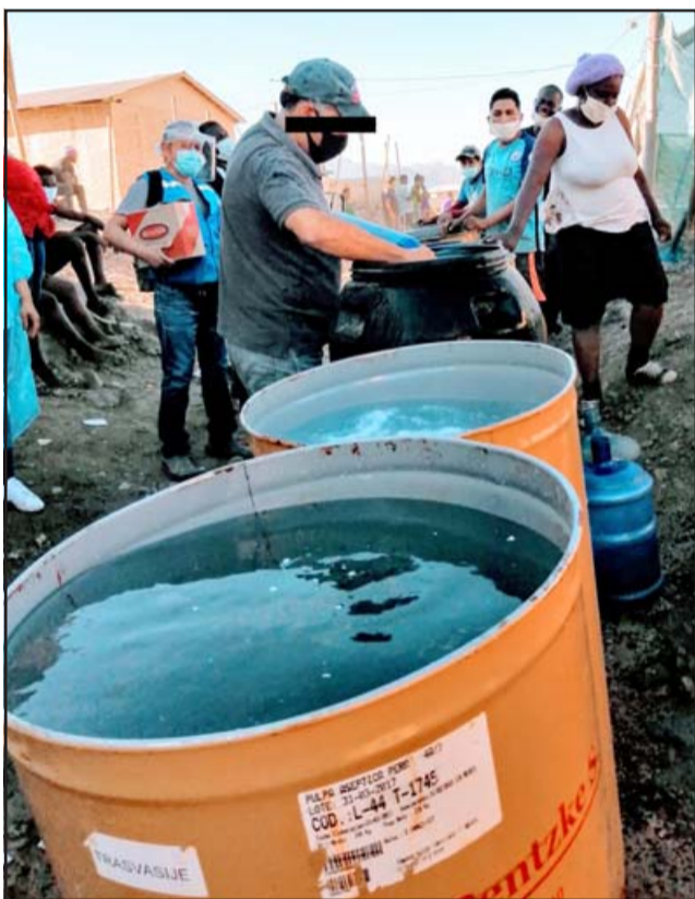
BOMBA DE TIEMPO.- El agua llenó tanques de metal y de plástico usándose mangueras. Este lugar es una bomba de tiempo a punto de estallar.