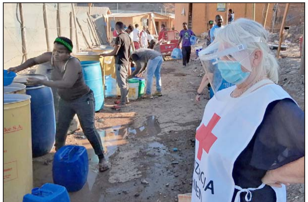
INFRAHUMANO.- Los cruzroja sanfelipeños no ignoran las deplorables condiciones casi inhumanas en las que viven estas familias.