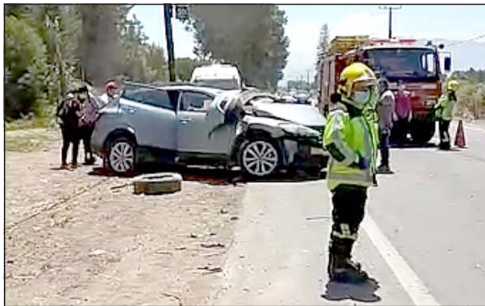
VIVOS DE MILAGRO.- En este auto viajaban siete personas, cuatro de ellas resultaron con golpes.