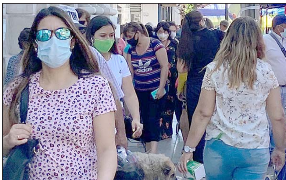
El notable aumento de personas circulando en las calles trajo consigo un aumento en el número de contagios de Covid-19.