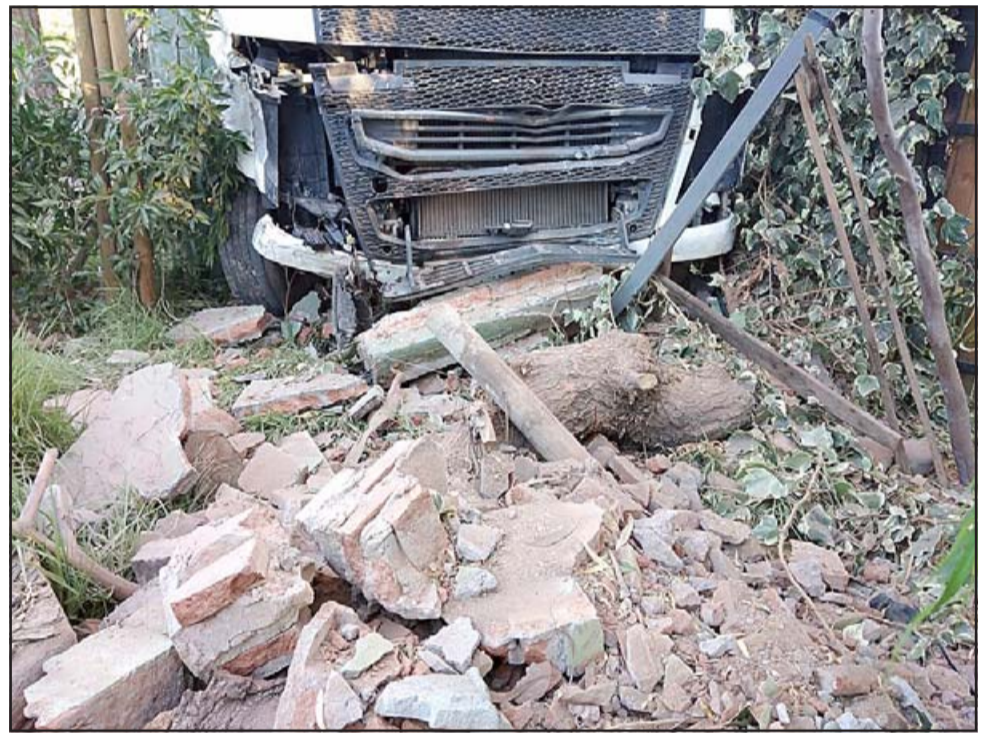
PUDO SER PEOR.- Al interior de la propiedad de un vecino se generaron muchos daños estructurales.