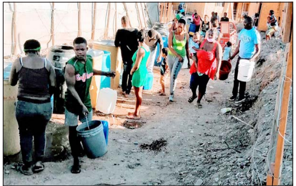
IMPRESIONANTE.- La escena es más que tercermundista, apela a nuestros sentimientos más nobles, pero igual nos alerta del peligro para la salud y el bienestar social.