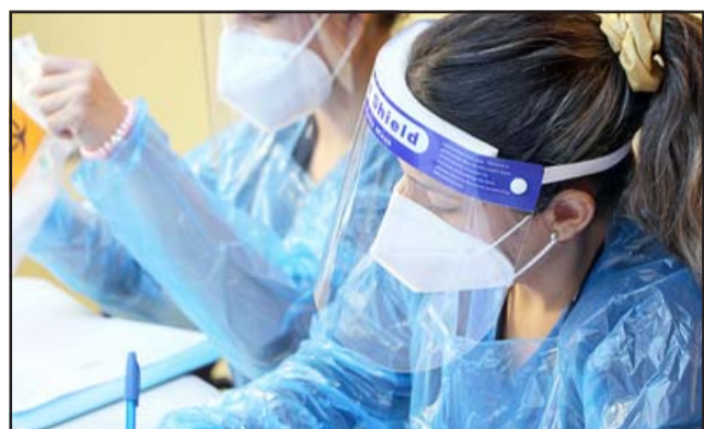
Los informes que maneja la Dirección de Salud Municipal muestran un incremento sostenido de los casos durante la última semana, reflejado en un alza que supera el 40%, situación que puede significar que San Felipe retroceda a la Fase 2.