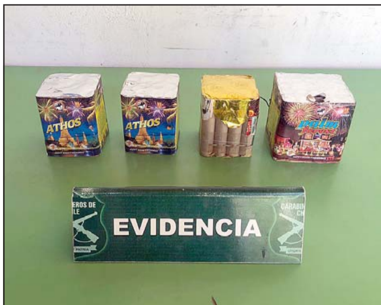
En la imagen los fuegos artificiales decomisados.

Recordar que actualmente el toque de queda comienza a las 22:00 horas hasta las 05:00 horas del día siguiente, exceptuando el día de año nuevo que es más tarde.