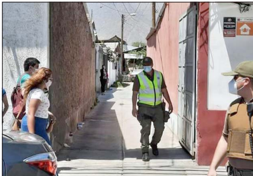
Personal de Carabineros en el domicilio de la mujer cuya causa de muerte se encuentra indeterminada.

Reiteramos que será el Servicio Médico Legal en las próximas 24 horas o más el encargado de determinar fehacientemente la causa de su muerte.