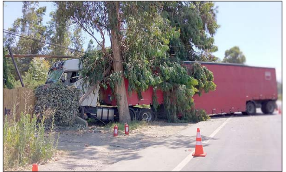
DAÑOS MILLONARIOS.- Así quedó este pesado camión cuando colisionó a un auto menor a la altura de El Mirador en Panquehue, y su conductor perdió el control del pesado vehículo.