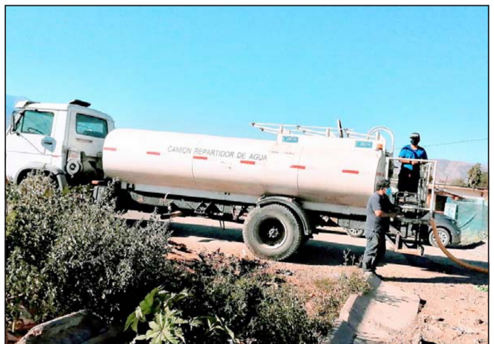
TRISTE REALIDAD.- En esta cisterna es llevada el agua que la Cruz Roja dona a estas familias en toma, se desconoce la calidad de la misma. Esta donación se gestionó con ayuda de Pastoral de Migrantes y Fundación María en el Camino.