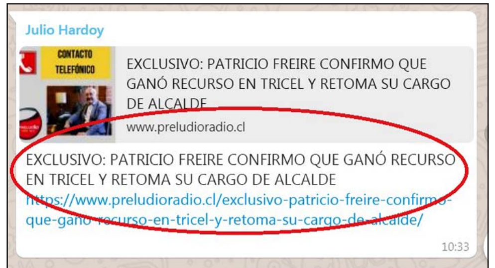
LA BROMA DEL DÍA.- Este es el 'Fake News' lanzado en redes sociales y alojado en una reputada emisora local sanfelipeña.

« Estoy muy molesto, me han llamado de todas partes colegas, amigos, familiares, empresarios, gente que me conoce y saben que este es un tema muy pero muy serio como para jugarme mi nombre públicamente con una tontería de estas. Imagino quiénes estarán detrás de este tipo de ataques disfrazados de broma, la situación que esta-