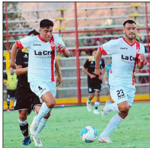
Los sanfelipeños están obligados a vencer a Rangers para seguir con sus opciones intactas de clasificar a la postemporada.