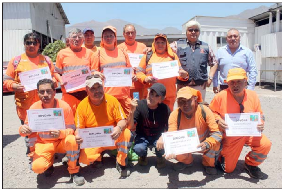
CUENTAS AL DÍA.- La empresa Veolia es una de las que, según García, al fin se les ha pagado todas las facturas atrasadas.

«El pago de horas extraordinarias sin un control adecuado, pasando a un sistema que se debe pedir autorización y especificar por qué se harán esas horas, se ha traducido en un ahorro importante», comentó el jefe comunal.