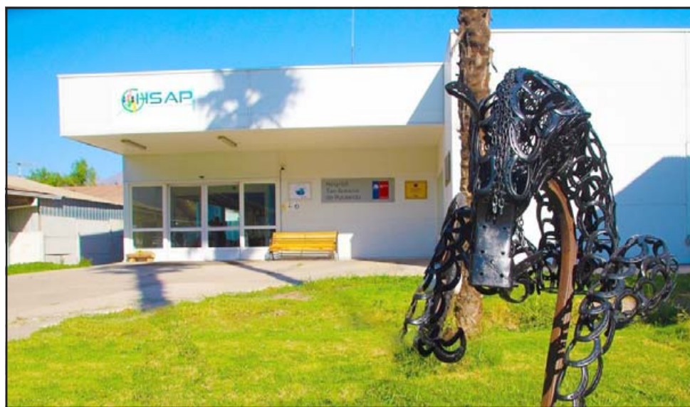
Frontis del Hospital San Antonio de Putaendo.

Según comentan los familiares al portal, se sienten