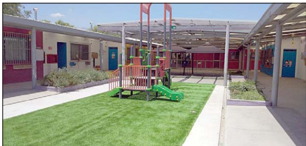
Los trabajos involucran una inversión de más de $167.000.000 y contemplan sombreaderos, juegos de patio, pasto sintético, entre otras mejoras de áreas verdes y espacios exteriores.

En la provincia de Los Andes, se desarrollaron proyectos de mejoras de pa-