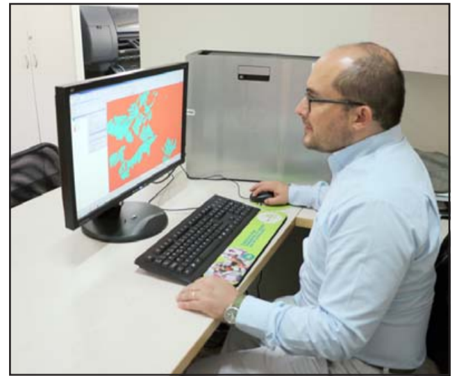
La información del proyecto está disponible en www.ciren.cl , donde es posible visitar un visualizador de mapas e información técnica para cada uno de los cultivos.