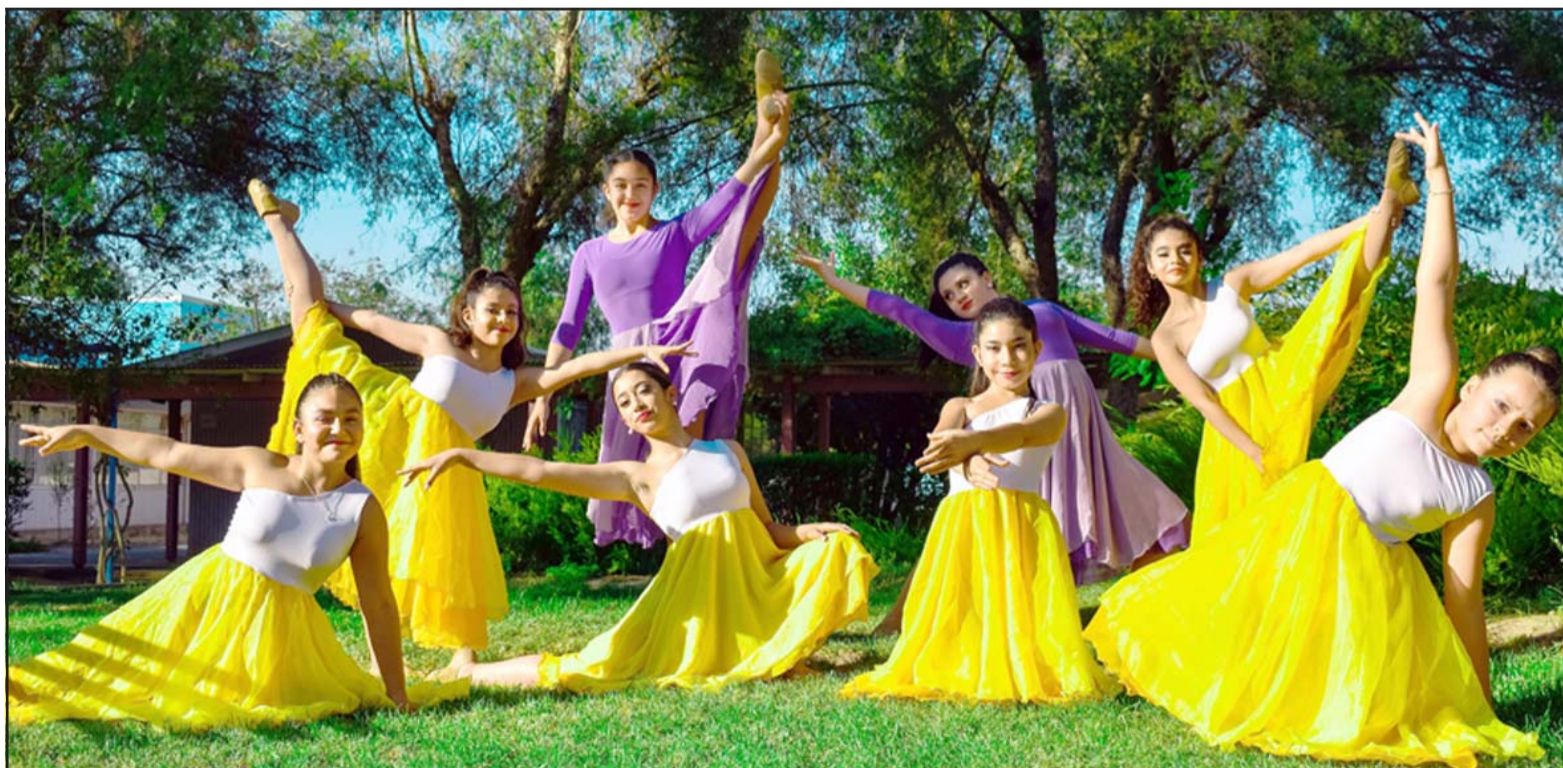
NUESTRAS CAMPEONAS. - Estas niñas ya están acostumbradas a ganar, pues llevan años compitiendo y entrenando muy responsablemente.