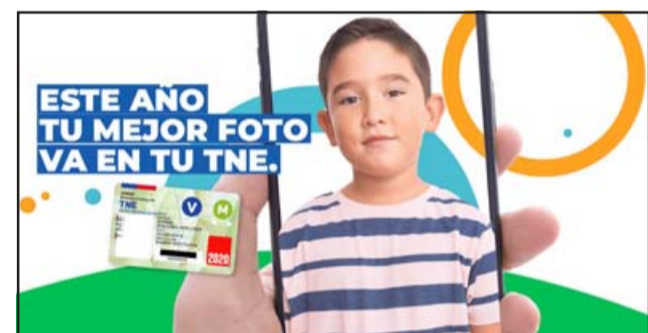
El proceso que antes de la pandemia se realizaba presencialmente en colegios y centros de educación superior, puede realizarse completamente online y sin aglomeraciones.

La TNE es un importante beneficio que entrega el Estado y que permite un ahorro hasta en un 70% en el valor del pasaje de loco-