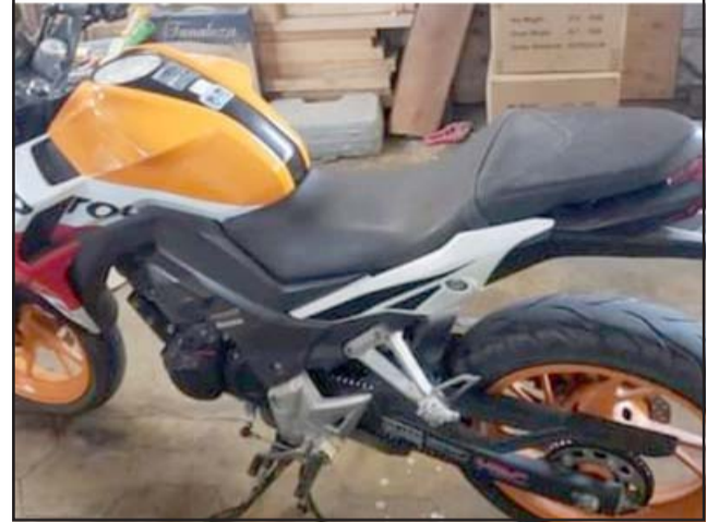
Esta es la moto que le fue robada a mano armada a un repartidor de Sushi.

pero él quedó nervioso, muy nervioso con todo lo que le pasó. La verdad que es preocupante porque así no se puede hacer ninguna cosa, no se puede trabajar tranquilo, no se puede hacer nada hoy en día.