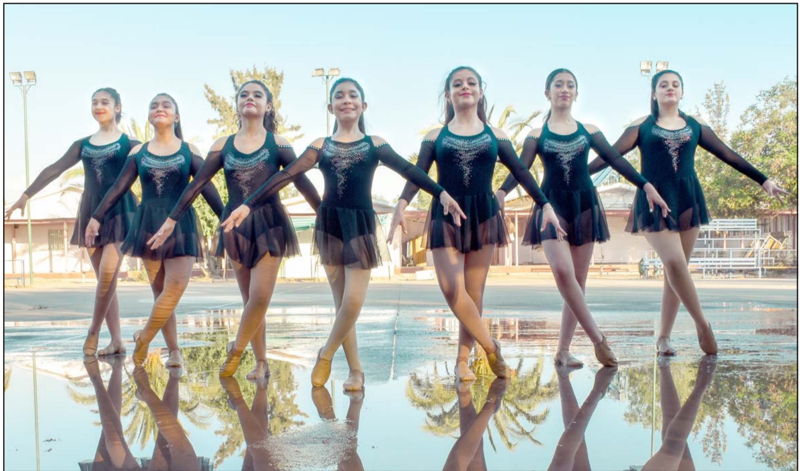
TALENTO LOCAL. - Aquí tenemos a las representantes de San Felipe que esperan poder participar en el Latinoamericano de Danza Florianópolis Brasil 2021.

«Nuestro equipo en tiempo normal lo conforman alumnas de 4º básico a 4º medio, separadas en categoría Básica y Media. Dicho taller pertenece al Liceo y son financiados por la ley SEP, junto al apoyo del Municipio y DAEM. A lo largo de estos años el equipo se ha coronado campeón nacional en cinco ocasiones, y ya ha traspasado fronteras, compitiendo de manera internacional ya en tres ocasiones: Córdoba, Argentina, campeonato Cheer Open 2015 en Córdoba; Argentina, en el Campeonato Universal Dance 2017 , en esa ocasión ganamos y nos permitió ir a competir a Bo-