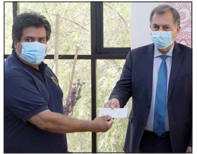
El municipio cumplió el compromiso de mantener al día el pago de este beneficio a Bomberos, entendiendo que con esto permite solventar en parte los costos que tiene la institución.

«Debemos recordar que Bomberos es una organiza-