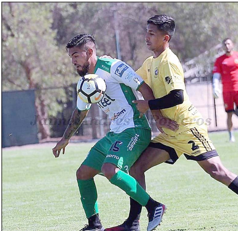
Lecaros reconoció que la eliminación fue un golpe muy duro en la interna de Trasandino.