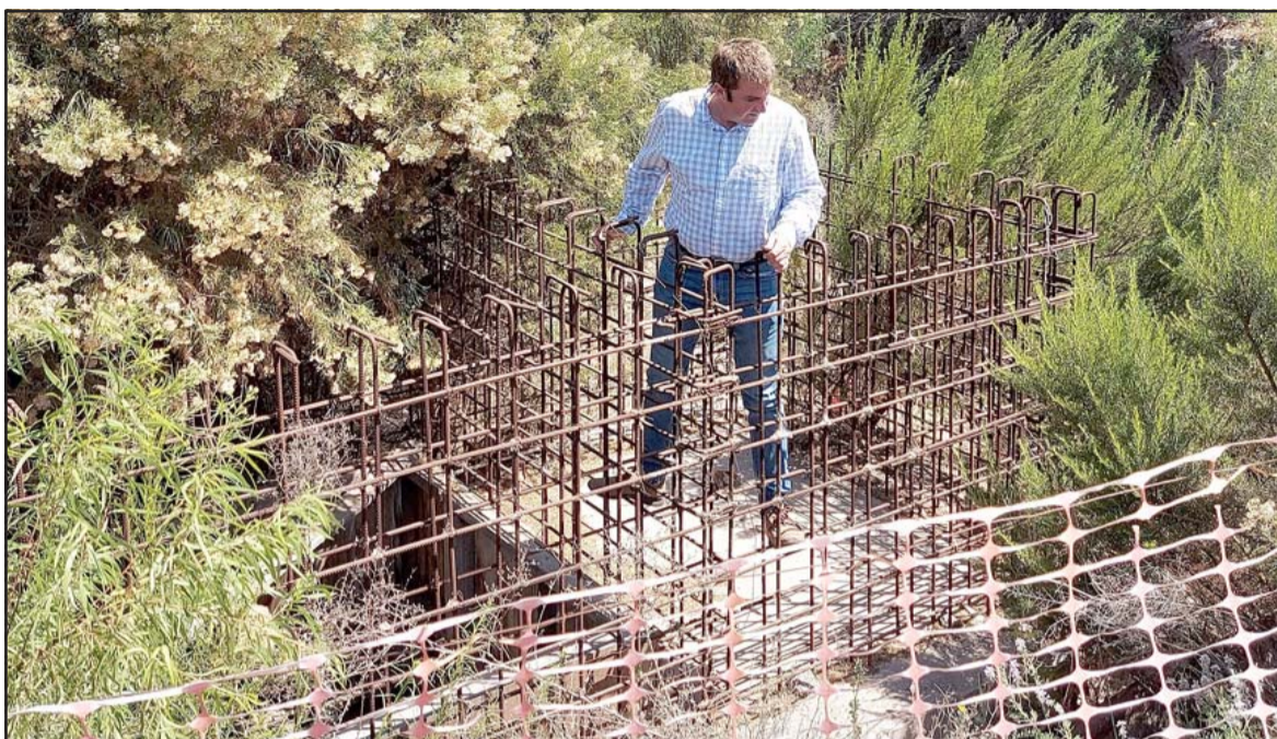
OBRAS ABANDONADAS.- Son 360 las uniones domiciliarias originales, son también casi 500 casas las afectadas, o sea, más de 1.000 personas afectadas con este errático accionar de las autoridades a cargo del proyecto.

- A mediados de agosto de 2017, realizaron una visita a terreno los consejeros regionales junto a una Comisión Fiscalizadora creada para la ocasión, presidida por Roberto Chahuán , quienes