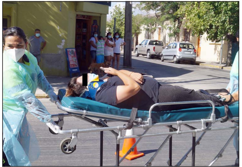
FUERA DE PELIGRO.- Profesionales paramédicos del SAMU trasladaron a la ciclista a Urgencias del Hospital San Camilo.

Conductora del auto reconoció que no la vio: