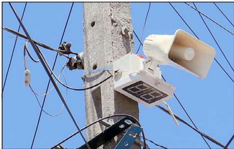
CASI NULAS. - Aunque estas alarmas están funcionando, sólo suenan cuando son activadas desde cada hogar. De poco ayudan si los vecinos están dormidos.