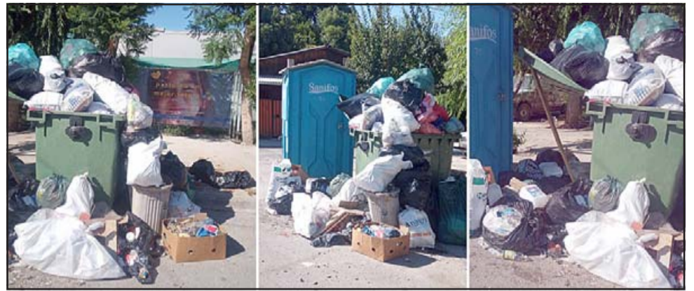
Vecinos suelen acumular gran cantidad de basura en los costados de los contenedores cuando éstos están copados, lo que se traduce en generación de microbasurales.

El profesional recordó que en periodo de pandemia sanitaria, es de mucha importancia mantener los es-