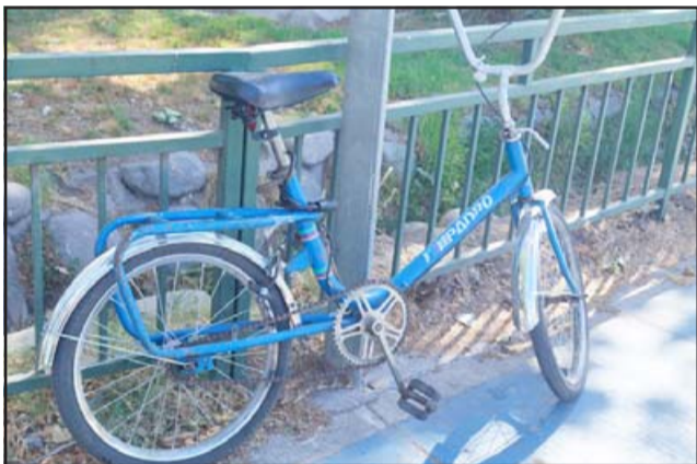
MUJER ATROPELLADA.- En esta pequeña bicicleta se movilizaba la mujer por la ciclovía de Avenida O'Higgins.