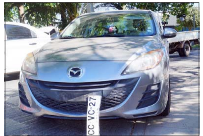
RECONOCIÓ SU DESCUIDO.- La conductora de este auto Mazda patente CC VC 27, causante del atropello, estuvo a su lado evitando que fuera arrollada por otros vehículos a la espera de personal de Bomberos y SAMU.