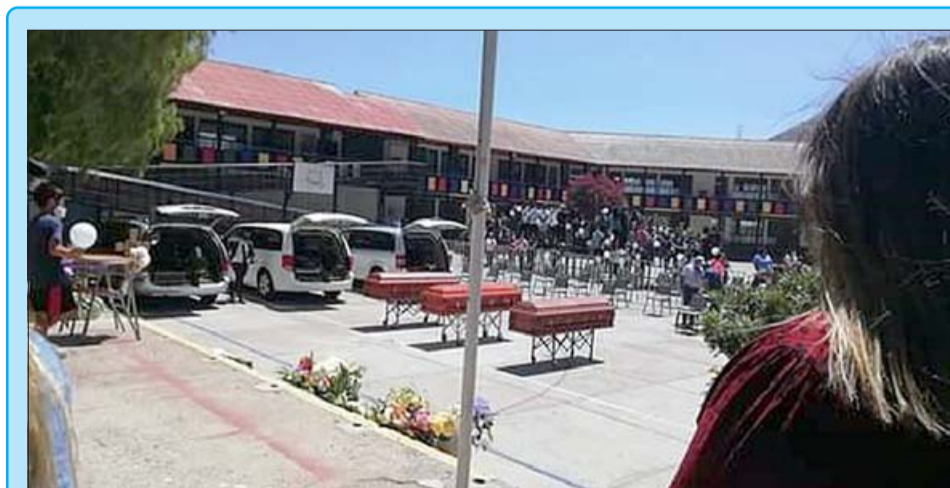
TRAGEDIA FAMILIAR. - Ayer al mediodía en el Colegio Menesianos en Llay Llay, se realizó una ceremonia por los tres jóvenes de esa comuna que fallecieron en un trágico accidente en Salamanca, donde además murió su padre y el conductor del otro vehículo. En la imagen los tres ataúdes que posteriormente fueron trasladados a Santiago donde fueron sepultados.

que tenemos en este ámbito (la seguridad pública es deber de otras instituciones), evidentemente los últimos años los municipios han sido actores relevantes y hemos avanzado notablemente recuperando sitios eriazos de nuestra ciudad, mejorando la iluminación de nuestras calles, para apoyar la sensación de seguridad».