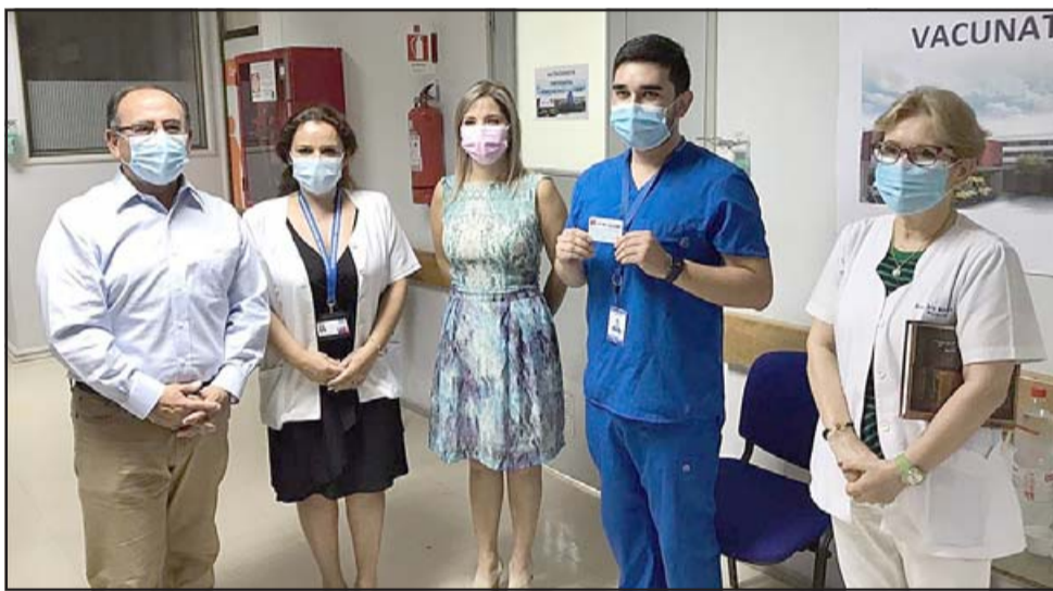
Autoridades de Gobierno y Salud celebraron la llegada de las primeras vacunas, aunque se espera recién en el primer semestre vacunar a toda la población.

positivas durante estos días tiempo hasta lograr la vacunación masiva y los resultados de esta», concluyó Abarca.