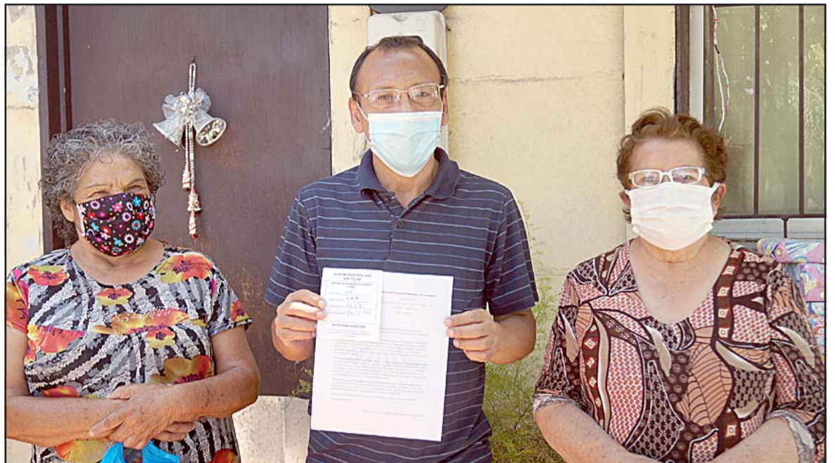
DENUNCIA PÚBLICA. - Aquí tenemos a varios vecinos del pasaje J.L. Castro, solicitando a través de Diario El Trabajo más seguridad para Población Aconcagua, enviaron esta carta solicitando apoyo de Carabineros.