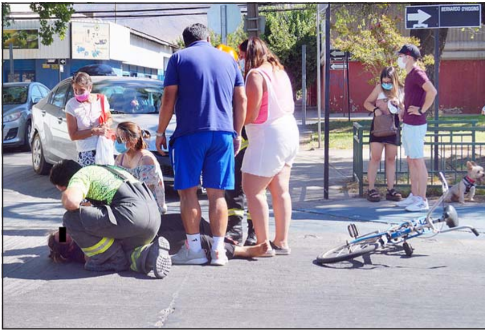
CONTRA EL PAVIMENTO.- Tanto la bicicleta como su dueña fueron eyectadas al centro de la avenida, mientras que vecinos del sector rodearon a la mujer para evitar que fuera nuevamente atropellada.