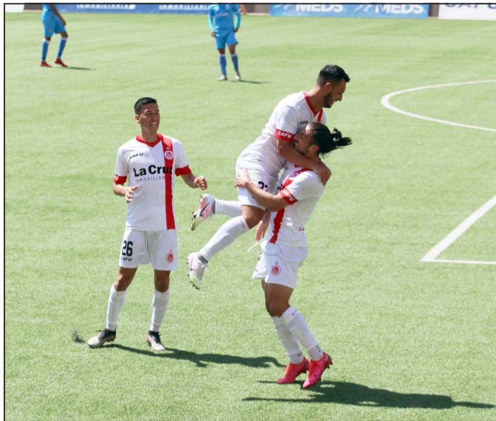
El cuadro sanfelipeño debe sumar por obligación ante el monarca de la Primera B.

19:15 horas: Ñublense – Unión San Felipe