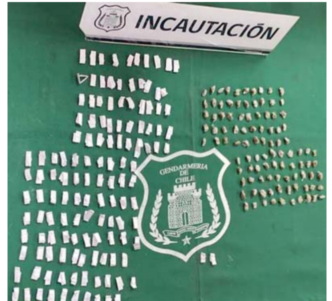
Uno de los gendarmes encargados de la inspección de los implementos revisó con el equipo de rayos X un listón de madera, descubriendo que la droga en su interior.

El comandante Millón destacó «el profesionalismo con que el personal de ser-