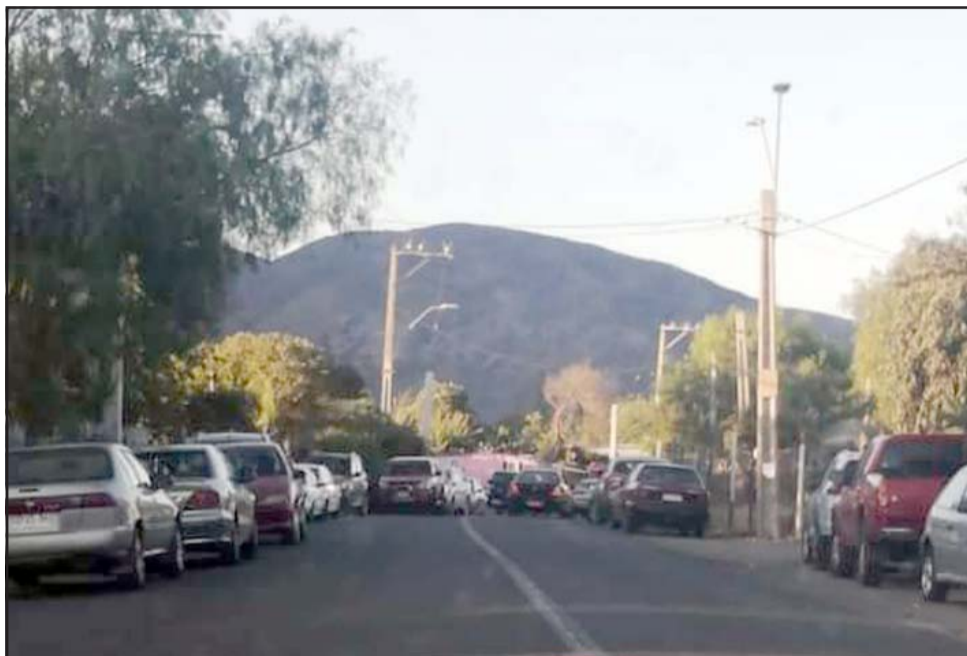
Vehículos afuera del recinto donde se estaba organizando el evento deportivo que reunió a unas 100 personas, algo que está prohibido en pandemia.

También se supo que desde la Seremi de Salud se inició un sumario sanitario.