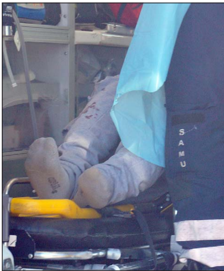
MUY MAL HERIDO.- Las cámaras de Diario El Trabajo captan el pantalón ensangrentado del motociclista mientras era atendido por personal del SAMU.