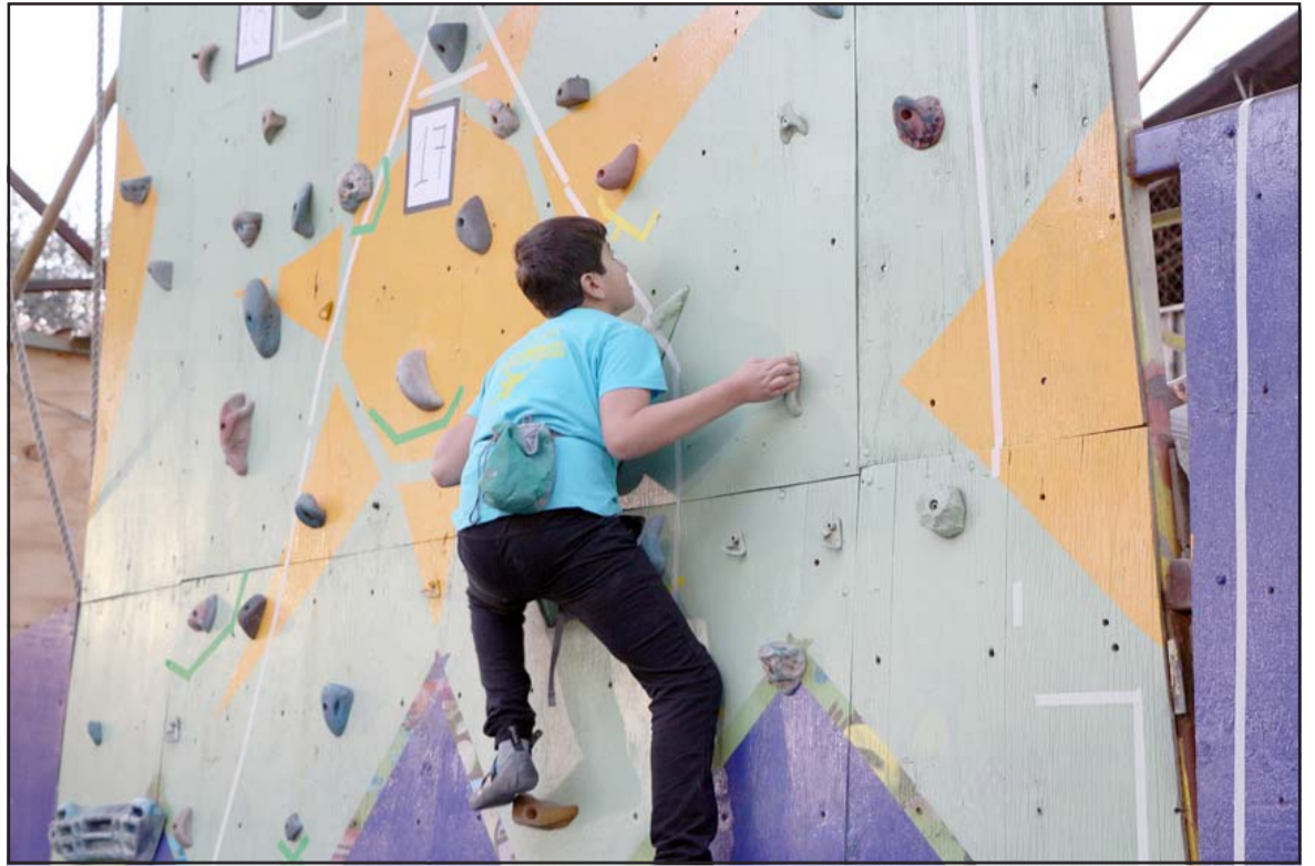
Escalada, uno de los tantos talleres que se estarán desarrollando como parte del programa 'Verano Entretenido' del municipio sanfelipeño.

Finalmente, en el parque de barras, calistenia para jóvenes