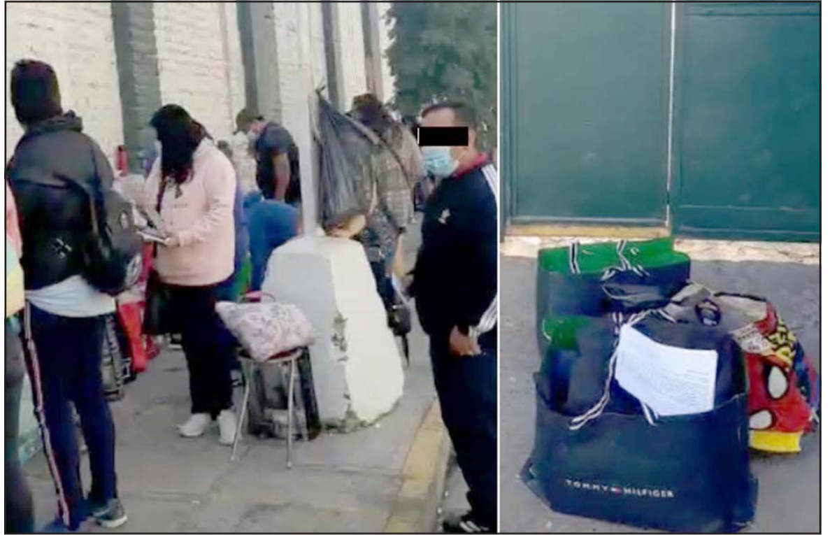
CASTIGADA.- Aquí vemos las bolsas con ropa y artículos personales del interno, que Gendarmería rechazó su ingreso al centro penal, también la fila de familiares de internos.