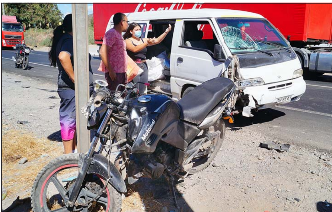
ACCIDENTE DEL DÍA.- Así quedaron la motocicleta y el furgón tras la fulminante colisión, un verdadero milagro que sobreviviera el motociclista a tal impacto.