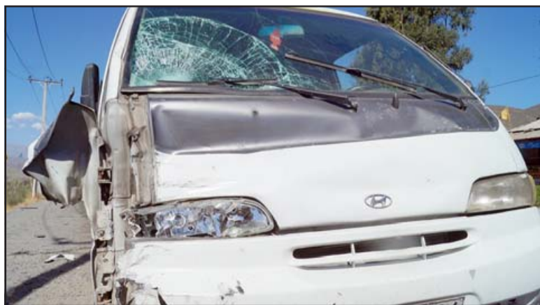
DAÑOS MATERIALES.- El parabrisas y parte frontal del furgón quedaron bastante dañados, una dicha que no se tenga que lamentar una tragedia mayor.