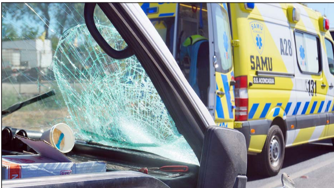
DE ALTA ENERGÍA.- El impacto fue de alta energía, la moto con su conductor se estrellaron contra el parabrisas del furgón.