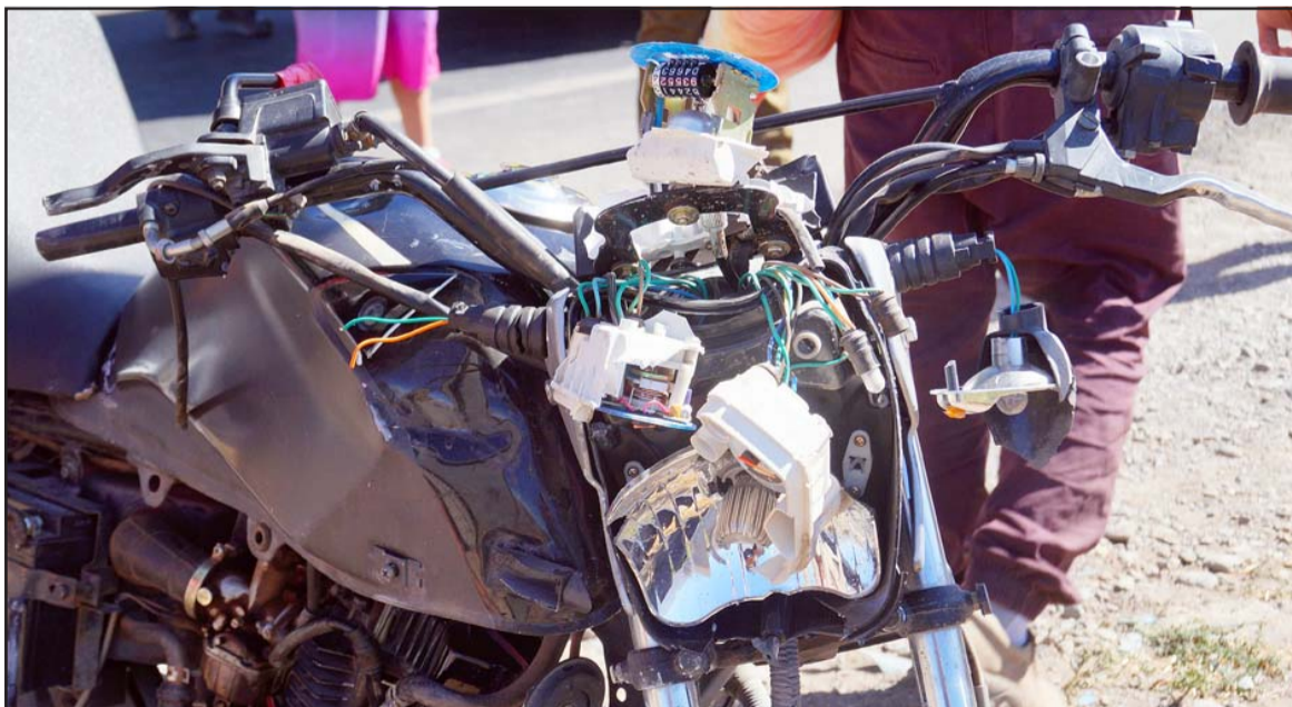
DESINTEGRADA.- La parte frontal de la motocicleta quedó completamente desintegrada tras el accidente.