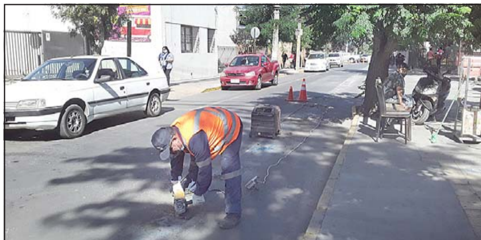
Un funcionario con un esmeril eléctrico corta los pernos que unían las tachas al cemento en calle Merced.

Al ser consultado nuevamente por esta medida, señaló que se iban a sacar las principales vías de conflicto como son «Prat, Merced, Salinas, porque el principio original de las ciclo vías, y todos estamos de acuerdo en llegar a la alameda y en la alameda vamos a instalar estacionamientos ade-