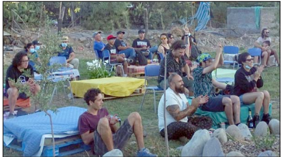
ROCK CAMPESINO.- Muchos son los fieles que siguen esta banda donde quiera que se presente.