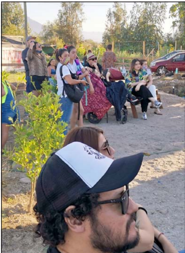
Muchos querían estar en la tocata, pero el aforo era para 30 personas, guardaron su distancia como corresponde.

Desde 1929 a la Era Digital ...la mejor forma de comenzar el día