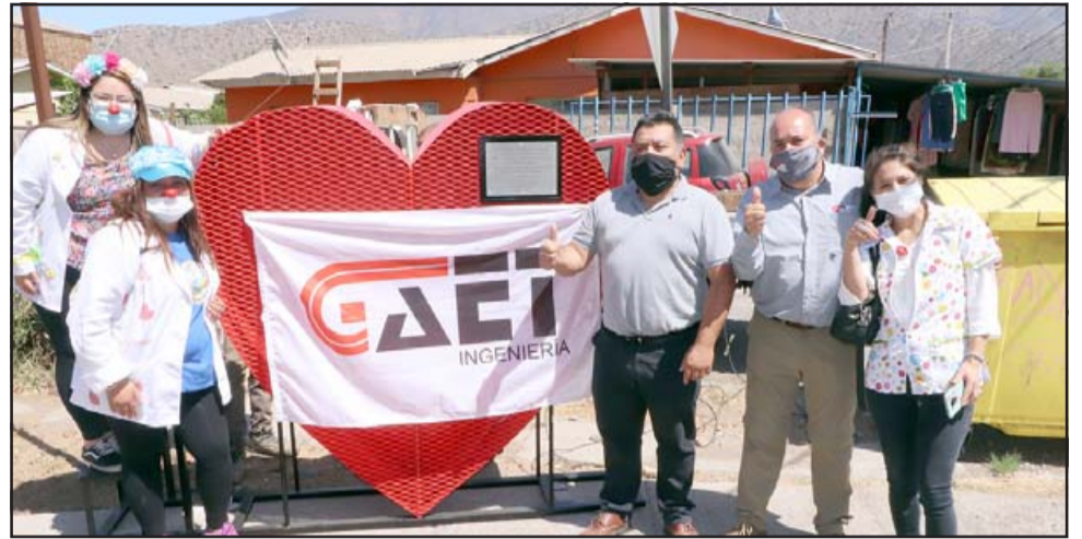
La estructura metálica fue donada por la empresa Gaet Ingeniería y el reciclaje está a cargo de la agrupación Clow-Risas Aconcagua.

mos dar un mensaje para que la gente tenga solidaridad, haya amistad como alegría y estemos más unidos que nunca, sobre todo en tiempos difíciles».