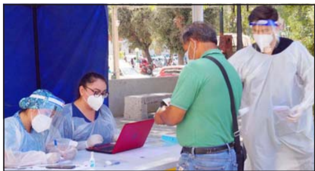
VIENE FASE 2.- El operativo TTA (Trazar Testear y Aislar) estuvo este martes a cargo de profesionales del Cesfam Curimón en la Plaza Cívica.