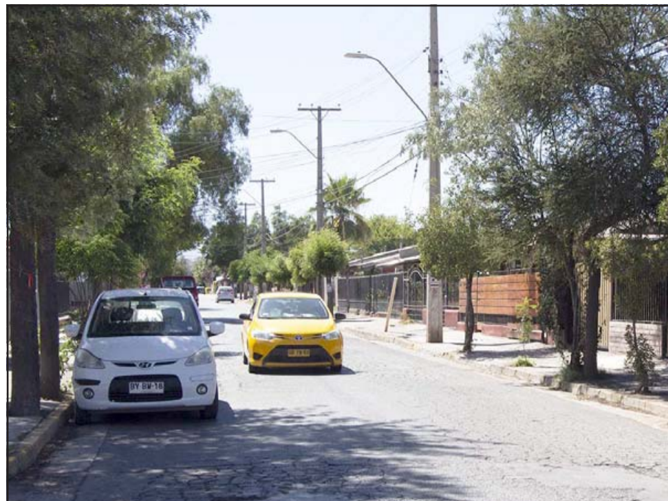
Durante esta semana se efectuará la licitación que permitirá la instalación de 40 resaltos en diferentes puntos de la comuna.

en el sector centro (Santo Domingo – Navarro), 2 en calle Santo Domingo (Condominio Santo Domingo), 3 en Avenida Chile (Villa El Canelo - Villa Argelia), 2 en Avenida Miraflores (Barrio Miraflores), 4 en el eje vial Miraflores-Escuela Agrícola (Villa El Descanso), 2 en Tacna Norte y Sur (Diego de Almagro y José Manso de Velasco), y 4 en el eje vial avenida Bernardo Cruz (La Santita-Pedro Aguirre Cerda).