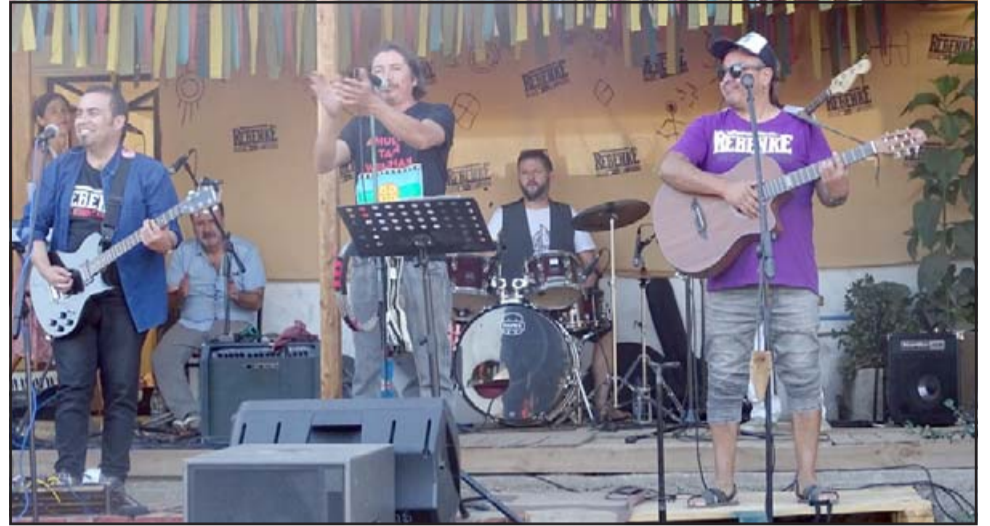
SIEMPRE REBENKE.- Con gran Fuerza y Vigor los amigos de Rebenke presentaron su primer CD a sus fanas.