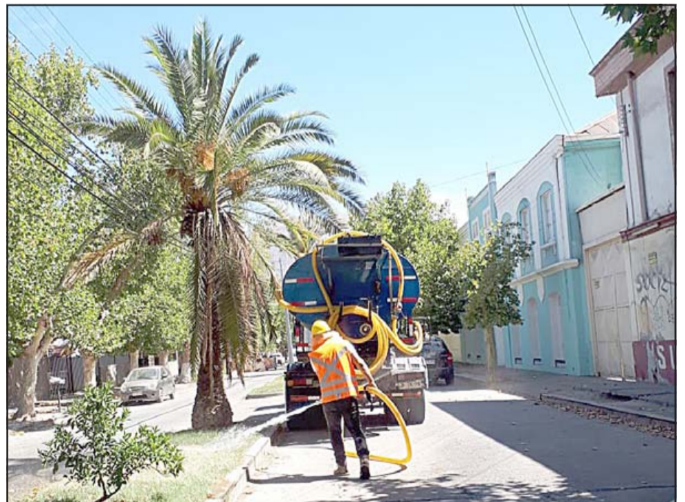
La mantención de las áreas verdes vuelve a estar en la polémica a raíz de una querrela presentada por el municipio en contra del exadministrador municipal, debido al doble pago de una factura por casi 53 millones de pesos correspondiente al mes de marzo de 2020.

El 18 de noviembre, la empresa de factoring solicitó a la Municipalidad de San Felipe el pago de la primera factura; luego, con fecha 24 de diciembre, Eco Sweep informó a la corporación que se encontraba regularizándola, acción que solo ratificó que el docu-