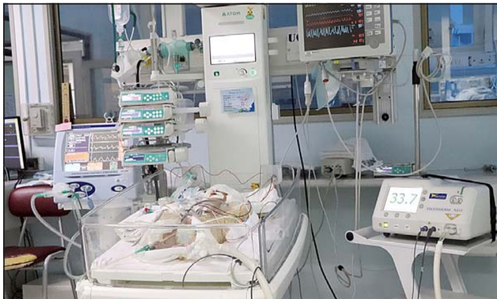
El equipo permite eliminar o disminuir las graves secuelas de la asfixia cerebral en los recién nacidos, bajando la temperatura cerebral y corporal de los menores a 33,5 grados.

Servicio, sumando técnicos, profesionales y médicos, pues se requirió aprender nuevas técnicas, manejar otro tipo de pacientes y realizar diversos protocolos para hacerlo lo mejor posible. « Todo este trabajo ha valido la pena, pues los resultados obtenidos son más que satisfactorios y nuestros patientitos han podido encontrar una solución a sus problemas acá en casa, con todo el cariño que nosotros les entregamos ».