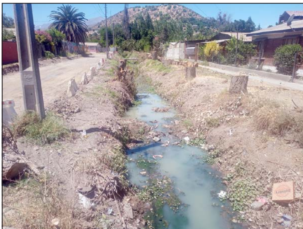
El depósito de aguas servidas en un canal de regadío está causando graves problemas a unas 400 familias de Catemu.

Agregó que la empresa Esval este domingo a última hora y el lunes en la mañana se constituyeron en el lugar, sacaron muestras de agua: «En principio ellos estaban en condiciones de asegurar que estos derrames no tienen que ver con la red que ellos administran, o sea no sería en este caso responsabilidad de ellos, y también descartan que las aguas servidas provengan de alguna rotura que haya podido hacer la