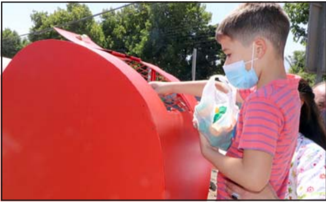
Los recursos que se generen irán en ayuda de niños con enfermedades oncológicas, además de niños con capacidades diferentes como asimismo adultos mayores.

El corazón de acopio de tapas plásticas en la comuna de Panquehue, está ubicado en el acceso principal de la Villa El Bosque. Desde el día de su instalación por parte de la empresa GAET Ingeniería, vecinos ya han estado depositando tapas para su cometido.