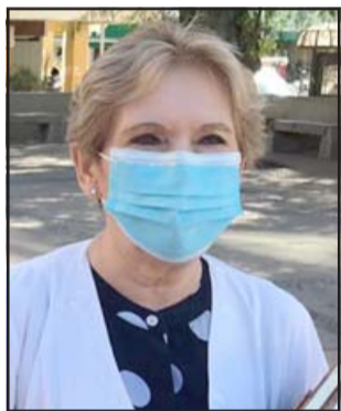
La psiquiatra Iris Boisier reconoció que el funcionario fue desvinculado del establecimiento debido a su conducta.

Al respecto la psiquiatra Boisier, en conversación con nuestro medio, reconoció que fue lamentable lo