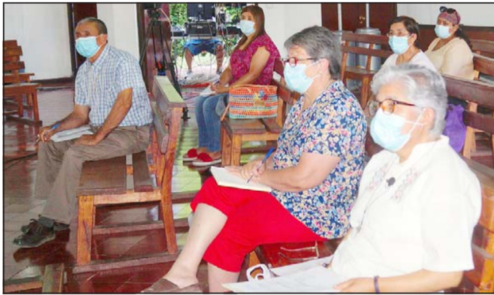
AMPLIA PARTICIPACIÓN. - Entre la gran cantidad de catequistas hay hombres y mujeres de todas las edades. En total son cerca de 200 catequistas los participantes este año.

traron este lunes en horas de la tarde la actividad desarrollada en la capilla de El Tambo, en dicha Escuela de Verano hubo una gran participación de los catequistas.