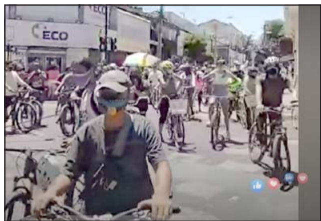
Ciclistas protestan por la medida en el centro de la ciudad.

cuados para que puedan dejar sus bicicletas con seguridad», señaló Beals.