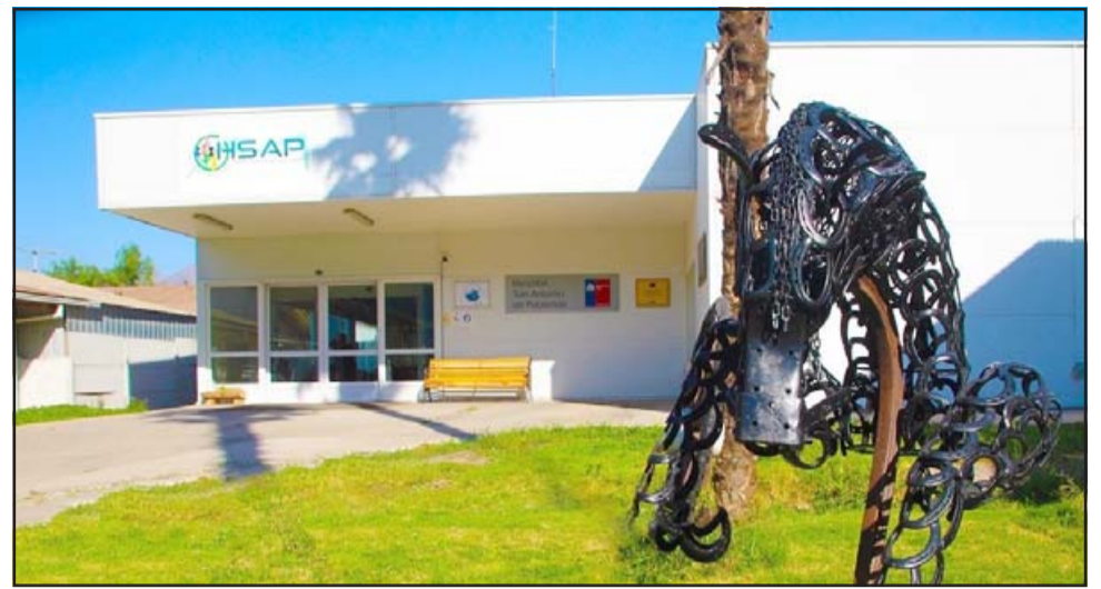
Frontis del Hospital San Antonio de Putaendo.

- Mire, acoso laboral en realidad no les cuesta tanto, hay varios sumarios. El acoso sexual es un tema algo