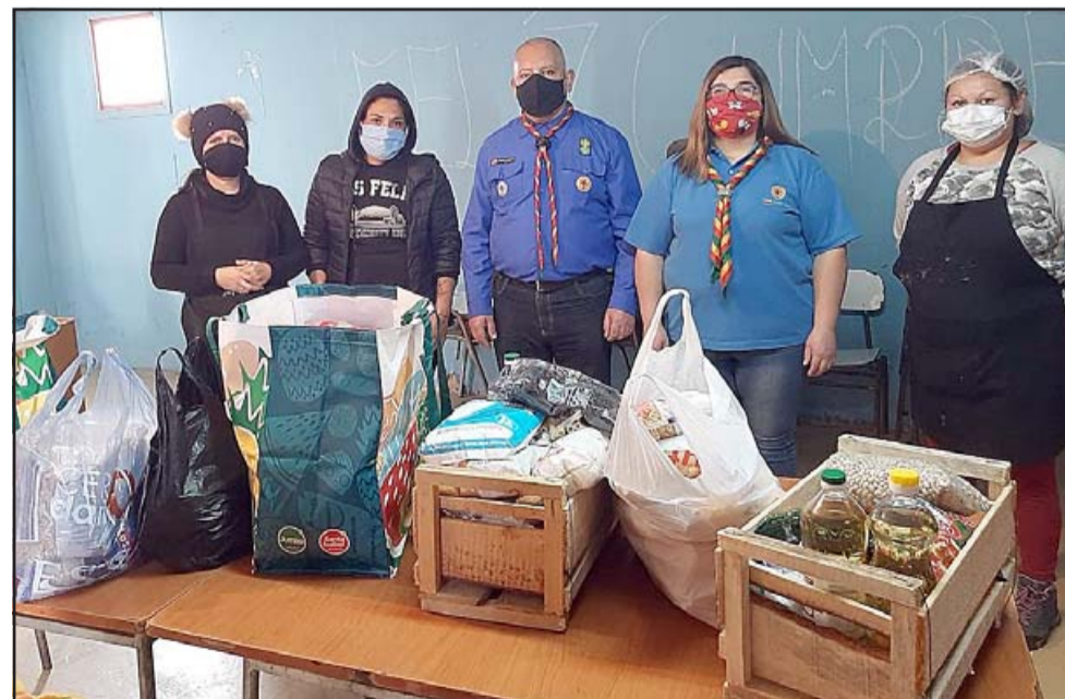
TRABAJO SOCIAL.- Aquí vemos a los Scouts Ashanti entregando mercadería al Comité de la Olla Común de los Departamentos de Encón.