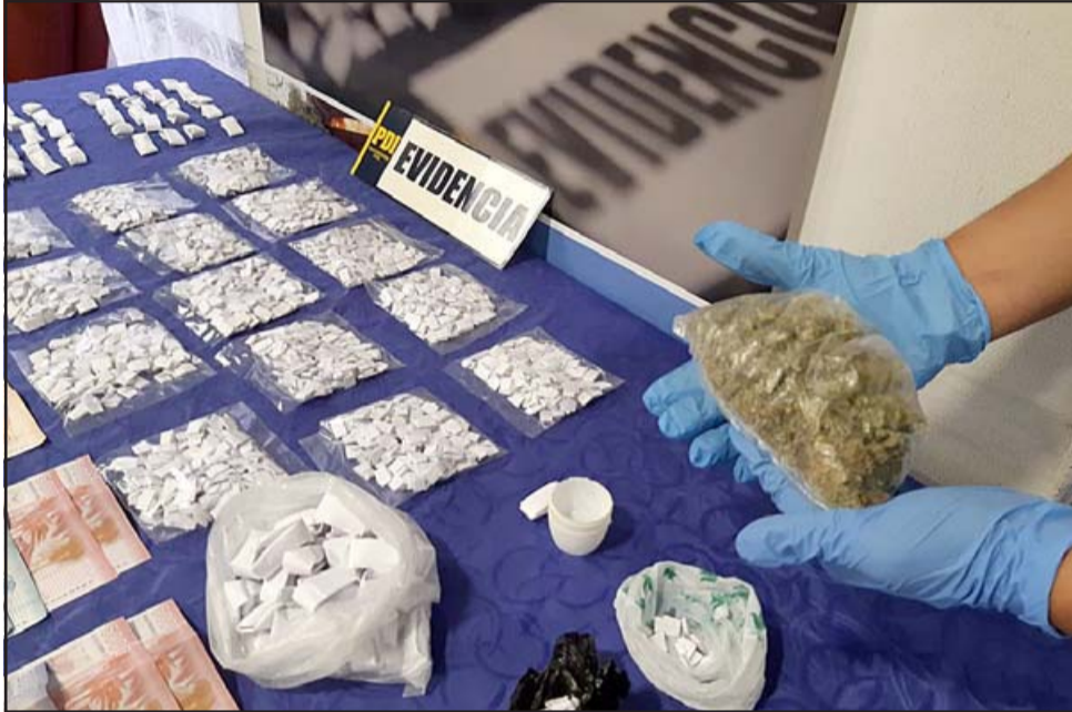
MESES DE TRABAJO.- Este jueves 28 de enero en horas de la tarde, detectives de la PDI de San Felipe culminaron con éxito una investigación por tráfico de drogas que venían realizando desde hace dos meses.