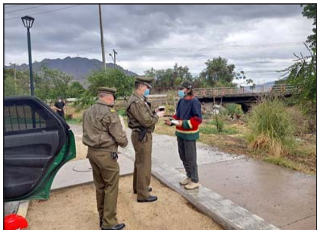
Carabineros entregando desayuno a un hombre en situación de calle, cerca del Puente Encón.

dos, todos pasarán a control de detención el día de mañana al Juzgado de Garantía San Felipe.