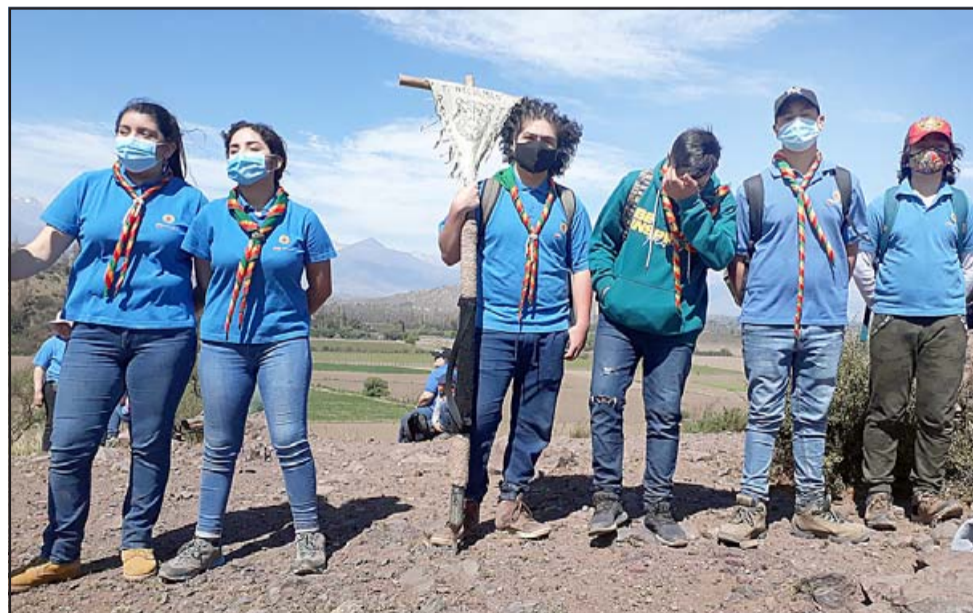
POR FIN JUNTOS.- Luego de más de seis meses de encierro, ellos lograron a finales de 2020 realizar actividades en el Cerro La Virgen.