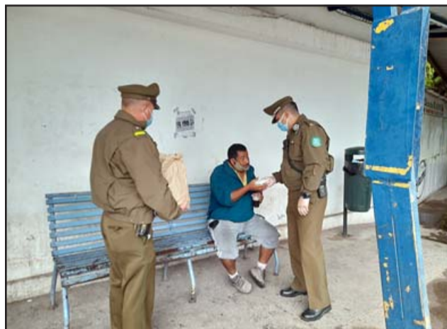
Acá entregando desayuno a una persona en situación de calle en el terminal de buses de San Felipe.