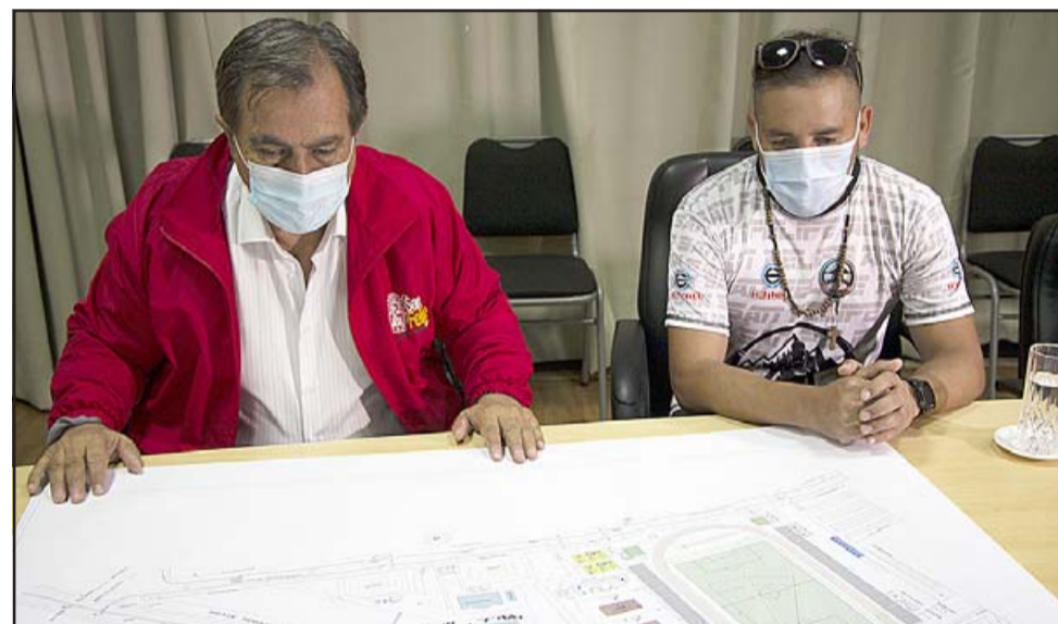
La iniciativa es impulsada por el alcalde Beals, se realizará en tres etapas y significará una inversión total que bordea los 6.500 millones de pesos.

Todo esto incorporará un completo circuito de vigilancia y guardias de segu-