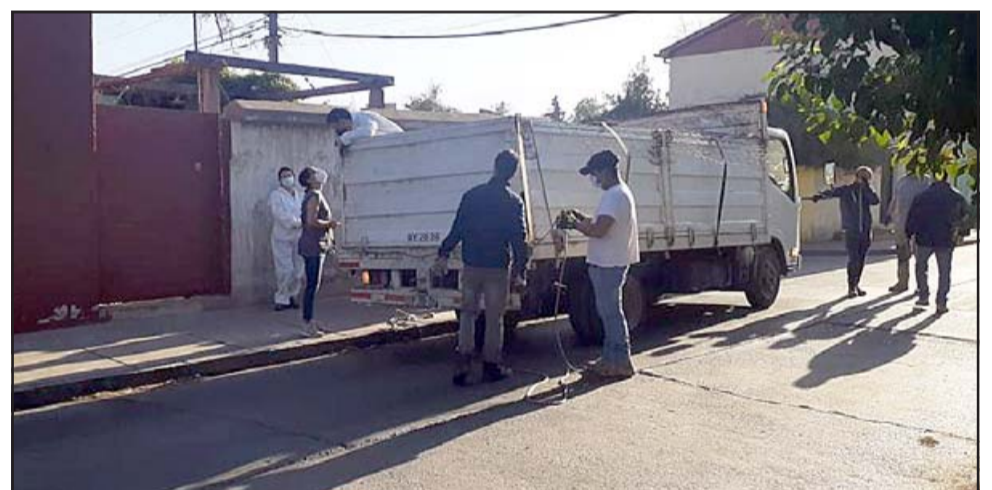
Este operativo entregó respuesta a una denuncia ciudadana, mascotas fueron atendidas por profesionales veterinarios.

tante que todos los vecinos tomen conciencia sobre los deberes de los dueños de mascotas y que se indican en la Ley de Tenencia Responsable, «puesto que esto no sólo se limitan al registro y el implante del microchip, sino también, responsabilizarse de su alimentación y manejo sanitario».