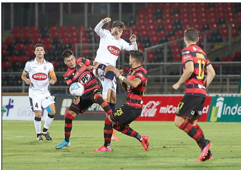
Deportes Melipilla es un rival de riesgo cosa que demostró al eliminar con claridad a Rangers.