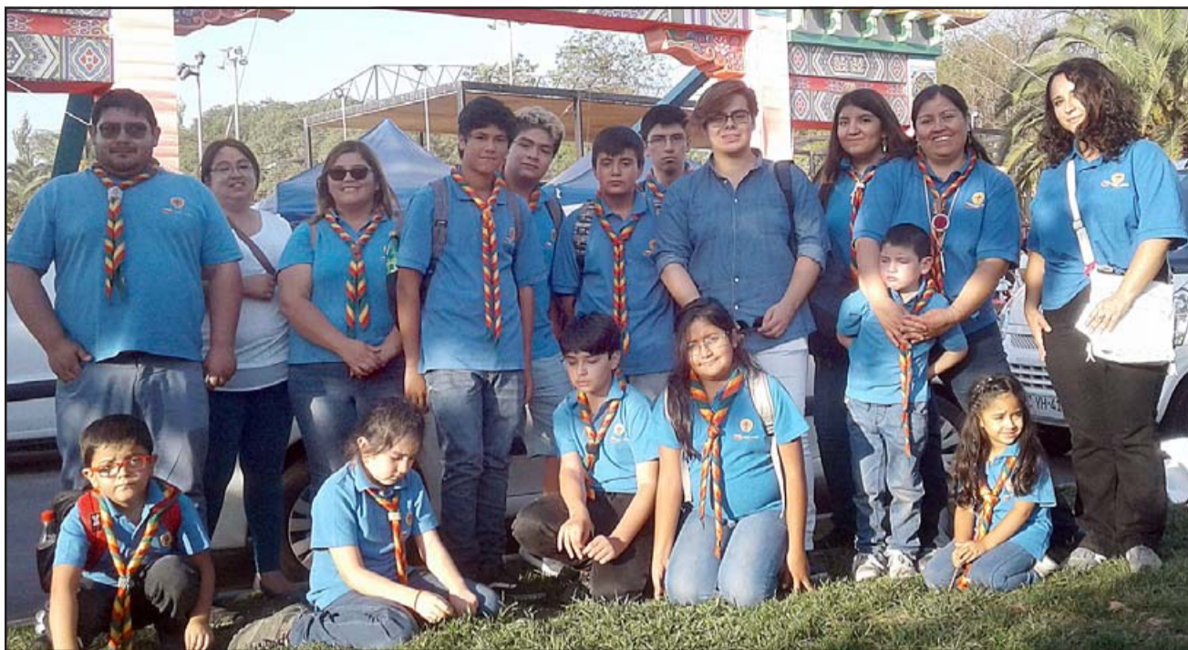
SCOUTS IMPARABLES.- Pese a un 2020 de encierro, limitación para actividades públicas, al final del año estos chicos lograron reunirse.

- Muy bien, partimos con unos pocos niños, pero perseveramos con la idea, hasta que ya se conectaban todos y las esperaban con ansias. Para los niños era un escape de su encierro, una forma de ver a sus amigos y lo más importante, de poder ser niños. Cada reunión era un desafío, para poder man-