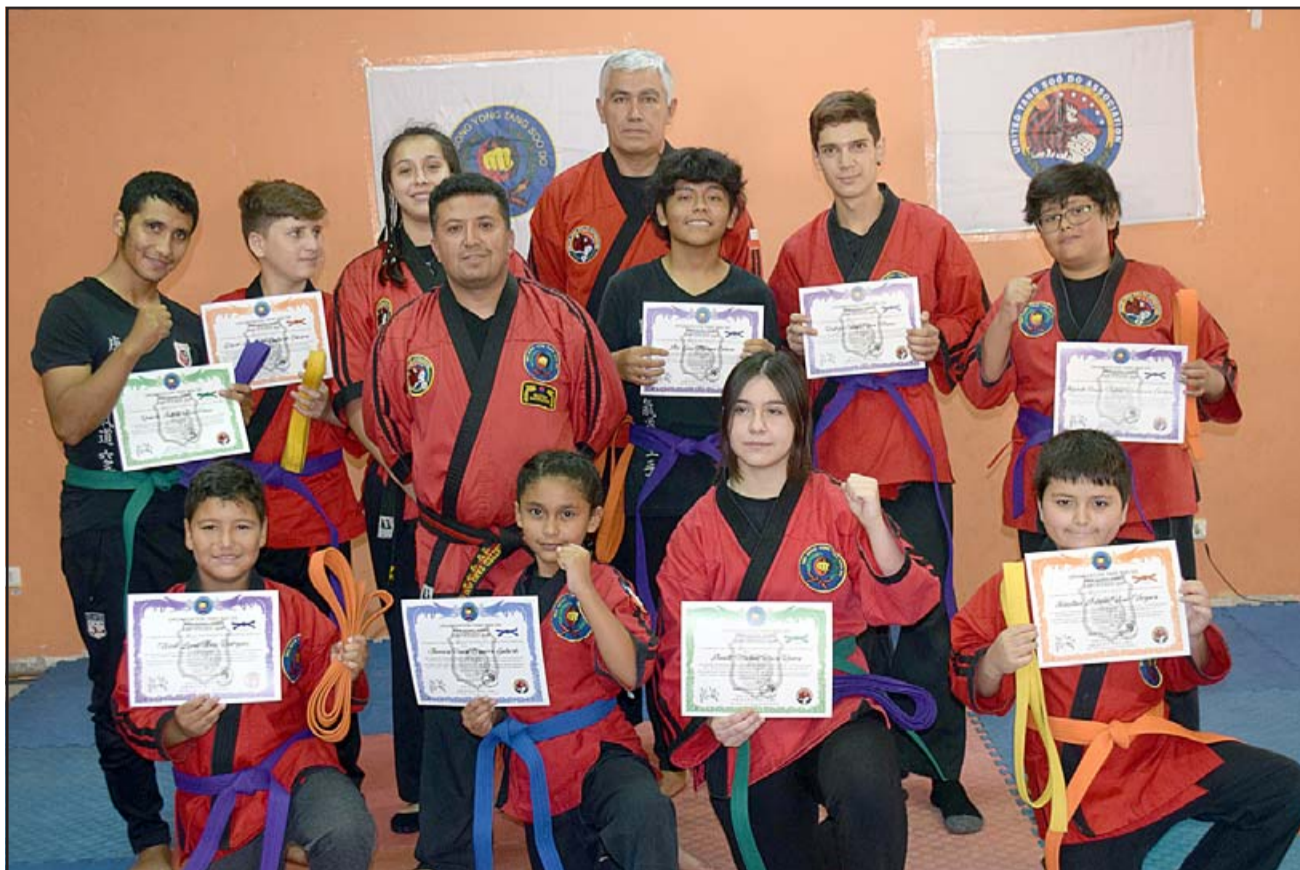
CAMBIO DE GRADO. - Ellos son sólo uno de los grupos de estudiantes que este fin de semana recibieron su nuevo cinturón, tras casi un año esperando avanzar.