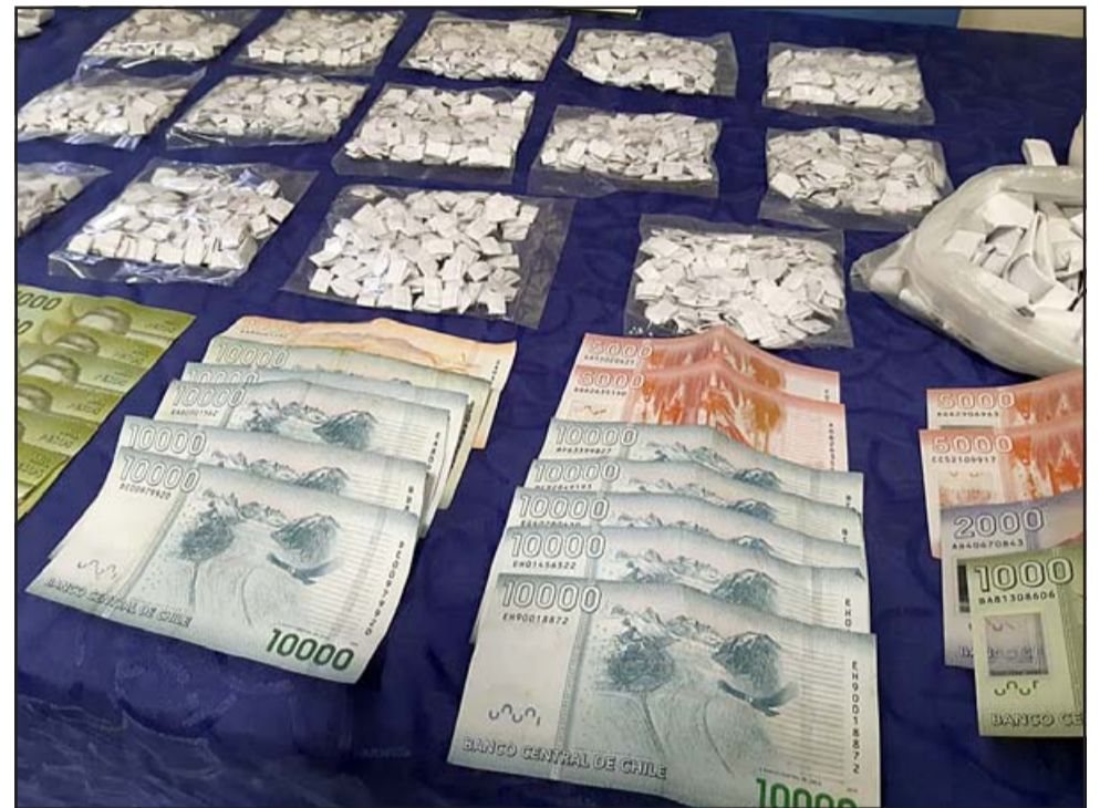
MUCHA DROGA.- Entre lo incautado se registró 1,90 gramos de cocaína (un papelillo); 160,37 gramos de pasta base de cocaína (1.445 papelillos); 161,82 gramos de cannabis sativa (102 papelillos), y $173.050 en efectivo.