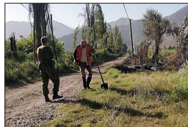
El funcionario de Carabineros junto al imputado al momento de ser sorprendido realizando la quema ilegal en un predio agrícola del sector.

El oficial indicó que durante todo este tiempo, va a ser un mes de la constitución de esta patrulla, ha servido de mucha ayuda el llamado anónimo denunciando este tipo de hechos como son las quemadas ilegales: «Si bien es cierto a veces no logramos la detención, ya que al ver la presencia policial las motocicletas que nos están prestando cobertura o dispositivo policial, huyen del lugar o se escabullen dentro de los mismos predios agrícolas, entenderán que son bastante grandes, ex-