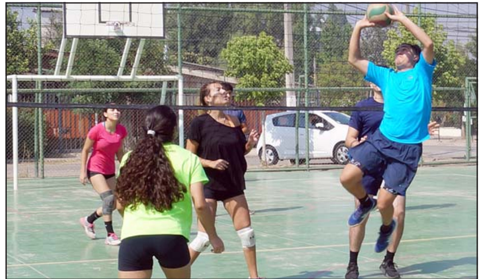
CON GRAN ENERGÍA.- Las cámaras de Diario El Trabajo registran el momento de acción y gran entrega de estos jóvenes deportistas.

- Sí, como 2020 fue un año en el cual pasamos encerrados y tras una pantalla, decidimos motivarnos y tomar la iniciativa de sacar a los niños de casa y llevarlos a un espacio abierto para poder realizar lo que tanto nos gusta. Esto sirve para captar jugadores nuevos en edades tempranas, continuar el trabajo realizado con quienes ya entrenan con nosotros y nuevos jugadores que tengan las ganas