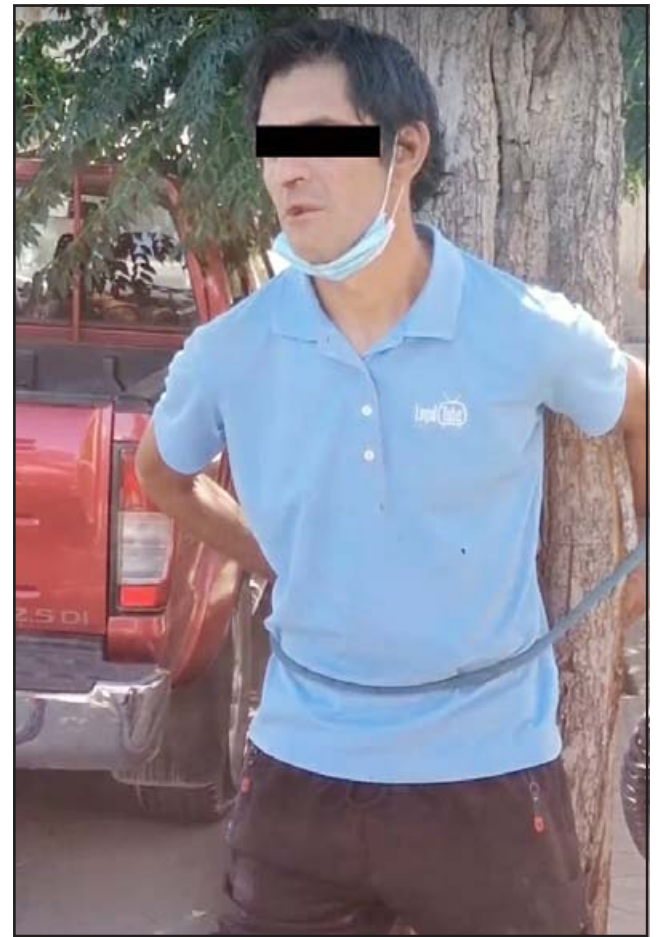
FUNADO POR ROBAR. - El tristemente célebre Fido fue detenido por los vecinos y amarrado a este árbol, hasta que llegaron los carabineros.