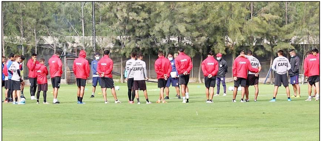
Esta tarde Unión San Felipe enfrentará a Melipilla en la primera final por el ascenso a la serie A.

En la interna albirroja existe mucha confianza y tranquilidad de cara a la llave decisiva porque los números están a su favor. En la fase regular del torneo, el conjunto sanfelipeño se impuso a los melipillanos por la mínima, mientras que recientemente igualaron a 1 en el estadio Municipal. «Con Melipilla tenemos buenas experiencias previas, y sabemos que le podemos hacer daño, aunque habrá que estar atentos porque son un muy buen