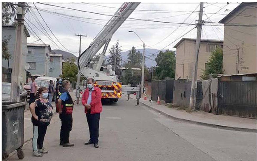
Los trabajos se realizaron el viernes último, con el apoyo de voluntarios del Cuerpo de Bomberos de San Felipe, obras que consistieron en la colocación de zinc removido por el viento y la reparación provisoria de la techumbre.