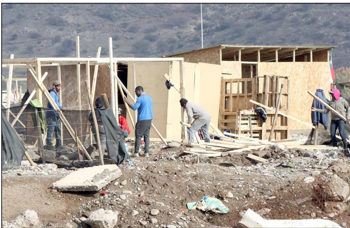
ARRIESGAN PENAS.- Son miles de personas las que invadieron estos terrenos y los convirtieron en un pueblo, hay varias querellas en su contra.