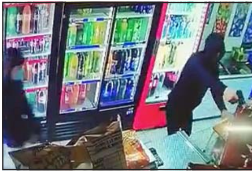
Autores están prácticamente identificados

Cuatro delincuentes, tres de ellos con armas de fuego