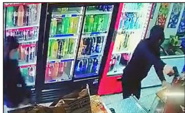
Las cámaras del minimarket registraron el asalto y a los delincuentes que actuaron cubiertos solo con las mascarillas, lo que permitió que estén identificados al igual que el vehículo usado en el asalto.

se taparon más y entraron, pero están como identificadas las personas y no las pueden encontrar, es que se les ven las caras.