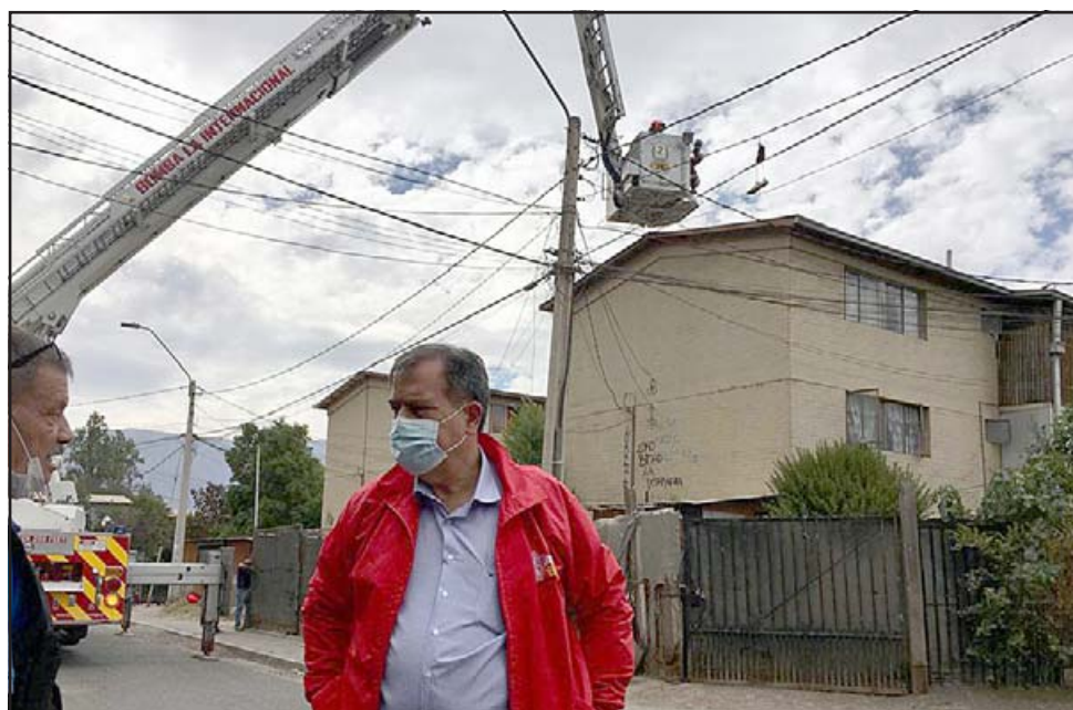
El alcalde Christian Beals inspeccionó personalmente los trabajos de reparación y conversó con los vecinos del sector.