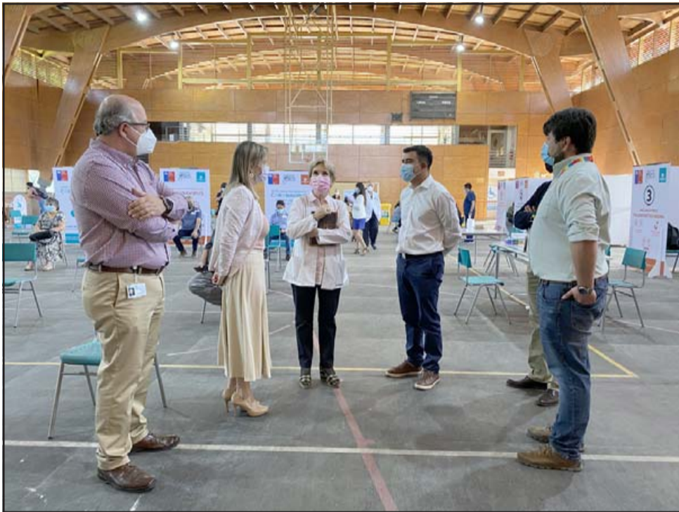
Las autoridades locales y de salud visitaron el Polideportivo y destacaron la correcta habilitación del lugar para realizar la vacunación.