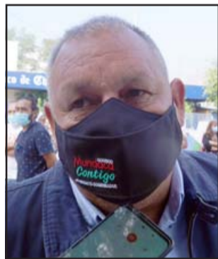
Rodrigo Mundaca Cabrera , candidato al cargo de Gobernador Regional.