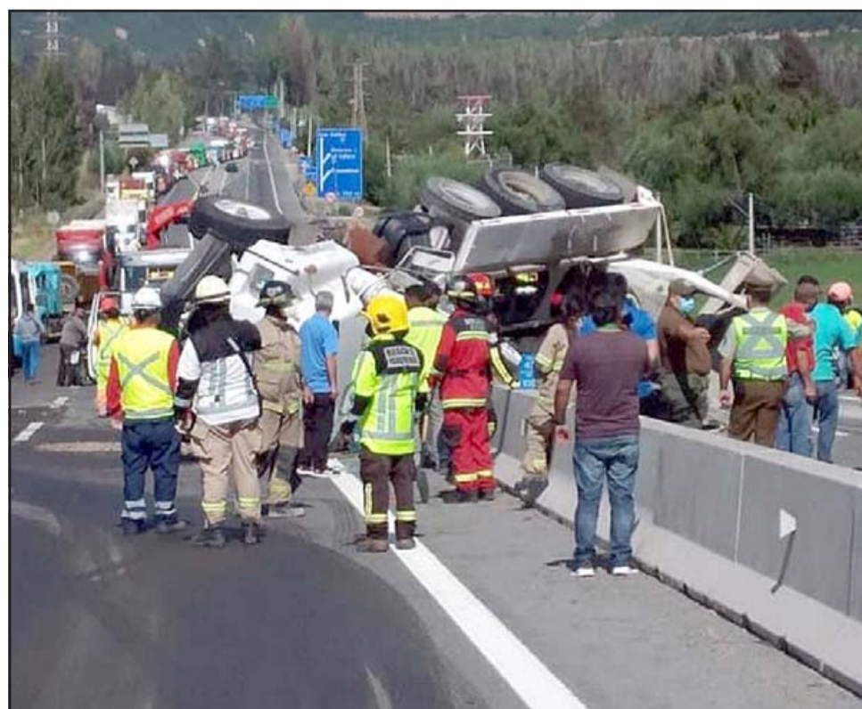
Al lugar llegó personal de emergencia de la Autopista, Carabineros, SAMU y Bomberos para poder ayudar en la emergencia.