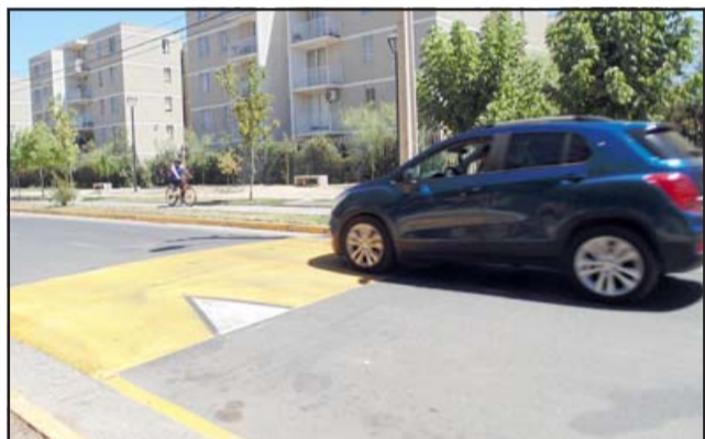
Hoy ya existe una gran cantidad resaltos en la comuna, y hay muchas otras solicitudes para instalar más, siendo impracticable colocar en todos los puntos que pide la comunidad.