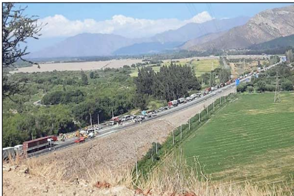
Un 'taco' kilométrico se produjo en el sector a raíz del accidente.