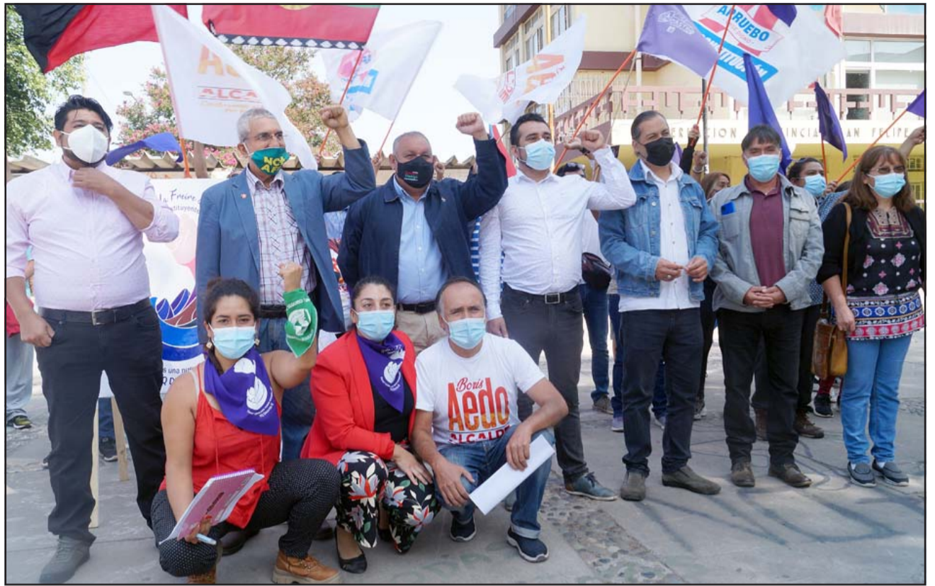
CANDIDATOS COMUNISTAS.- Aquí vemos a varios de los jóvenes políticos que este martes se reunieron en la Plaza Cívica de San Felipe.

nal estamos por la construcción de un modelo anti-neoliberal, principalmente donde lo que existe ahora como sistema queremos proponer a la ciudadanía en las distintas instancias de participación, un cambio a lo que existe en la actualidad, pues no estamos conformes a como está digamos llevándose a cabo el modelo, por eso también se genera el estallido social, y ante eso nosotros nos hemos agrupado a través de esta alianza en pos de proponer un programa para el país que será propuesto en estas elecciones, un programa para la Región donde tenemos nuestro candidato y tam-