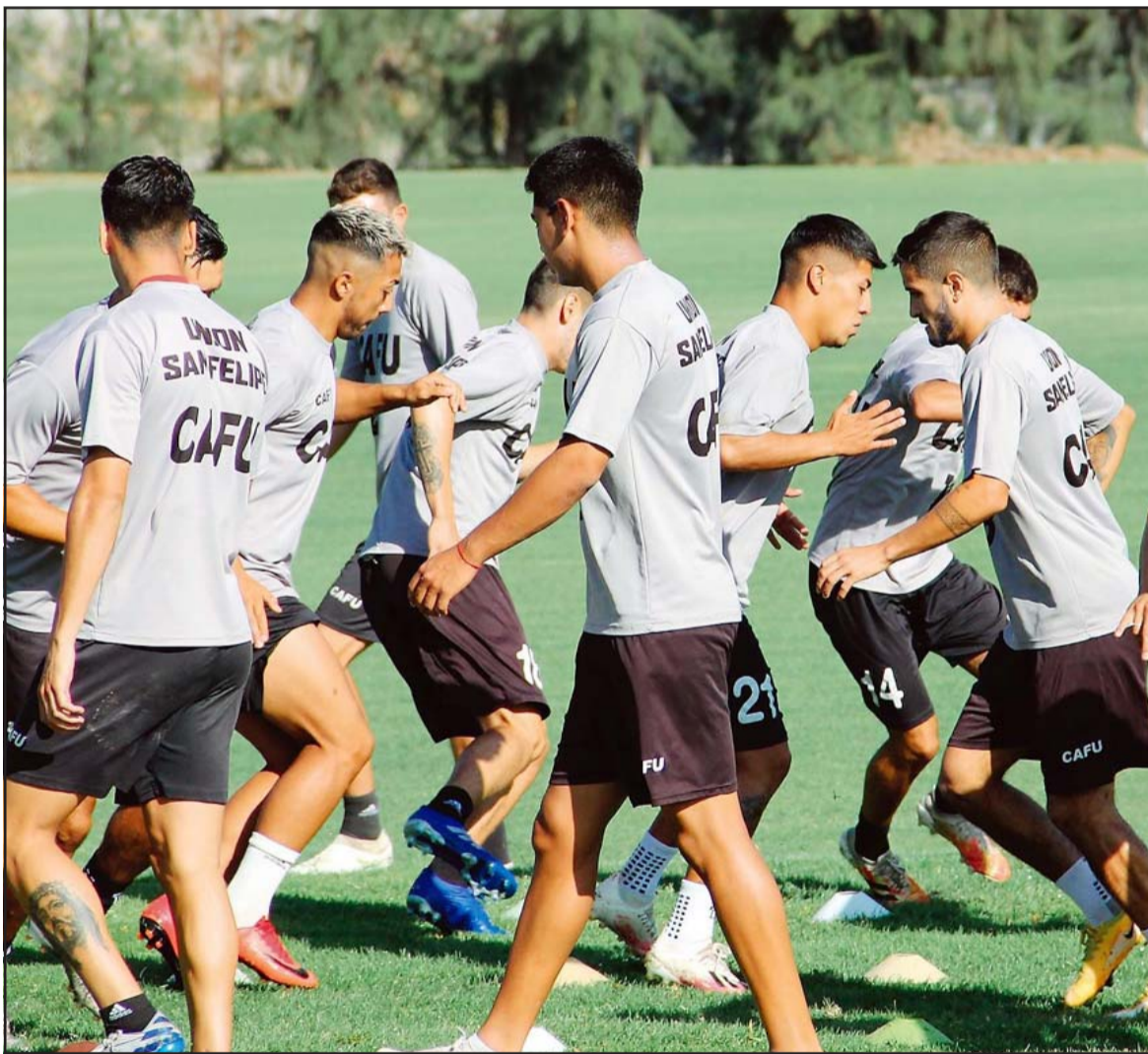
Unión San Felipe tendrá duros rivales en el próximo torneo de la Primera B.

El nuevo integrante de la división es Lautaro de Buin, el flamante campeón de la Segunda División. Ese cuadro hará su estreno absoluto en las grandes ligas del balompié profesional chileno, aunque los rumores hablan que sus controladores apostarían fuerte porque la idea es ser protagonistas de la serie.