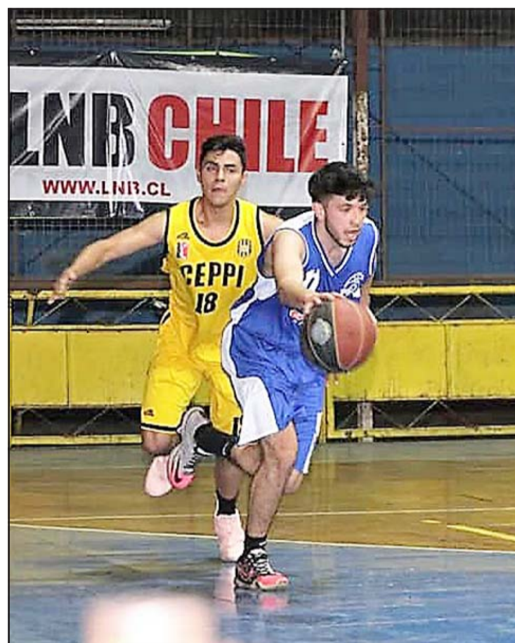
El campeonato de plata del baloncesto chileno, donde competirá el Prat, no comenzará en marzo.