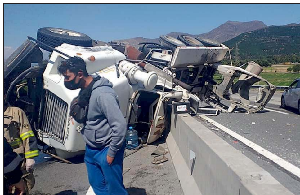
El grave accidente vehicular se registró en el sector de la Cuesta Chagres, donde un camión betonero volcó en medio de las dos pistas.