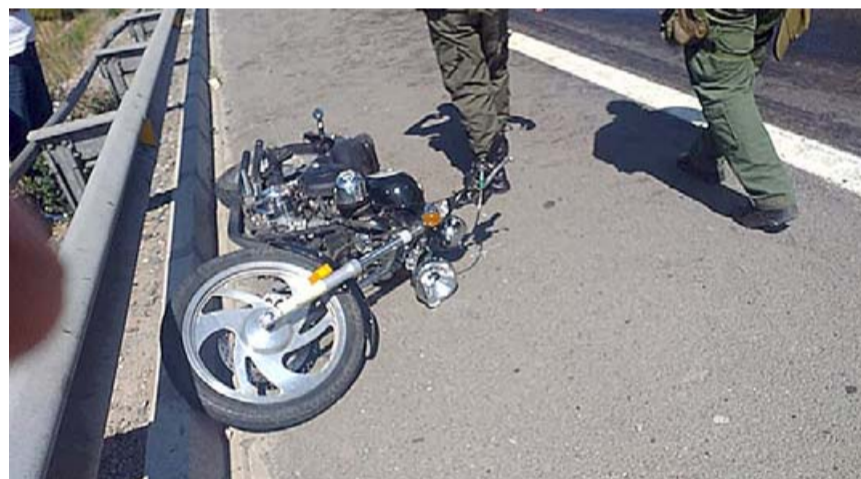
Un motociclista sufrió lesiones graves tras caer producto del derrame de petróleo del vehículo mayor.