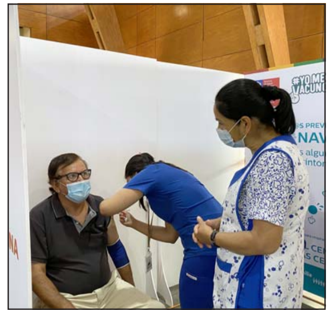
El recinto abrió sus puertas y atenderá de lunes a domingo según el calendario del Ministerio de Salud, a todos los vecinos y vecinas.

En ese sentido, es importante destacar que el centro de vacunación cuenta con el respaldo de los profesionales de la Clínica Río Blanco y de ESACHS. «División Andina ha preparado el recinto con personal de salud y administrativos que atenderán en cuatro módulos de vacunación (dos en la primera etapa), en-