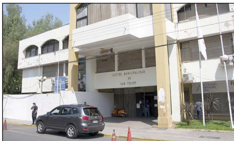
La auditoría abarcará las cuentas del municipio, de la Dirección de Administración de la Educación Municipal (Daem), la Dirección Municipal de Salud y al Cementerio Municipal.

Te invitamos a seguir estas recomendaciones para prevenir eventuales contagios del COVID-19