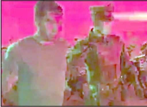
El padre se entregó pensando que había matado a su hijo, pero el menor logró sobrevivir.

La pequeña víctima tenía solamente 5 años de edad