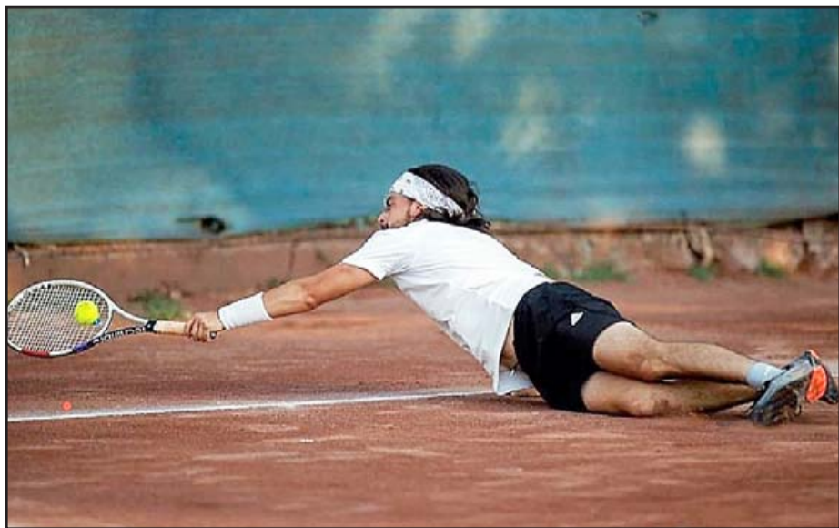
El torneo Máster reúne a los mejores tenistas del valle de Aconcagua.

El Máster es por sí solo el torneo de mayor importancia y atractivo del Tour Aconcagua, al reunir a las mejores raquetas de cada serie: « Ya está definido que se hará en este formato y será muy interesante porque permitirá reunir a los mejores de cada temporada, por lo que a fines de este año se nos viene una gran competencia », agregó el actual relacionador público del Club Valle de Aconcagua.