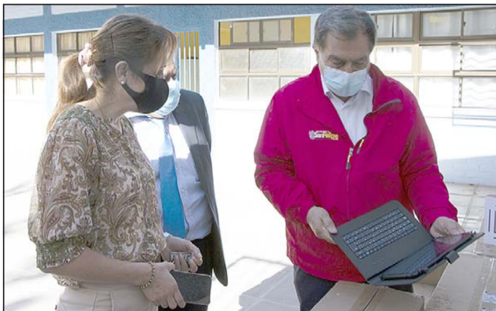
Durante esta semana, la totalidad de las escuelas y liceos municipalizados comenzaron a prepararse para recibir a los estudiantes que estarán de forma presencial, lo que dependerá de si la familia decide o no enviarlos a clases.