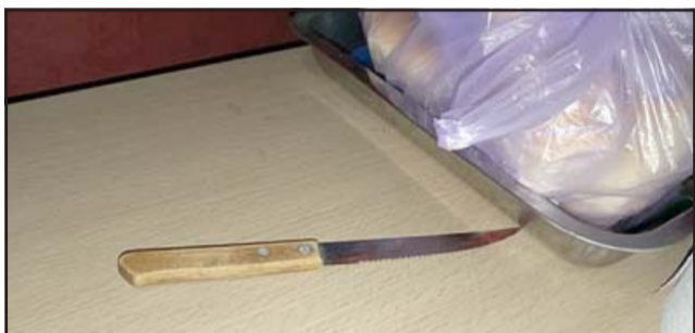
Arma blanca utilizada en su momento para agredir al menor.