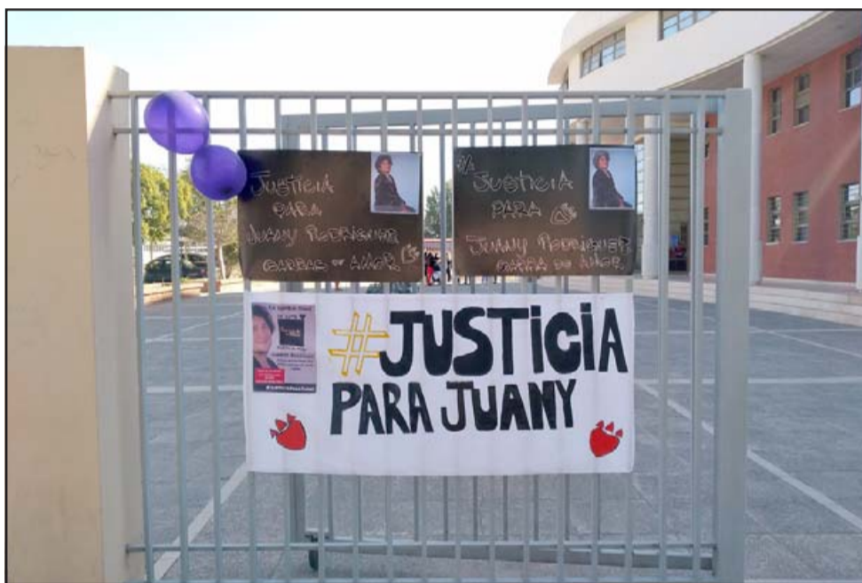
Fans colgaron lienzos pidiendo justicia por el fallecido integrante de la banda 'Garras de Amor'.

nunca le hizo mal a nadie, era muy querido por toda la comunidad. Hay millones de recuerdos con él, siempre estará en nuestros corazones, como músico, como hermano, siempre lo vamos a tener en nuestros corazones», finalizaron.