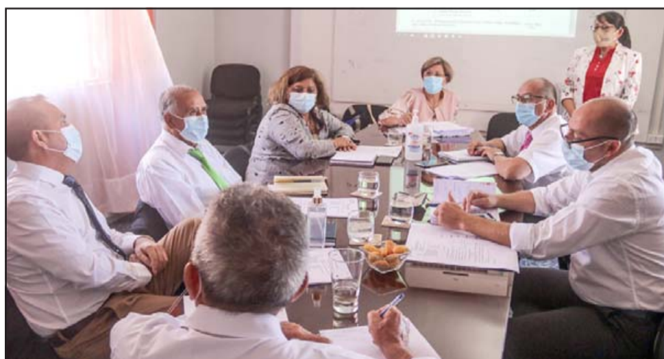
La directora del DAEM Putaendo se reunió con el Concejo Municipal para informar sobre los preparativos para el inicio de clases virtuales a partir del 1 de marzo.

En este sentido, a contar del primero de marzo todos los establecimientos estarán abiertos para resolver eventuales consultas y necesidades de las apoderadas y apoderados. El horario de la atención de público será desde las 8:30 hasta las