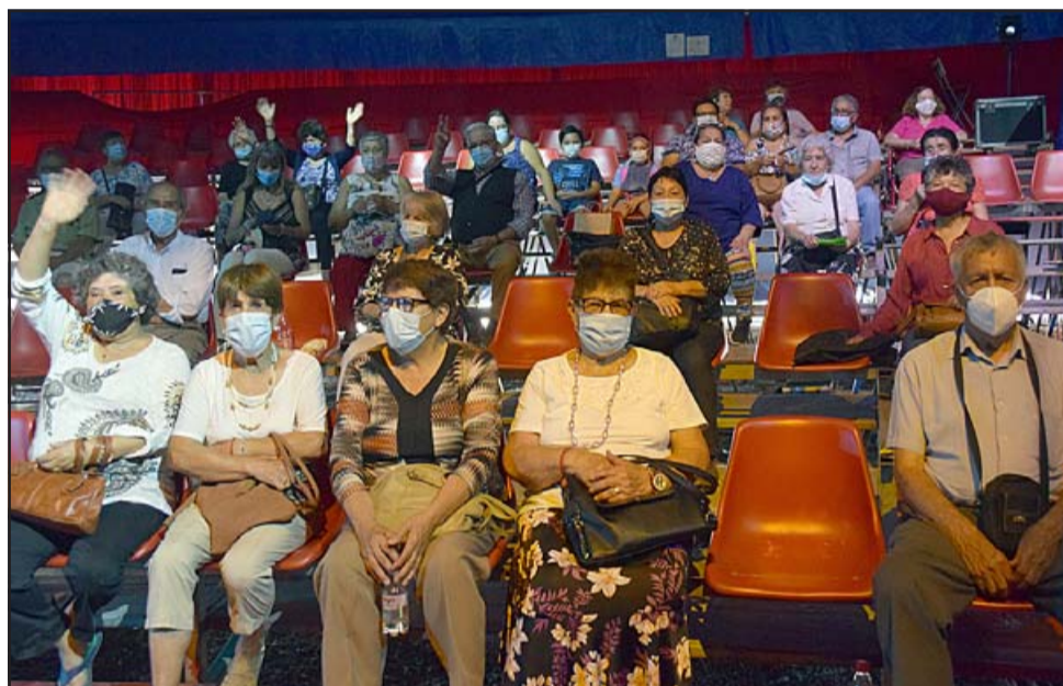
UNA TARDE INOLVIDABLE.- Ya instalados en su butaca, los abuelos disfrutaron de la tarde circense más esperada por ellos.

En todos sus establecimientos educacionales: