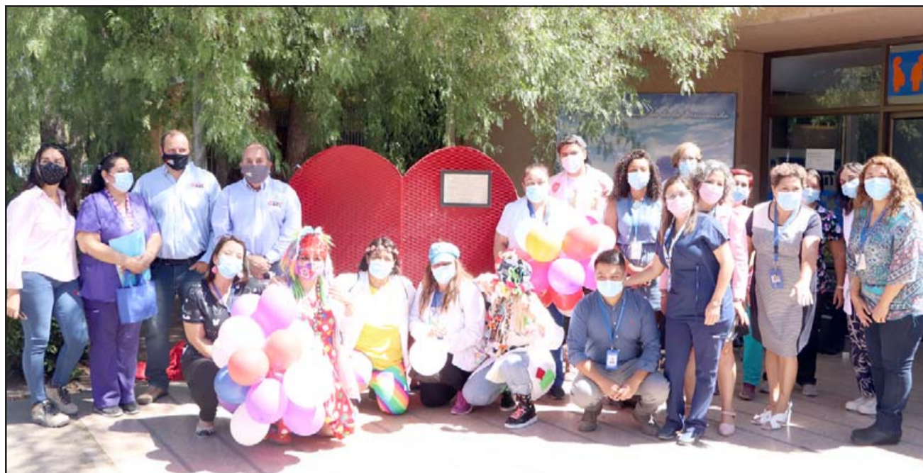
La iniciativa surgió de parte del comité paritario del establecimiento en el marco de su política medioambiental, el cual realizó las gestiones con el gerente general de la empresa Gaet.

forma un círculo virtuoso de ayuda a las personas y al medio ambiente, así que agradecemos a Gaet y a todos los que se la jugaron por concretar esta hermosa iniciativa. Como hospital estamos felices de contar con este corazón», aseguró la facultativa.