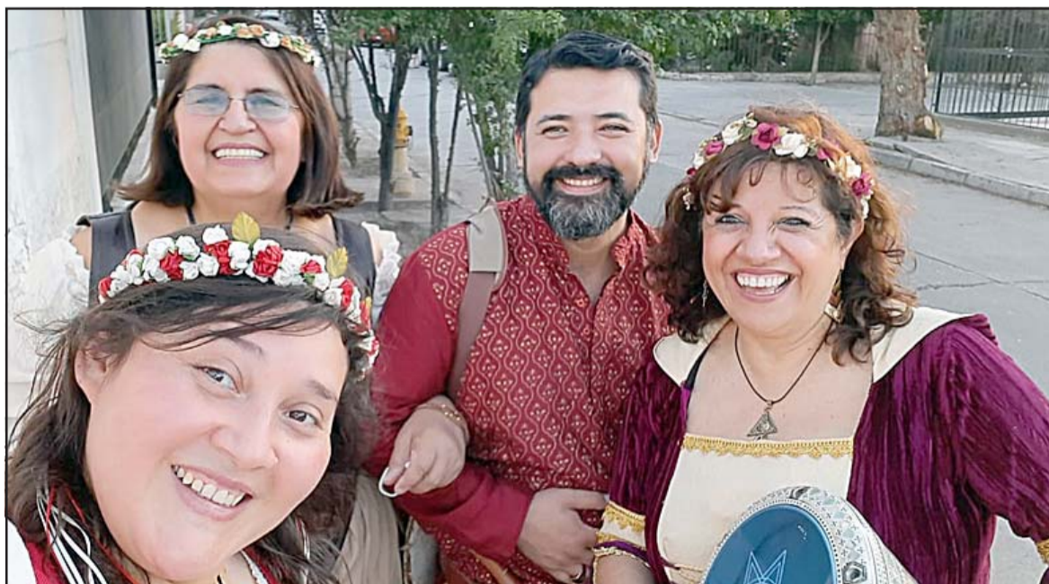
JUNTOS DE NUEVO. - Los coristas se mostraron felices de poder presentarse al aire libre, hace un año que no se podían reunir y cantar.