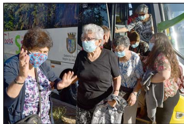
LA LLEGADA.- Diario El Trabajo registró la llegada de estos adultos mayores al Circo Pastelito y Tachuela Chico.

Las cámaras de Diario El Trabajo dieron cobertura a la jornada circense, los invitados llegaron en bus municipal y guardando las medidas de seguridad fueron conducidos a las graderías del imponente circo, cada uno guardó su distancia y dieron rienda suelta al desahogo por la angustia y estres por meses acumulado. Roberto González Short